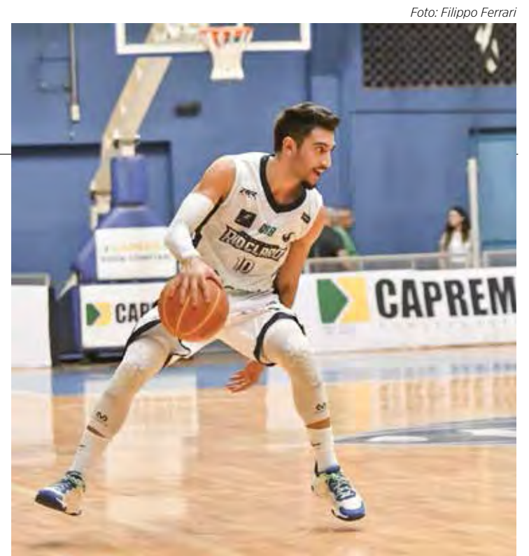
Leão em quadra, hoje, pelo NBB15.

do Sul-RS enfrenta a Unifacisa-PB, em partida que começa às 20 horas. O time do Rio Claro Basquete só volta a jogar pelo NBB no próximo dia 8, quando enfrentará o time do Flamengo, no Ginásio Felipe Karam, às 18 horas.