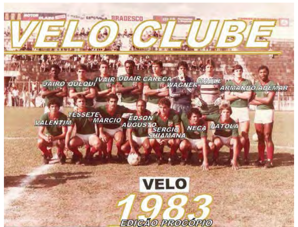
Time do Velo no ano de 1983

Na preliminar, pela categoria juvenil, o Velo derrotou o Lemense por 3x1.