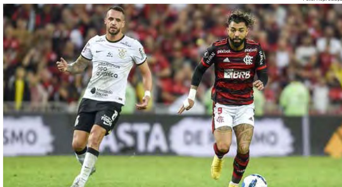
Flamengo e Corinthians foram finalistas em 2022

Confira os confrontos, dos jogos de ida, envolvendo os times paulistas, com os mandos de campo já definidos: