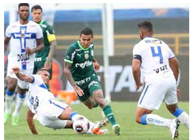
Palmeiras e Água Santa começam domingo a decisão.

marcado para o dia 9, no mesmo horário, na Arena Allianz Parque, em São Paulo. A procura por ingressos para a primeira partida tem sido bastante grande, o que acabou gerando pane no sistema de venda de ingressos on line. Ambas as partidas das finais do Paulistão serão transmitidas aos vivos pela TV Record e no Canal Futebol Paulista, no Youtube.