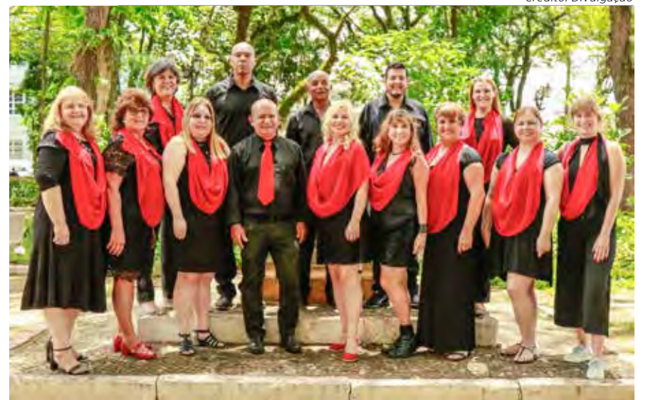
O coral Madrigal da Cultura é uma das atrações do primeiro Encontro Literomusical

O Centro Cultural Roberto Palmari fica na Rua 2, 2880. Vila Operária, junto ao Lago Azul.