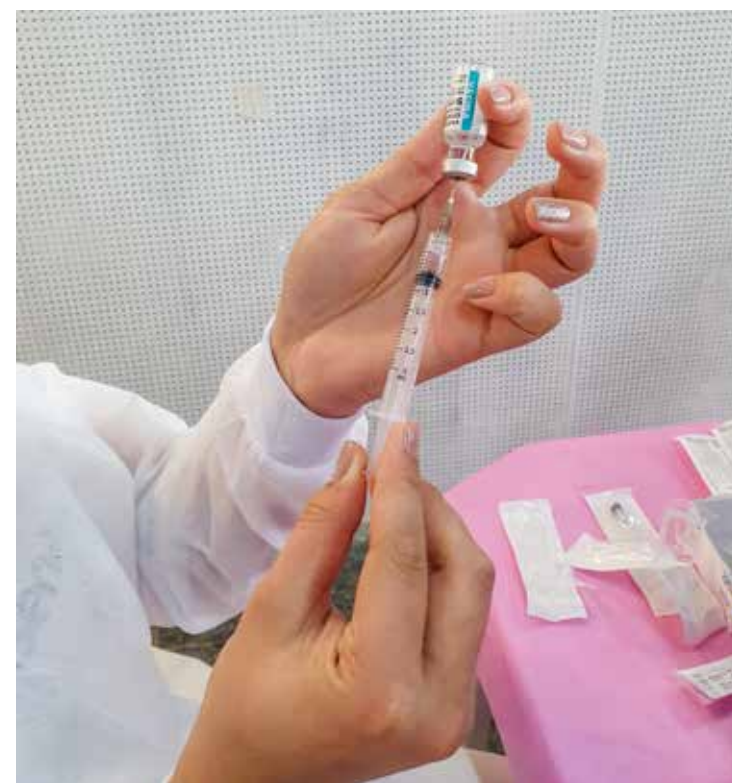
Rio Claro realiza mutirão de vacinação contra a Covid-19 para ampliar a cobertura vacinal

Para receber a dose da bivalente, é necessário que a pessoa já tenha tomado pelo menos duas doses de vacinas anteriores contra a Covid e o intervalo necessário da dose mais recente para o reforço com bivalente é de quatro meses.