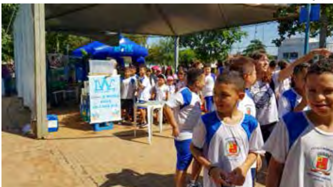
Crianças participaram de atividades do Dia da Água