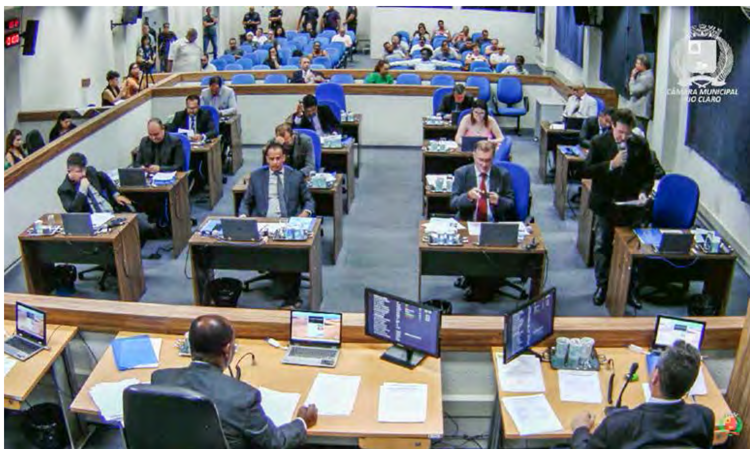
Vereadores em plenário na sessão camarária desta segunda-feira, dia 27 de março