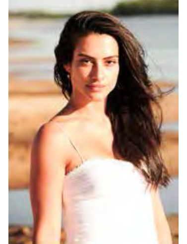
Cleo em cena de "Araguaia"