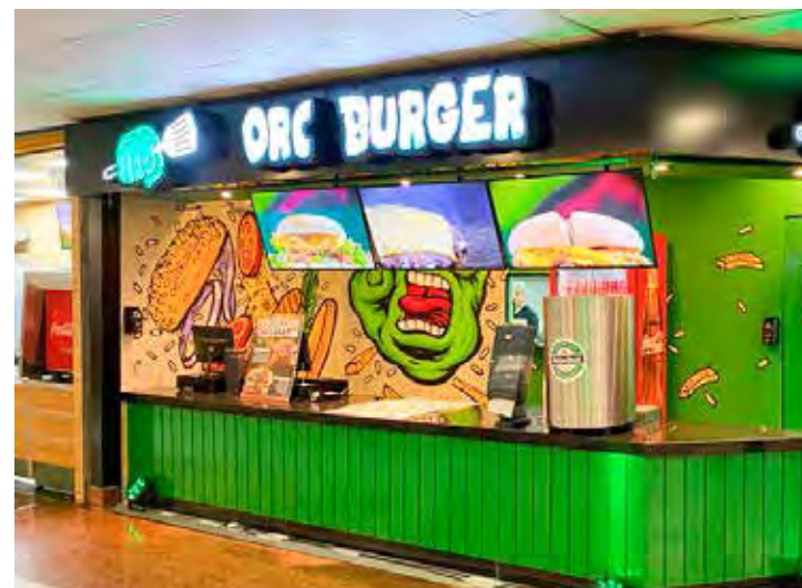
Operações recém-inauguradas no Shopping Rio Claro: Orc Burger e Mundo Kids