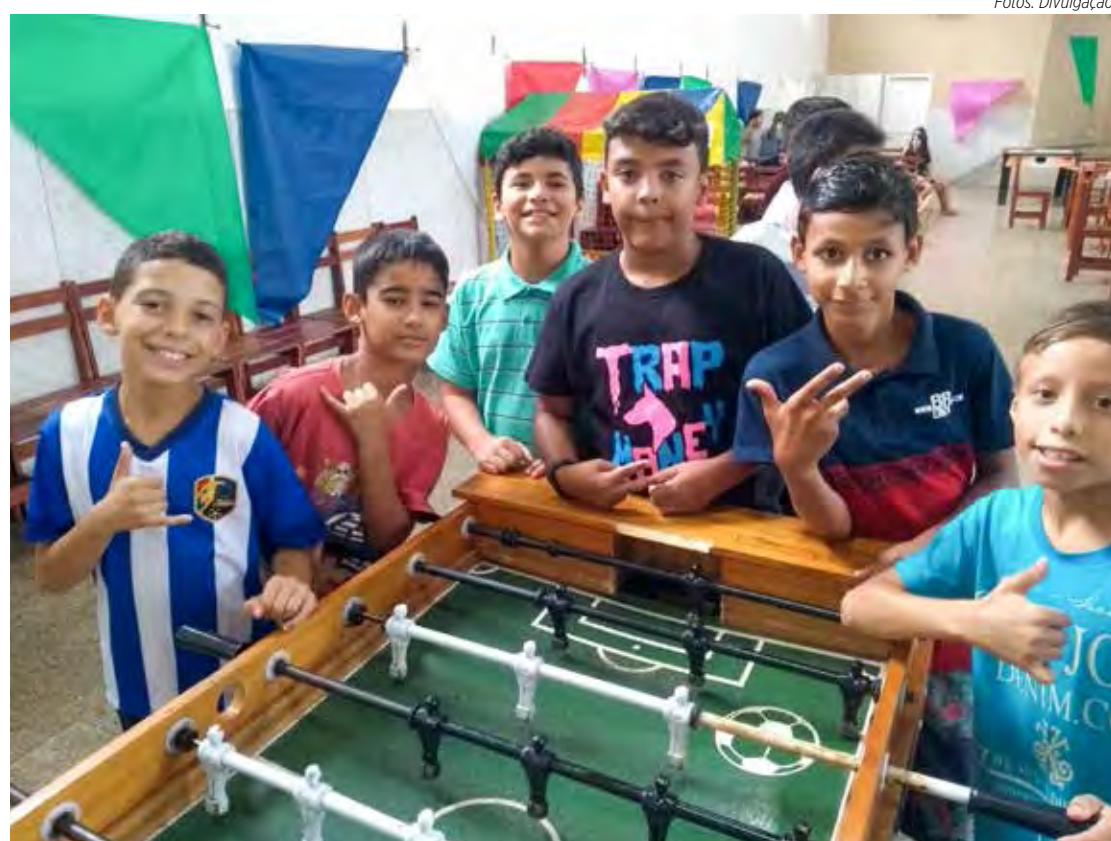
Criançada se divertiu com várias atividades