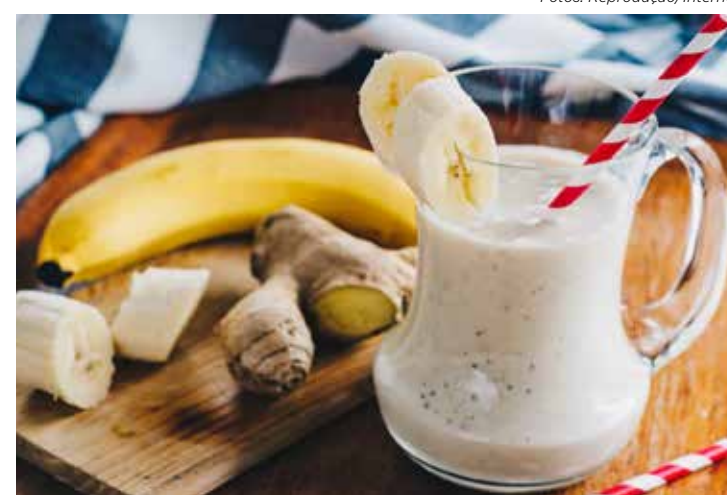
Suco de banana com gengibre

*As receitas foram retiradas do livro Na cozinha com as frutas, legumes e verduras, do Ministério da Saúde em parceria com a Universidade Federal de Minas Gerais.