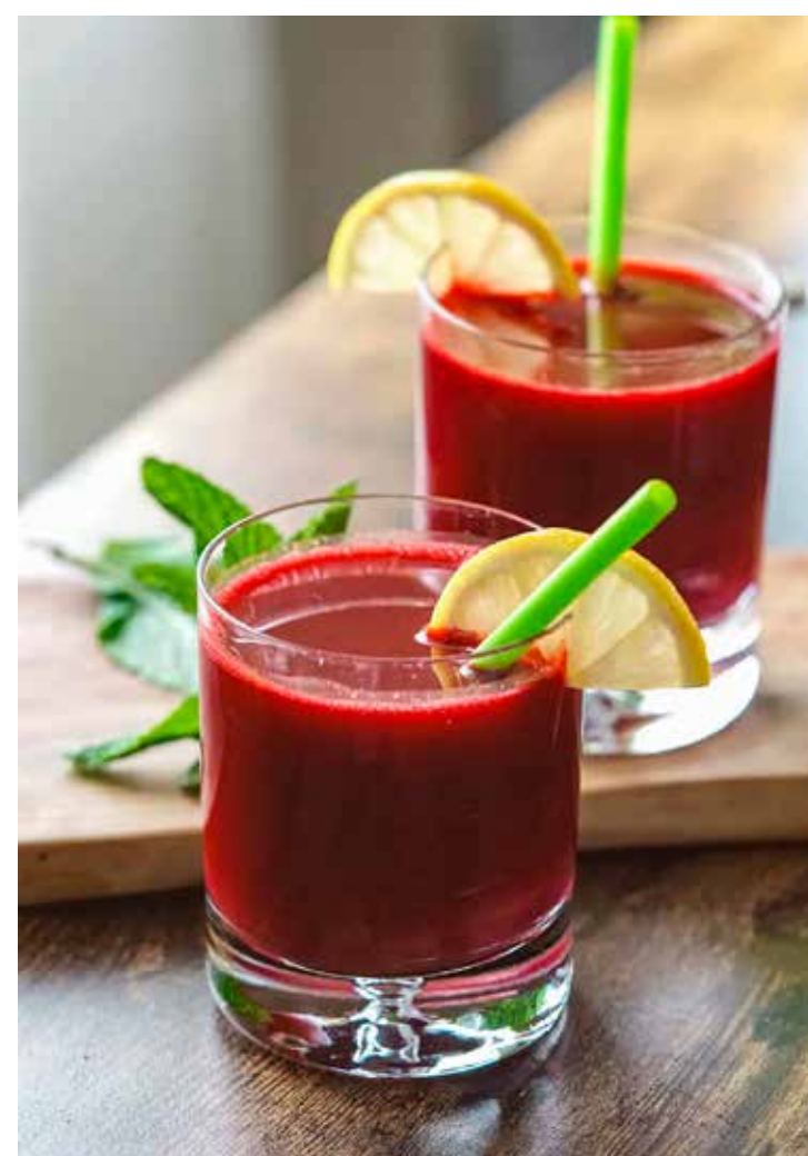
Suco de beterraba com limão