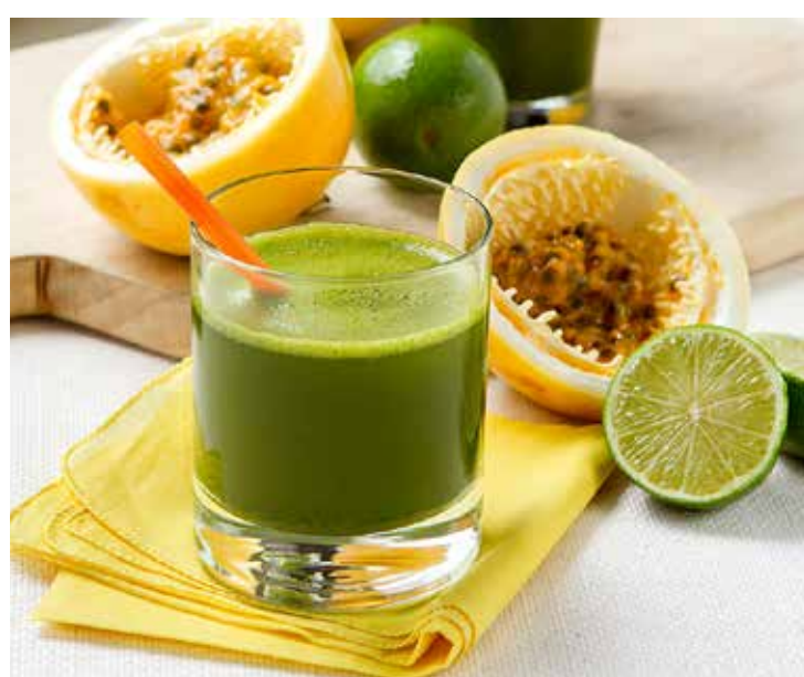
Suco de couve com maracujá