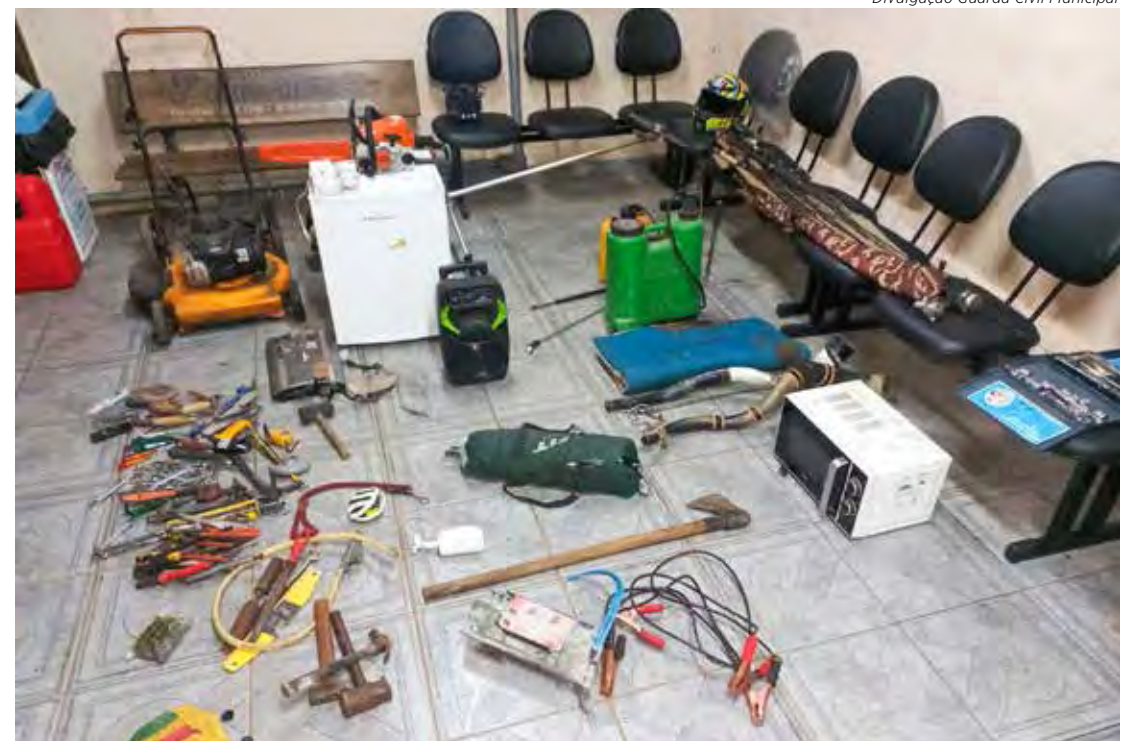
Vários equipamentos furtados das propriedades foram localizados e devolvidos a proprietários rurais vítimas dos crimes

Ao abordar o veículo e os ocupantes, os GCMs encontraram uma grande quantidade de fios em cima de uma carreta reboque, além de uma motocicleta Honda/CG 125 vermelha sem nenhum sinal de identificação, e, ainda, vários produtos de procedência duvidosa, dentre eles; um gerador elétrico, 1 cortador de grama, 2 roçadeiras, 1 frigobar, 1 micro ondas, 5 botijões de gás, 3 bombas de pulverização, 2 motosserras, 1 TV de 29 polegadas, 4 selas, 1 escada retrátil, várias ferramentas, 1 caixa de som. Também foi localizada uma espingarda calibre 12, sem identificação, com o cano serrado, com 7 munições intactas e 5 deflagradas. Foram achadas também 13 munições calibre 38, intactas, 2 cartuchos de espingarda calibre 32, 1 intacto e outro deflagrado e, ainda, 1 espingarda de pressão.