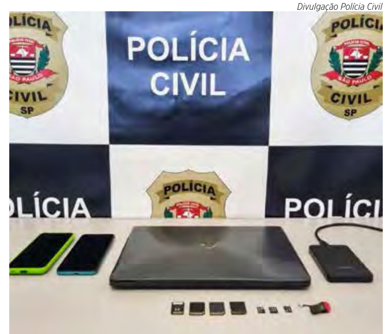
Registros dos abusos e pornografia infantil foram encontrados em equipamentos que estavam com o comerciante

vamente e ao menos uma vítima já teria sido ouvida. A maioria das vítimas seria de Brotas, mas, também haveria outras de cidades