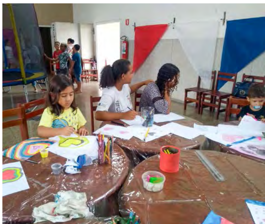
Projeto é realizado desde 2017 em Corumbataí

disputado na casa do adversário. Novorizontino x Noroeste farão a outra semifinal da competição. O primeiro jogo acontece em Bauri, no próximo domingo (26).