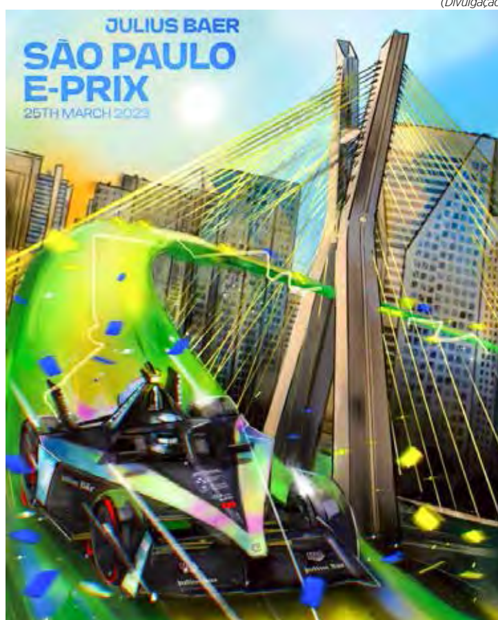
Primeiro E-Prix de São Paulo (JULIUS BAER SÃO PAULO E-PRIX) é a 6ª etapa da temporada

As atividades no Anhembi começam nesta sexta-feira, com o shakedown e o primeiro treino livre. No sábado, serão realizadas mais uma sessão de treinos antes da classificação e a da corrida. A Band transmite o fim de semana em São Paulo entre o canal de TV aberta, o Bandsports e seu site.