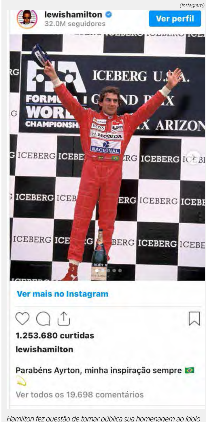
Hamilton fez questão de tornar pública sua homenagem ao ídolo

Lewis sempre fez questão de reforçar sua idolatria pelo três vezes campeão brasileiro. Inclusive, na vitória do GP do Brasil de 2021, o inglês pegou a bandeira brasileira e emulou o ídolo ao dar uma volta com a flâmula e subir ao pódio com o símbolo nacional.