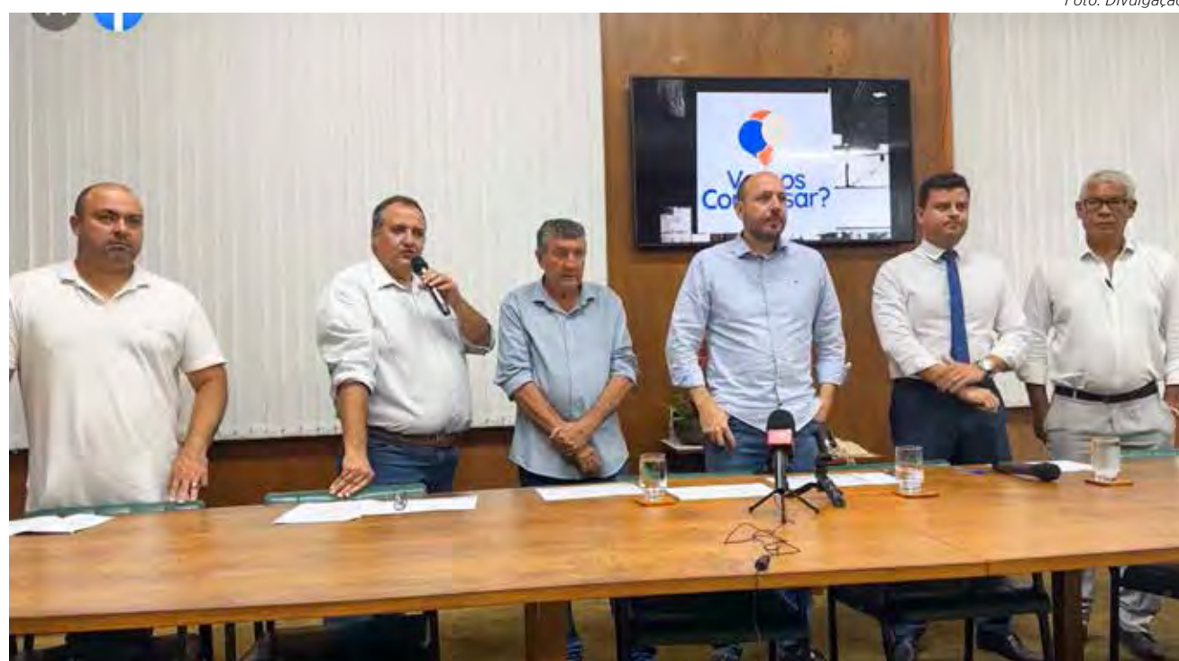
Prefeito Gustavo lançou o projeto “Vamos Conversar?” em coletiva de imprensa nesta quinta-feira (23)

As reuniões serão quinzenais e realizadas às quartas-feiras, às 19 horas. O primeiro encontro será no próximo dia 29 na Escola Municipal Hamilton Prado que fica na Rua 14, nº 3.896, no bairro Vila Elizabeth (BNH). Além de escolas, outros espaços públicos também serão utilizados para realizar as