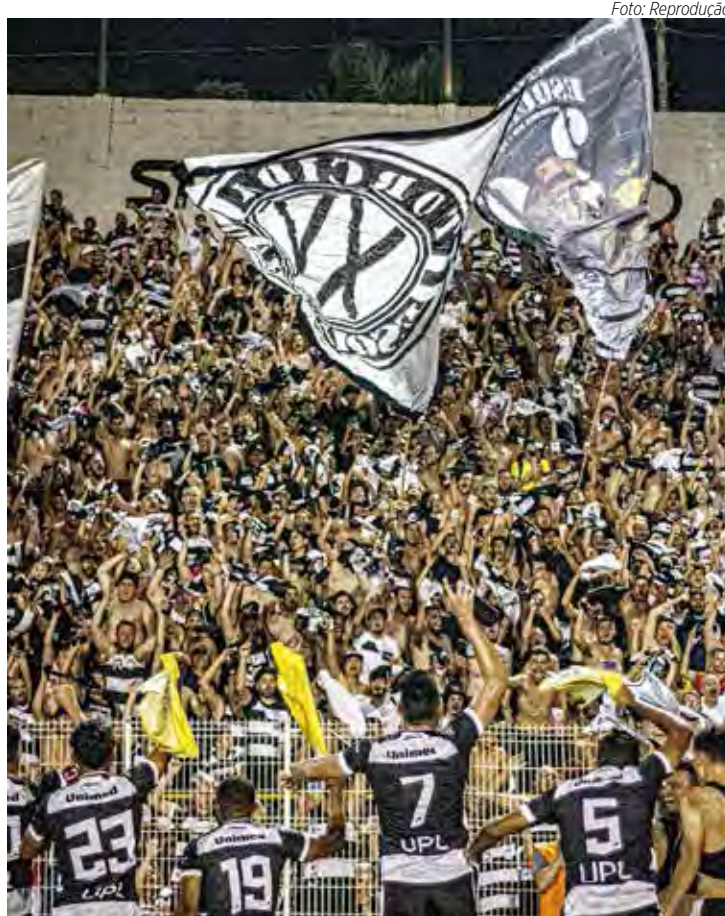
Torcida do XV promete lotar de novo o Barão

01/04 (sábado) – 15h30 – Jorge Ismael de Biase Novorizontino x Noroeste 01/04 (sábado) – 18h30 – Moisés Lucarelli Ponte Preta x XV de Piracicaba