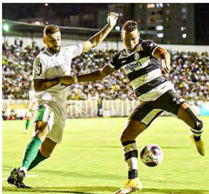
XV fez o que precisava e vai disputar o acesso

O bom futebol jogado e a vitória por 2x1, na casa do adversário, na primeira partida, foi determinante para a obtenção da vaga. Agora, o XV de Piracicaba vai enfrentar em dois jogos na semifinal a equipe do Ponte Preta que eliminou o Comercial de Ribeirão Preto. A primeira partida será em Piracicaba no próximo sábado (25) e a segunda, em Campinas.