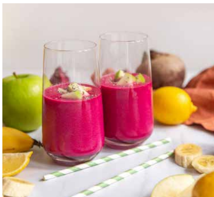
Suco de beterraba com banana

Bata todos os ingredientes no liquidificador até ficar bem cremoso. Sirva em seguida.