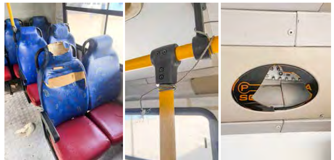
Danos foram fotografados pela empresa e as imagens anexadas ao Boletim de Ocorrência

Ele afirma, ainda, que um laudo pericial foi solicitado pela empresa, que já sofreu outros episódios similares, sendo que em