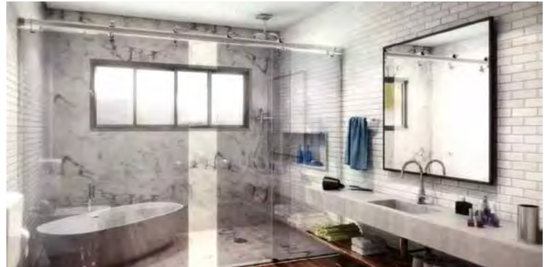
Investir em uma manutenção preventiva do box diminui o risco de acidentes