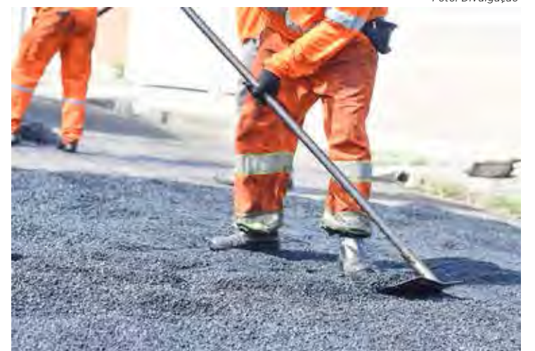
Prefeitura tem vagas de empregos temporários para zeladoria

A contratação temporária, feita com base no decreto de emergência assinado pelo prefeito Gustavo, será por período de 3 a 12 meses. Os contratados terão carga horária de 6 horas e salário de R$ 1.302,00 mais vale alimentação de R$ 100,00 e seguro de vida.