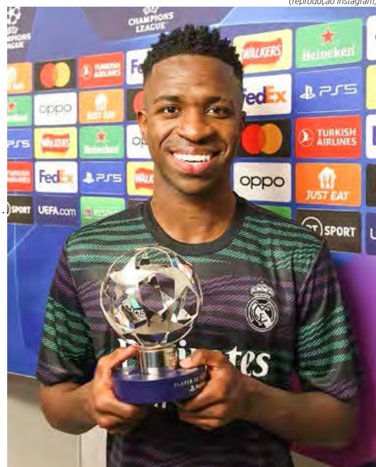
O craque brasileiro Vinicius Junior, do Real Madrid