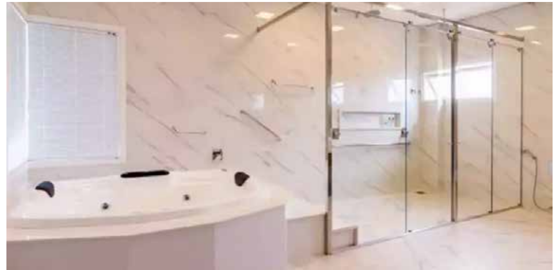
O ideal é verificar a procedência do vidro antes da instalação do box