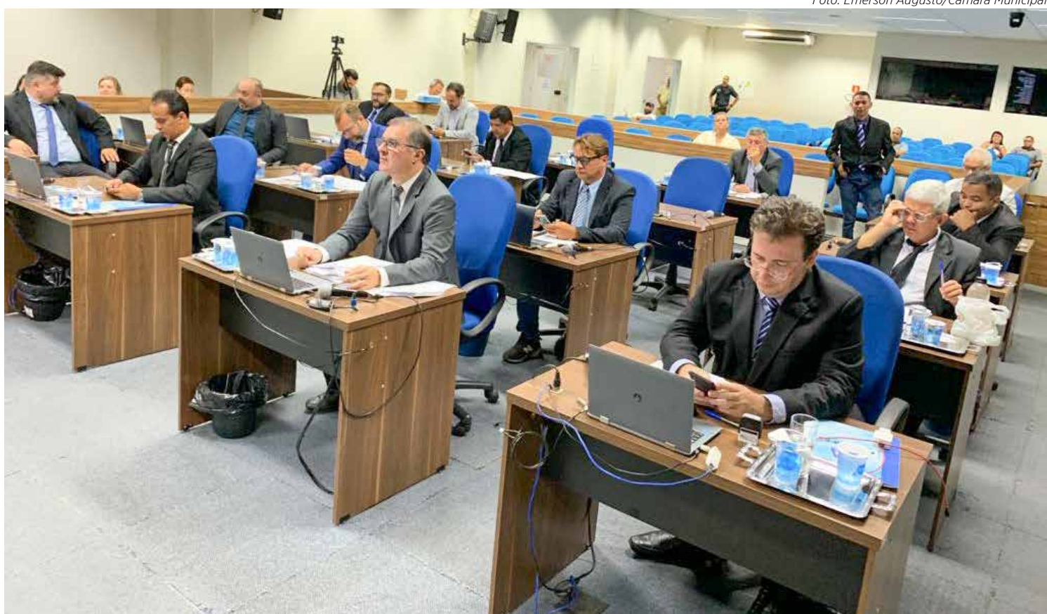
Vereadores aprovaram 15 projetos de lei na sessão desta segunda-feira (20) que tratam de diversos temas.