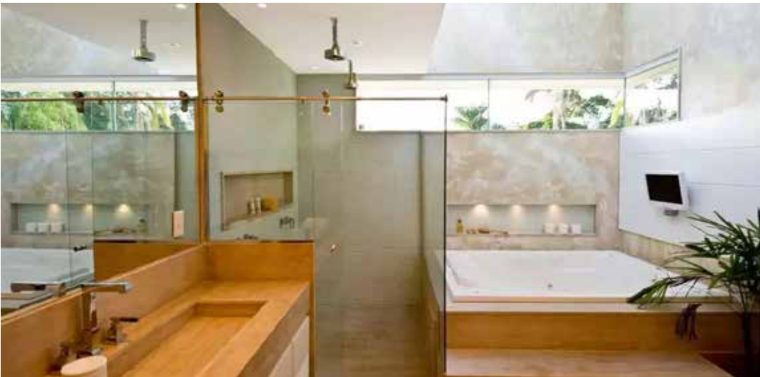
Um ponto que precisa de atenção constante é o estado de conservação do vidro