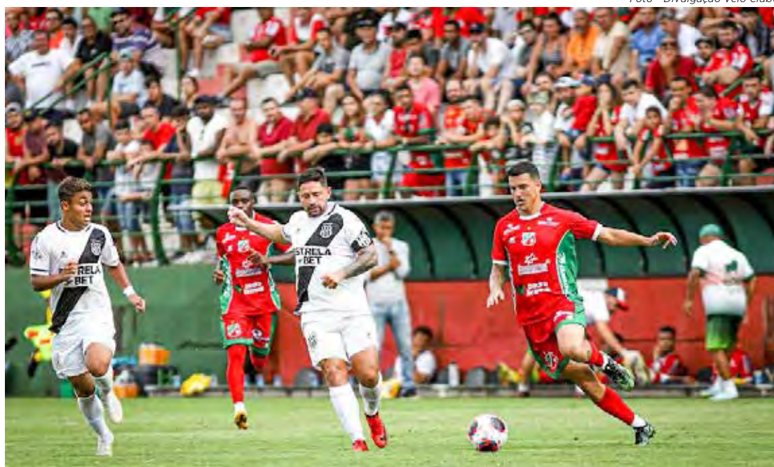
Velo joga tudo ou nada contra Noroeste, em Bauru

Atletas e comissão técnica do Velo Clube estão cientes da responsabilidade e prometem dar o melhor de si em favor do Rubro-Verde da Rua 3. Torcedores também estão confiantes na classificação, até porque, tecnicamente, as duas equipes se equivalem. As organizadas Geraldo do Velo e Veloucura devem marcar