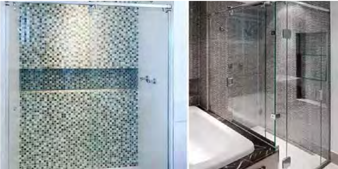
Estar em dia com a manutenção do box é essencial para um banho tranquilo e relaxante

Um dos erros mais comuns que as pessoas comentem quando o assunto é segurança dentro de casa, é não investir em uma manutenção preventiva do box