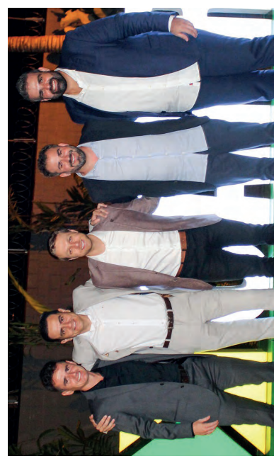
Diretores da CAPREM Construtora