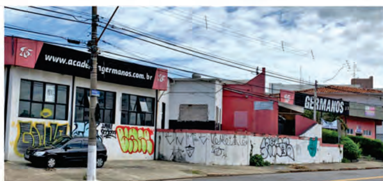
CÓDIGO: 7456 - Galpão com 1.318,20m² Taquaral- Campinas/ SP Valor Venda: R$5.000.000,00