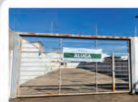
CÓDIGO 7042 Terreno com 749,00m² Consolação- Rio Claro/SP Valor Locação: R$3.111,11