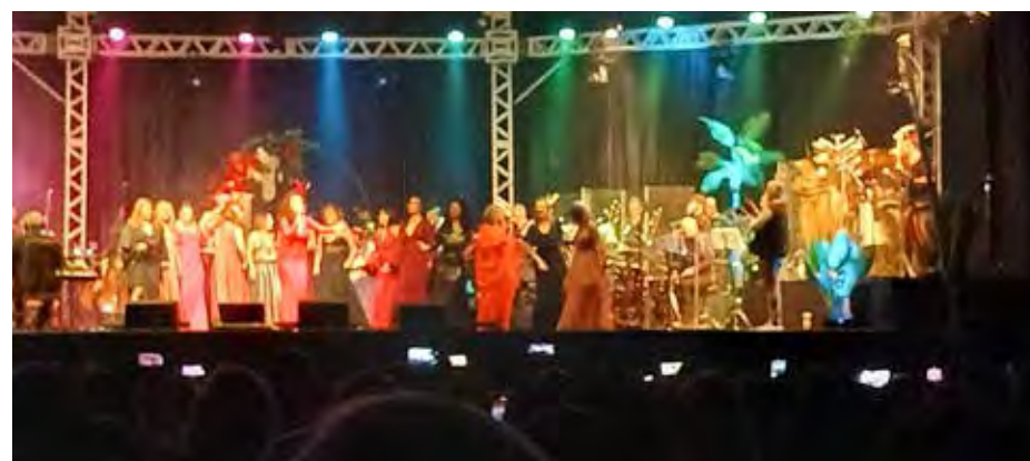
Orquestra Filarmônica de Rio Claro e Mulheres que Cantam e Encantam! Maravilhosa produção e qualidade total Parabéns aos organizadores