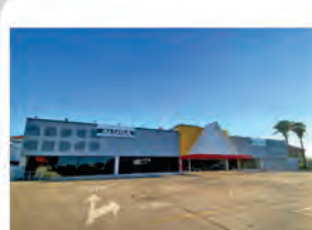
Código 8262 ÁREA TERRENO: 4.269,12 M2 - ÁREA CONSTRUÍDA: 2.513,00 M2 - Centro- Rio Claro - Valor Locação: R$83.333,33