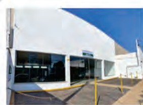
CÓDIGO: 6165 RUA 14- Salão com 600,00m², 2 wc's, cozinha, escritório e recuo para carros. Consolação- Rio Claro/SP Valor Locação: R$20.000,00