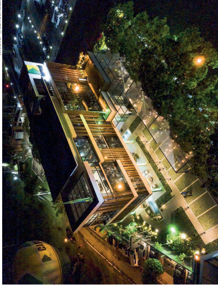
Nova sede administrativa da CAPREM Construtora