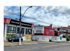
CÓDIGO: 7456 Galpão com 1.318,20m² Taquaral- Campinas/ SP Valor Locação: R$33.333,33