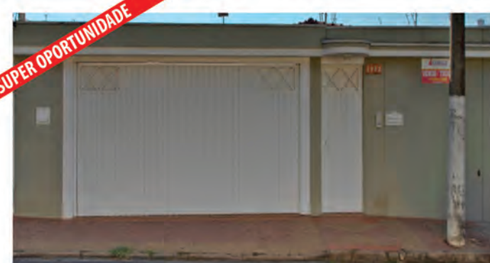
CÓDIGO 9084 - Recepção, 5 salas, 3 wc's, cozinha com arm. emb., área externa com churrasq., lavanderia e garagem para 4 carros. Santa Cruz- Rio Claro/SP - Valor Venda: R$850.000,00