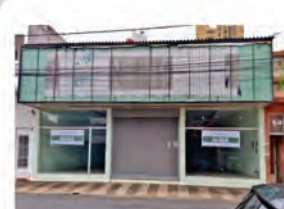
CÓDIGO: 7291 Galpão com 370,00m², com 2 escritórios, 2 wc's. Centro- Limeira/SP Valor Locação: R$16.666,67