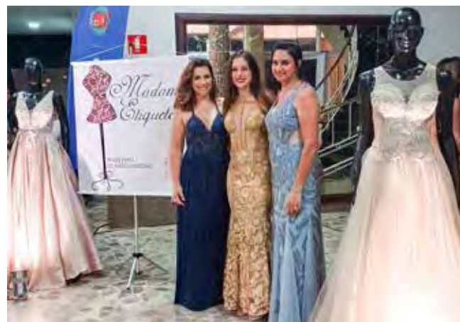
Recepcionando com glamour, lindas modelos de patrocinador Madame Etiqueta