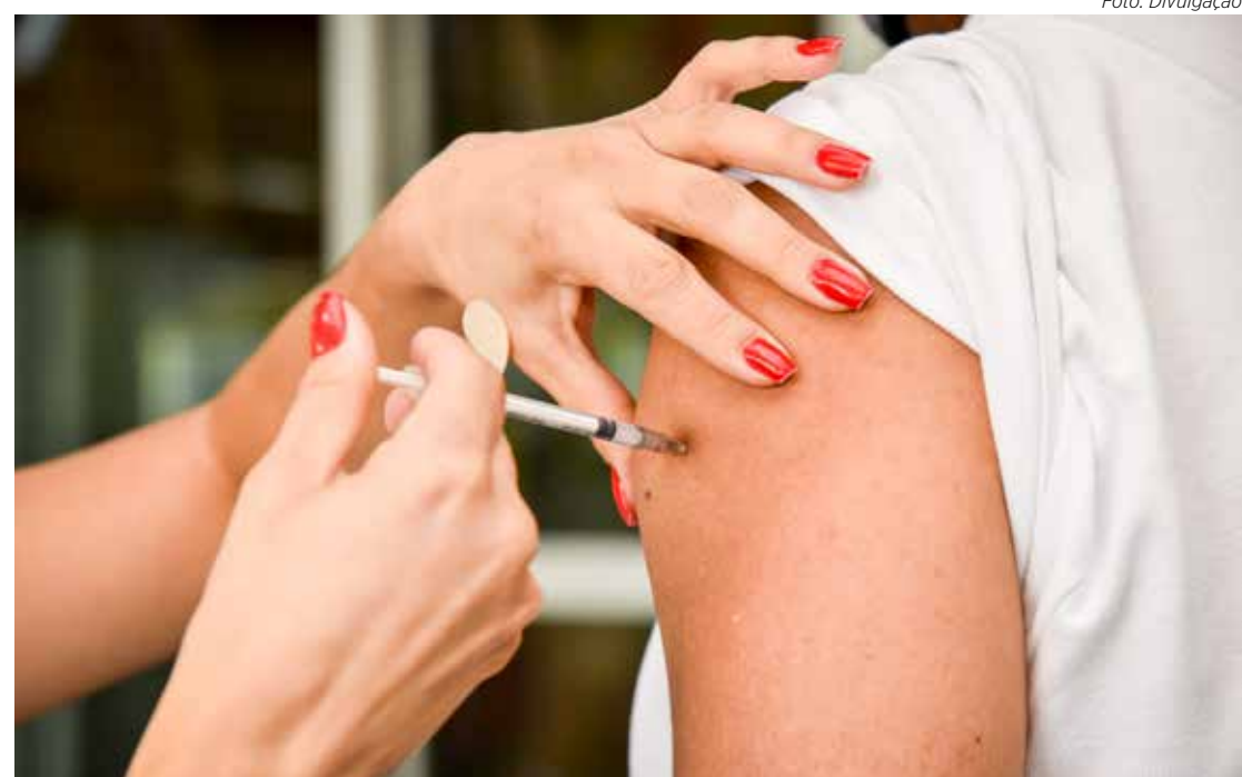
O município aplica a vacina bivalente e as demais doses contra a Covid-19