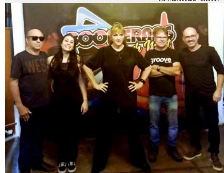
A banda Naftalina interpreta vários clássicos dos anos 70, 80 e 90