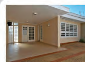
CÓDIGO 9084 Recepção, 5 salas, 3 wc's, cozinha com arm. emb., área externa com churrasq., lavanderia e garagem para 4 carros. Santa Cruz- Rio Claro/SP Valor: R$4.444,44