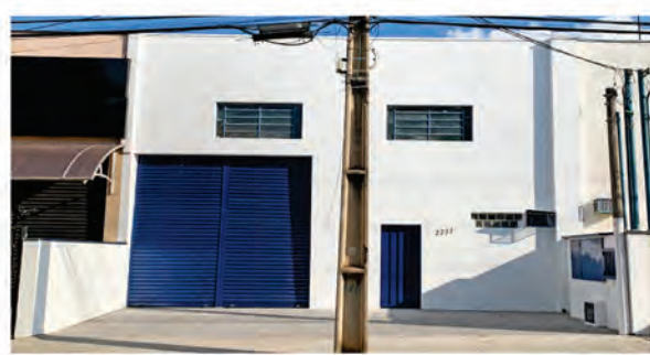
CÓDIGO 9122 - Galpão 300,00 M2, contendo recuo para carros, 2 Wc's, cozinha, área de luz. Avenida 14 Nº 2237, Jardim São Paulo - Rio Claro - Valor: R$835.000,00