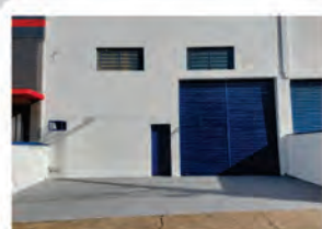
CÓDIGO 9121 Galpão 300,00 M2, contendo recuo para carros, escritório, mezanino, 2 Wc's, cozinha, área de luz. Avenida 14 Nº 2227, Jardim São Paulo - Rio Claro Valor: R$835.000,00