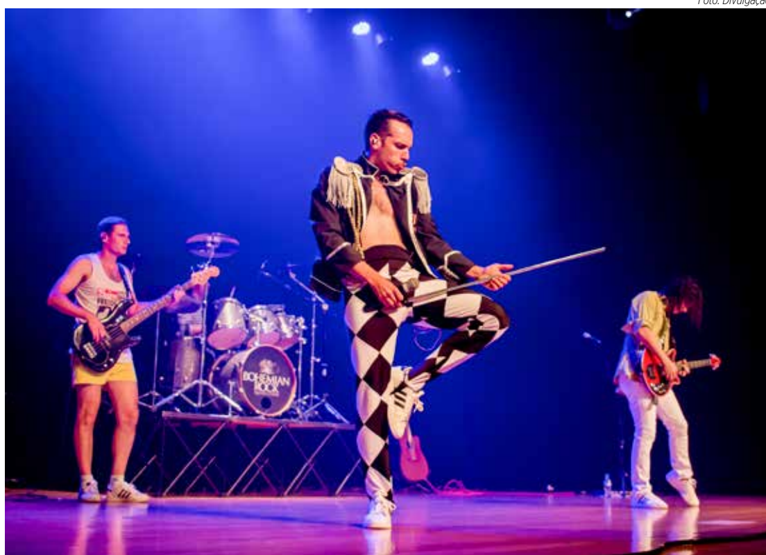
A banda Bohemian Rock tem em seu repertório músicas de todas as fases do Queen

A Bohemian Rock tem em seu repertório músicas de todas as fases do Queen. Desde su-