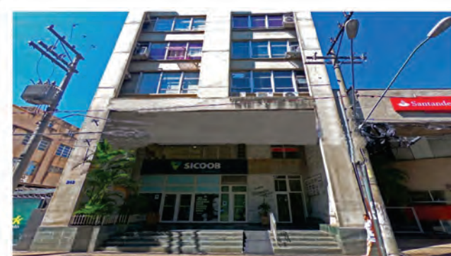
Código 8442 SALA COM APROXIMADAMENTE 82,00M², WC E COZINHA - Centro- Rio Claro - Valor Locação: R$666,67