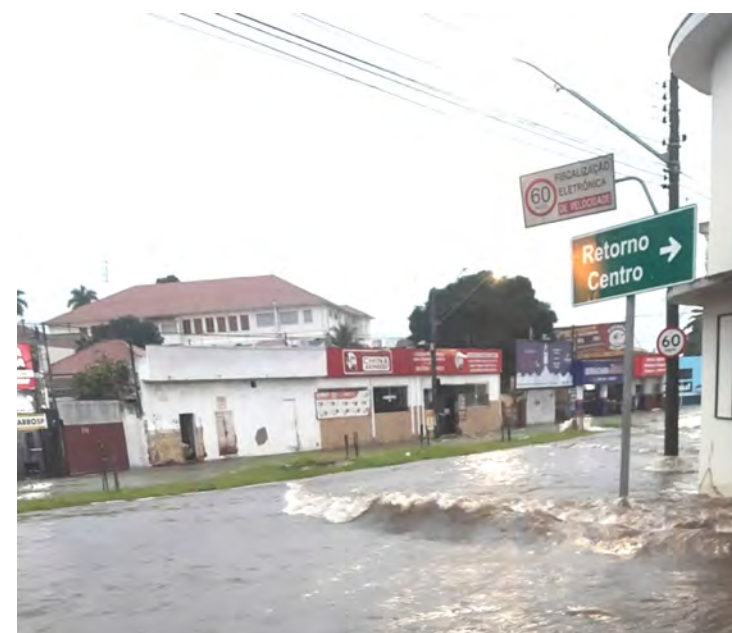
Alagamento em Avenida no Jardim São Paulo

O governo municipal e órgãos competentes estão fazendo sua parte no que se refere à prevenção e auxílio adequado em relação aos problemas decorrentes das chuvas, porém a população em geral pode ajudar a minimizar os efeitos das enchentes, ajudando na prevenção. As medidas a serem tomadas são: descartar lixo no lixo, pois o mesmo pode ser levado com força pelas águas e entupir as saídas de água e o descarte correto evitaria muitos problemas; colaborar e plantar mais árvores, incentivando espaços verdes, os mesmos permitem que a água penetre no solo, diferente do solo pavimentado; evitar descarte de resíduos próximos a bueiros ou córregos; evitar ocupar áreas sujeitas a inundações, principalmente próximas aos rios; optar por pisos intertravados para áreas externas, que possui sistema drenante, e a água é melhor absorvida.