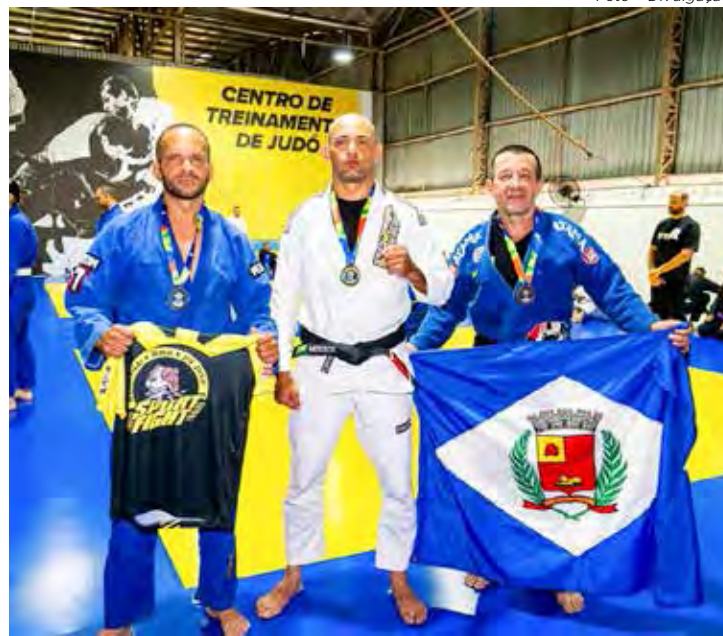
Equipe de judô da GCM de Rio Claro subiu ao pódio em Mogi Guaçu