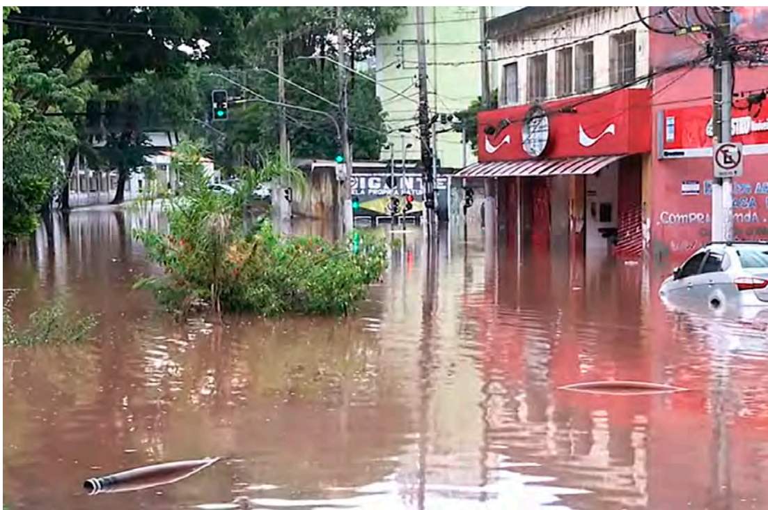
Inundação em São Paulo.

Notícias sobre enchentes virou algo corriqueiro na TV e mídia em geral. Chuvas fortes e contínuas estão ocorrendo com frequência e a população tem que enfrentar a onda de inundações que abatem várias regiões do Brasil. Vários transtornos e prejuízos são causados pelos alagamentos, pessoas presas no trânsito por conta da chuva, entre outros.