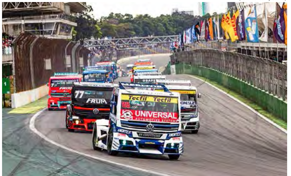
Copa Truck abre temporada em Goiânia