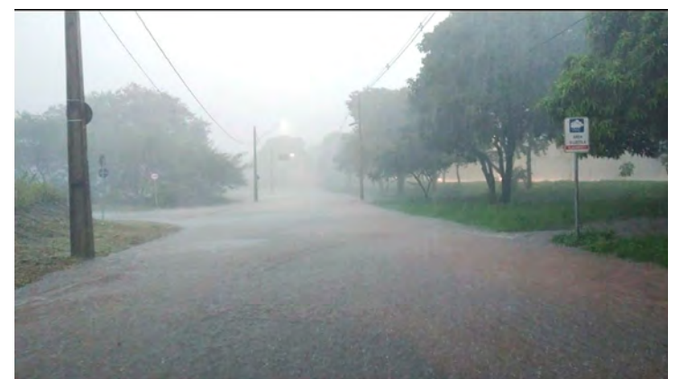
Alagamento na Avenida Visconde do Rio Claro

Exemplificando através de nossa cidade, a chuva de sexta-feira – 10 de março causou vários pontos de alagamento, como é o caso do pontilhão que dá aces-