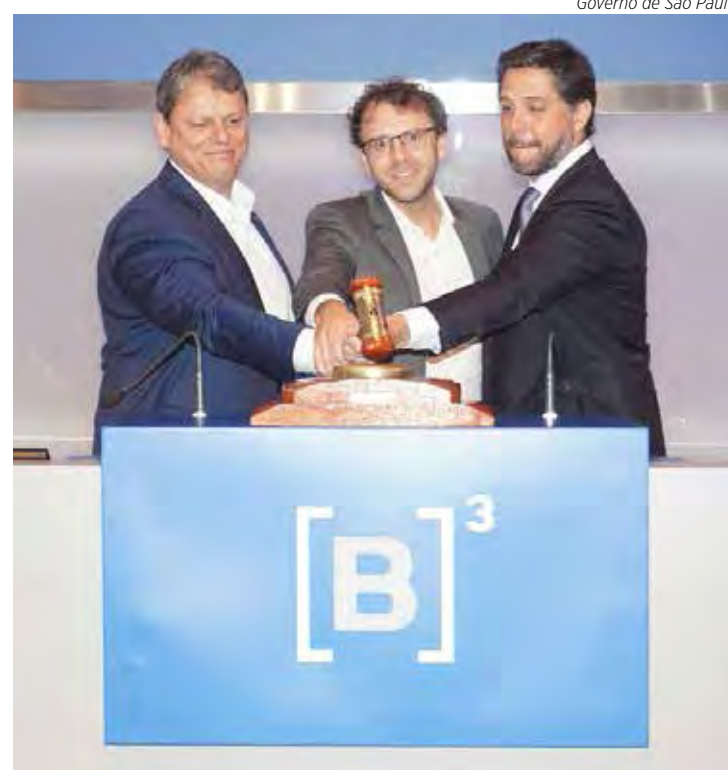
Governador do estado, Tarcísio de Freitas, durante oficialização do leilão

“A primeira parte está feita, agora é ir para campo realizar essa obra extremamente importante do ponto de vista logístico. São Paulo vai ganhar mobilidade com a Rodoanel Norte. O que foi pensado muitos anos atrás será concretizado agora. Guarulhos, Arujá e São Paulo vão gerar empregos, são pais de família que terão essa condição de levar o sustento para casa. É o usuário que vai se deslocar com mais velocidade e segurança. Vamos fechar essa saga do Rodoanel. Esse é um governo que acredita na iniciativa privada, no capital privado como indutor do desenvolvimento, que alivia o Estado. E vamos conseguir dar outros saltos importantes para melhorar a vida da população”, ressaltou Tarcísio de Freitas.