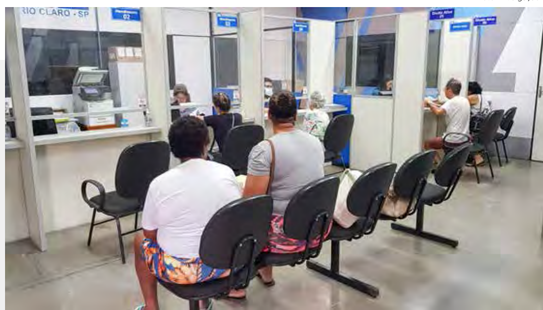
Atendimento presencial no Daae continua sendo feito mediante agendamento prévio

O usuário também pode agendar atendimento presencial no site do Daae, no endereço https://daaerioclaro.sp.gov.br , clicando no item “Agendamento”, na parte de serviços, na página inicial.