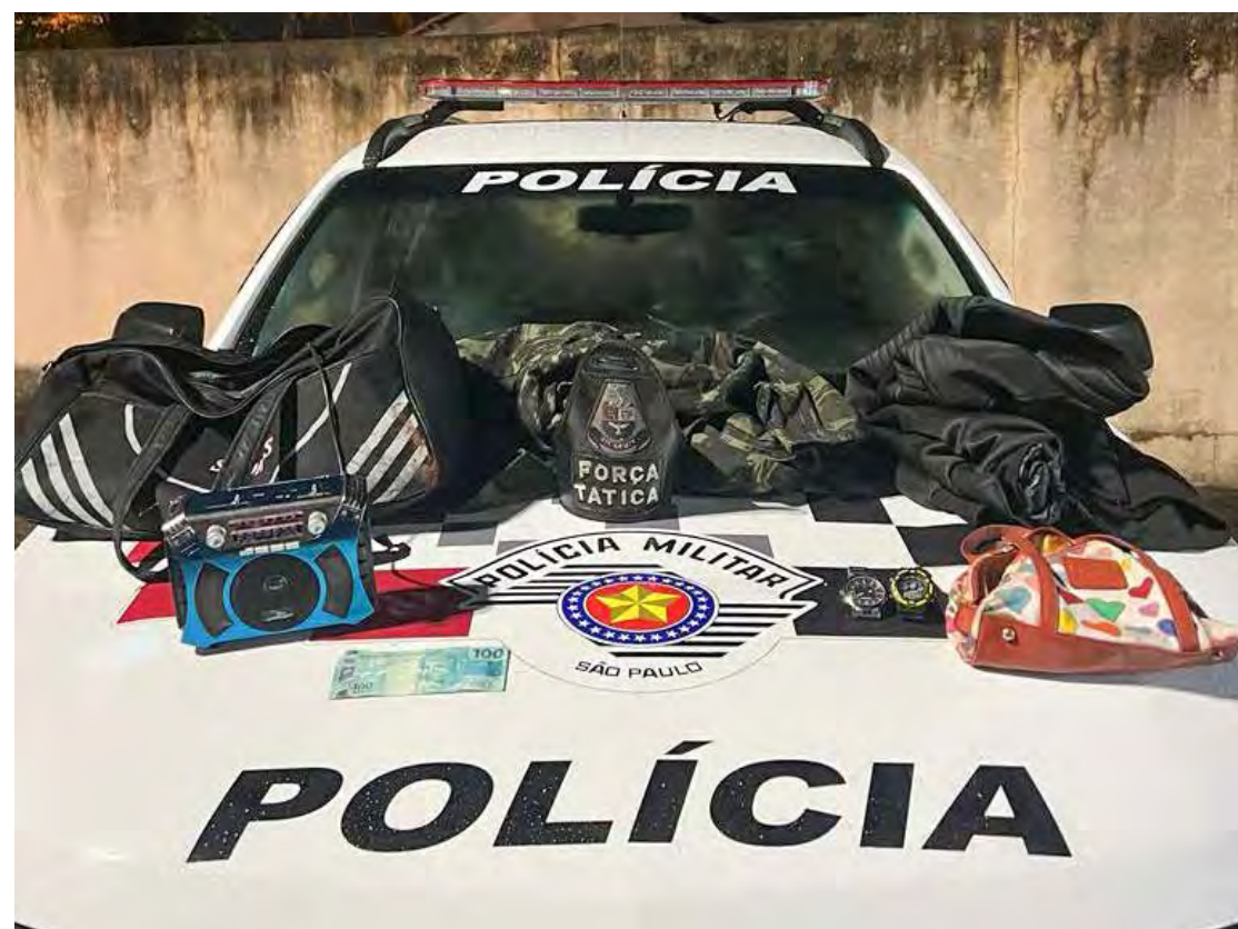
Pertences da vítima foram recuperados durante a ação da Polícia

Chegando ao endereço reportado, souberam da vítima que um homem a teria ameaçado e levado objetos da casa, fugindo para um terreno nas proximidades.