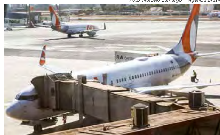
Intenção do governo seria vender passagens mais acessíveis em períodos de baixa temporada

“Desde o início do ano, a Abear e suas associadas mantêm diálogo constante com o Ministério de Portos e Aeroportos sobre o cenário do setor aéreo e as possíveis soluções para o crescimento do