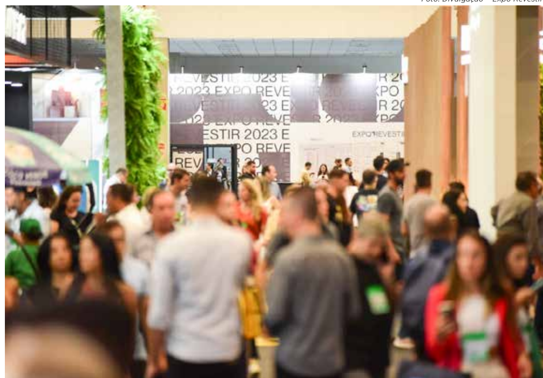
Vista geral dos primeiros dias de visitação da Expo Revestir 2023, em São Paulo

21ª Expo Revestir – 2023 14 a 17 de março Horário: 14 a 16 de março: das 10h às 19h 17 de março: 10h às 17h São Paulo Expo Rodovia Imigrantes, 1,5 Km | São Paulo