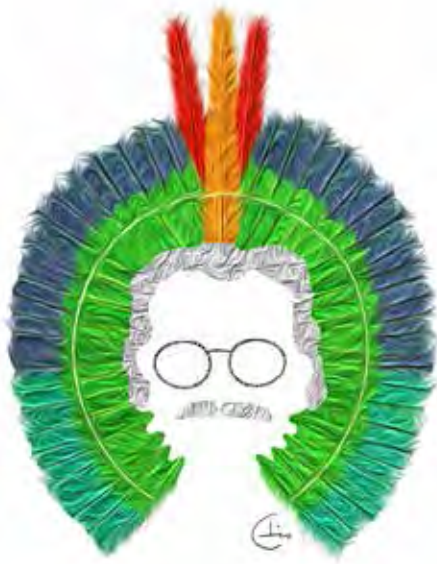
Arte de Chico Riani para a obra