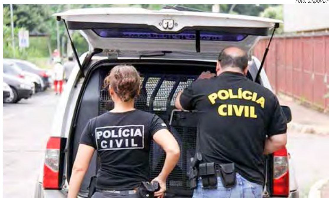
Os estados em que mais aumentou o efetivo feminino foram Espírito Santo, Acre, Roraima, Amapá e Rio Grande do Norte

A Pesquisa Perfil das Instituições de Segurança Pública, ano-base 2004 a 2021, mostra ainda aumento no número de delegacias de Polícia Civil especializadas no atendimento a ocorrências envolvendo mulheres em todo o Brasil. Em 2004, eram 177 unidades; em 2020, 464 e, em