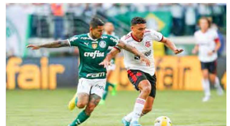
Palmeiras e Flamengo estarão no Mundial de Clubes da Fifa em 2025

O ranking, neste caso de preenchimento de vagas, vai levar em consideração apenas o período entre 2021 e 2024. O desempenho histórico não contará.