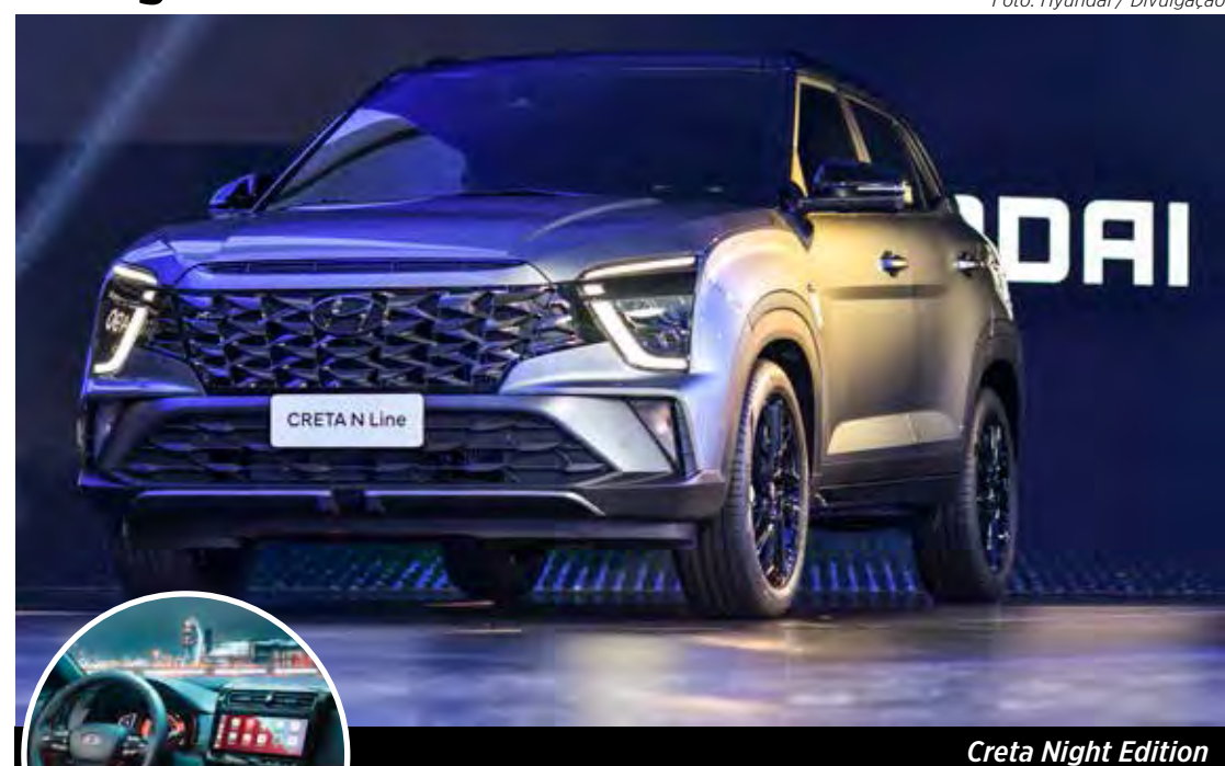
Creta Night Edition