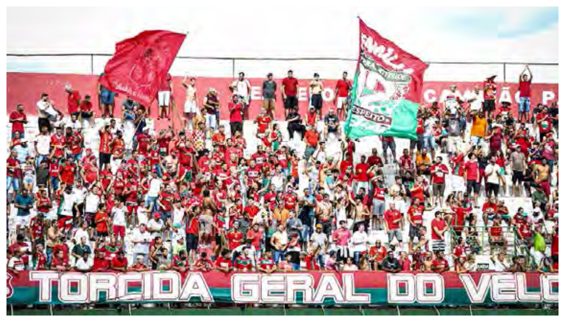
Torcida do Velo promete lotar o Benitão na sexta-feira

Vestindo a camisa oficial do Velo Clube o torcedor velista paga o ingresso no valor de meia entrada, tanto na arquibancada coberta como na descoberta.