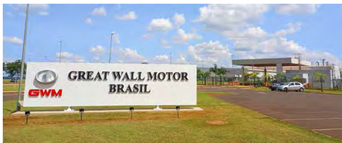
Fábrica GWM em Iracemápolis

garantia de 8 anos), sinal de internet 4G Claro, proteção para pneus contra furos e rasgos, duas primeiras revisões gratuitas, carro reserva na falta de peças para reparo e serviço de assistência 24 horas.