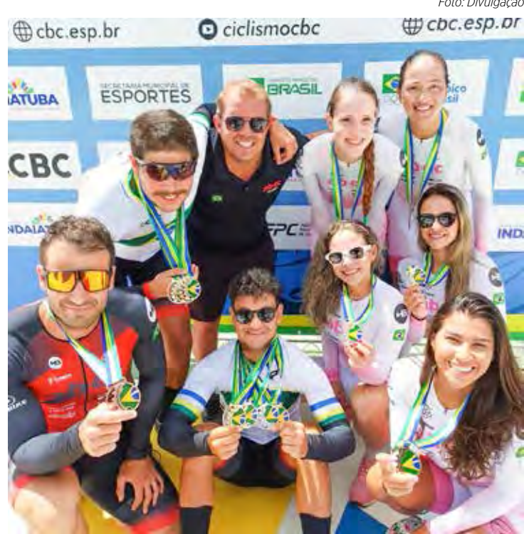
Premiação da equipe ABEC de Ciclismo

No total, os atletas da ABEC conquistaram 11 medalhas, sendo 5 de Ouro, 4 de Prata e 2 de Bronze, além de outros resultados expressivos em disputas acirradas na categoria masculina.