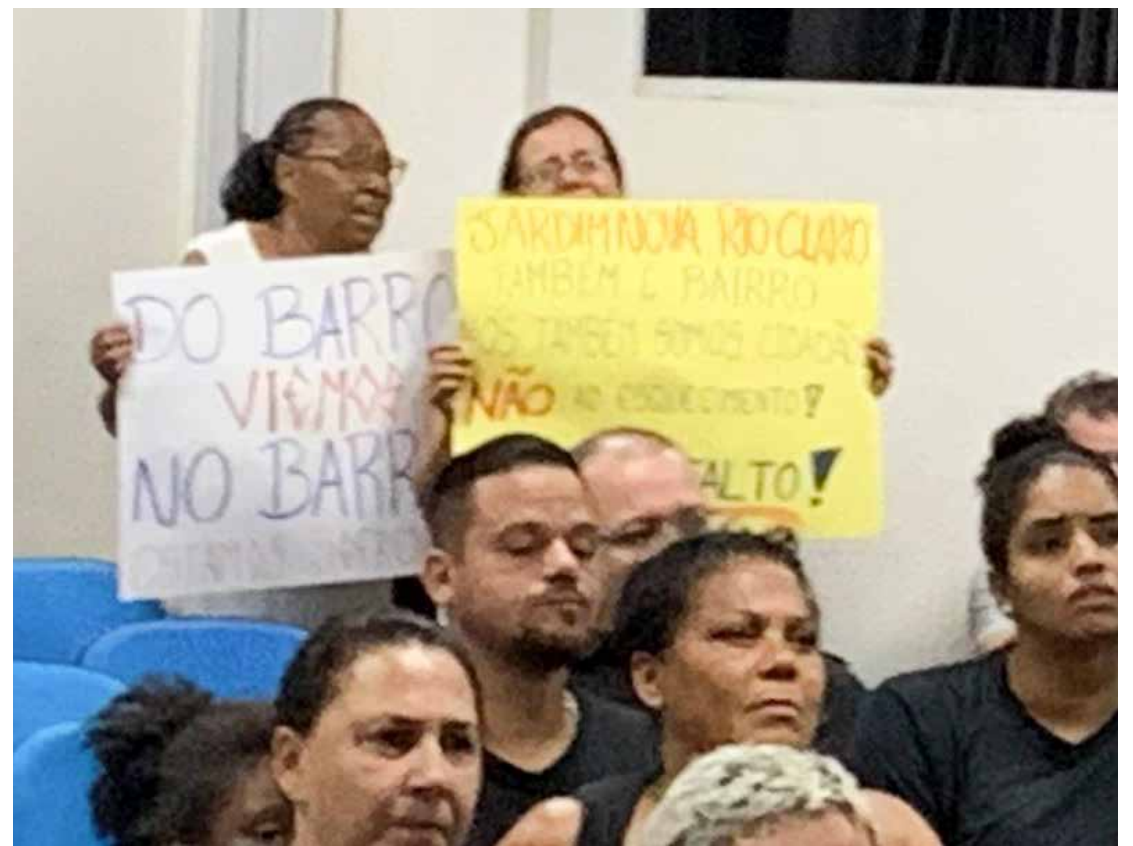
Grupo de moradores do Jardim Nova Rio Claro acompanhou a sessão camarária de segunda-feira (13)

Rio Claro. Morador tem que deixar carro longe de casa porque não dá para chegar em casa no veículo devido ao barro”, informou o parlamentar que exibiu vídeo com imagem de ruas esburacadas e cheias de lama. Andreetta solicitou ainda que enquanto o asfalto não chega ao bairro, a prefeitura