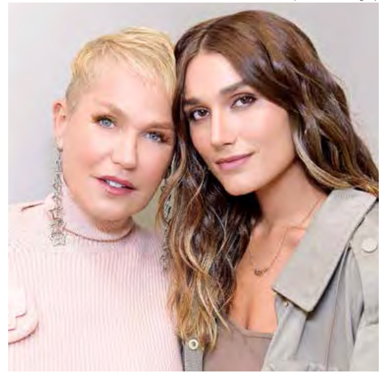
Xuxa e Sasha