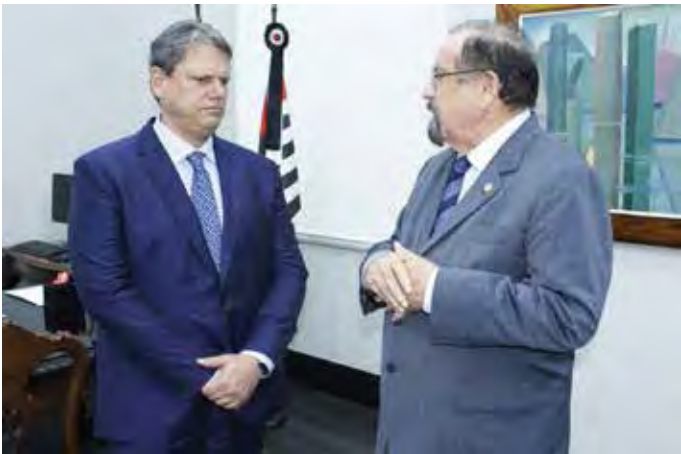
O governador Tarcísio de Freitas e o deputado Aldo Demarchi