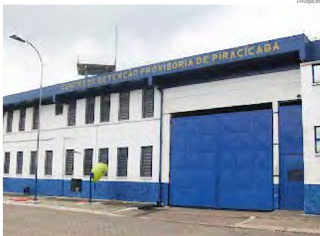
Centro de Detenção Provisória, de Piracicaba/SP

Detida em flagrante, ela foi levada para a delegacia e ficou à disposição da Justiça. Já sobre o filho detido, a direção do CDP afirmou que como de praxe instaurou um procedimento administrativo disciplinar.