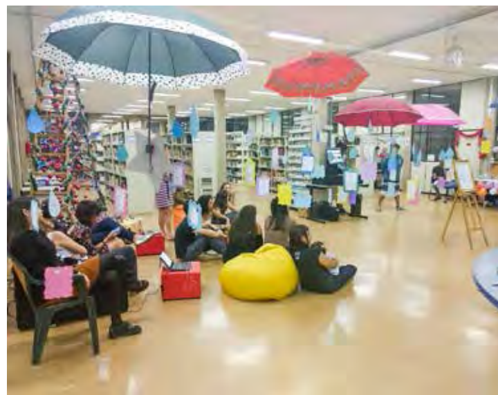
O espaço promove atividades diversas, como exposições, feiras, entre outros eventos

"É uma área onde agregamos valores, temos a oportunidade de contribuir e incentivar o estudo, a pesquisa e o conhecimento, particularmente tudo isso é muito fascinante.