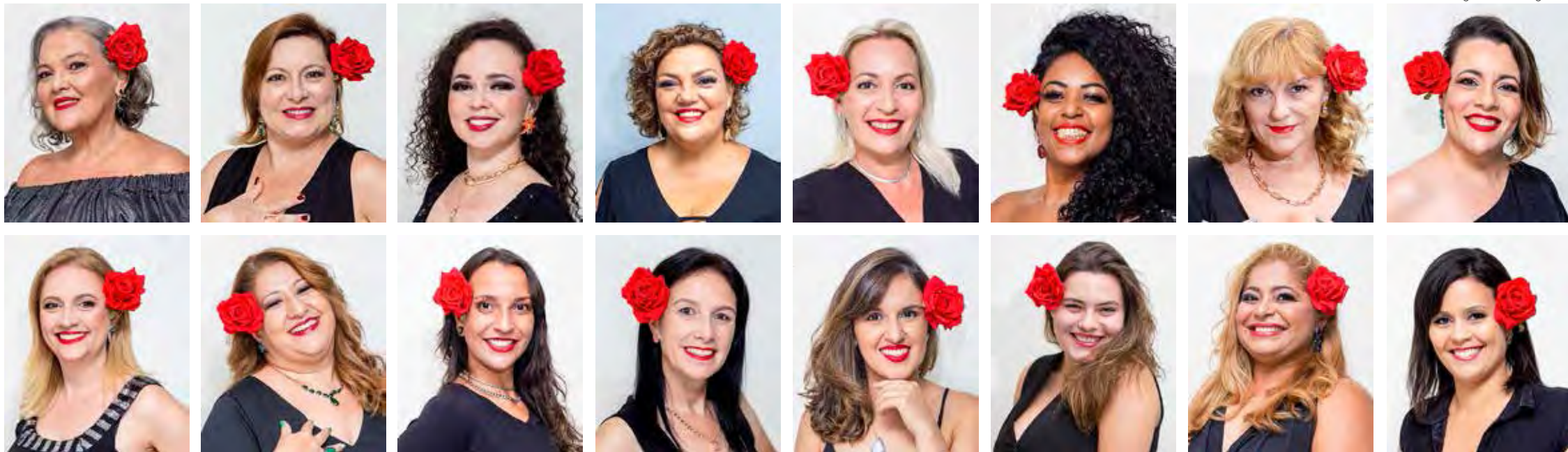
Grupo Mulheres que Cantam e Encantam faz show em homenagem à cantora Gal Costa