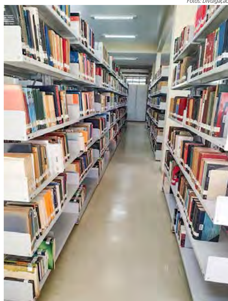
A biblioteca da Unesp tem um rico acervo disponível aos estudantes e à comunidade

Engenheiro de formação, trocou a ocupação pela biblioteconomia após conhecer o bibliotecário Melvil Dewey, que instituiu o Sistema de Classificação Decimal. Em 1915, aos 33 anos de idade, Manuel Tigre assumiu de vez a nova profissão. (Fonte: MEC)