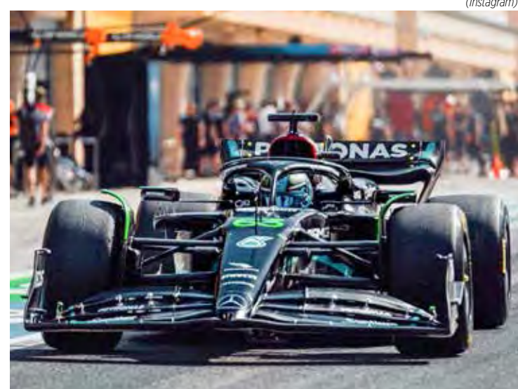
Diretor de engenharia destacou todos os problemas do W14 que ficaram ainda mais evidentes durante o GP do Bahrein

A equipe saiu da abertura do atual calendário como a quarto time mais rápido, depois que Hamilton foi impotente ao tentar resistir ao ataque de Fernando Alonso, da Martin, em sua busca ao pódio, logo atrás das Red Bulls. George Russell foi igualmente derrotado, ficando atrás de Lance Stroll, que ficou em sexto.