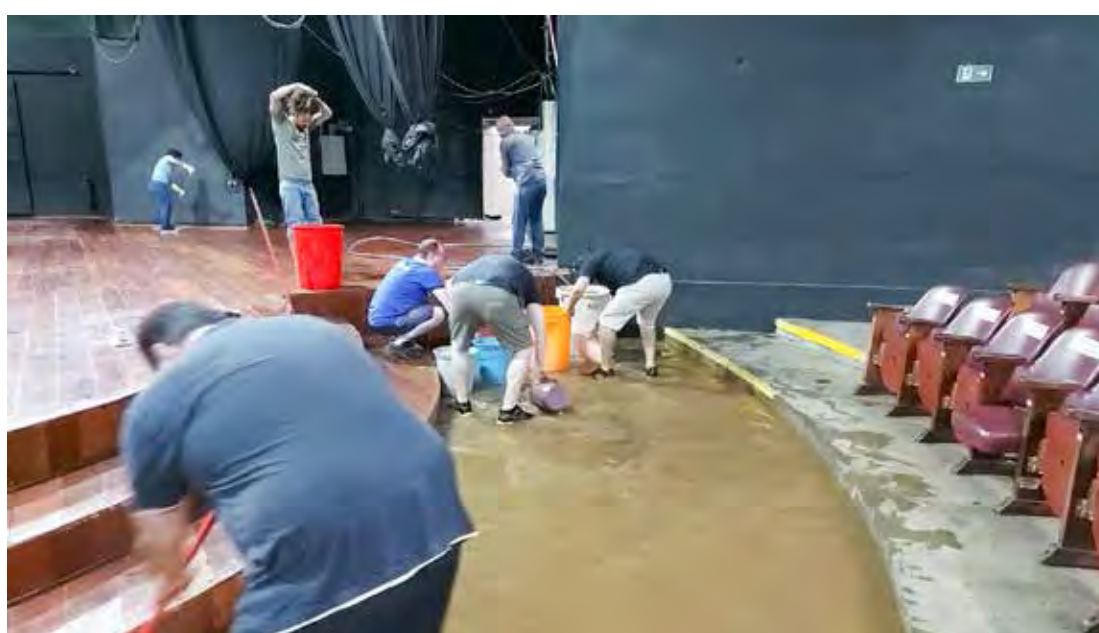
Serviços começaram a ser feitos já durante as chuvas de sexta-feira