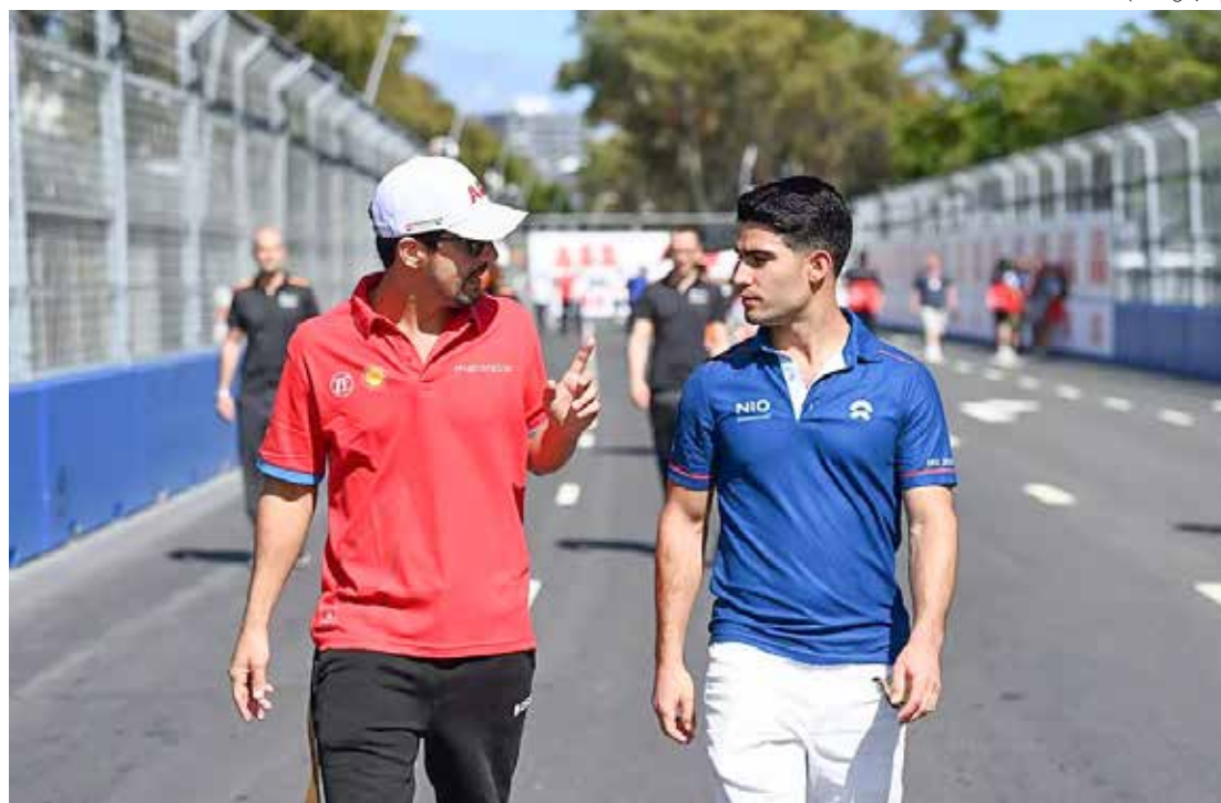
Representantes do Brasil na FE, Lucas Di Grassi e Sérgio Sette Câmara participaram do evento no Sambódromo

O poder público municipal espera gerar mais de 3 mil empregos diretos e indiretos relacionados ao evento da Fórmula E, com impacto estimado superior a R$300 milhões.