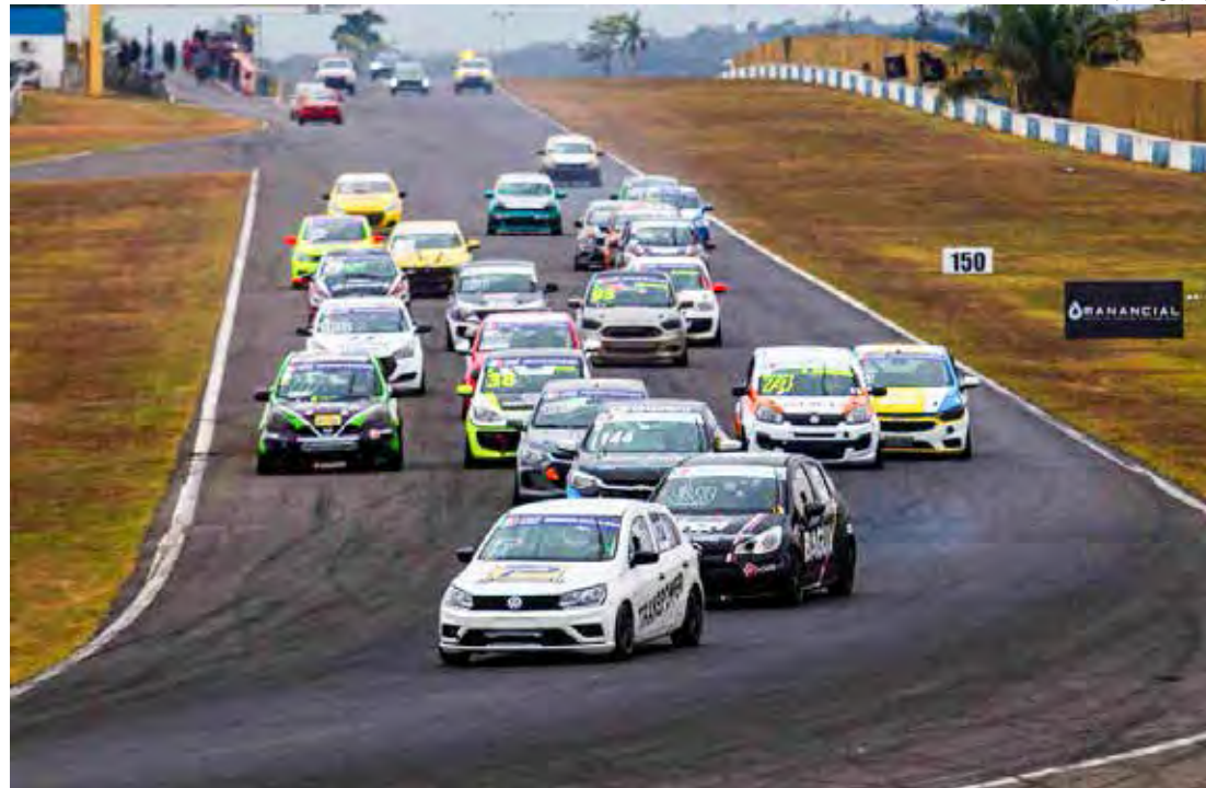
Goiânia sedia primeira etapa do campeonato

A proposta caiu no gosto de equipes e pilotos, com 37 carros inscritos. A programação da abertura do Marcas Brasil Racing contará com quatro sessões de treinos livres nesta sexta-feira (10). A partir das 17h25 acontece o treino classificatório. No sábado as largadas estão previstas para as 10h35 e 13h35. Já no domingo, sinais vermelhos apagados às 11h20 e 14h45.