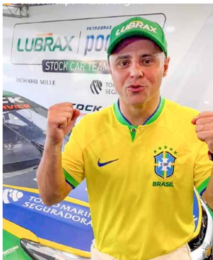
Vice-campeão mundial de Fórmula 1 prevê que 2023 verá sua melhor campanha na principal categoria do automobilismo nacional

dos pela empresa sul-coreana Hankook Tire. “É uma mudança muito interessante”, diz ele. “Vamos passar por um aprendizado para entender o pneu e o jeito dele trabalhar. Vamos ver se a gente consegue se adaptar o mais rápido possível a esse pneu e ter um entendimento bom e completo. Acho que é positivo, mudanças são sempre importantes”, finalizou.