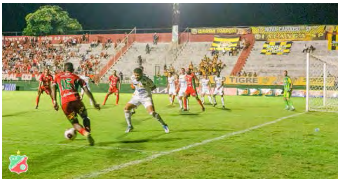
Velo enfrenta o XV, em Piracicaba, neste sábado, 11, pela Série A2