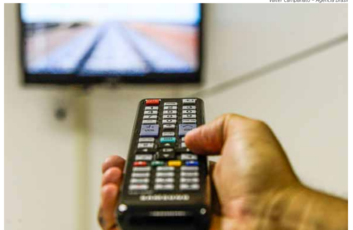
Valter Campanato - Agência Brasil