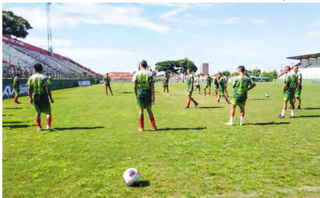
Velo Clube se prepara para clássico regional em Piracicaba