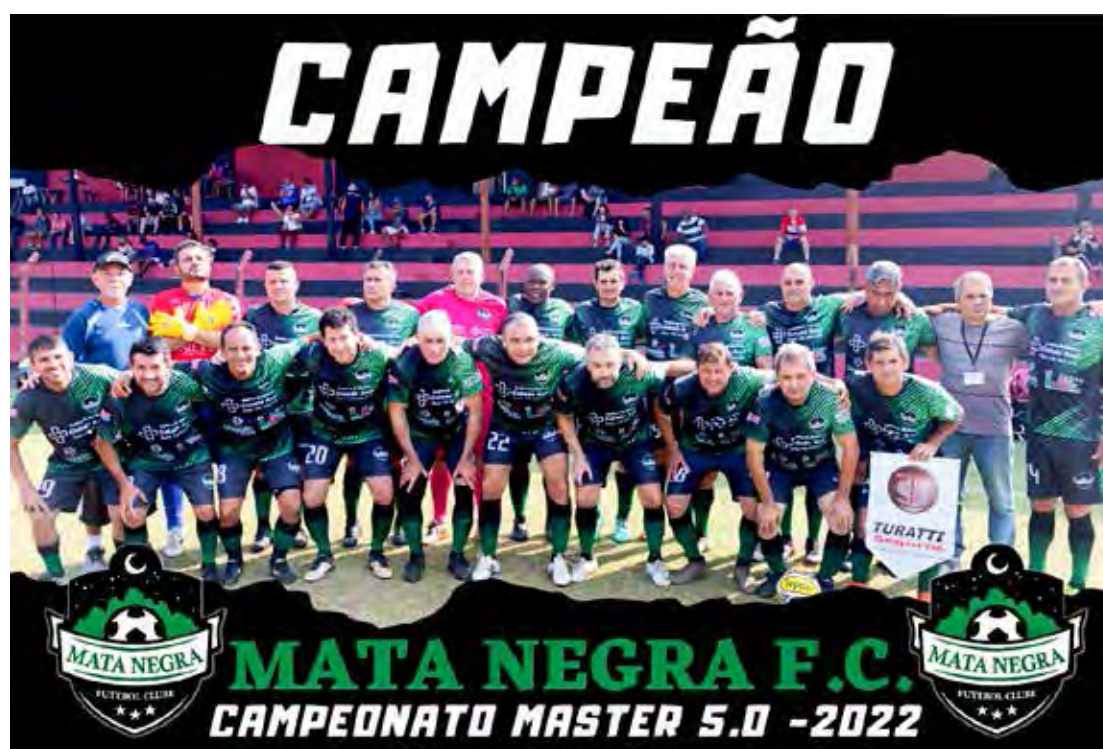
A equipe do Mata Negra FC é a grande campeã do torneio Máster 5.0