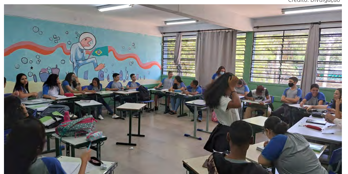
Alunos participam de atividade em sala de aula de escola pública de Rio Claro.

Foram 10 turmas de três escolas públicas de Rio Claro, SP, contempladas pelo método, sendo: 1A, 1B, 2A, 3A, 3D – Escola Estadual Heloisa Lemenhe Marasca; 2C, 2D, 2E, 3T do EJA – Escola Esta-