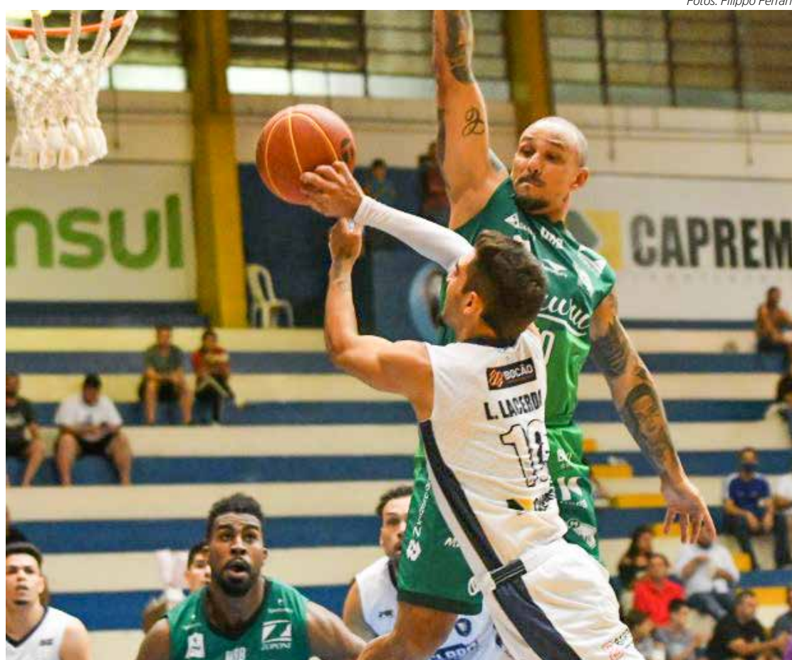
Rio Claro comandou o placar o tempo todo contra Bauru