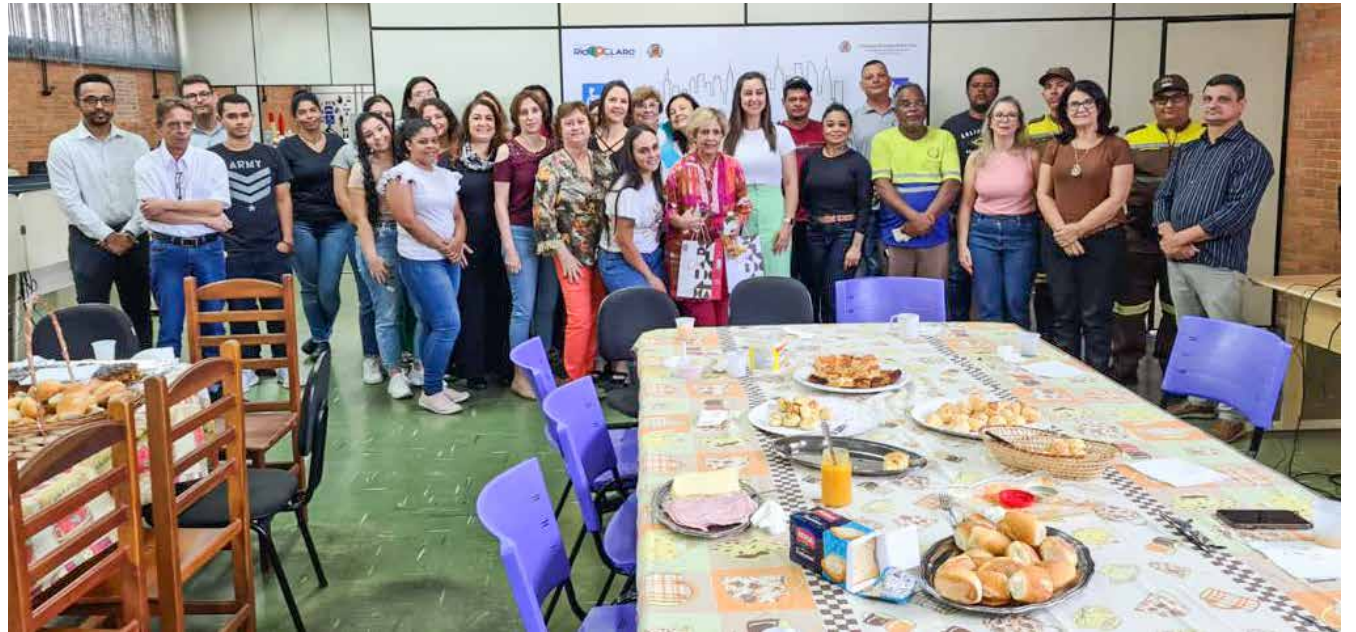
Mulheres e homens da Secretaria de Mobilidade Urbana participaram de café da manhã