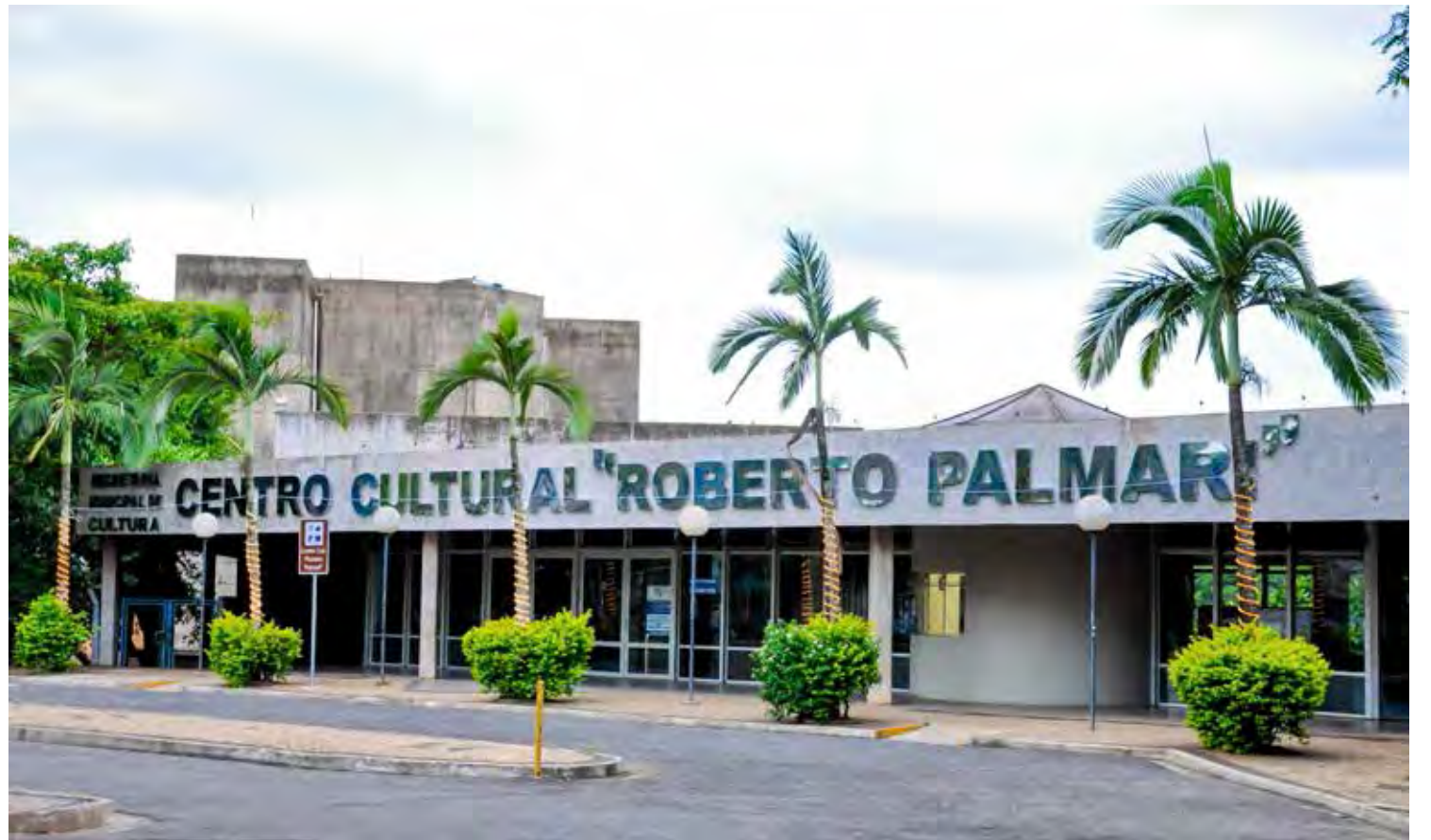
A cerimônia de abertura da Semana da Mulher será realizada hoje no Centro Cultural “Roberto Palmari”

Logo depois, às 15h30, nova palestra no auditório do NAM, desta vez com o tema “A mulher por trás das mães de filhos com autismo” com a