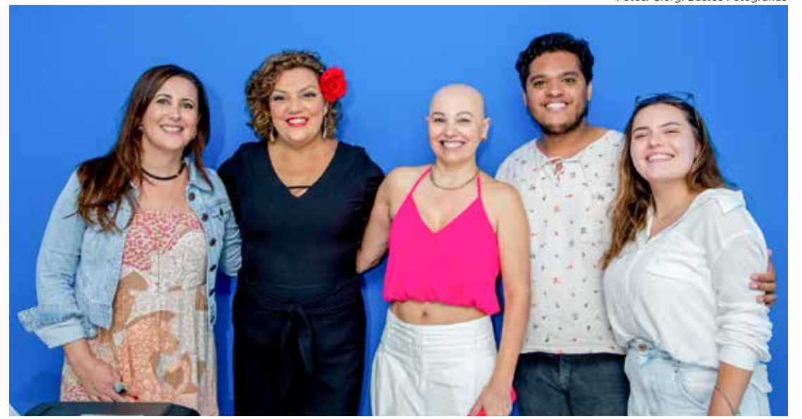
Ensaio do show do grupo Mulheres que Cantam e Encantam que vai homenagear a cantora Gal Costa

O show "Eternamente Gal" - Mulheres que Cantam e Encantam 2023 será realizado nos próximos sábado e domingo, dias 11 e 12 de mar-