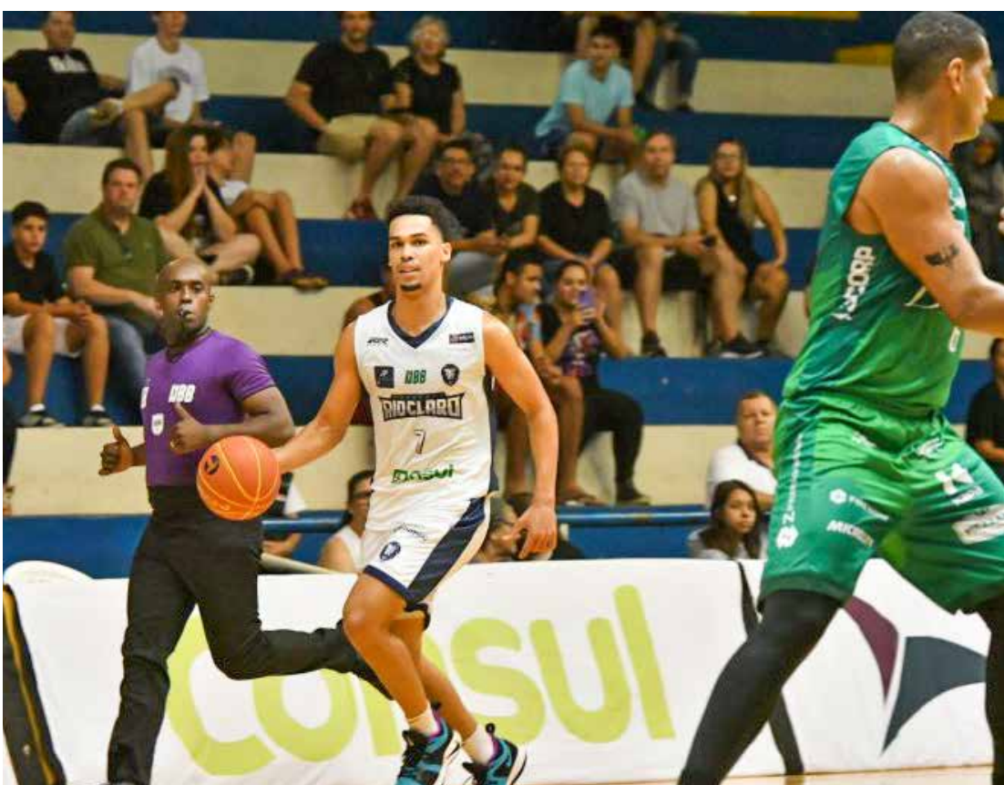
Rio Claro Basquete conquistou a 6ª vitória no NBB15