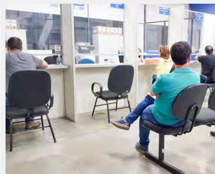
Setor de atendimento ao público do Daae no bairro Cidade Nova

O usuário também pode agendar atendimento presencial no site do Daae, no endereço https://daaeriolclaro.sp.gov.br , clicando no item "Agendamento", na parte de serviços, na página inicial.