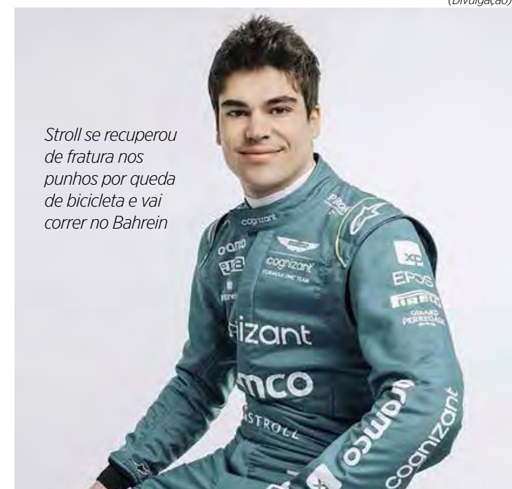
Stroll se recuperou de fratura nos punhos por queda de bicicleta e vai correr no Bahrein