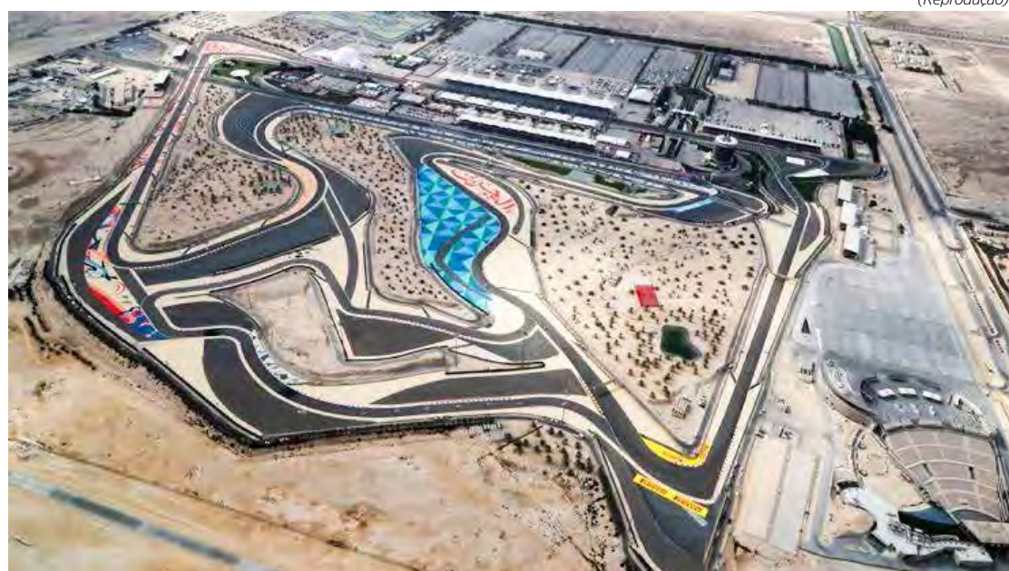
Programação no circuito do Sakhir será repleta de atividades de pista