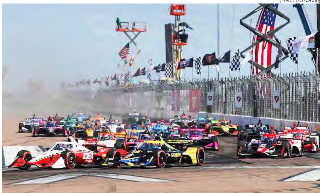
Fórmula Indy abre temporada nas tradicionais ruas de São Petersburgo

Road to Indy- Três das principais categorias do Road to Indy também fazem a abertura de seus campeonatos esse fim de semana em St. Petersburg. A Indy NXT fará uma corrida, enquanto a USF2000 e a USF Pro 2000 farão uma rodada dupla.