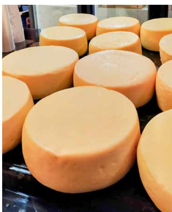
A Casa Ferruccio tem o delicioso queijo meia cura da Canastra