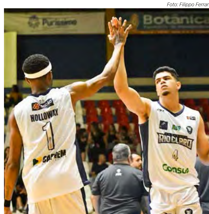
Rio Claro Basquete enfrenta o Pinheiros, às 20 horas, pelo NBB15

Na próxima segunda-feira (6), o Leão voltará a jogar pelo NBB15. O adversário será o Bauru Basket, em partida marcada para às 20 horas no ginásio Felipe Karam.