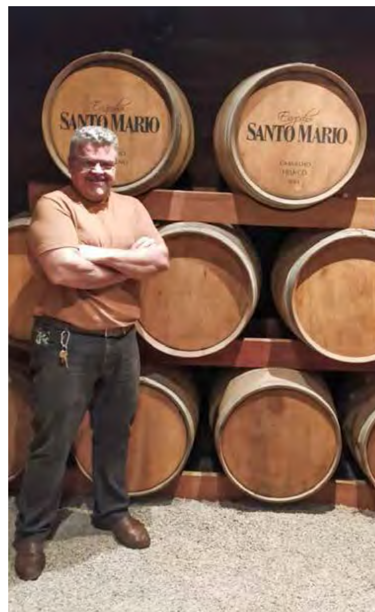
Vinhos e cachaças também podem ser encontrados no empório

O Empório Casa Ferruccio fica na Avenida 7, nº 1243, entre as ruas 13 e 14, no bairro Consolação em Rio