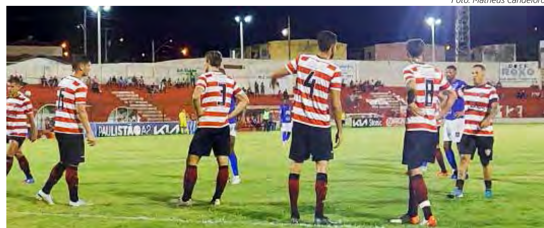
Linense levou a melhor sobre o Azulão

No próximo sábado (4), o Azulão rio-clarense visita o Noroeste, jogo válido pela 14ª