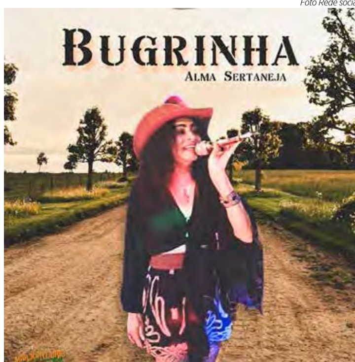
Bugrinha - Alma Sertaneja no Ponto 44 e no Brunelli's Bar

MADUREIRA BAR MUSIC – Nesta sexta (3), a partir das 20h, tem música ao vivo com Projeto X com as melhores do Rock e Pop Rock. No sábado (4) a partir das 20h, tem música ao vivo com Banda Total Brasil com as melhores do Samba, MPB e Pop Rock. O Ma-