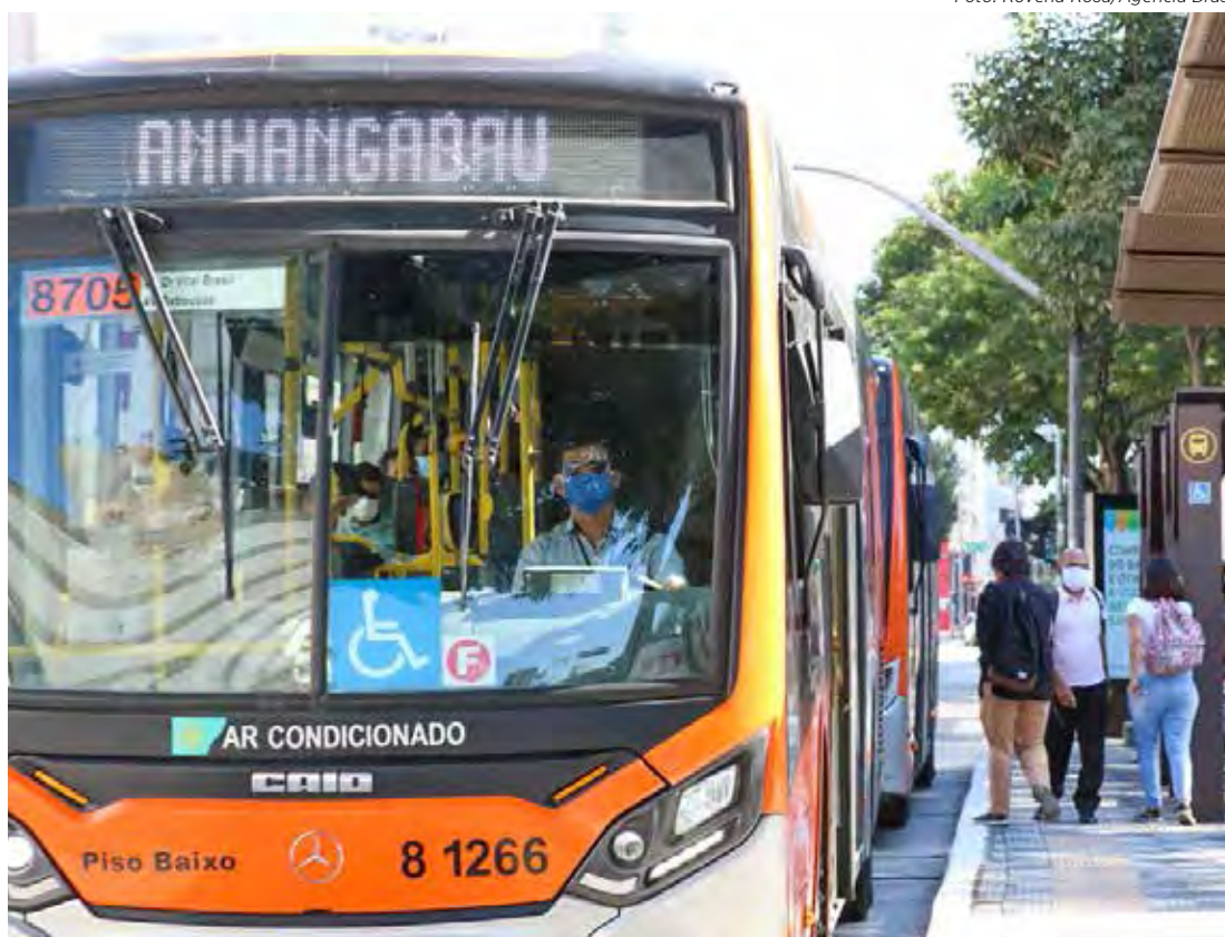
Uso de máscaras deixa de ser obrigatório em ônibus, trens e metrô de São Paulo a partir de hoje

Além disso, o uso de máscaras segue sendo especialmente importante por idosos com mais de 65 anos de idade e pessoas com alguma imunodeficiência, com comorbidades e com sintomas respiratórios. O governo