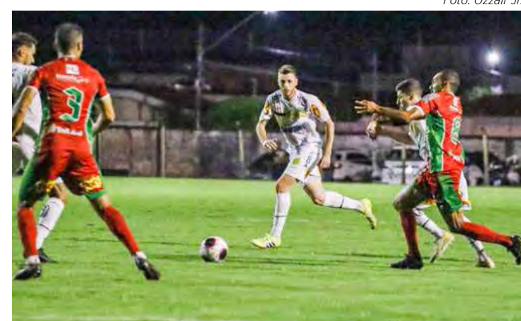
Velo mereceu a vitória sobre o Tigre