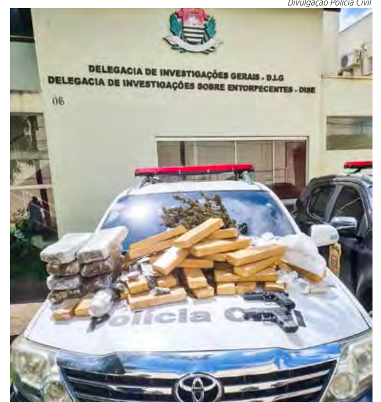
Vários tipos de drogas e material para fracionamento, embalagem e venda foram apreendidos

Os dois homens acabaram presos em flagrante e as investigações devem continuar para apurar outras conexões com a prática criminosa.