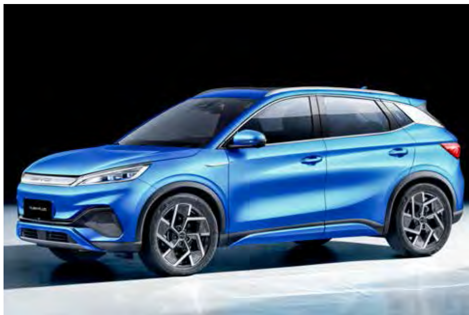
BYD YAN Plus elétrico - marca vai fabricar no Brasil

Enquanto a eletrificação é tema de eventos e estratégia de montadoras, o CEO do Grupo Stellantis, Carlos Tavares, jogou um banho de água ao afirmar ao jornal Valor Econômico que a tecnologia não faz sentido no Brasil. “O elétrico não faz sentido se comparado com o carro que pode rodar com 100% de etanol”, segundo disse, apoiado em informações de cientistas. “Sem contar que é muito mais caro para a classe média”, emendou o executivo.