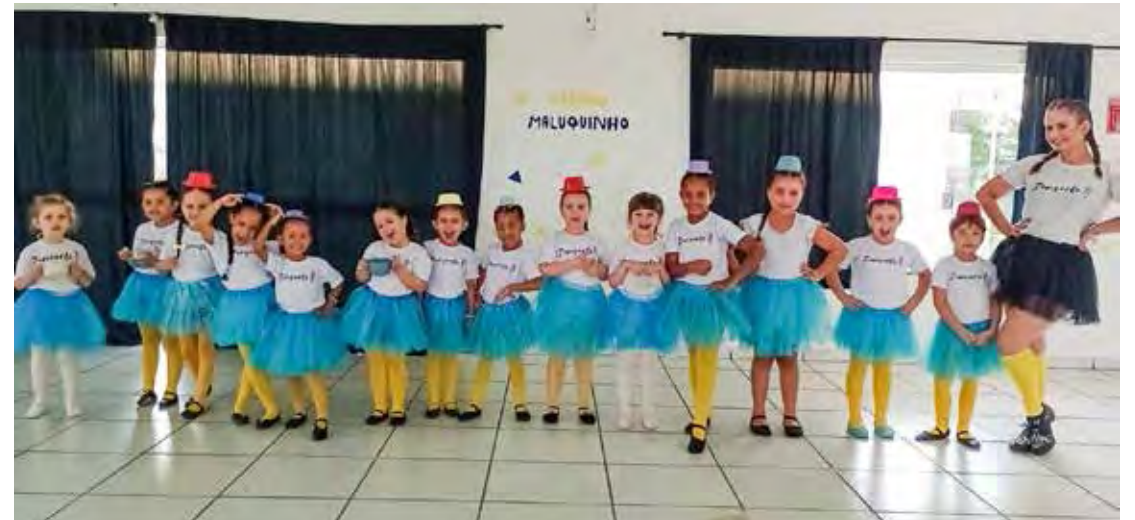
"O Menino Maluquinho" foi um dos temas já apresentados pelas alunas da Dançarte