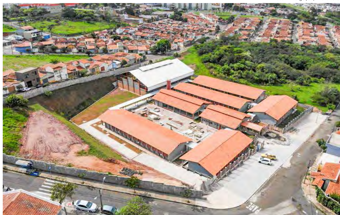
Vista aérea da escola no Benjamin de Castro que deve ser inaugurada no início de abril

audiência que foram retomadas nesta semana a construção de duas creches que estavam com obras paralisadas localizadas no Jardim Residencial das Palmeiras e Jardim Residencial dos Bosques. A escola do Palmeiras tem previsão de término de quatro meses e a do Bosques no final do ano, segundo informou a secretária na audiência pública.