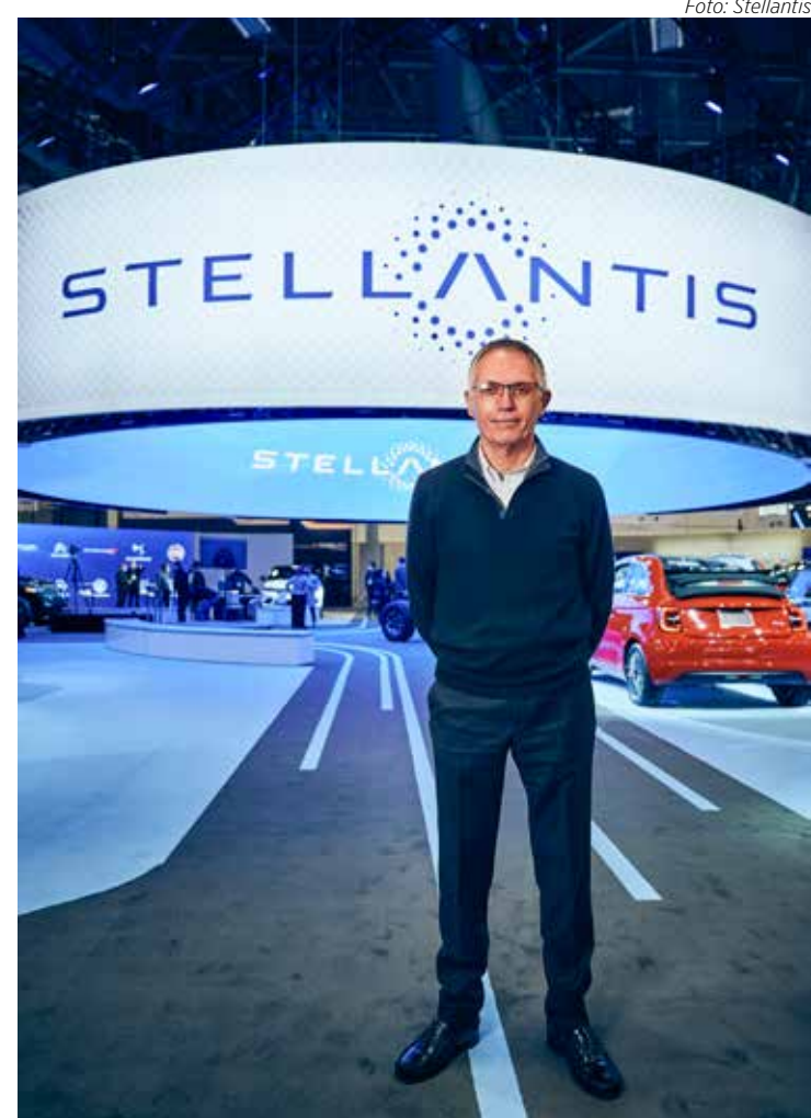
Carlos Tavares, CEO do Grupo Stellantis

do. Por isso, para a Associação Brasileira de Engenharia Automotiva (AEA), o Brasil é líder em descarbonização. “Estamos à frente de países da Europa e da China”, afirmou Besalieu Botelho, presidente da entidade.