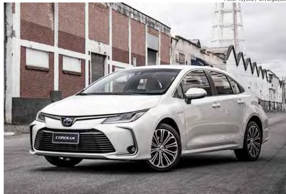
Corolla híbrido flex foi pioneiro

No Brasil, 47% da matriz energética é renovável, comparado a 14% do resto do mun-