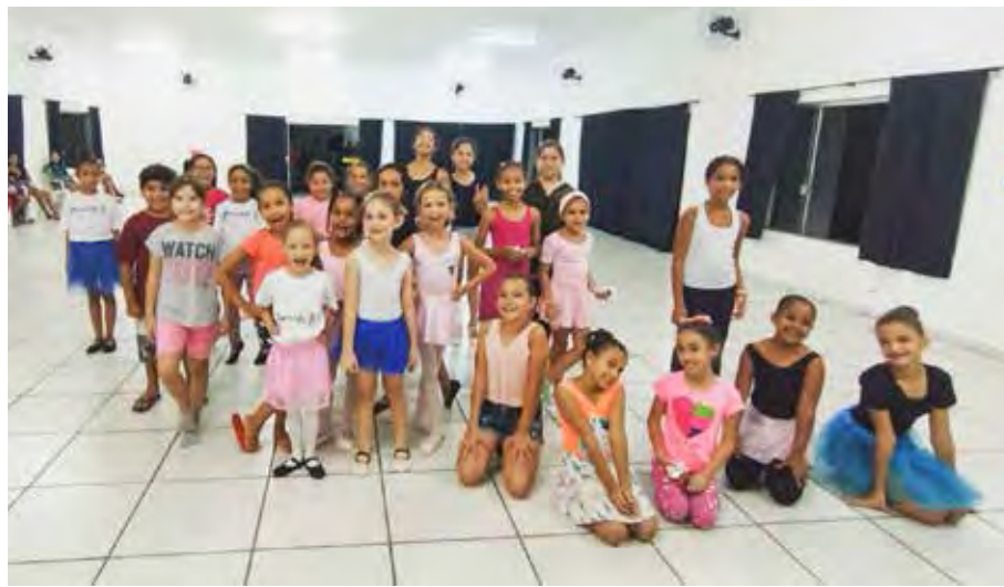
O projeto social Dançarte atende atualmente 65 crianças e jovens