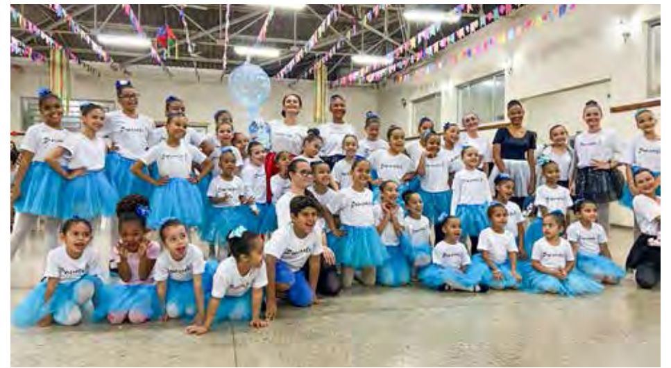
Crianças e jovens recebem aulas gratuitas de balé clássico