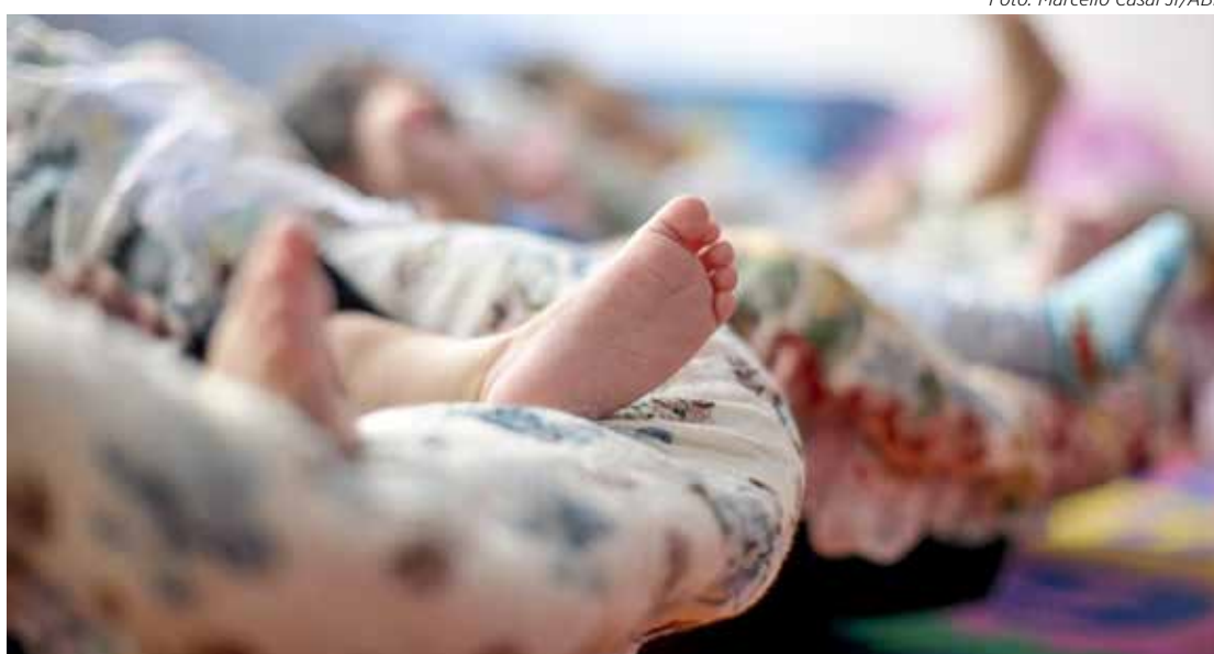
Município tem 807 crianças aguardando uma vaga em creche

As três escolas contam com investimentos do governo federal, através do Fundo Nacional de Desenvolvimento da Educação (FNDE), e de contrapartida do município.