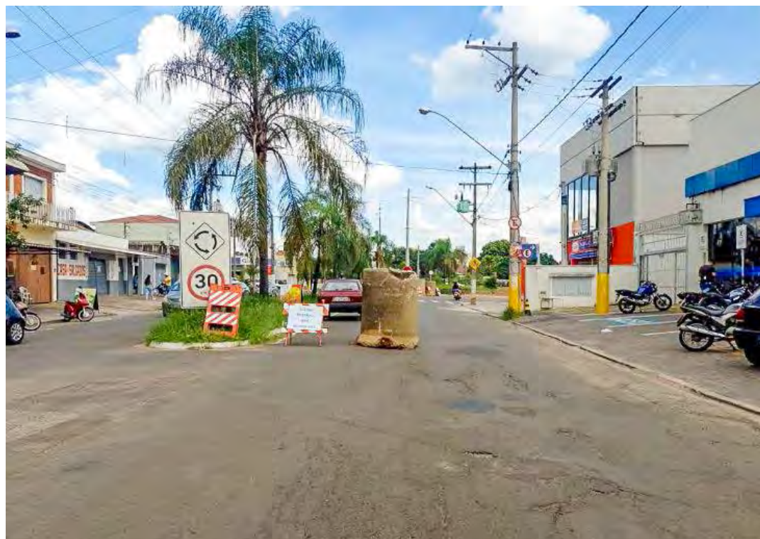
As interdições ocorrem em razão da realização de obras