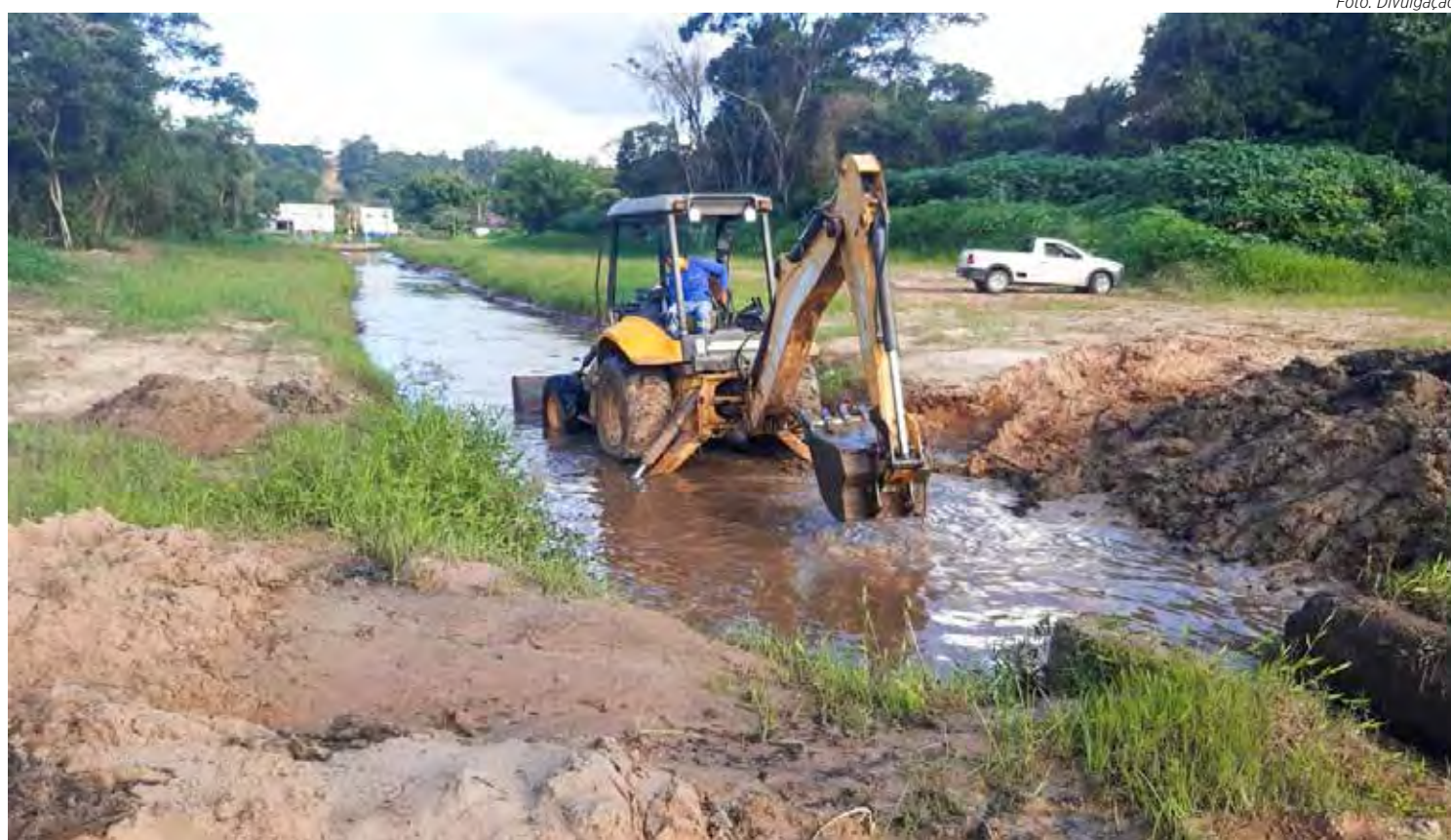
Serviço de limpeza na ETA 2 será realizado na manhã desta terça-feira (28)

A ETA 2 abastece 60% da cidade. Os outros 40% são abastecidos pela ETA 1, que fica no bairro Cidade Nova e seguirá funcionando normalmente.