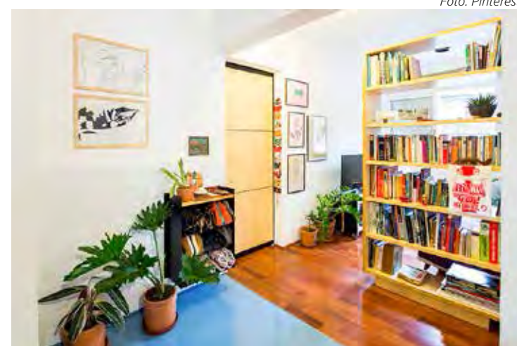
Misturar pisos diferentes

Além de brincar com a mistura de materiais, cores e estampas também podemos inovar utilizando o formato dos pisos. Os revestimentos cerâmicos hexagonais estão em alta na decoração e uma das maneiras mais interessantes de utilizá-los é através do piso, criando recortes e desenhos na