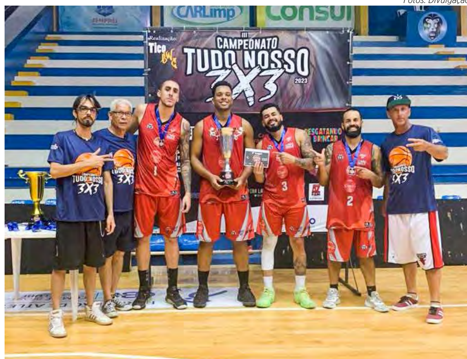
Guarulhos Basquete (Guarulhos) - 2º Lugar