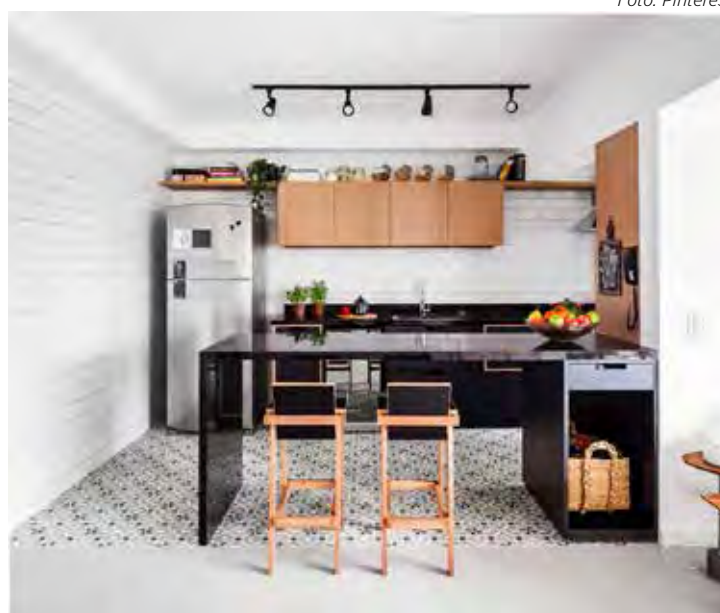
Misturar pisos com estampa diferente

Por mais que o ambiente seja integrado, você pode escolher um piso diferente para demarcar a mesa de jantar, a sala de estar ou então delimitar o espaço da cozinha.