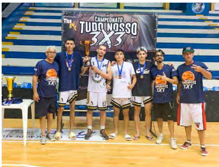
Black Panthers (Rio Claro) - 3º lugar