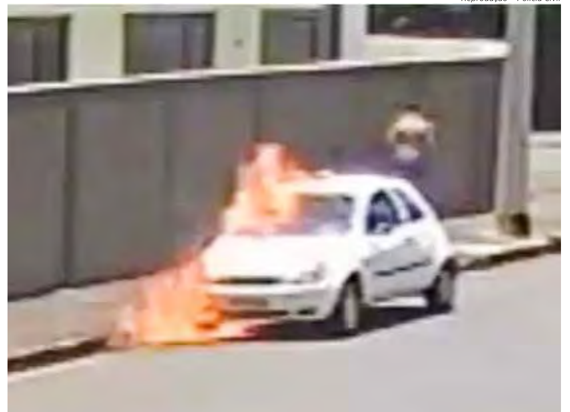
Imagens de câmeras de segurança mostram o indivíduo, mas a Polícia precisa de mais informações

um homem que incendiou um veículo em Rio Claro. O caso aconteceu no dia 25 de janeiro.