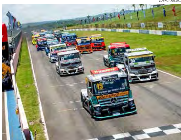
A programação completa da corrida será divulgada posteriormente

A venda online será realizada até o dia 17 de março, passando a ser na bilheteria do autódromo no sábado e domingo de evento. Mais informações e valores no site da categoria ( https://copatruck.com.br )