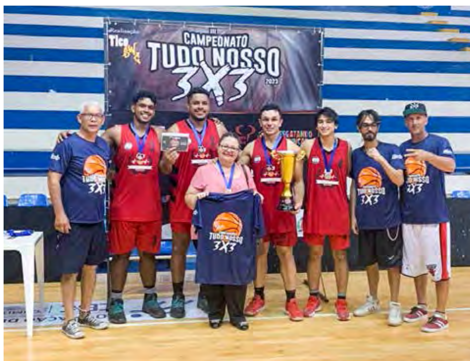
Equipe Mais Mais de Campinas - Campeã