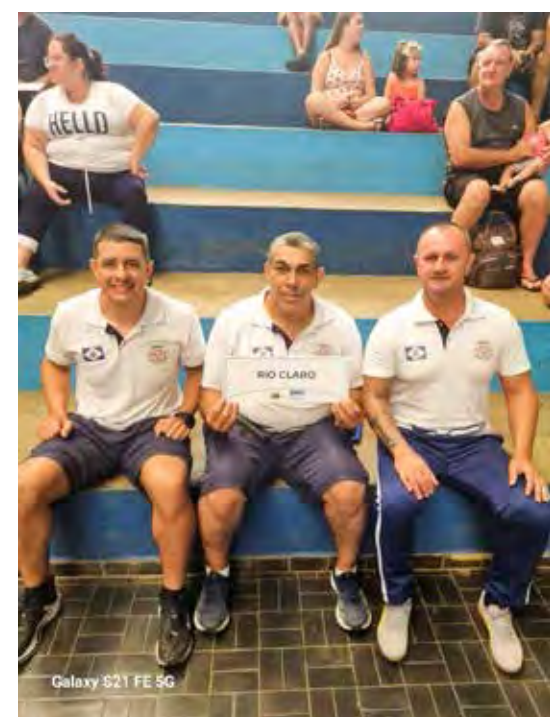
Olimpíadas das Guardas Municipais do Estado receberam este ano inscrições de delegações de 45 municípios paulistas

Sem edições por dois anos, por conta da pandemia de Covid 19, as Olimpíadas das Guardas Municipais do Estado receberam este ano inscrições