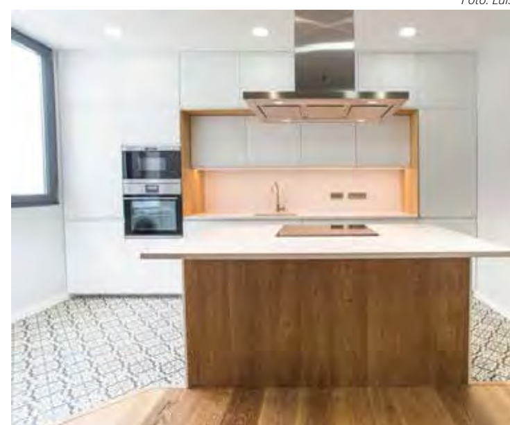
Pisos diferentes na cozinha