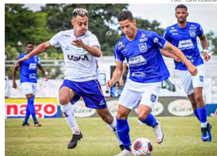
Rio Claro FC superou São Caetano e volta a sonhar com G8

A vitória, que veio em hora certa, fez o Azulão subir do 12º para o 10º lugar na tabela de classificação, agora, com 15 pontos ganhos. Na 13ª rodada, o Rio Claro FC vai à cidade de Lins para enfrentar o C.A. Linense no estádio Gilberto Siqueira Lopes, quarta-feira (1º), às 19h30.