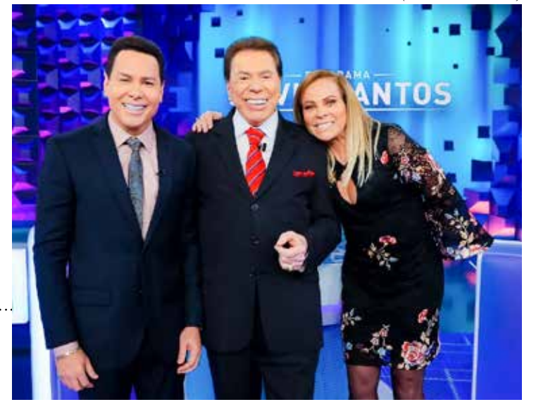
Silvio Santos, ao lado de Marcão do Povo e Christina Rocha, no programa do último domingo