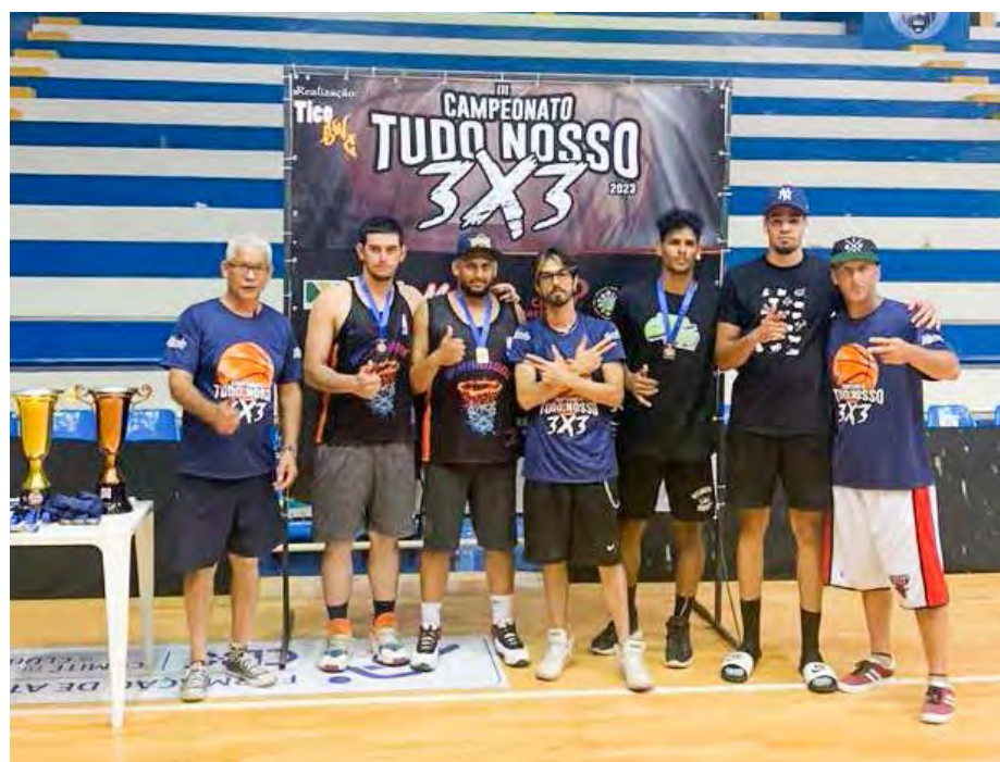
Aracity (Araraquara) - 4º lugar