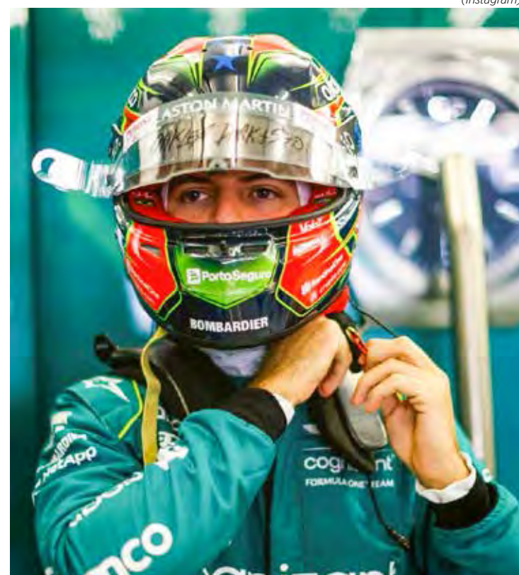
Drugovich satisfeito com resultado dos testes e possibilidade de estreiar na F1

tar “feliz demais pela confiança que a Aston Martin depositou em mim nestes testes e pela possibilidade de substituir o Lance no GP do próximo final de semana.”