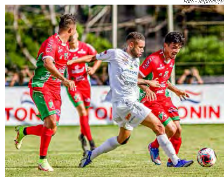
Rubro-Verde busca reabilitação na quarta-feira (1), no Benitão