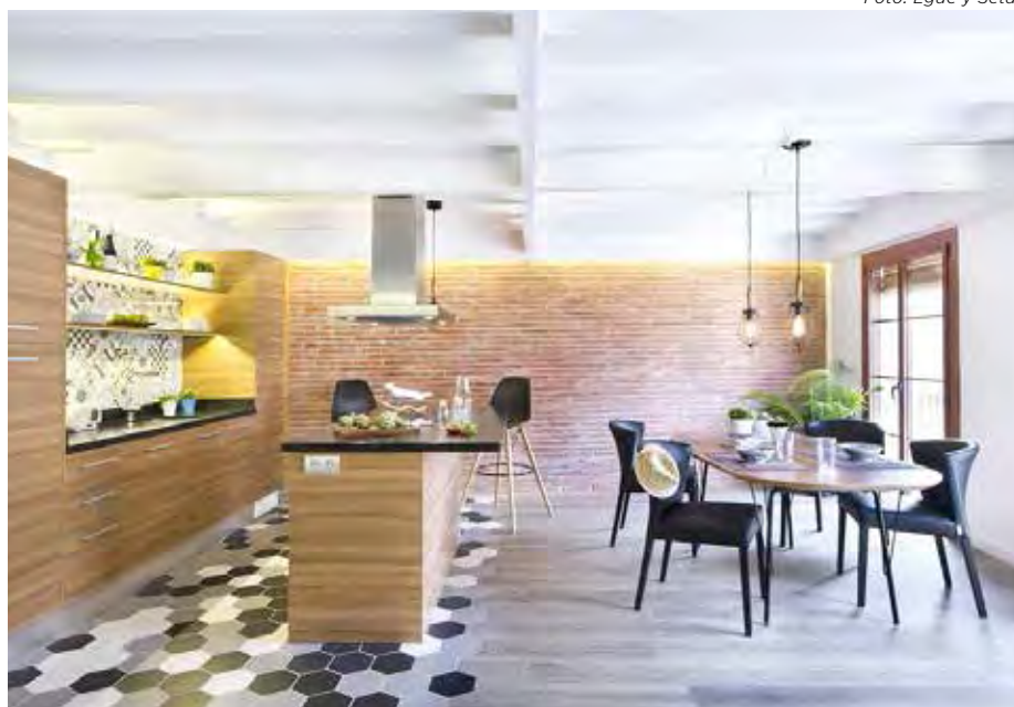
Cozinha integrada com sala de jantar

Combinar pisos diferentes é uma tática muito utilizada para compor cozinhas que se encontram integradas. Muitas vezes