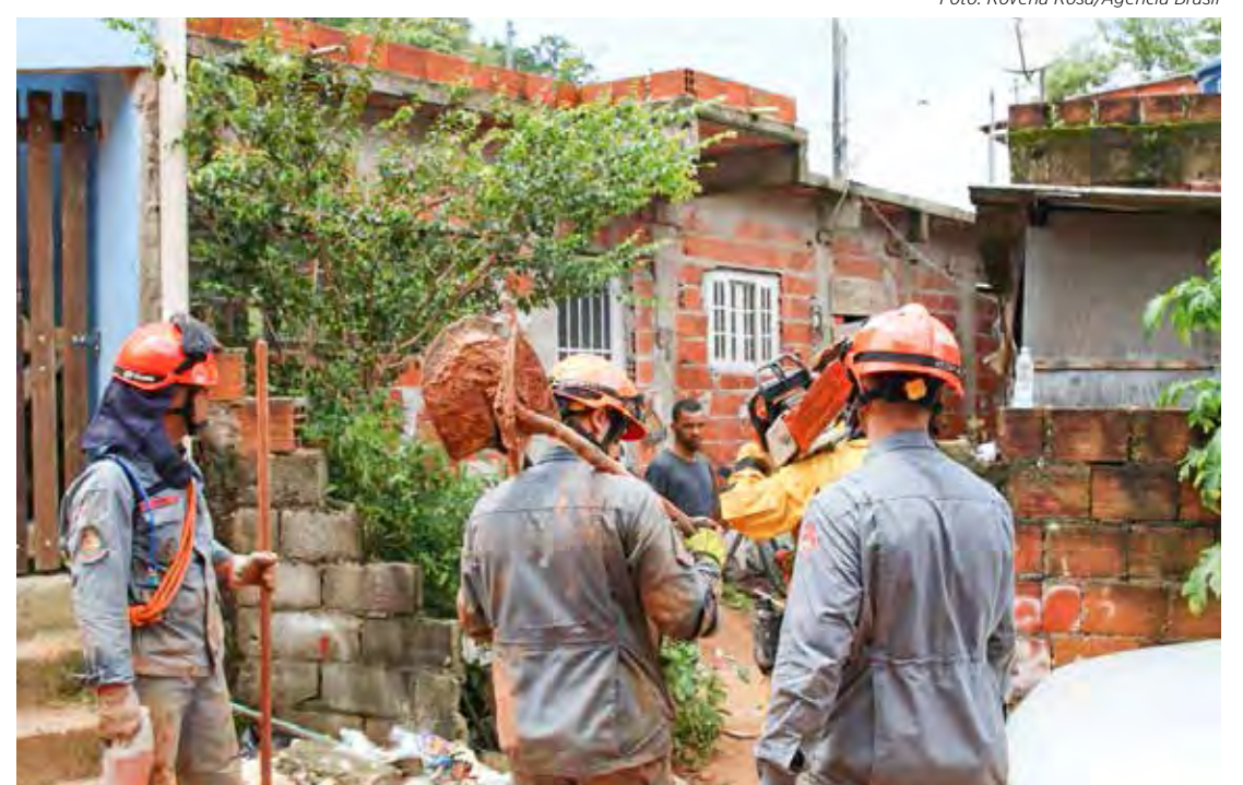
As enxurradas e deslizamentos de terra deixaram ainda 2.251 desalojados e 1.815 desabrigados na região

O vice-presidente também considerou a possibilidade de destinar parte dos 1,5 mil apartamentos de um conjunto habitacional do Minha Casa, Minha Vida em Bertiooga, município vizinho a São Sebastião, para atender os desabrigados.