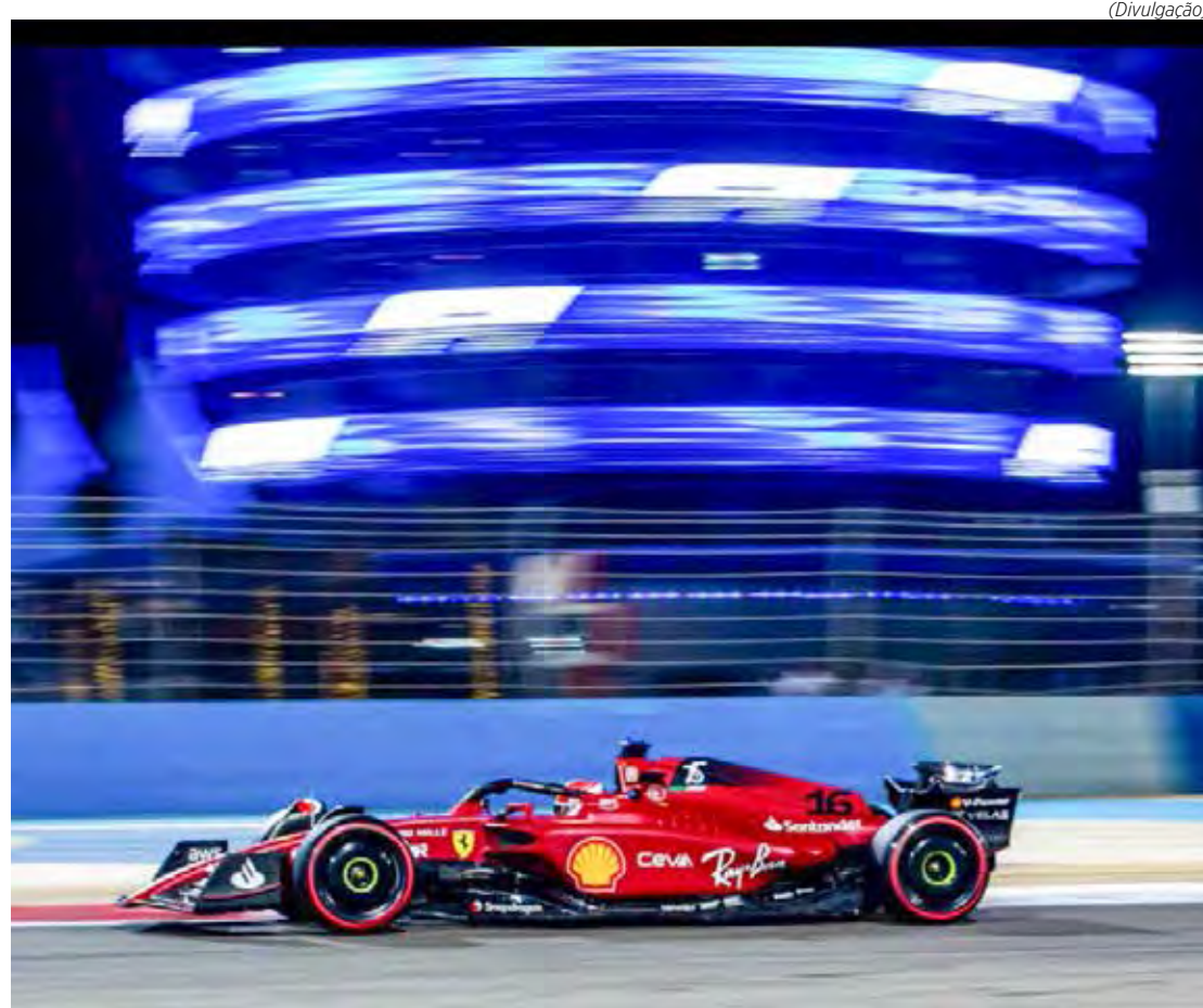
Fórmula 1 dá o pontapé inicial da temporada com o GP do Bahrein