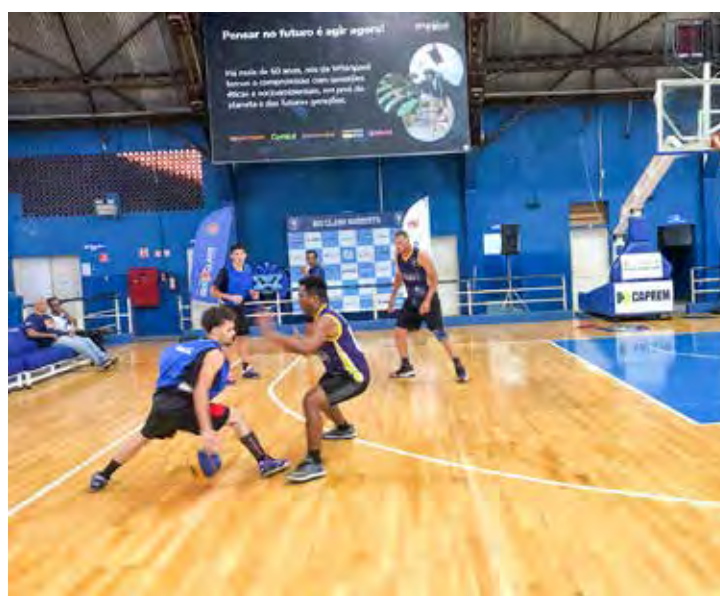
Campeonato de basquete 3x3 foi realizado no domingo (26) no Ginásio Felipe Karan

edição do ano passado, quando 30 equipes disputaram o campeonato.