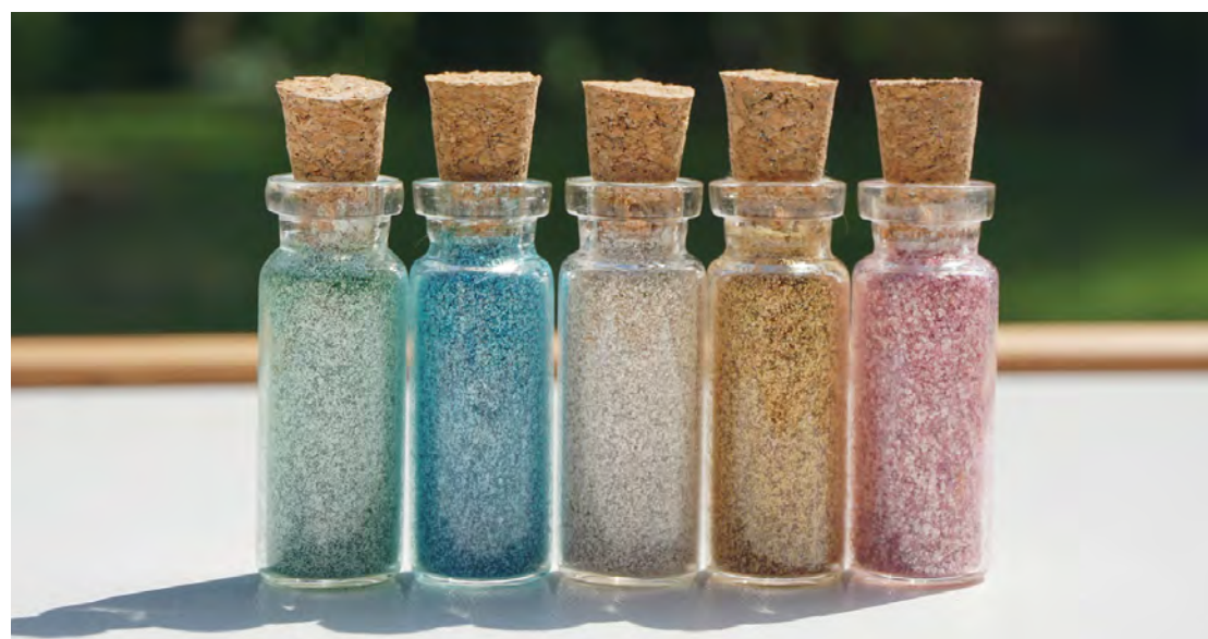
Glitter Biodegradável em substituição aos feitos por microplásticos.

Finalizando, observamos que pequenas mudanças podem gerar grandes impactos benéficos, pois medidas simples e educação básica, como jogue seu lixo na lixeira, farão a festa mais bonita do Brasil, muito mais amigável ao meio ambiente e igualmente divertida.