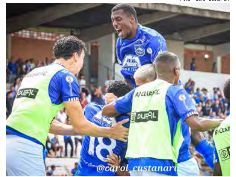
Apesar dos problemas, Azulão confia na vitória contra o Nhô Quim

Vale destacar que tem direito a meia entrada idosos e estudantes com apresentação de documento comprobatório. Torcedores com a camisa oficial do Rio Claro também tem direito a meia entrada. E crianças com até 12 anos de idade, acompanhadas dos pais ou responsáveis tem entrada livre. Para adquirir os ingressos há também a opção de fazê-lo pelo site www.totalticket.com.br. Outra informação importante é que os torcedores do Rio Claro FC irão ocupar somente a arquibancada coberta e os torcedores visitantes a arquibancada descoberta.