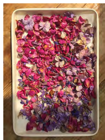
Pétalas de flores secas são opções alternativas de substituição aos confetes nas festas carnavalescas.

Os confetes e serpentina devem ser evitados se você vai curtir a festa na rua, pois esses enfeites se misturam a galhos, folhas e outros resíduos das ruas, gerando enchentes, podendo entupir bueiros, dificultando o escoamento das águas pluviais.