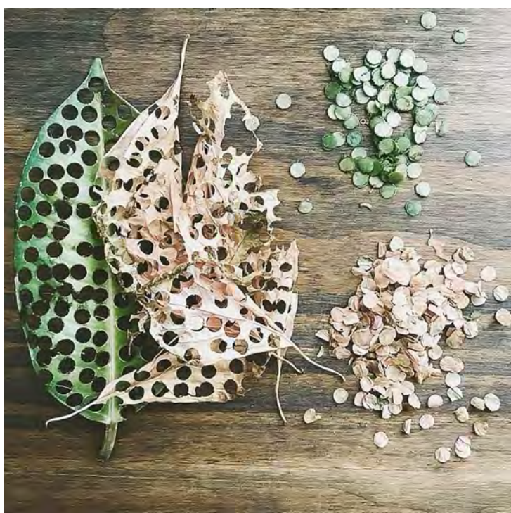
Folhas recém caídas, podem se transformar em confetes sustentáveis.

No Carnaval as pessoas pensam apenas em aproveitar a temporada da folia da melhor forma possível, vale ressaltar que o respeito ao meio ambiente e aos espaços públicos, e práticas sustentáveis para curtir essa festa são muito importantes e devem ser adotadas.