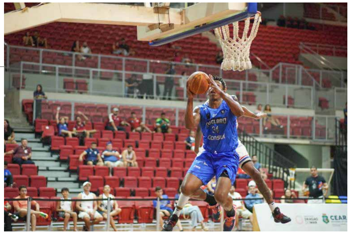
NBB15 - Rio Claro Basquete vence Fortaleza, fora de casa

Em seu próximo compromisso pelo NBB15, o Leão vai enfrentar o Pinheiros-SP, dia 3/3, no ginásio Felipe Karam, às 20 horas.