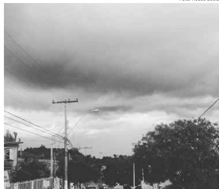
A região onde pode ocorrer o maior volume de chuvas é no Litoral Norte, com possibilidade de até 250 milímetros

Em São José dos Campos, Barretos e Franca, o total de chuvas pode alcançar até 100 milímetros. Já na Capital e Região Metropolitana, Campinas, Sorocaba, Ribeirão Preto e Ara-