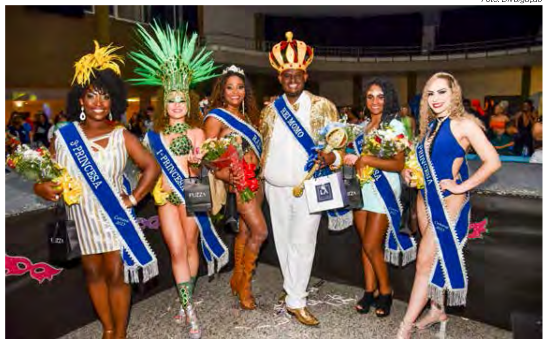
Rei, rainha e princesas do carnaval de Rio Claro abrem os desfiles deste sábado

O desfile das escolas de samba e blocos terá um amplo esquema de segurança. Todos que forem participar do evento passarão por revista pela equipe de segurança.