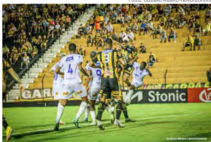
Rio Claro FC não resiste ao Tigre e volta com derrota de Novo Horizonte