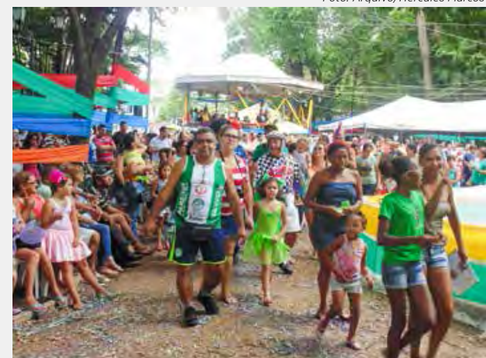
Público poderá curtir gratuitamente música ao vivo com as mais consagradas marchinhas de carnaval