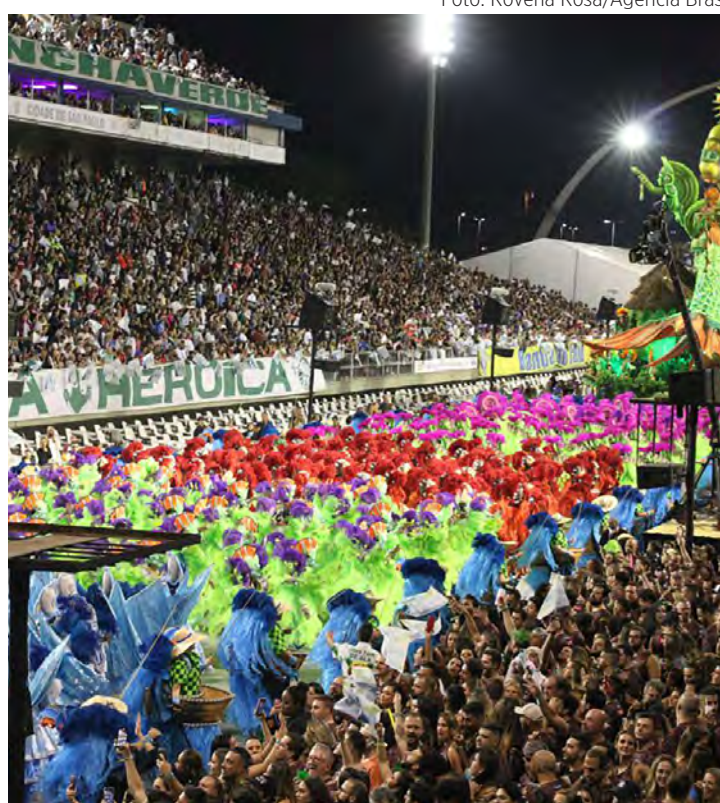
Desfile das escolas de samba do grupo especial de São Paulo começa hoje.

Os desfiles do grupo especial do carnaval de 2023 do Rio de Janeiro serão realizados no domingo (19) e segunda-feira (20). O primeiro dia será aberto pela Império Serrano às 22 horas, que volta ao grupo especial após três anos de ausência. Em seguida, desfilam Acadêmicos do Grande Rio (entre 23h e 23h10), campeã do grupo especial de 2022, Mocidade (0h e 00h20), Unidos da Tijuca (1h e 1h30), Salgueiro (2h e 2h40) e Mangueira (3h e