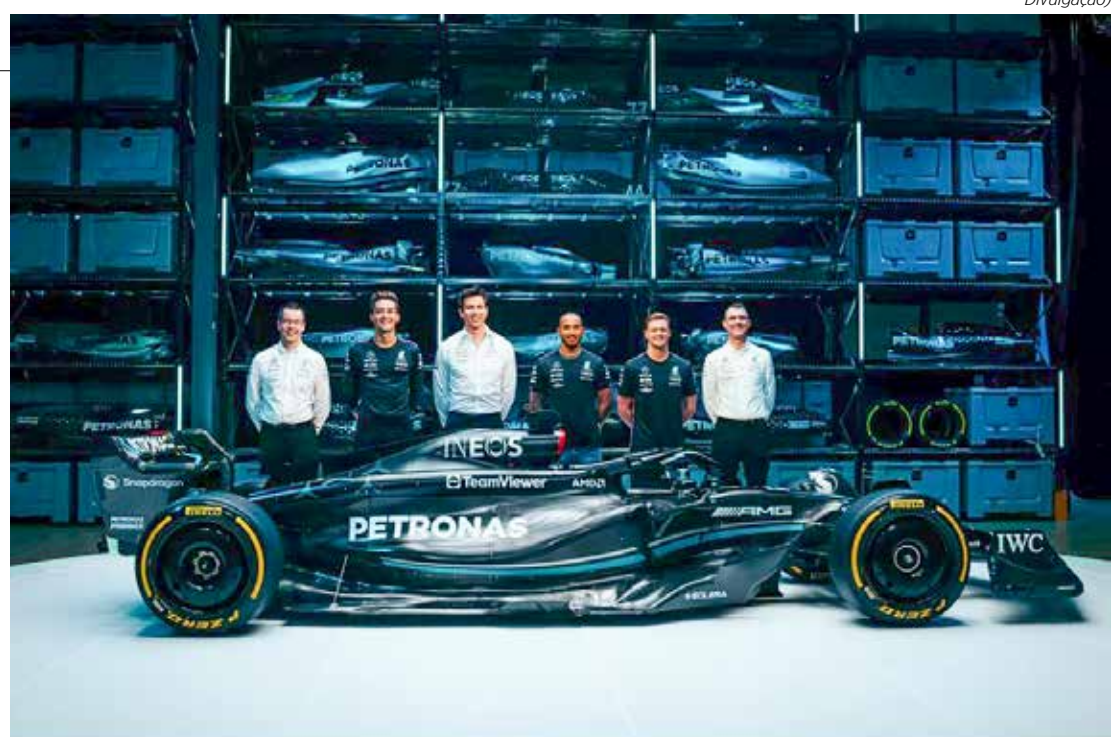
W14 mantém pintura preta como estratégia para ganhar mais leveza

Isso porque, em vez de o carro ser totalmente pintado de preto, grande parte dele não é pintada e funciona como fibra de carbono bruta.