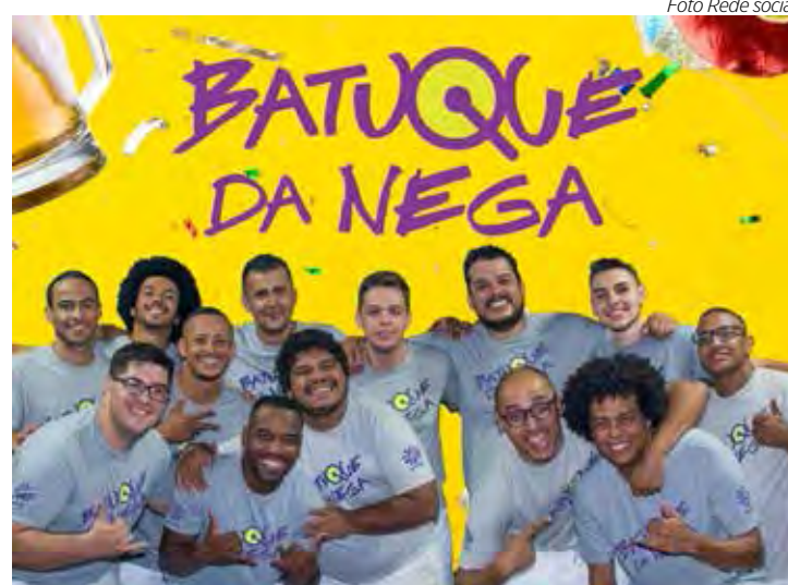
Batuque da Nega, na Jardim Publico com o Bloco do Coreto e no Paradise Beach Sports