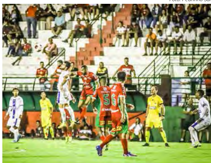
Sem dar espaço, a marcação eficiente do Velo, na vitória contra o Taubaté