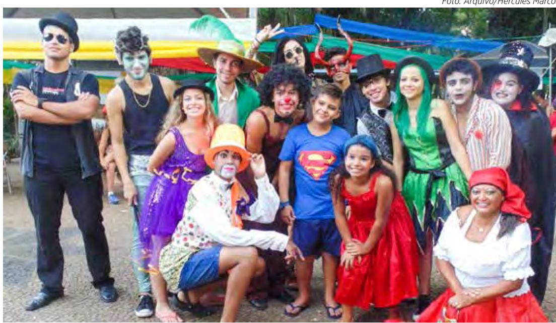
Bloco do Coreto sempre reúne grande público em seus eventos de carnaval

Já no Jardim Público, às 21 horas, os foliões vão poder dançar e cantar ao som do grupo Batuque da Nega. O grupo teve início em 2011, unindo os elementos de escola de samba para levar