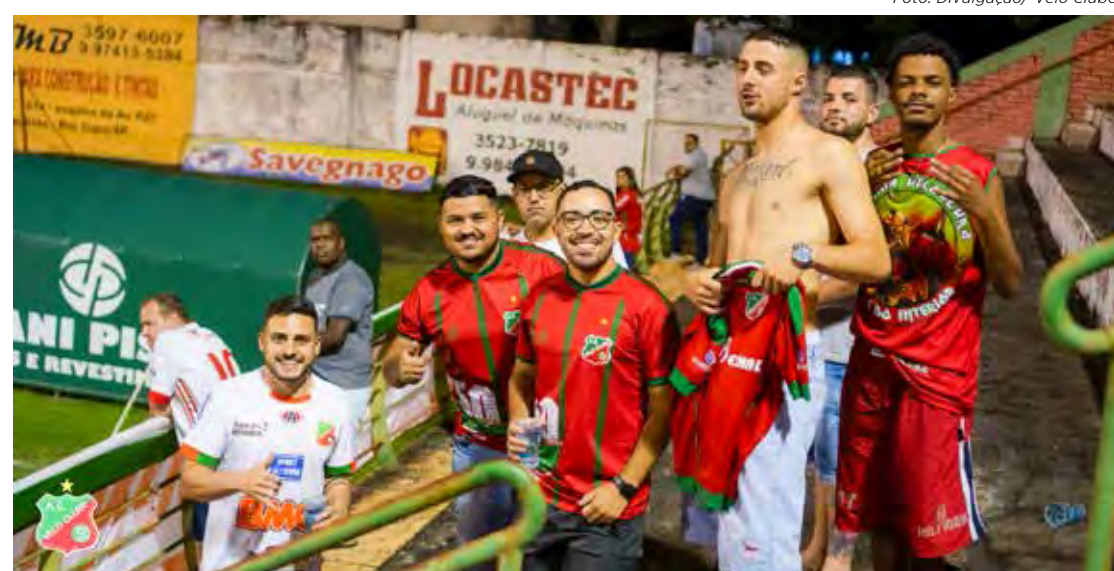
Torcedores vibram com a vitória do Velão