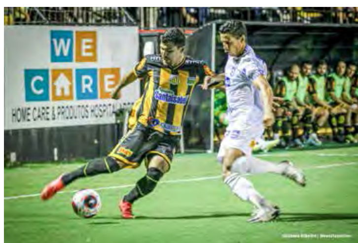
Azulão tentará a reabilitação no sábado (18) contra o XV, no Schmidtão

Desatenção da zaga rioclarista e novamente Ronaldo bate cruzado e forte para vencer o goleiro do