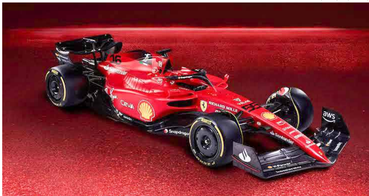
Novo carro da Ferrari para a temporada 2023