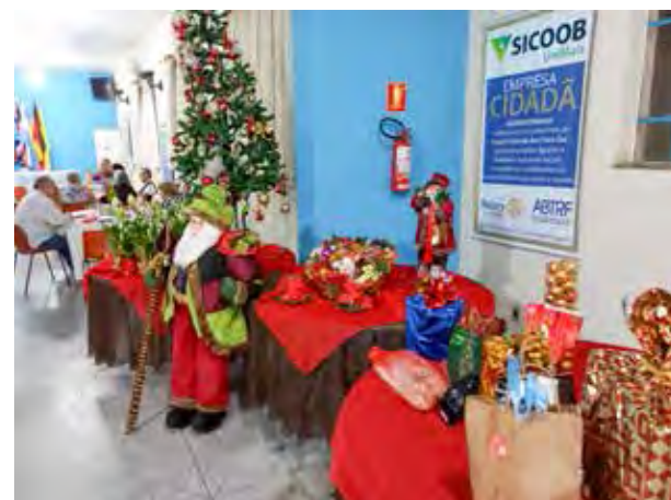
Uma alegre decoração trazendo o clima natalino à noite