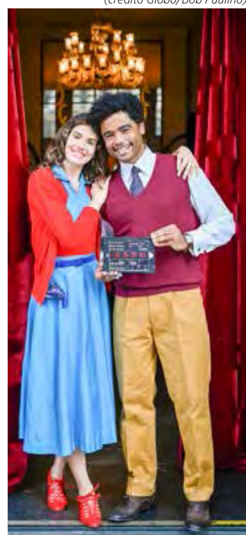
Camila Queiroz e Diogo Almeida estão em "Amor Perfeito"

novo longa estrelado por Larissa Manoela, "Tá Escrito", consolidou-se como produtora independente em 2015, após o lançamento de "Carrossel - O Filme". Desde então, seus filmes foram vistos por mais de 20 milhões de pessoas nos cinemas. Atualmente, a Paris desenvolve quatro séries para diferentes plataformas de streaming e ainda filma mais três longas-metragens até o fim de 2023.