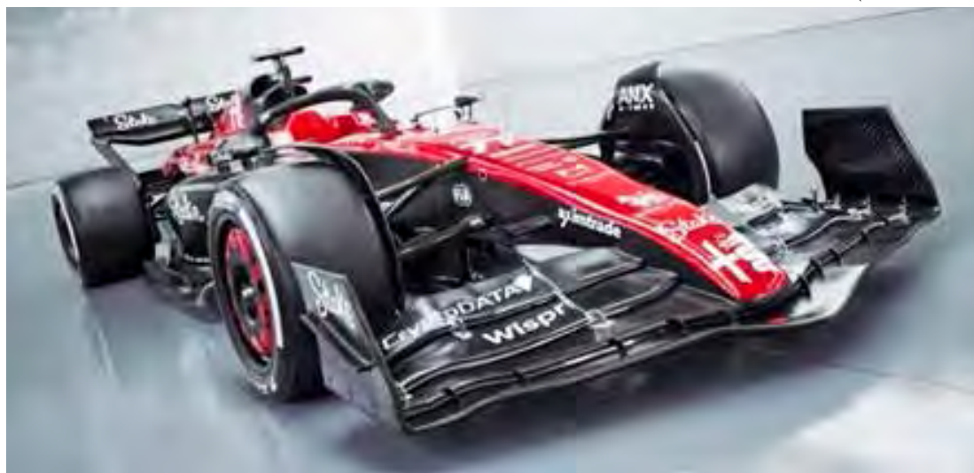
Visão do C43 que está sendo leiloado