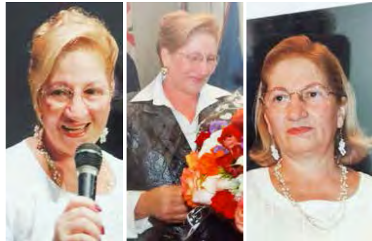
Cabeleireira nasceu em São Carlos e veio para Rio Claro onde está até hoje e construiu carreira