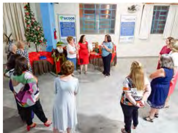
Uma festiva de natal coroada com amigo secreto