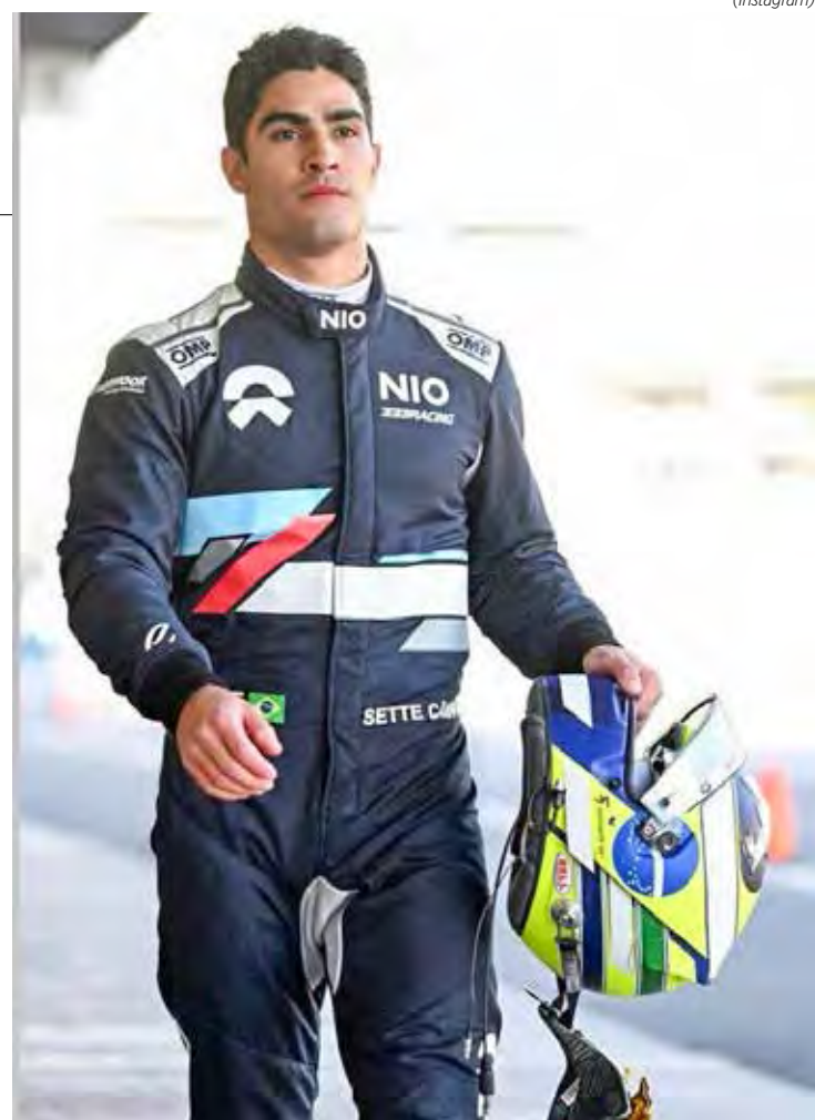
Sette Câmara ficou no Top 10 da corrida indiana, que marcou a quarta da temporada 2023 da Fórmula E