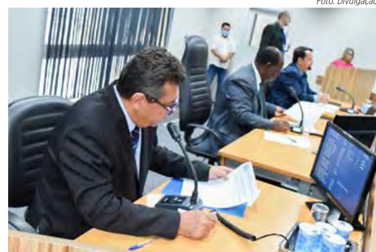
Com o fim do recesso parlamentar, sessões ordinárias foram retomadas na última segunda-feira (6) pela Câmara

As comissões permanentes são responsáveis pela análise de