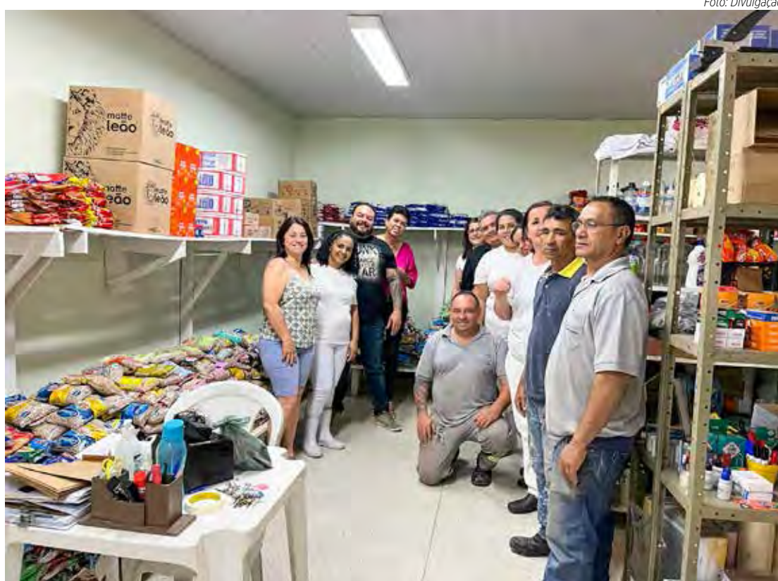
Alimentos arrecadados em uma das campanhas realizadas pela Casa Bezerra de Menezes

As doações podem ser entregues nos pontos de coleta instalados nos supermercados participantes da campanha, das 9 às 16 horas. As pessoas também podem levar os doativos à sede da