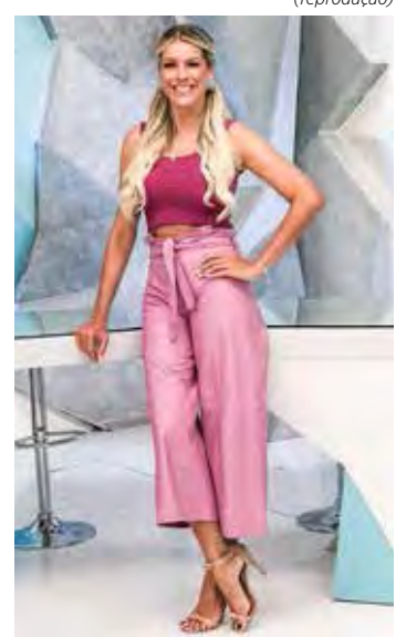
“Jogo Aberto”, esportivo das manhãs da Band

O fortalecimento da TV como um todo também passa por Band e Rede TV! mais atuantes e em busca de objetivos maiores. Mas, por razões que são bem diferentes, uma porque insiste em bater cabeça e a outra sem querer nada com nada, a perspectiva de mudança é nenhuma, pelo menos em curto ou médio prazos.