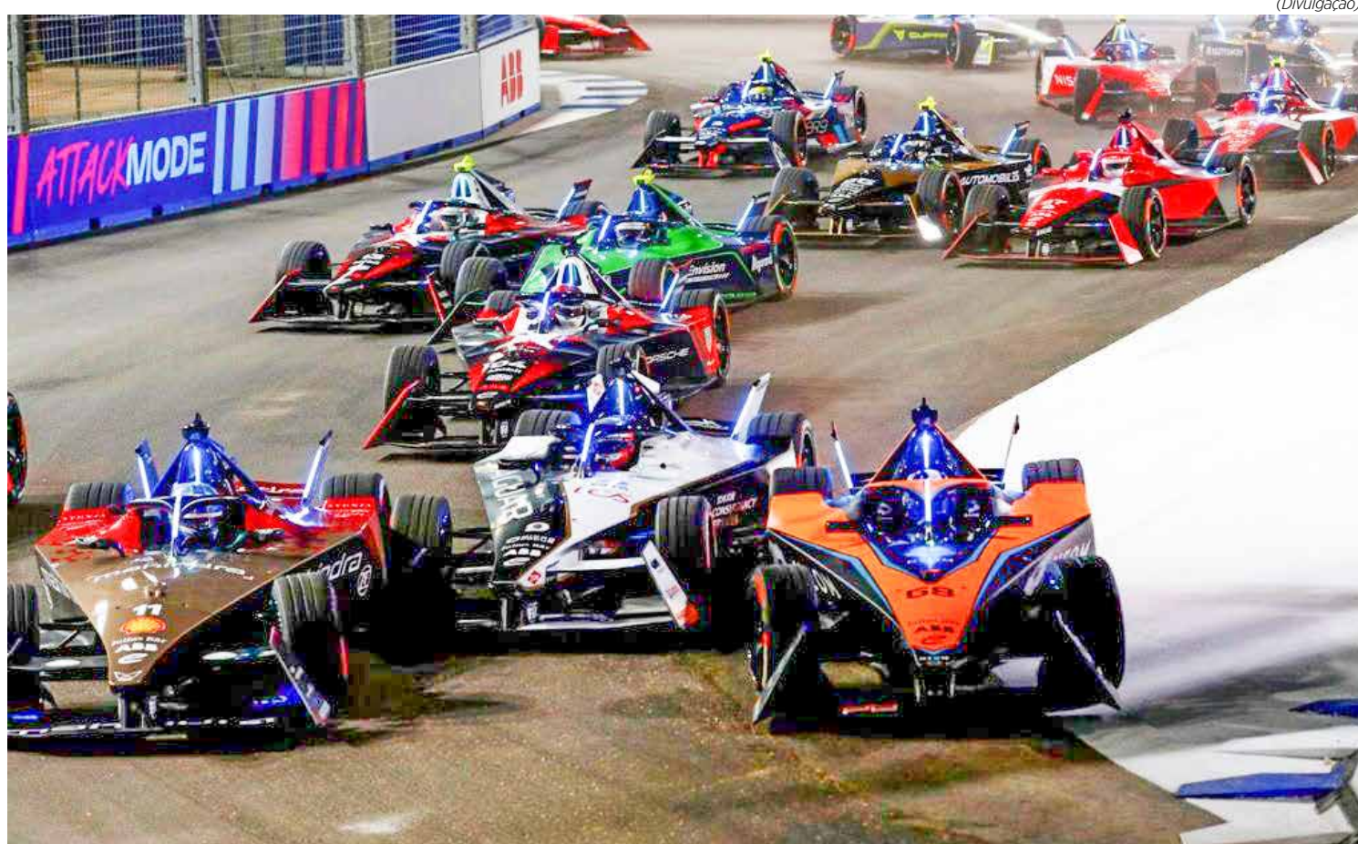
Terceiro fim de semana do campeonato segue na Ásia com a estreia de etapa na Índia

Em 2023, a McLaren completa exatos 60 anos em atividade na F1. Daí o nome escolhido: MCL60. Agora é aguardar o lançamento.