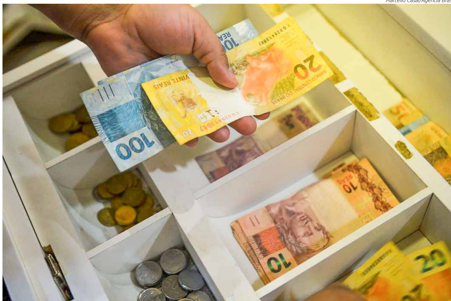
Taxa de juros do consignado do Bolsa Família não poderá passar de 2,5%

A parcela de famílias com dívidas - em atraso ou