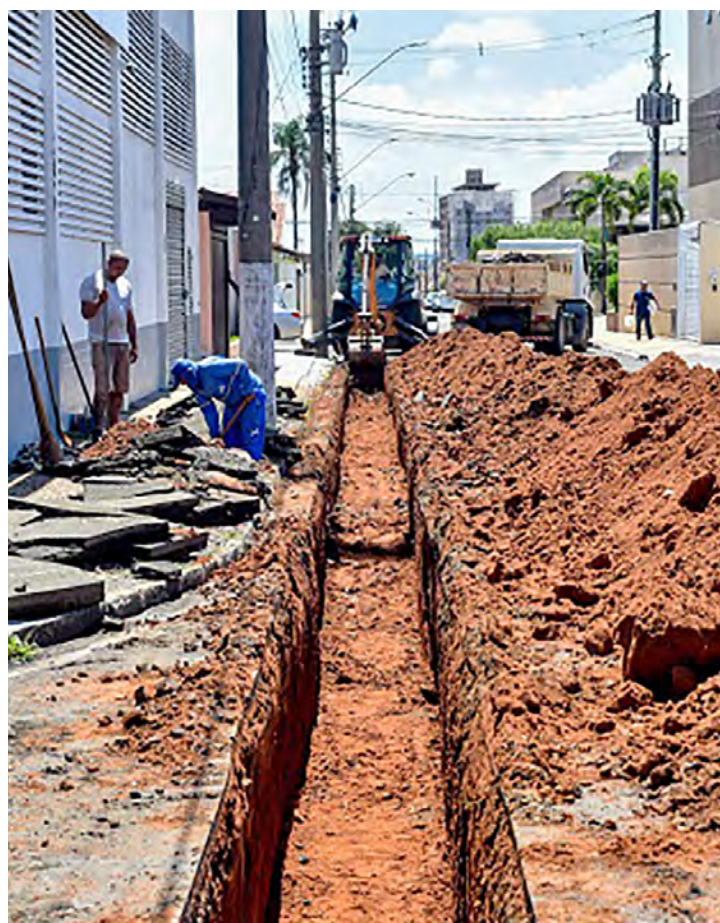
Todo o trecho será renovado com a substituição da rede antiga por nova.

Também foi feito o fechamento da vala e a compactação do solo no local. A rede de abastecimento foi religada para que o local não ficasse sem água. A obra está sendo feita por etapas e o serviço será concluído nos próximos dias. Por isso, o Daae solicita que motoristas não estacionem veículos nesse trecho para possibilitar a execução do serviço.