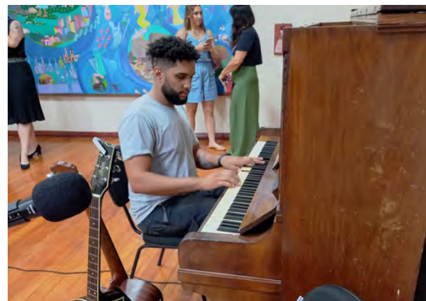
Música também fez parte da noite