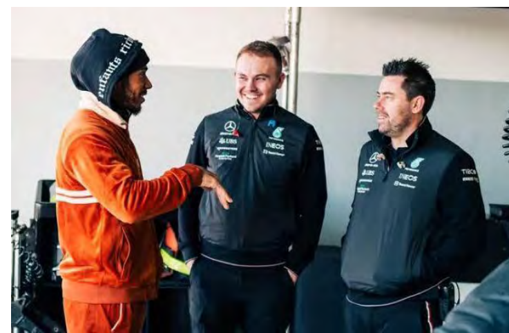
Hamilton e Russell na pista para teste de pneus em Paul Ricard

A Mercedes também confirmou que a apresentação do W14 acontecerá em 15 de fevereiro, com algumas insinuações de que o carro de 2023 pode voltar à cor preta que esteve nos modelos da Mercedes em 2020 e 2021.