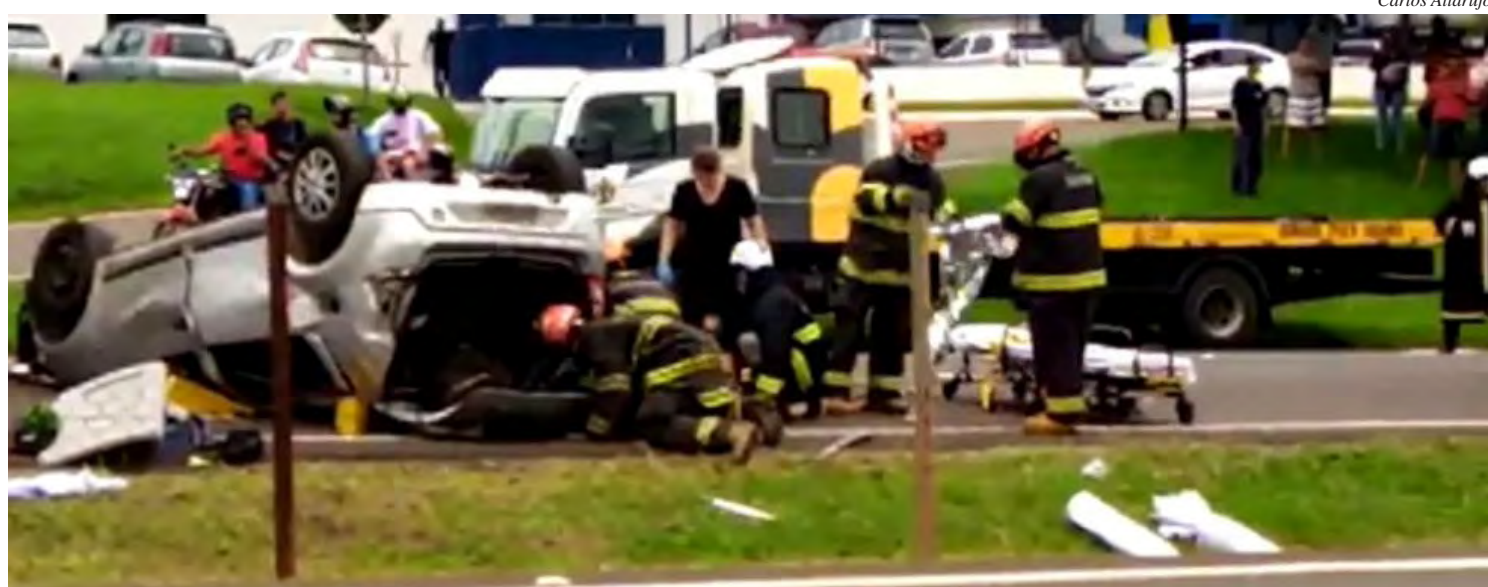
Caso foi rapidamente atendido e não houve reflexo no trânsito

Imagens feitas no local do acidente mostram que o veículo ficou tombado no local. Segundo a corporação, a vítima morreu no local. O veículo e o motorista foram removidos para o acostamento da pista norte, onde equipes aguardavam os trabalhos periciais. Também conforme a PMR, não houve reflexo no trânsito.