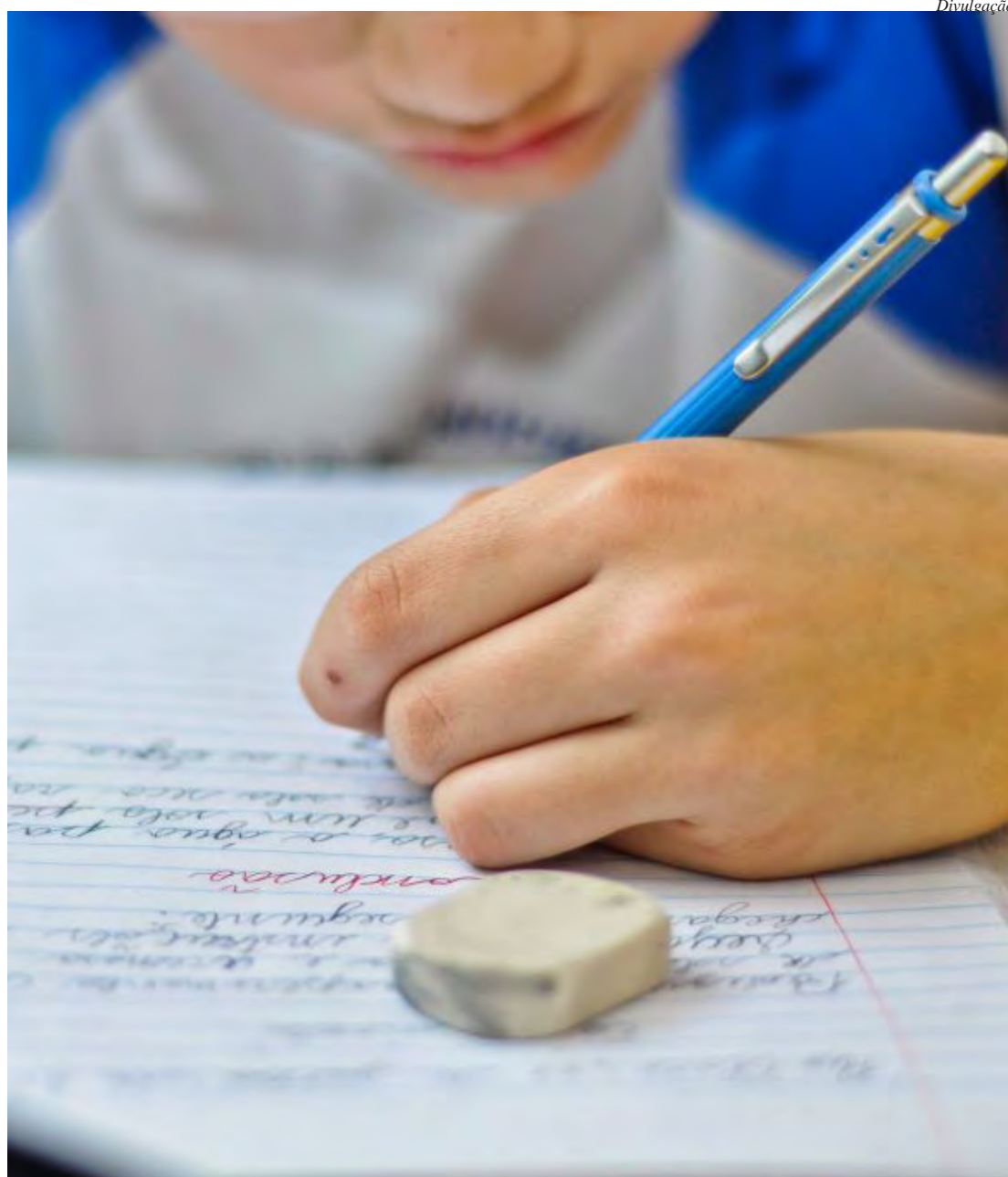
Alunos retomam as atividades escolares depois de quase dois meses de férias

De acordo com a Secretaria Municipal da Educação, o primeiro semestre de aulas termina no dia 6 de julho. De 7 a 21 de julho haverá recesso para os estudantes, sendo que para os alunos das escolas de educação integral o recesso ocorrerá entre 17 e 21 de julho. O segundo semestre letivo começa no dia 24 de julho e termina em 20 de dezembro, completando os 200 dias de aula obrigatórios.