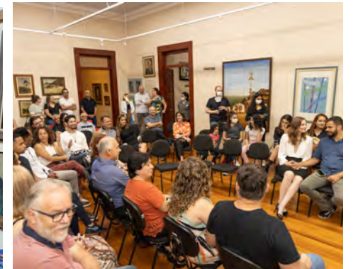
Casarão da Cultura ficou lotado