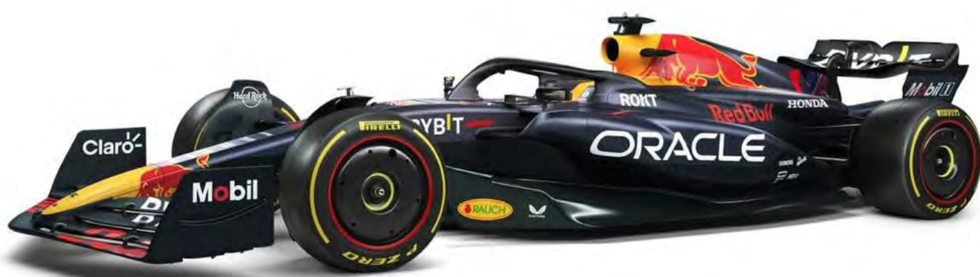
Red Bull lança RB19 com cores tradicionais e confirma parceria com Ford para F1 2026

formada pelo atual bicampeão do mundo, Max Verstappen, e o mexicano Sergio Pérez. Será o terceiro ano dos dois juntos. Os reservas serão Daniel Ricciardo, que retorna ao time após cinco anos, e os jovens Liam Lawson e Zane Maloney.