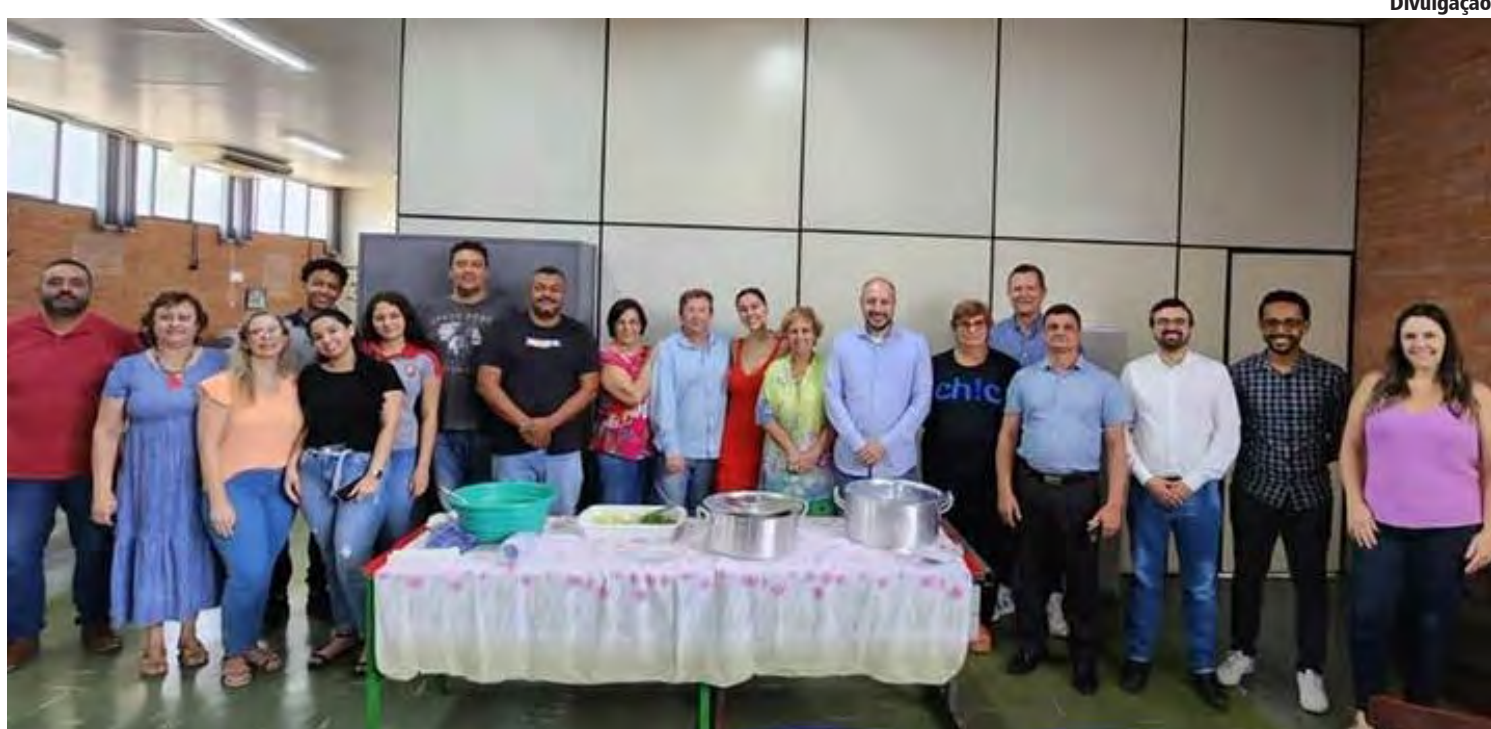
Almoço com participação de todos os servidores da Mobilidade Urbana, efetivos e comissionados, guarda mirim e capacitação

Uma das solicitações dos servidores é a reforma do prédio da secretaria com a construção de salas individualizadas para serviços que demandam privacidade, ou até mesmo para atendimentos à população. Hoje tudo é feito em espaço conjunto, o que pode causar constrangimentos. Outro ponto é a construção de um local próprio para as refeições que atualmente são realizadas em espaço localizado em frente aos banheiros. Também há pedido para uma sala de reunião. O prefeito Gustavo autorizou a reforma que deverá ser realizada em breve.