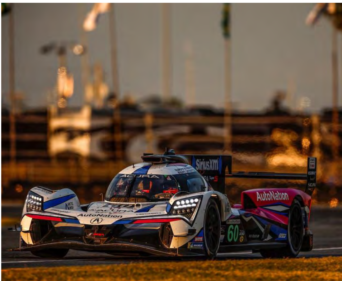
Meyer Shank larga na frente nas 24 Horas de Daytona.

O melhor Cadillac é o #01, da Ganassi, que Sébastien Bourdais colocou na quarta posição. Divide a segunda