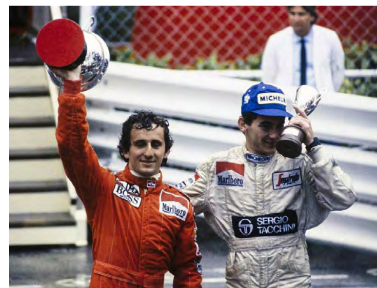
Ayrton Senna e Alain Prost protagonizaram a rivalidade mais séria da história da Fórmula 1

"Senti que ele não estava bem. Ele me ligou com frequência. Às vezes, duas vezes por semana", disse o francês de 67 anos. "Ele nunca me ligou enquanto eu estava competindo. Perdeu a motivação sem mim. Eu provavelmente era o seu ímpeto. Isso é difícil de entender. Nós dois passamos por uma história incrível no sentido humano e psicológico. Você tem que preservar as belas memórias", concluiu o tetracampeão mundial.