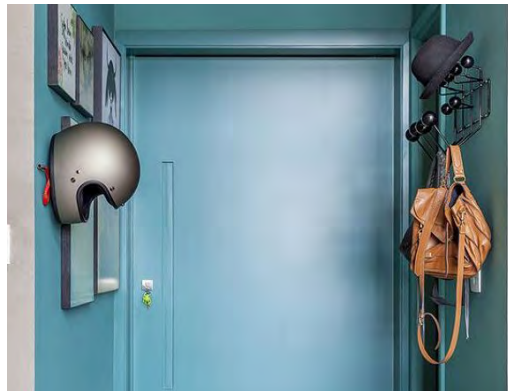
Ganchos: Os ganchos ocupam pouco espaço e resolvem muitos problemas