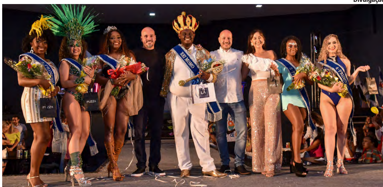
Escolha dos membros da corte momesca foi realizada sábado no Grupo Ginástico