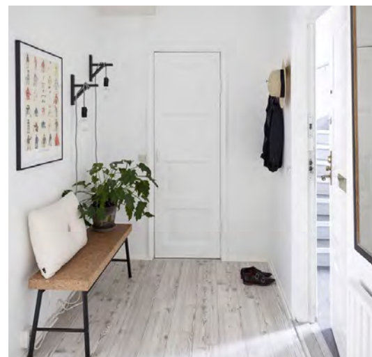
Bancos: Os bancos são uma forma prática para apoiar qualquer coisa