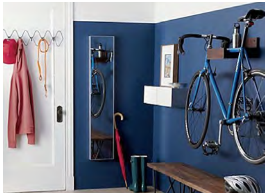
Suporte de bicicleta: O ideal é deixar a bicicleta em um local de fácil acesso