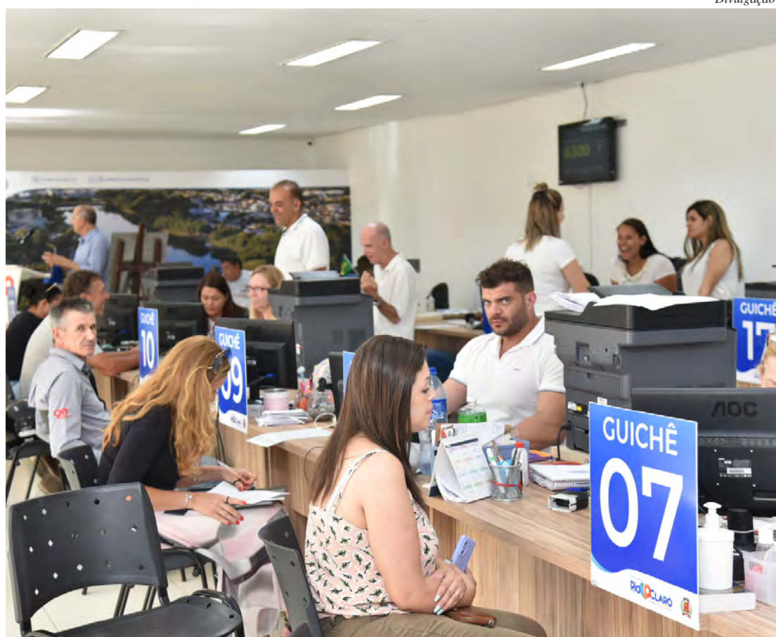
O Atende Fácil atende de segunda a sexta-feira, das 8 às 16 horas, na Avenida 2, 130, Centro

Vale lembrar que a prefeitura realiza neste ano nova edição do PID (Programa de Pagamento Incentivado de Dívida) com descontos de até 95% nos débitos atrasados, contraídos até 31 de dezembro de 2022, inscritos ou não em Dívida Ativa. O PID foi aprovado no final do ano passado pela Câ-