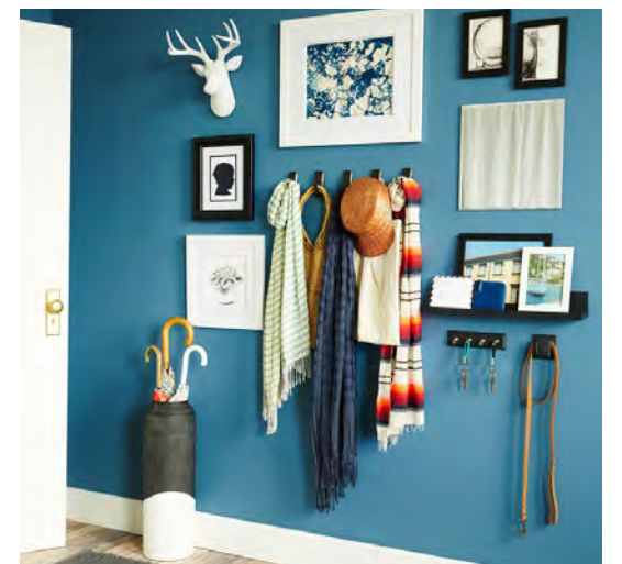
Porta-chaves: O porta-chaves é boa opção para colocar sobre o quadro elétrico