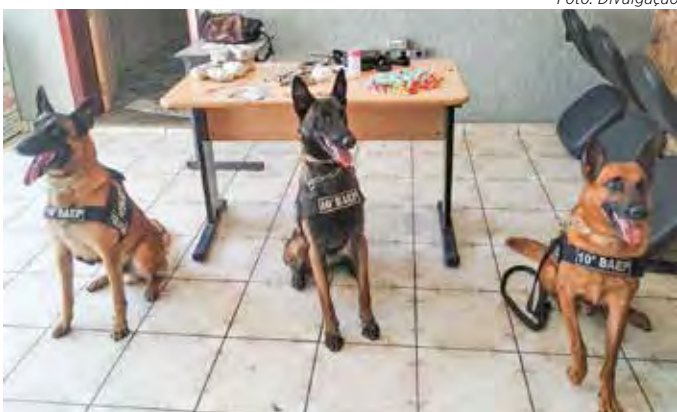
Cães farejadores treinados para localizar as drogas auxiliaram os policiais na apreensão