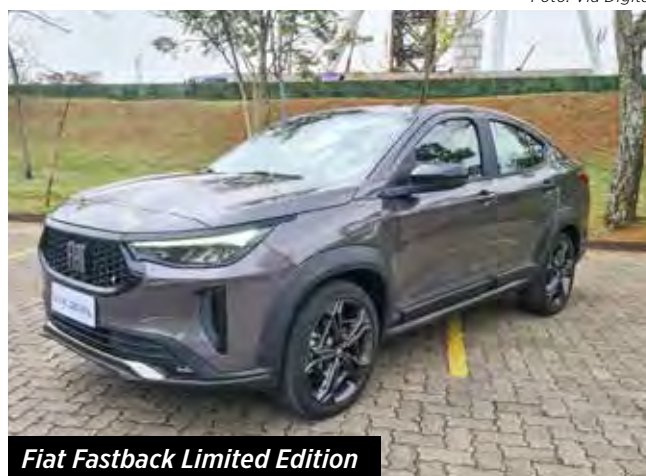
Fiat Fastback Limited Edition

Os valores podem variar conforme o ICMS de cada estado.