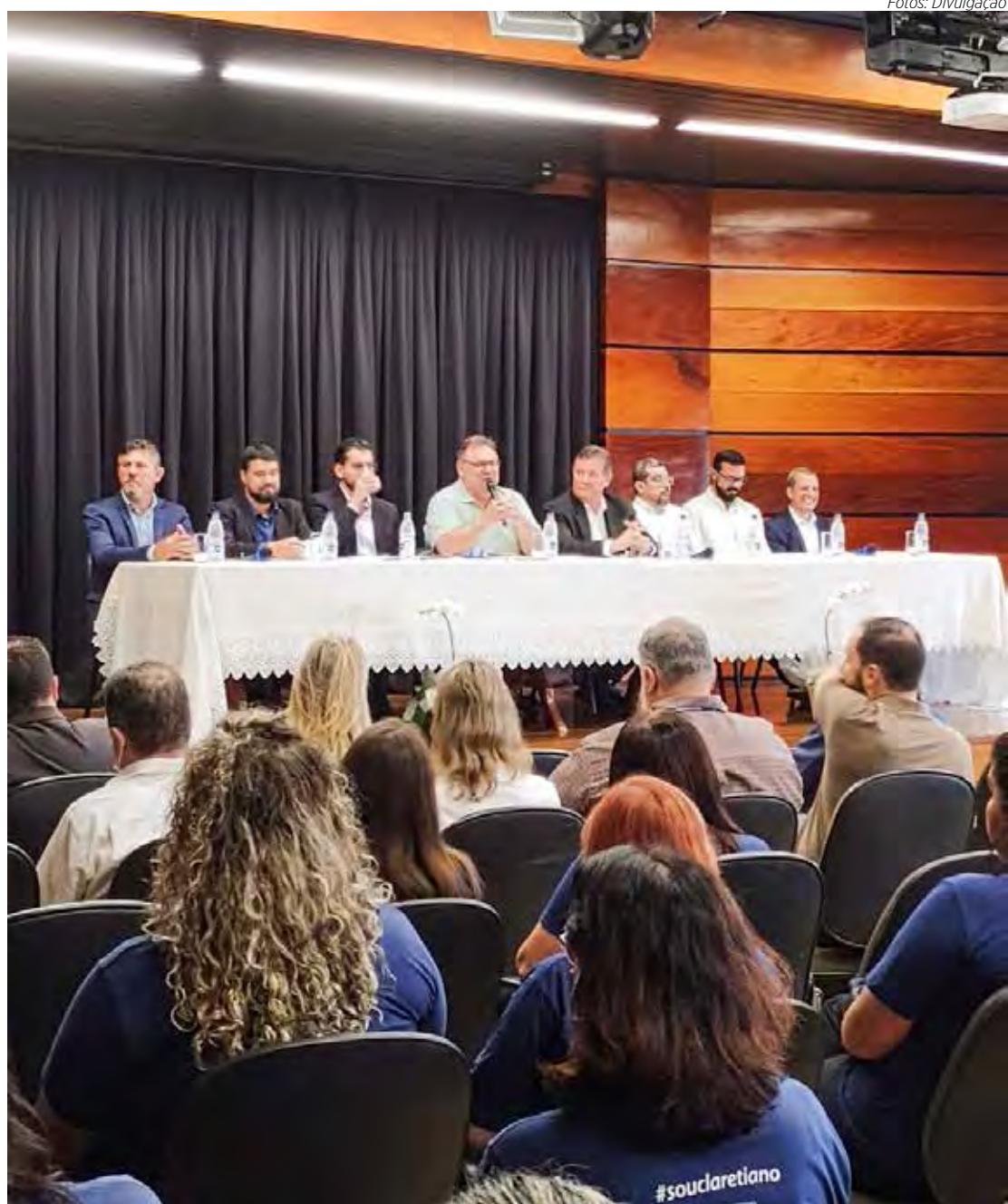
Cerimônia de posse da nova reitoria contou com a presença de autoridades e sociedade