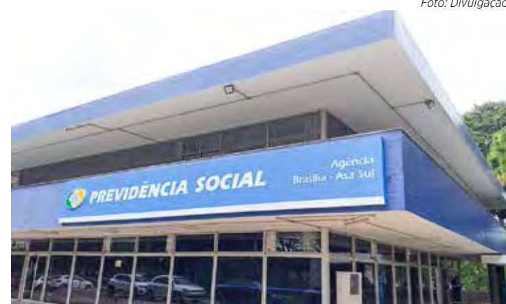
Sede do INSS em Brasília – a cada ano, as aposentadorias mudam conforme regras da Reforma da Previdência

Quem alcançou as condições para se aposentar por alguma regra de transição em 2022, mas