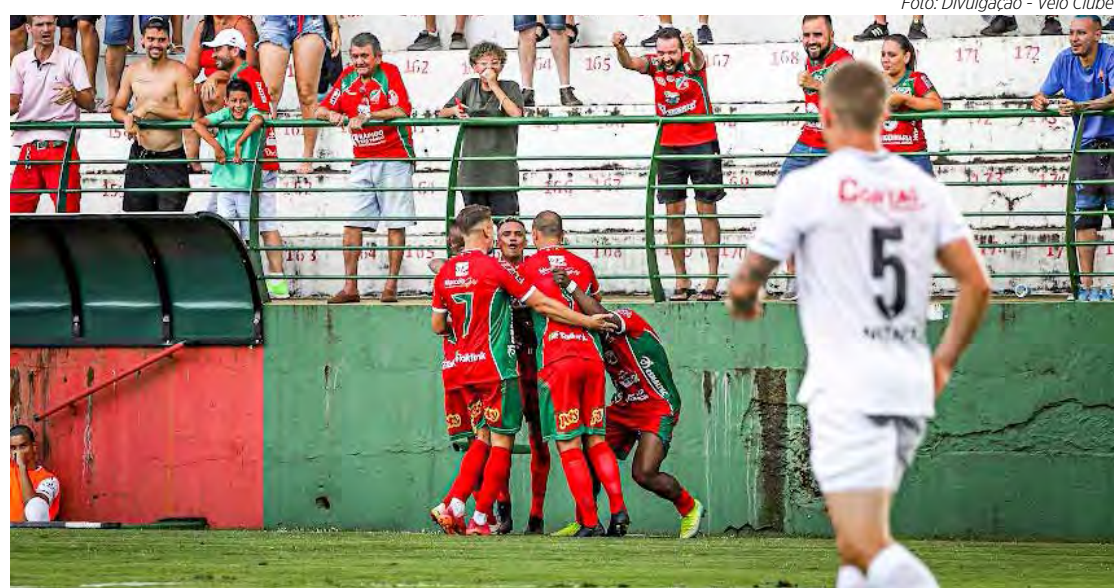
Velo enfrenta Lemense, fora de casa