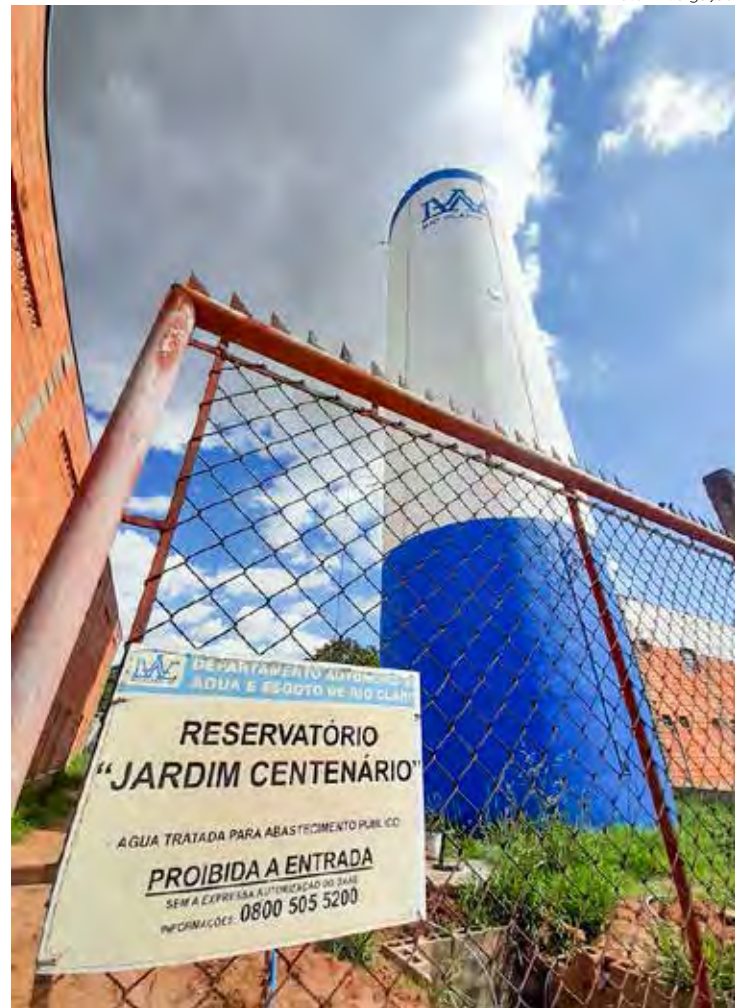
Reservatório no Jd. Centenário recebe melhorias para acabar com vazamentos na estrutura