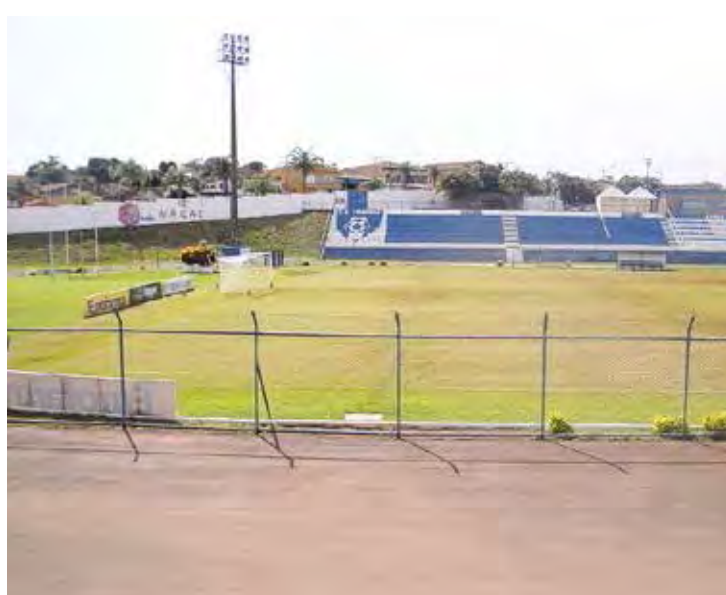
Estádio Bruno Lazarini, em Leme, foi interditado pela FPF

Para que o Estádio possa ser LIBERADO PARA JOGOS, faz-se necessário que o Clube envie os documentos em questão, e após análise do Departamento de Infraestrutura de Estádios, estando a documentação dentro do Padrão da Portaria nº 290 de 27/10/2015 e com as informações necessárias, o Estádio