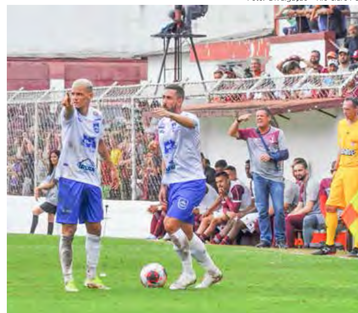
Rio Claro FC recebe Portuguesa Santista no Schmidtão

Vale destacar que, para ter direito a meia entrada, o torcedor estudante deve apresentar a carteirinha. Idosos e, crianças até 12 anos, acompanhadas dos pais ou responsáveis tem entrada livre.