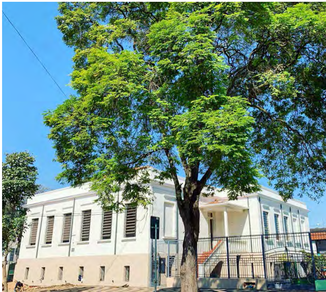
Prédio onde serão ministradas as aulas dos cursos oferecidos pela prefeitura/Fainsp.

Os cursos são oferecidos pela prefeitura em parceria com a Faculdade do Interior de São Paulo (Fainsp), vinculado ao Centro Universitário Celso Lisboa do Rio de Janeiro. As inscrições devem ser feitas até o próximo dia 27 na Secretaria Municipal de Educação que fica na Rua Toledo de Barros, 115, no Centro. O atendimento ao