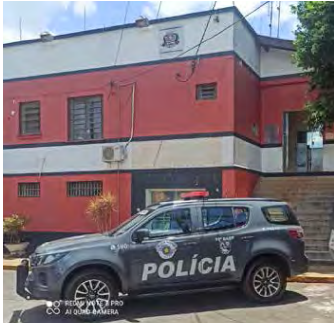
O condenado foi levado à Delegacia de Pirassununga