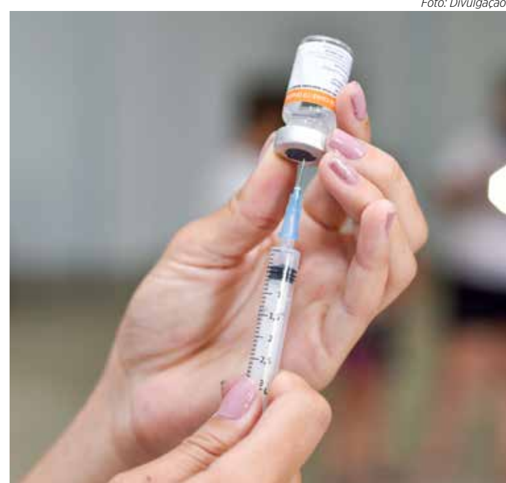
A vacina contra Covid está disponível nas unidades de saúde

O agendamento será respondido informando local e horário para a vacinação. Ao comparecer para a vacinação, é preciso que o responsável apresente documento pessoal da criança e carteirinha de vacinação de rotina. A Vigilância Epidemiológica realiza o agendamento conforme as doses são disponibilizadas ao município.