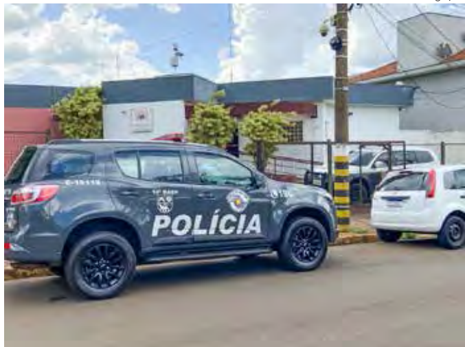
Na Delegacia de Cordeirópolis, os detidos confessaram furtos