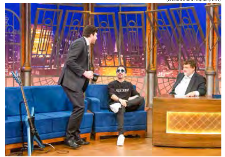
Imagem "The Noite"

tes, meio que por encanto, foram desaparecendo, supostamente porque "não rendiam mais". Hoje, se tanto, restaram o "The Noite", do Danilo Gentili no SBT, e "Conversa com Bial", este agora economicamente transformado em formato on-line, o que também não muda nada ou compromete seu conteúdo. O conteúdo é que conta. Eles e os muitos podcasts que vieram a existir, conservam a mesma essência dos "programas sofá" e a grande maioria com rendimentos e repercussão dos mais interessantes. Se teve quem deixou esse formato de lado e hoje há os que se aproveitem muito bem dele, será que a questão não é saber fazer?