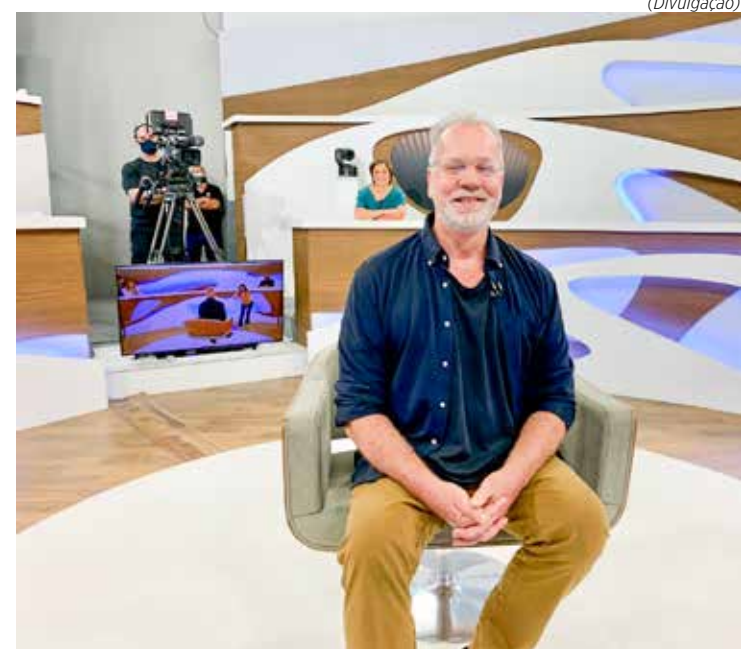
Luiz Fernando Guimarães

O "Roda Viva" da TV Cultura, segunda-feira que vem, terá uma edição inédita com Luiz Fernando Guimarães. Um de nossos principais atores, com dezenas de trabalhos na televisão e no cinema, Guimarães fala da sua recente autobiografia e da luta contra o álcool, entre outros temas.