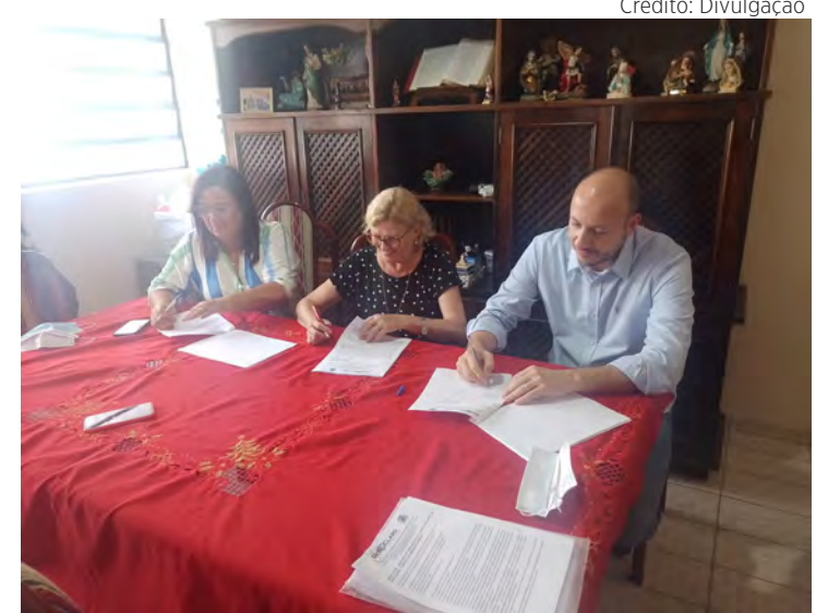
As parcerias firmadas com o município foram celebradas a partir de chamamento público.