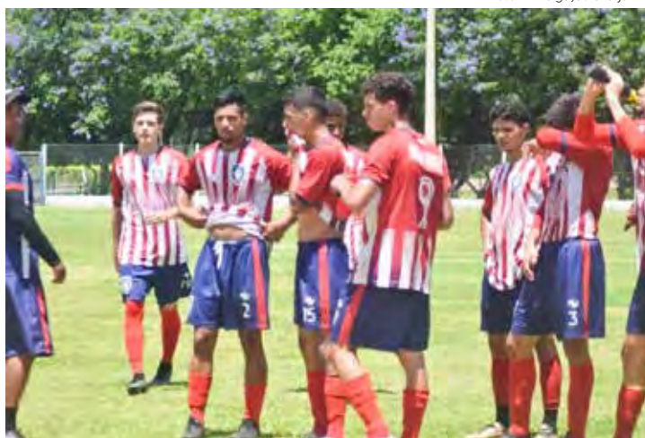
Time do Sharjah FC, adversário do Rio Claro FC na primeira rodada da Copa São Paulo 2023

dor o empresário José Ermírio de Moraes que, inclusive, dá nome ao estádio municipal.