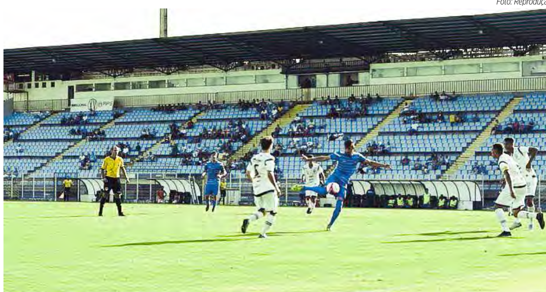
Rio Claro FC quer vitória em sua estreia na 53ª Copa São Paulo