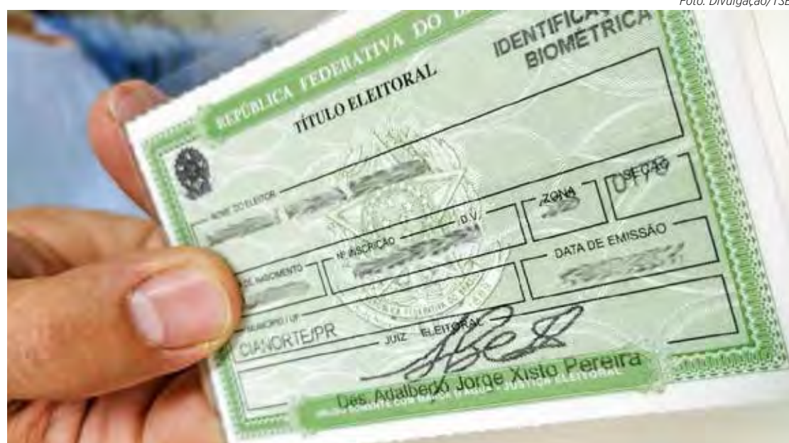
O eleitor que não votar e não justificar por três eleições consecutivas tem o título cancelado

O eleitor que não justificar a ausência nas eleições 2022 pagará multa referente a cada turno, se for o caso, entre o mínimo de 3% e o máximo de 10% do valor utilizado como base de cálculo – o equivalente a R$ 35,13. O valor ainda poderá ser multiplicado por dez em