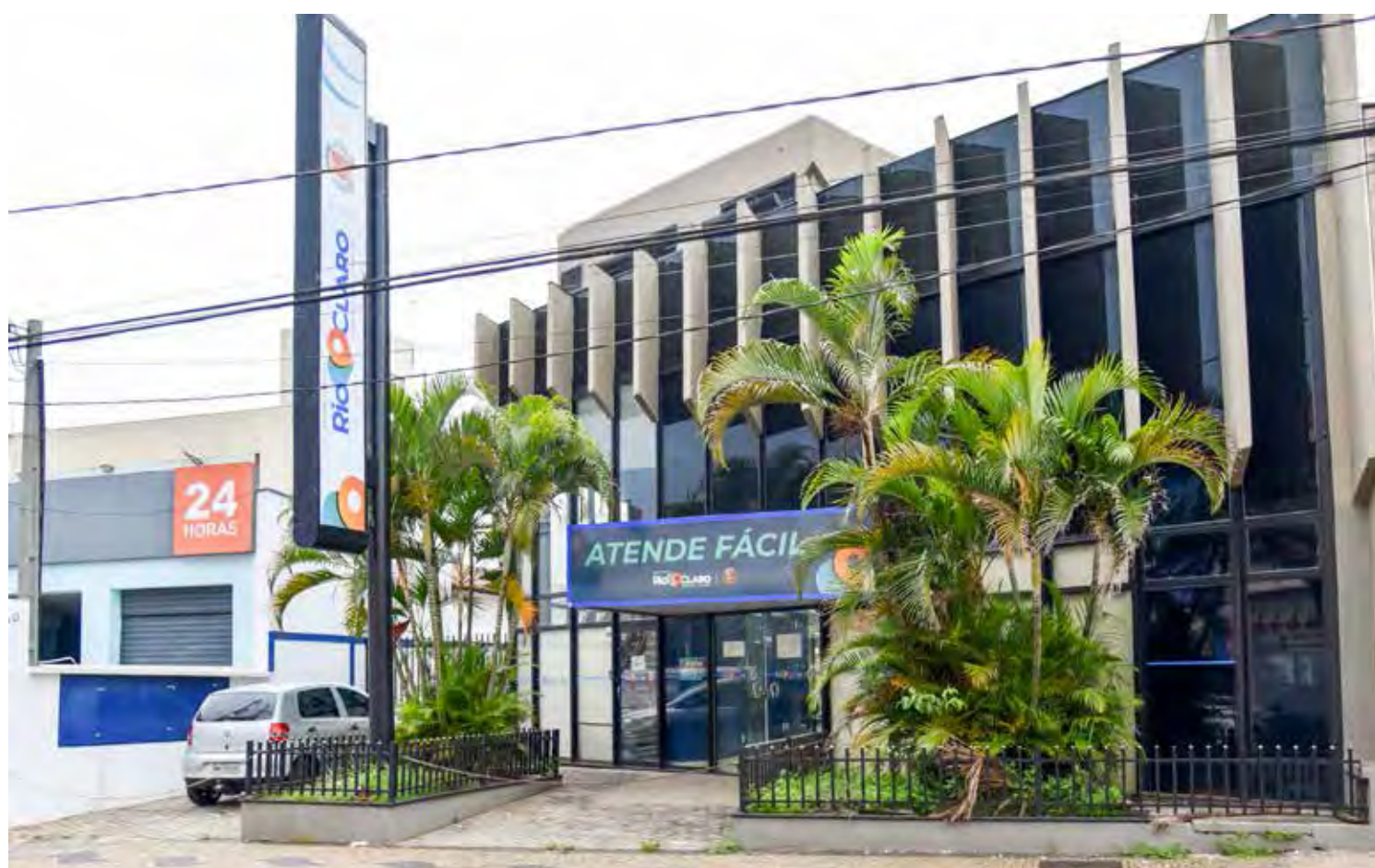
Pedidos dos ambulantes serão realizados no Atende Fácil de 5 a 25 de janeiro

Os alimentos serão comercializados em seis setores do espaço multiuso e no Jardim Público. Os comerciantes podem fazer a opção entre um dos dois locais. A definição do setor em que ficará cada barraca se dará por sorteio, que também definirá quais serão os comerciantes que poderão vender seus produtos no carnaval.