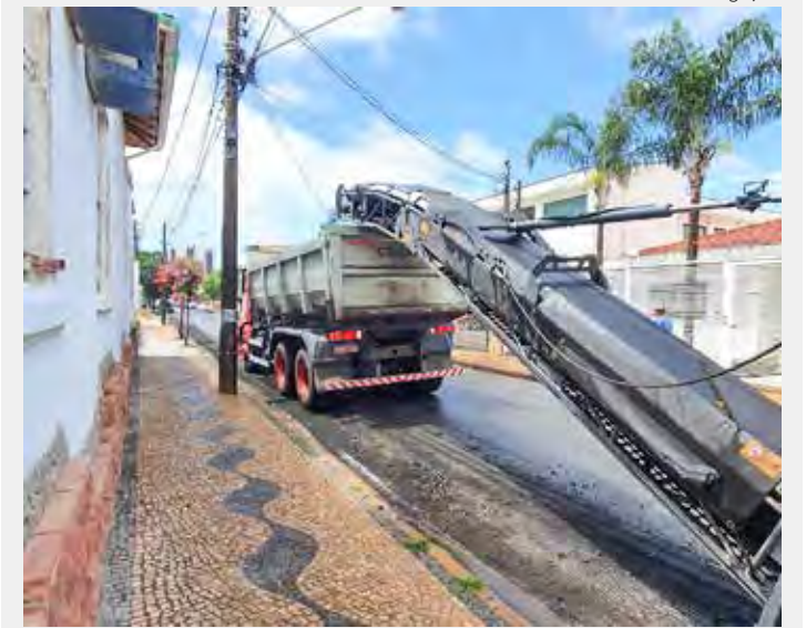
Material do antigo pavimento é reaproveitado como raspa de asfalto