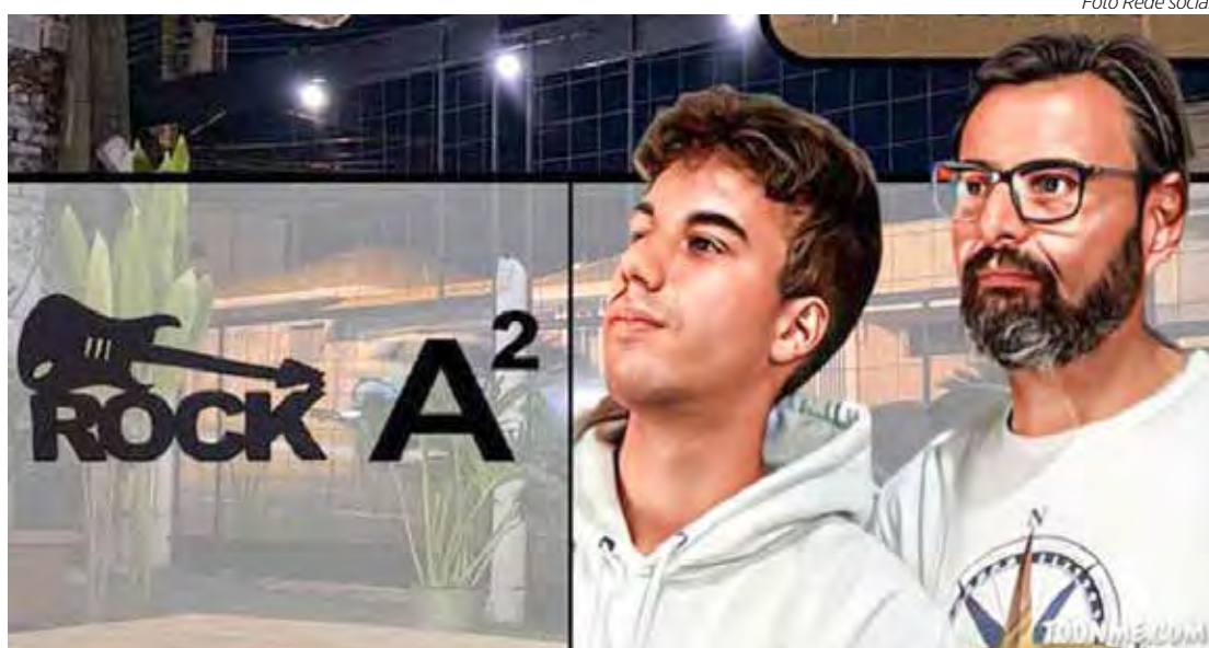
Rock A² no Malados Bar

RÉVEILLON CELEBRATION – No sábado (31) partir das 19h tem “Réveillon Celebration” festa na virada de ano, com música ao vivo as 19h30 tem show com Banda Fênix, e as 21h e a vez de agitar o ambiente com Balaio de Gato, já as 23h tem muito samba e