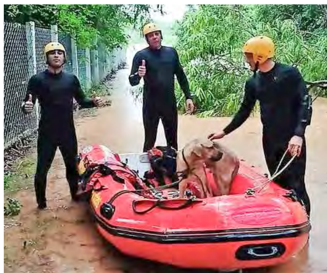
Pedido de ajuda chegou pelo telefone de emergência; na imagem, bombeiros no momento do salvamento

Segundo relatos dos agentes de segurança, o local estava alagado e havia um grande volume de água com correnteza. Os profissionais usaram um bote para chegar até o animal e resgatá-lo.