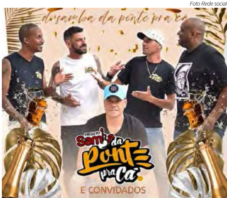
Grupo Da Ponte Pra Cá e Convidados no Sr. Boteco Petiscaria