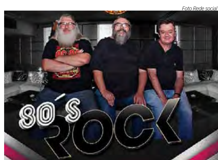
80's Rock no Chopp & Cia.