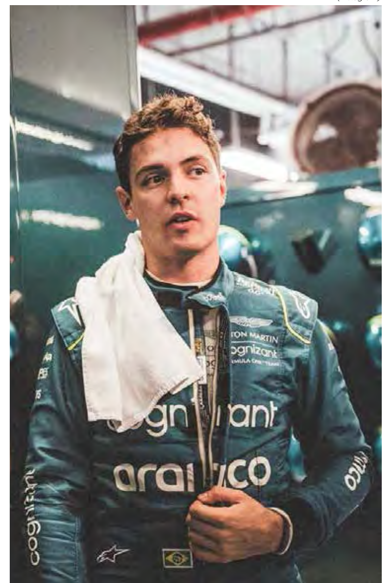
Brasileiro Felipe Drugovich vai abrilhantar o Grid da Corrida dos Campeões