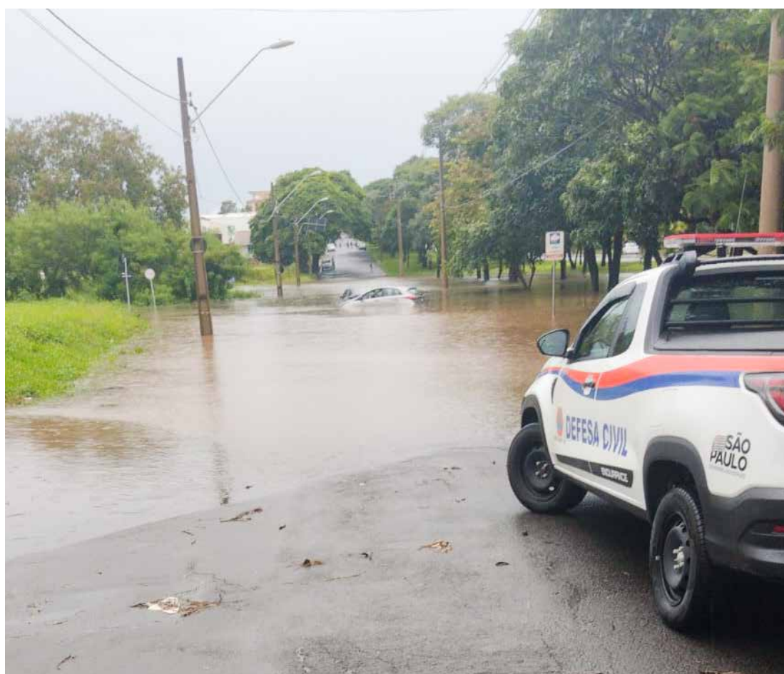
Choveu praticamente o dia todo em Rio Claro ontem, deixando várias ruas alagadas

Com o aumento das chuvas, comum no verão, ocorre também o aumento do volume