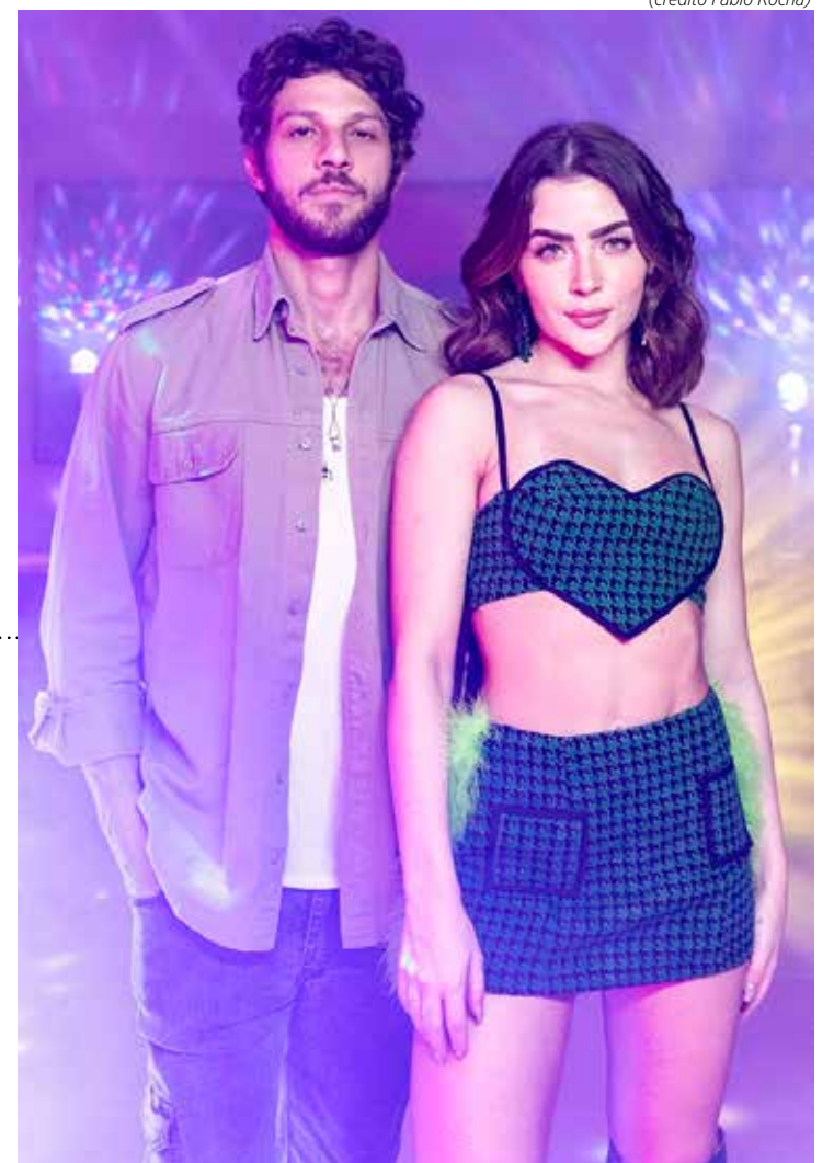
Chay Suede e Jade Picon em "Travessia", sucesso da TV aberta

A Globo contratou Sabrina Sato, mas percebe-se que até agora ainda não foi definido um meio para aproveitar melhor o seu trabalho. Por enquanto, só participações em programas, como agora será no "The Masked Singer".