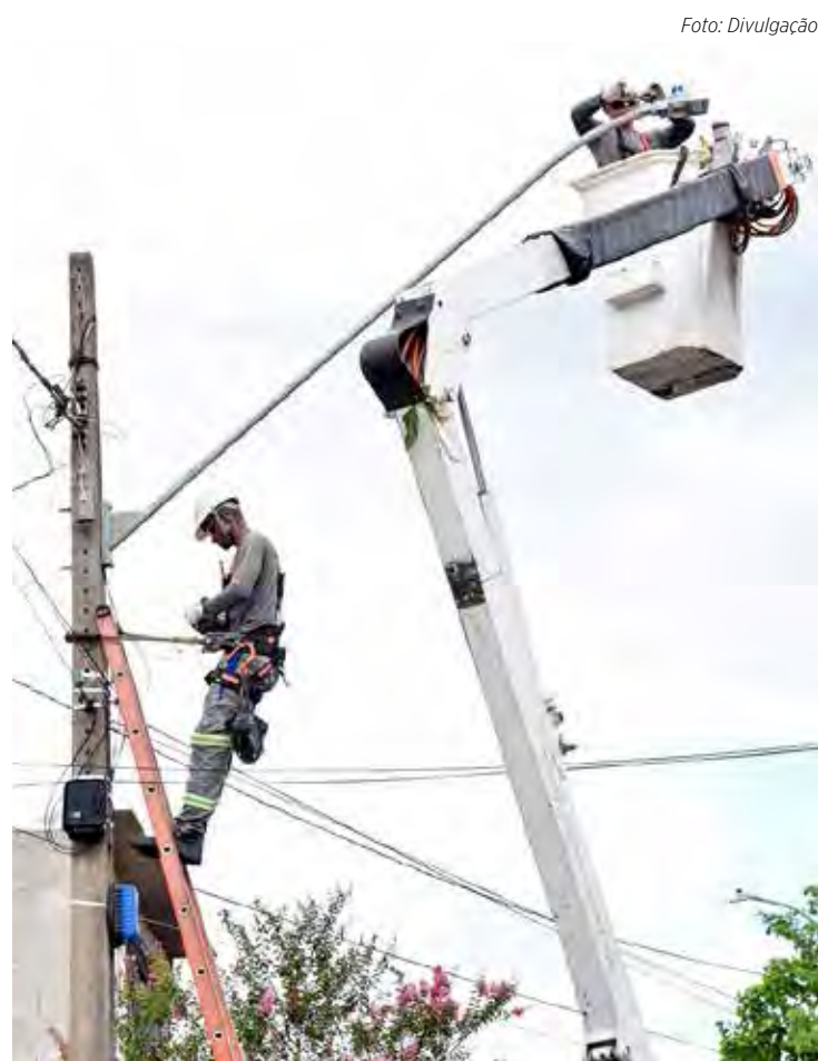
Vários pontos da cidade estão ganhando nova iluminação