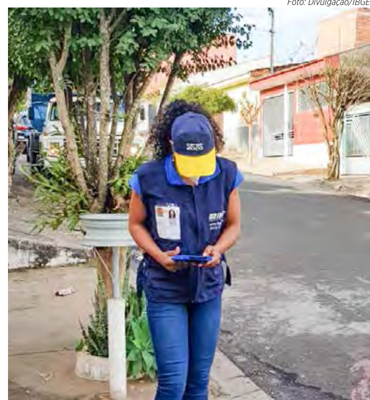
Recenseadora durante coleta de dados em Rio Claro que tem 70,8% da população recenseada

De acordo com o IBGE, até o dia 25 de dezembro deste ano, 83,9% da população já havia sido recenseada, somando 87,7 milhões de domicílios particulares e mais de 178 milhões de pessoas. O Censo 2022 está em campo realizando coletas desde 1º de agosto e continuará durante o mês de janeiro de 2023.