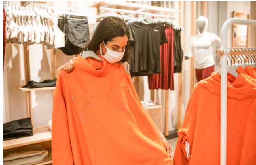
A troca por motivo de gosto ou tamanho fica a critério do lojista

Por outro lado, o Procon-SP ressalta que "se o produto for essencial ou se em virtude da extensão do de-