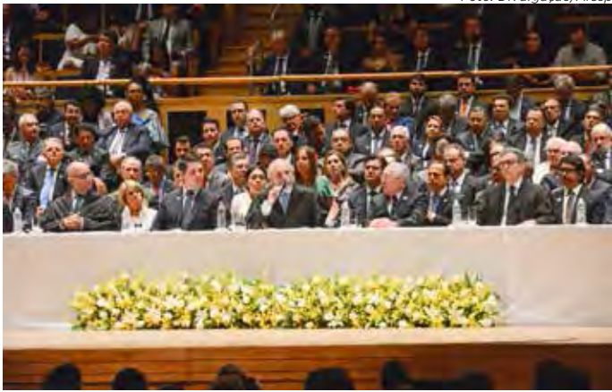
Cerimônia de diplomação dos eleitos em São Paulo

Após a diplomação dos candidatos e candidatas que se elegeram neste ano, começou a correr o prazo para dois tipos de ações judiciais que podem cassar o mandato dos eleitos e eleitas: o RCED (recurso contra expedição de diploma) e a AIME (ação de impugnação de mandato eletivo).