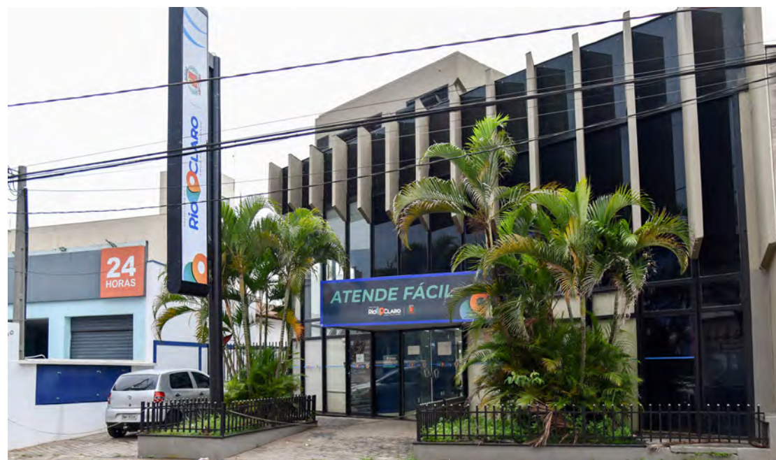
O novo endereço do Atende Fácil será na Avenida 2, entre as ruas 2 e 3, Centro.