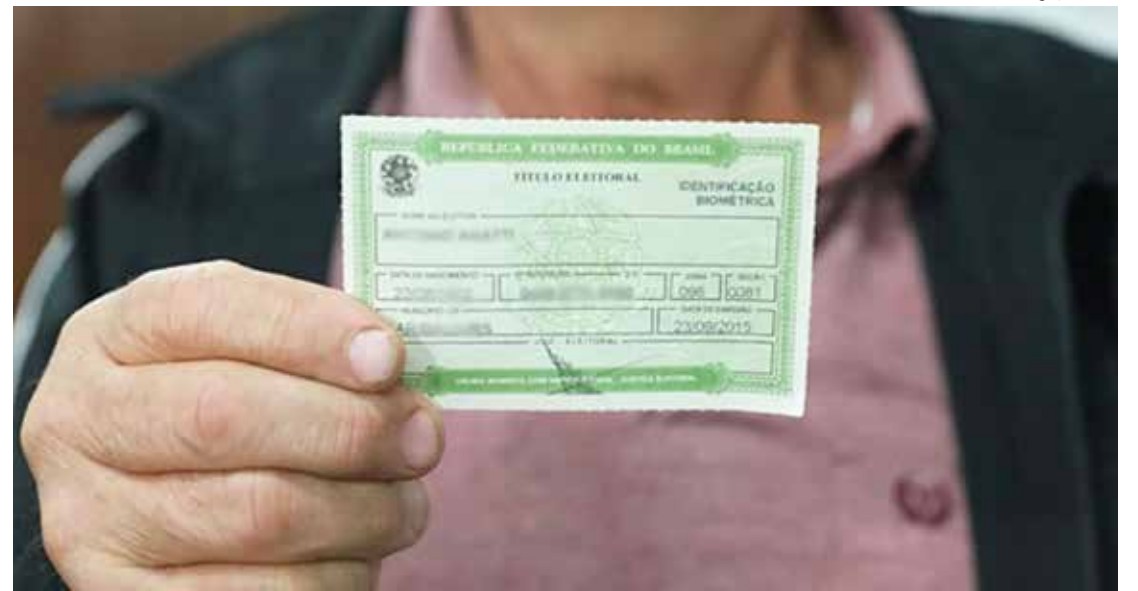
Título de eleitor pode ser emitido pela internet; alistamento é obrigatório para maiores de 18 anos

O sistema vai pedir o envio de pelo menos quatro fotografias para comprovar a identidade do eleitor ou eleitora. A primeira delas é uma selfie segurando um documento oficial de identificação. As outras duas são da própria documentação (frente e verso) usada pela pessoa para se identificar na primeira foto.