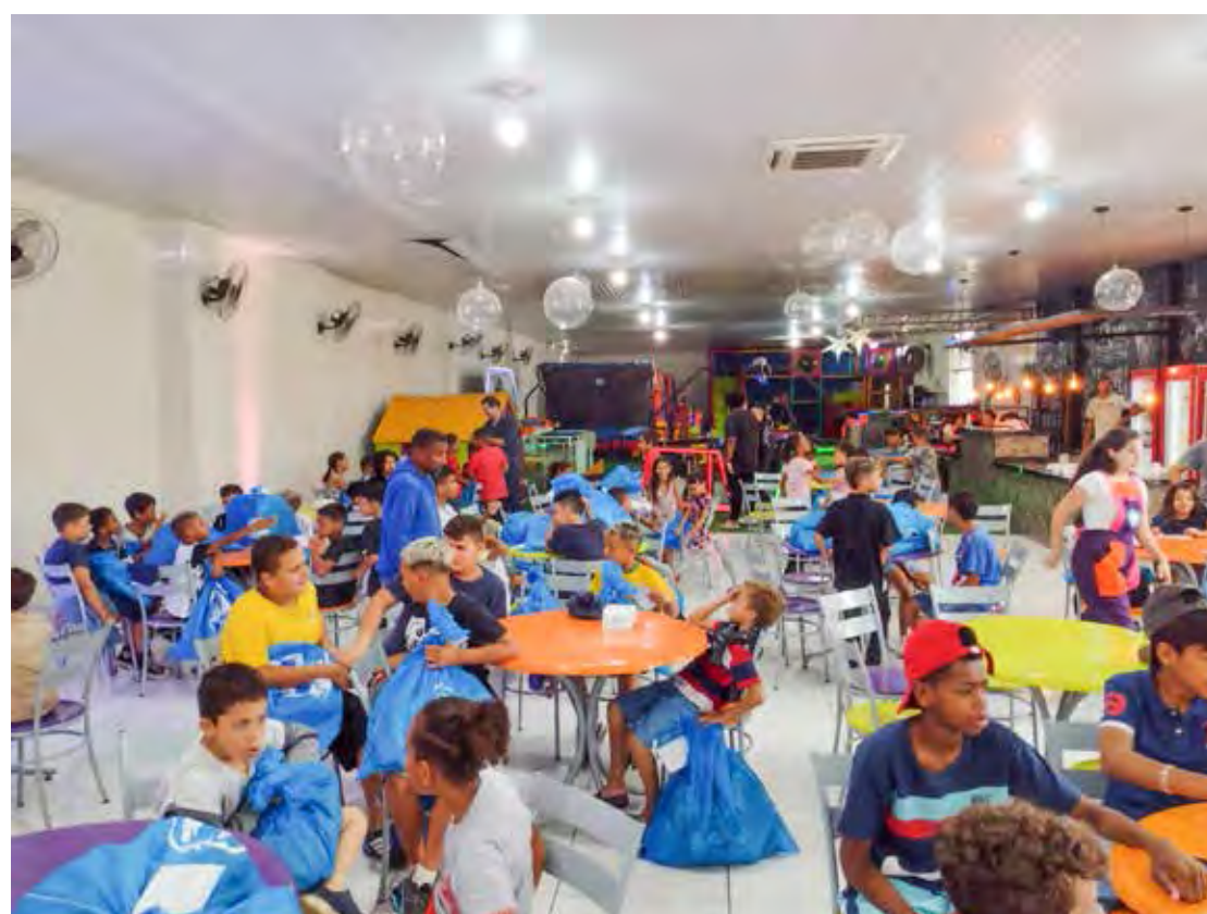
Crianças puderam aproveitar brinquedos infláveis e o almoço diferenciado