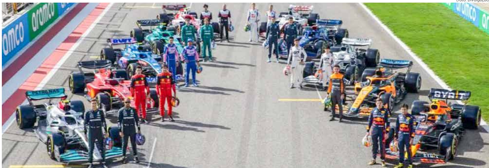
Em cada temporada, os times pagam uma tarifa baseada nos resultados do ano anterior

O campeão de construtores de 2022, no caso a Red Bull, deverá pagar uma tarifa base de 617.687 mil dólares - o que equivale a 585.660 mil euros - e mais 7.411 mil dólares por cada ponto somado o que representa, ao todo, um valor aproximado