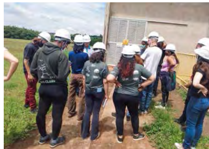
Estudantes durante visita à Estação de Tratamento de Esgoto Jardim Novo