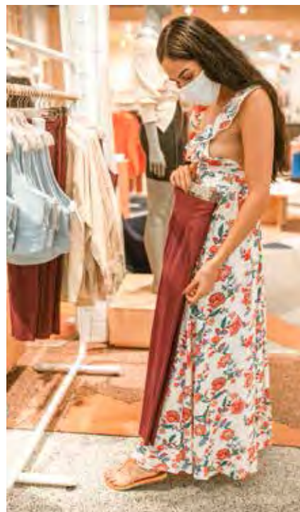
Se a troca for de peça de vestuário a etiqueta deve ser mantida no produto

"O Código de Defesa do Consumidor não obriga o fornecedor a