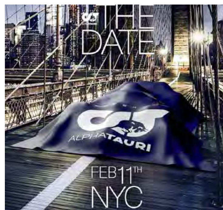
Lançamento acontece no dia 11 de fevereiro; equipe é a terceira a confirmar data