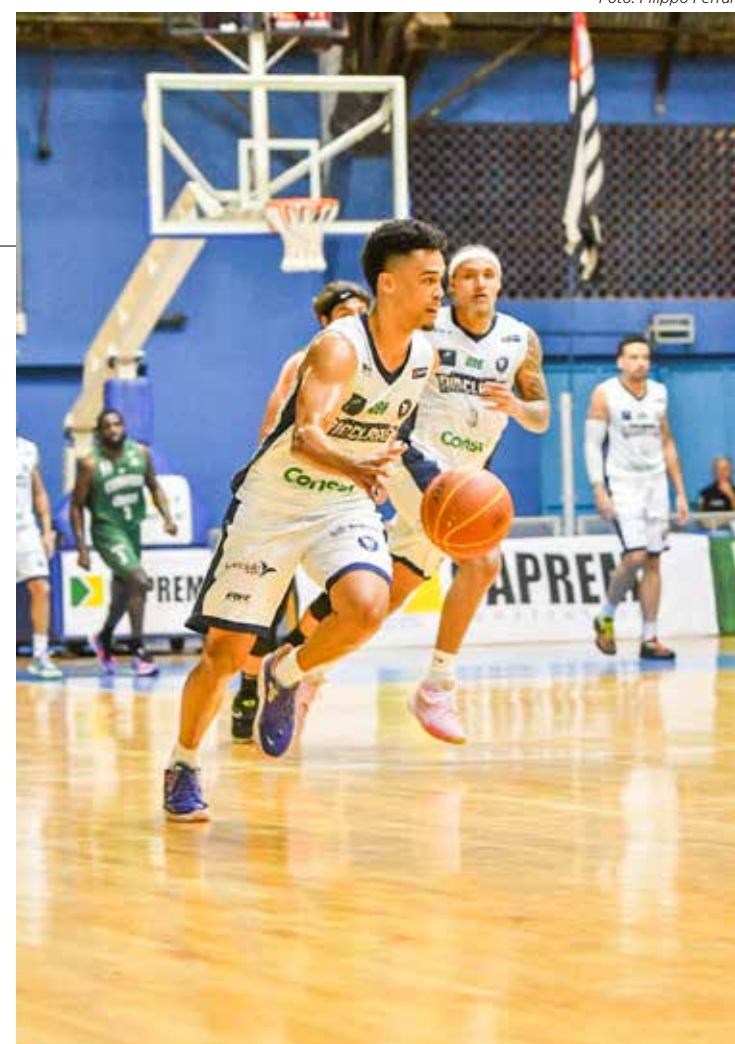
Rio Claro Basquete em quadra na noite de hoje pelo NBB

A liderança do NBB 15 é do time de Franca, que já soma 14 vitórias e permanece invicta na disputa.