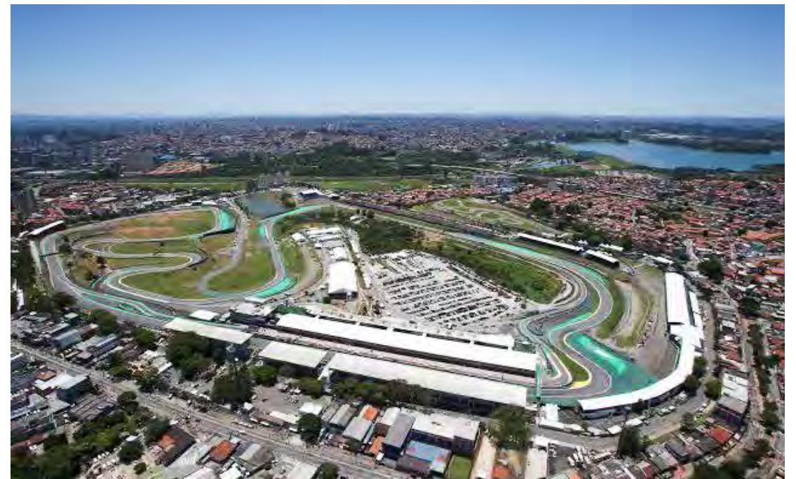
A FIA homologou o cronograma da F1 2023 e trouxe novidades — as principais delas em Las Vegas e Interlagos