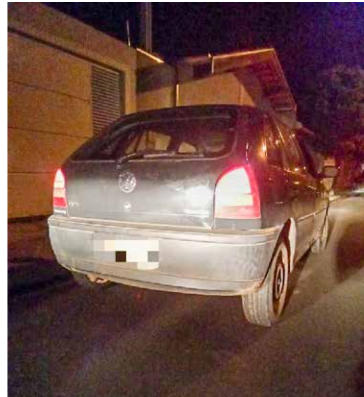
Polícia apreendeu um revólver calibre 38 e munição de pistola nove milímetros no banco de trás do veículo, além de objetos e carteira roubados das vítimas

Os GCMs foram ao local e lá informaram que os três homens, um deles armado, chegaram em um veículo modelo Gol e abordaram as vítimas que estavam sentadas em fren-