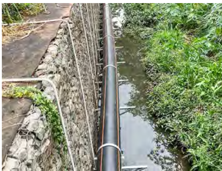
Com a finalização das obras a cidade passa a ter 100% de esgoto tratado