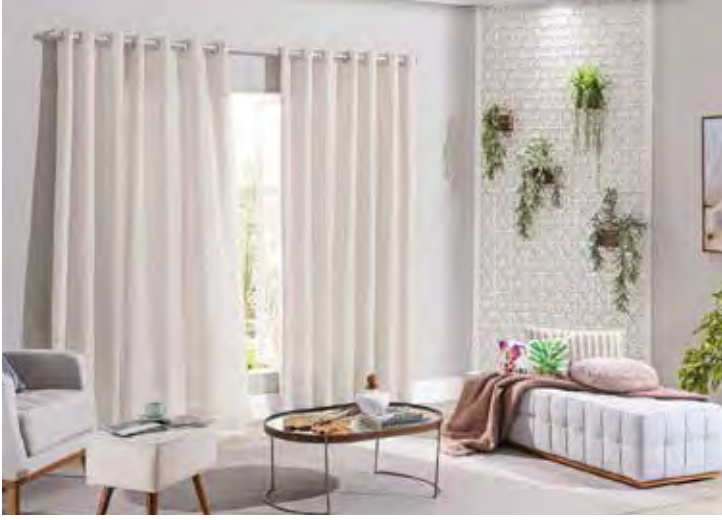
O ideal é que a largura da cortina seja duas vezes o tamanho do varão