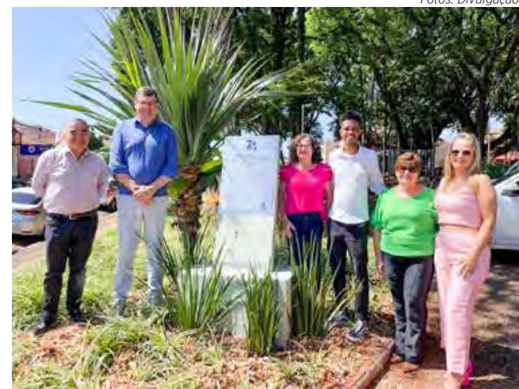
Autoridades e munícipes celebraram a conclusão das interligações da rede coletora de esgoto