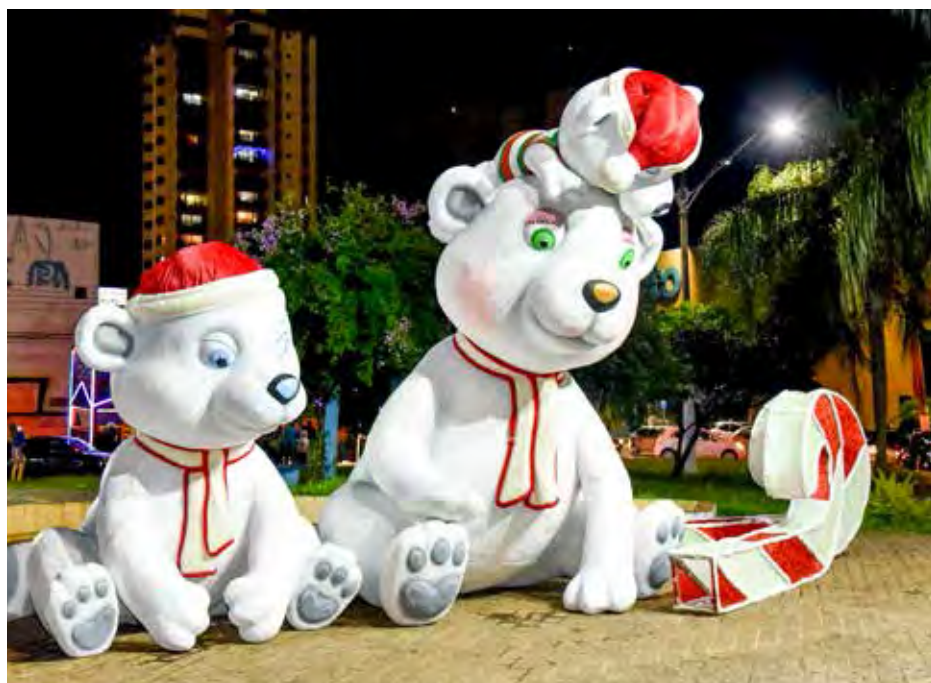
Os enfeites estão em três pontos mais centrais da cidade

A prefeitura adotou outras duas medidas como atrações natalinas. Na Avenida 7 com Rua 1 está instalada a Casa do Papai Noel, que pode ser visitada até sexta-feira (23), das 18 às 22 horas. Não há cobrança de ingresso. E a Secretaria de Turismo está recebendo pelo WhatsApp fotos de casas, sacadas de apartamentos e de prédios comerciais decorados para o Natal. As mais bonitas serão premiadas.