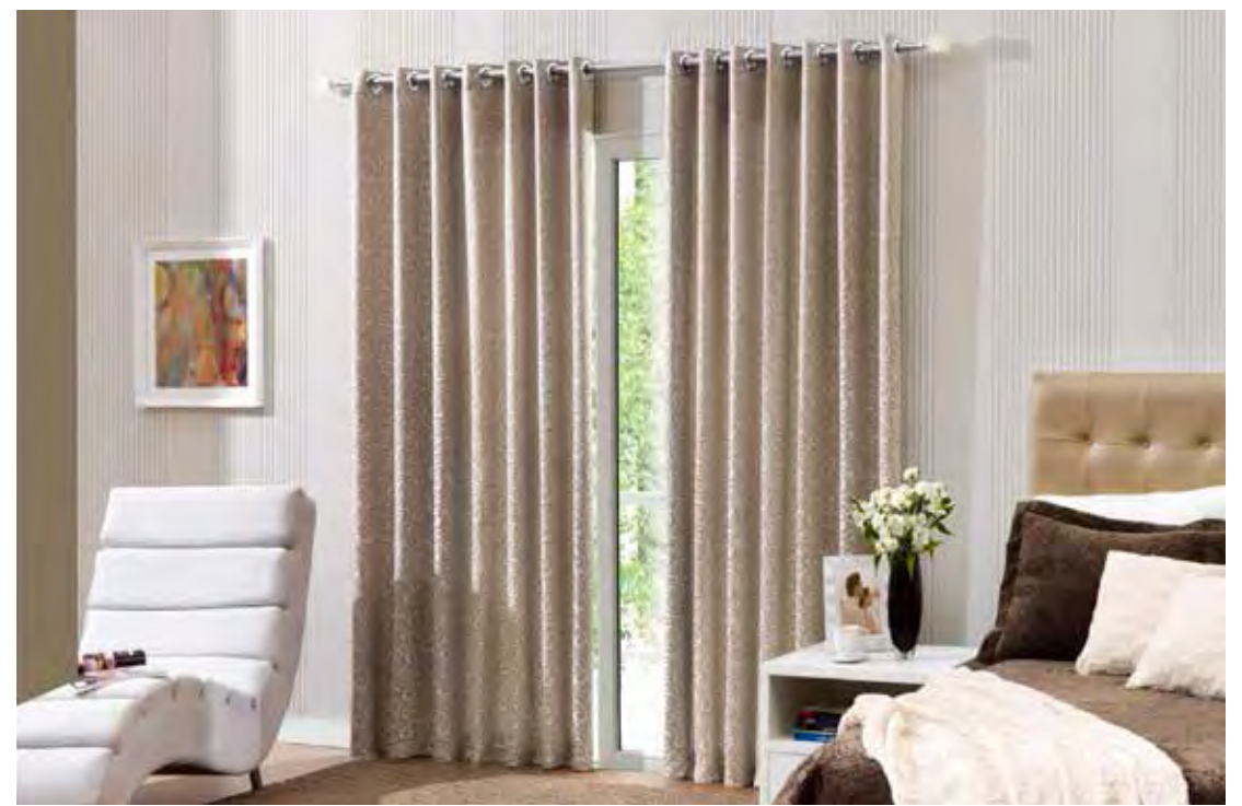
O ideal é que toquem levemente o piso

5 Caso o ambiente onde a cortina for instalada seja alto, coloque o varão entre o teto e a parte superior da janela, ou se preferir, você pode utilizar a cortina do chão ao teto, se o ambiente for mais baixo, procure instalar pelo menos 20 cm acima da janela, sempre centralizando o varão.