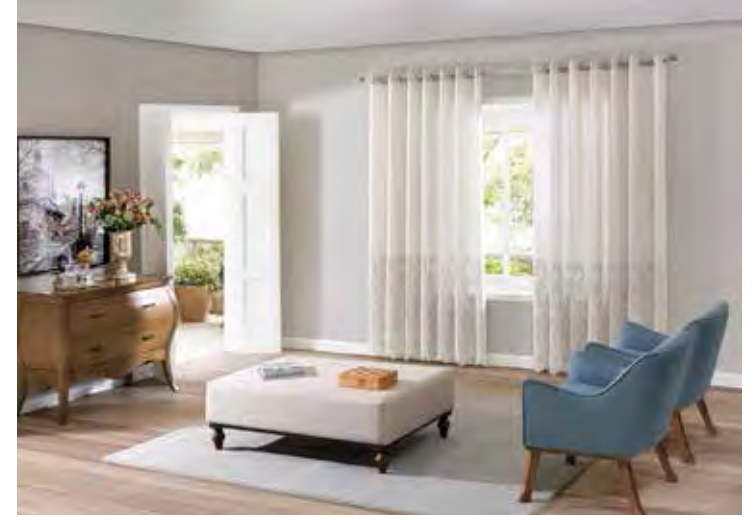
Se o ambiente for alto, coloque o varão entre o teto e a parte superior da janela