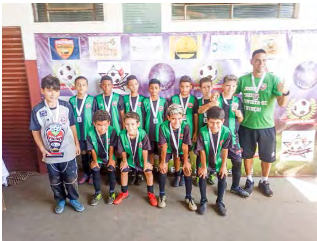
Escolinha do Cris CR10, categoria Sub-10

Cris CR-10 fez uma partida bastante equilibrada com o time da Escolinha Chute-Inicial do Corinthians, de Limeira, mas acabou perdendo por 1x0. De todo modo, estão de parabéns os garotos bons de bola da Escolinha do Cris CR 10.