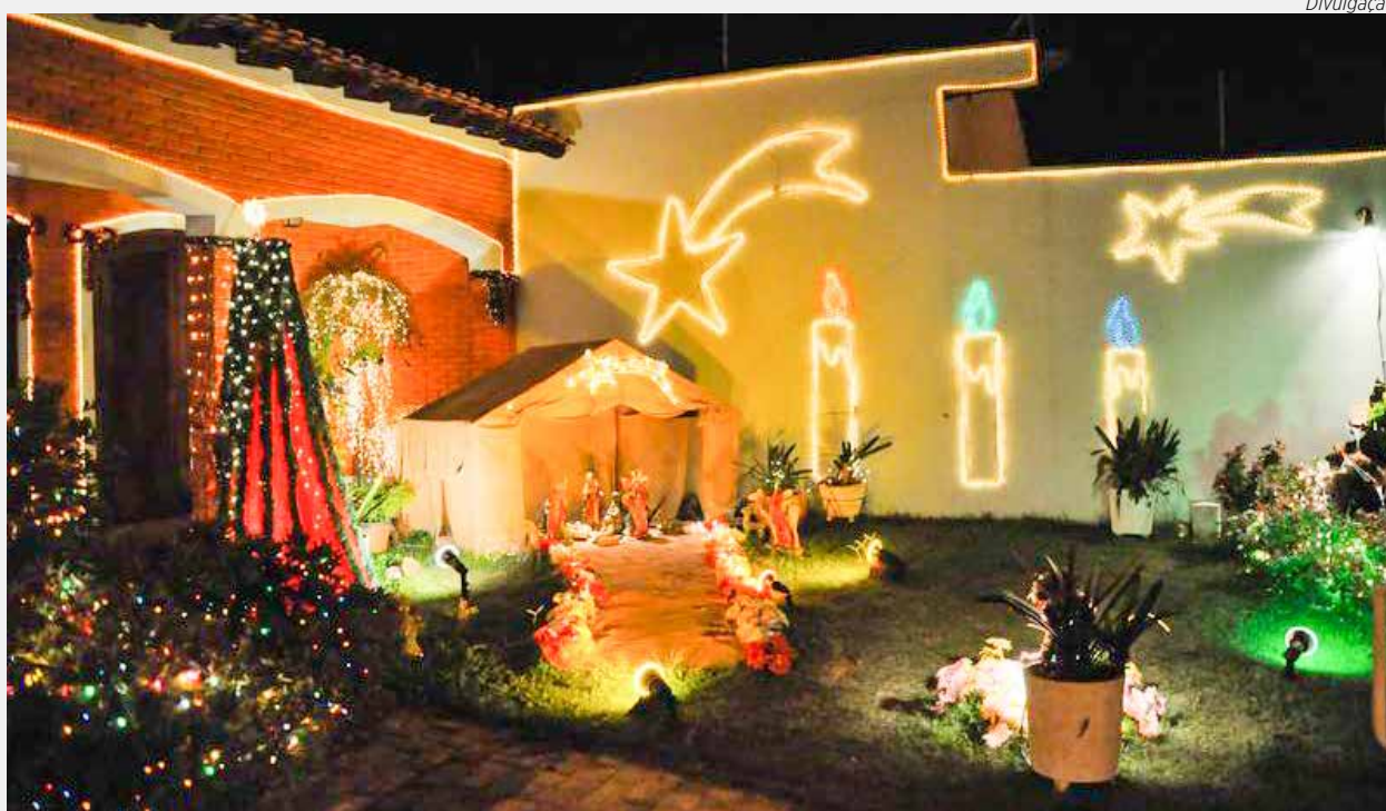
População pode encaminhar fotos de imóveis decorados para o concurso

“As decorações deverão ser feitas em locais externos, que possam ser visualizados pelo público sem a necessidade de acessar o imóvel”, observa o secretário municipal de Turismo, Guilherme Pizzirani.