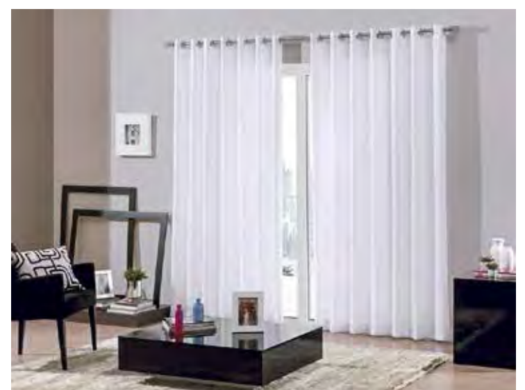
O varão deve passar 20 centímetros de cada lado da janela