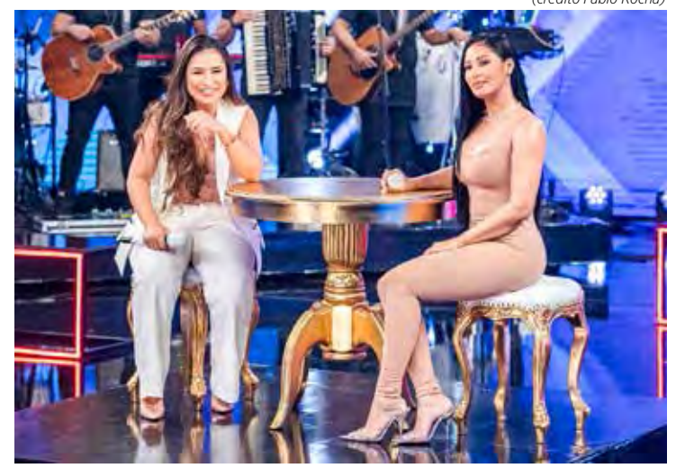
Simone e Simaria

Não há nada que uma boa conversa entre irmãs não resolva. Vai por mim.