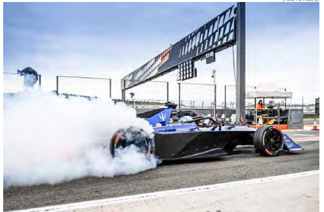
Maserati mostrou bom desempenho nos testes