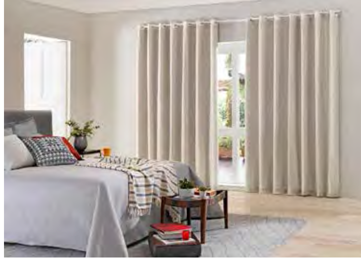
É importante também se atentar a porcentagem de bloqueio de luz