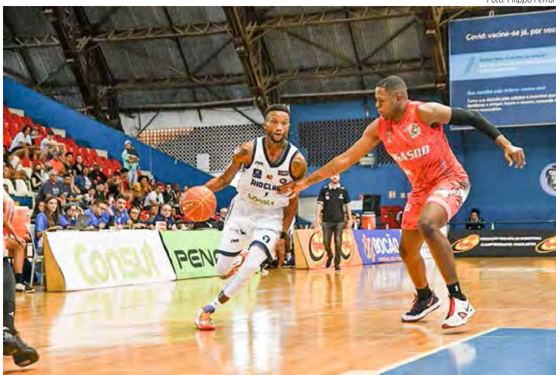
Rio Claro Basquete quer vencer para melhorar posição na tabela