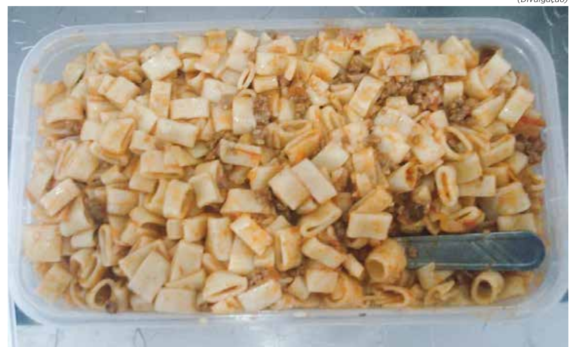
Caso aconteceu na manhã do último domingo (18)

mulher não chegou a ser levada para a delegacia. Após prestar esclarecimentos na unidade prisional, ela foi suspensa do rol de visitas temporariamente,