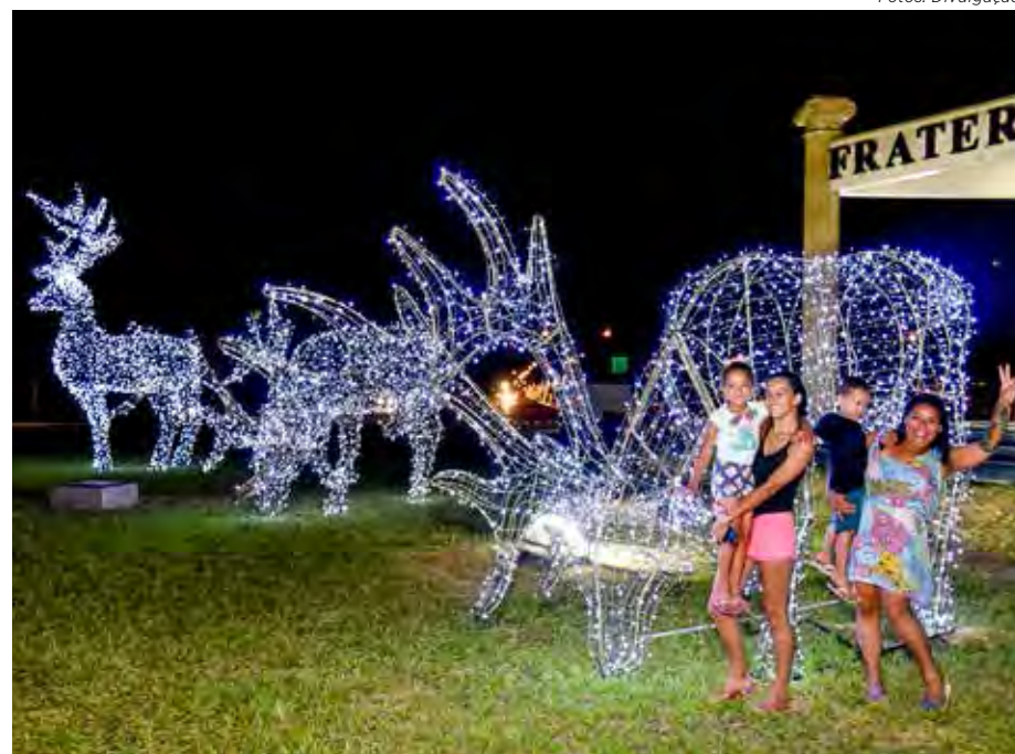
População tem visitado os locais enfeitados para apreciar e tirar fotos