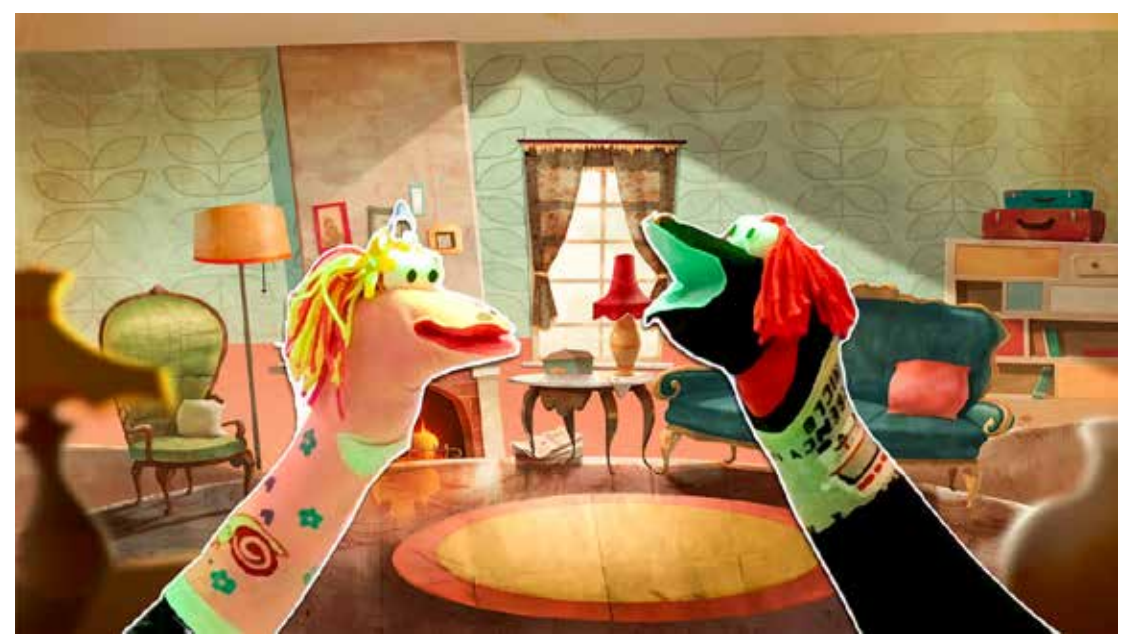
A Websérie "Sentimentos" busca sensibilizar o público infantil

Este evento é uma realização do governo do estado de São Paulo, por meio da Secretaria de Cultura e Economia Criativa, e Instituto Lumiarte, bem como da prefeitura de Rio Claro, Secretaria da Cultura através da Lei Municipal de Incentivo à Cultura, e conta com o patrocínio do Instituto Carlos Roberto Hansen, Tigre - Tubos e Conexões e Unimed Rio Claro.