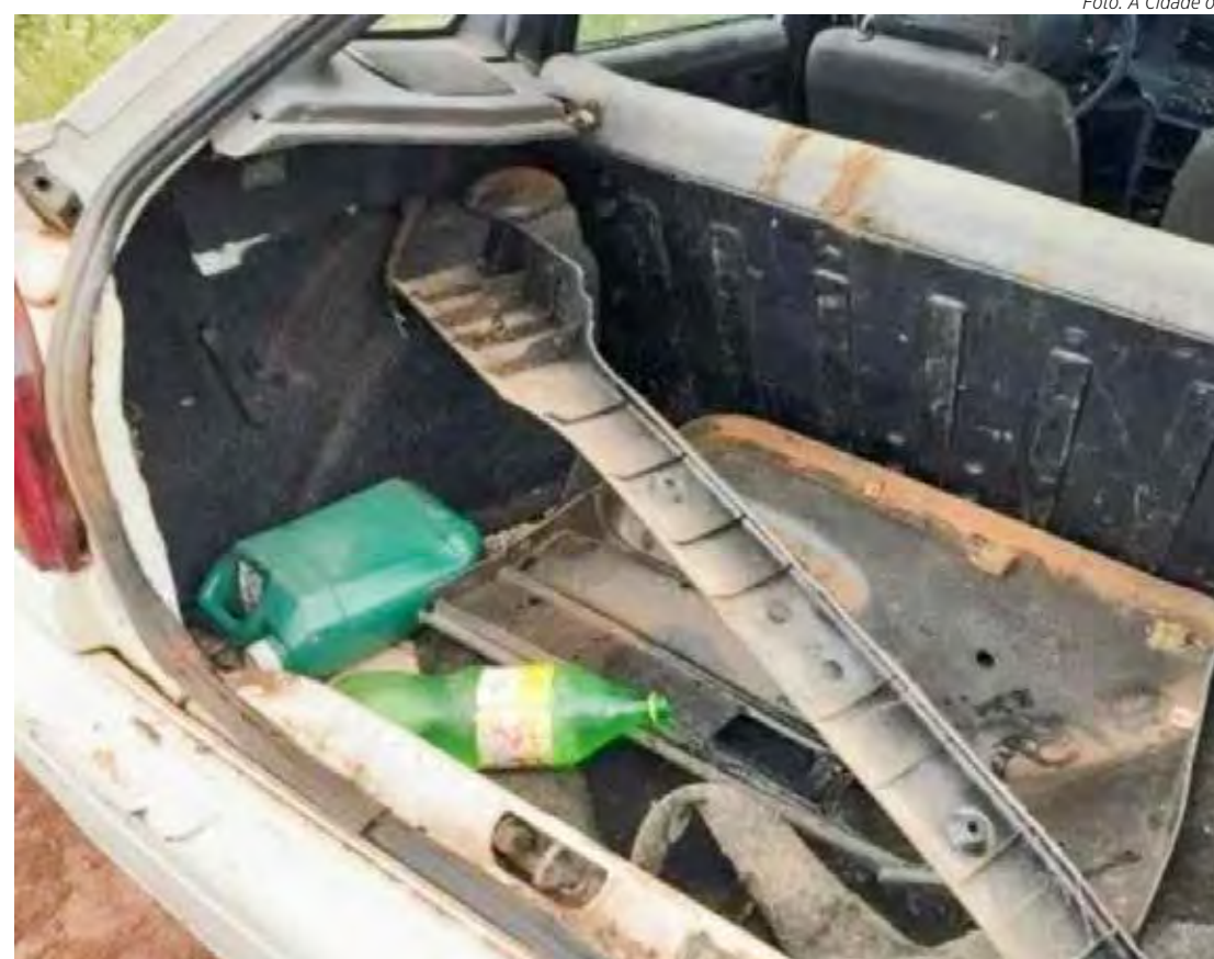
Inicialmente suspeito negou o envolvimento na morte, mas, após ver as provas coletadas pela polícia, confessou o crime, de acordo com a polícia

Os policiais foram à casa da vítima na Rua José Ferrari. Mariano morava com outro homem de 39 anos, que foi encontrado dormindo ao lado do irmão, de 25 anos