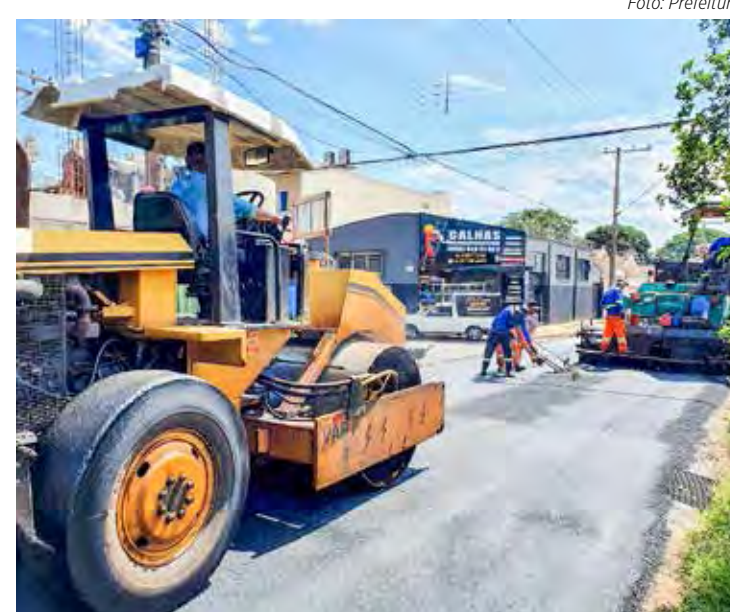
Alguns trechos recém-recapeados podem ficar momentaneamente sem a pintura de solo

Caparrotti ressalta que, em casos de sinalizações como a de "Pare", as vias possuem as placas de trânsito para orientar os condutores. "Mesmo assim, sempre trabalhamos para recompor a pintura de solo o mais rápido possível, e reforçamos a necessidade de colaboração dos motoristas para um tráfego seguro nos trechos recém-recapeados", conclui.