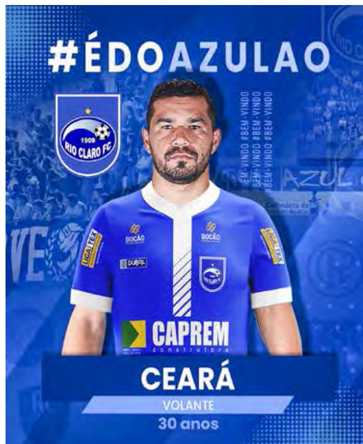
Ceará traz experiência para o meio campo da equipe rioclarista

Outro nome que chega para incrementar ainda mais o ataque do Rio Claro FC no Campeonato Paulista é Gusta-