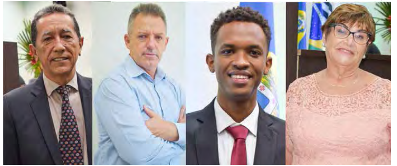
Vereadores que compõem a nova mesa diretora da Câmara de Cordeirópolis para o biênio 2023-2024