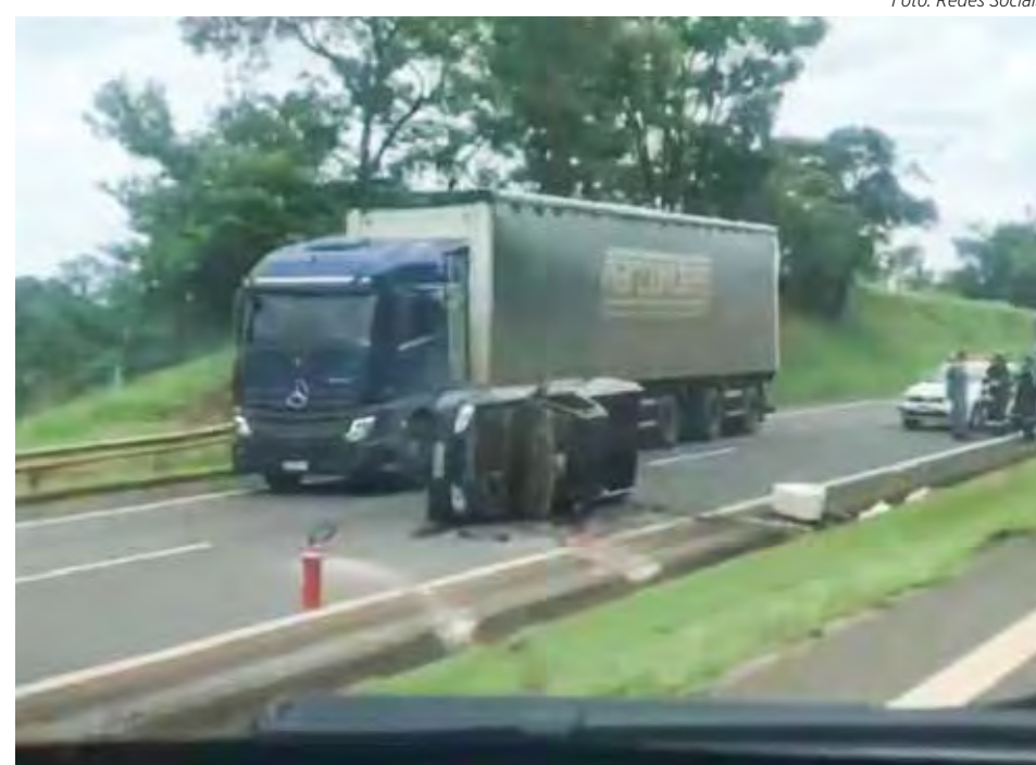
Caso aconteceu na manhã de quarta-feira (14)

O corpo da vítima foi trazido para o IML (Instituto Médico Legal) de Rio Claro.