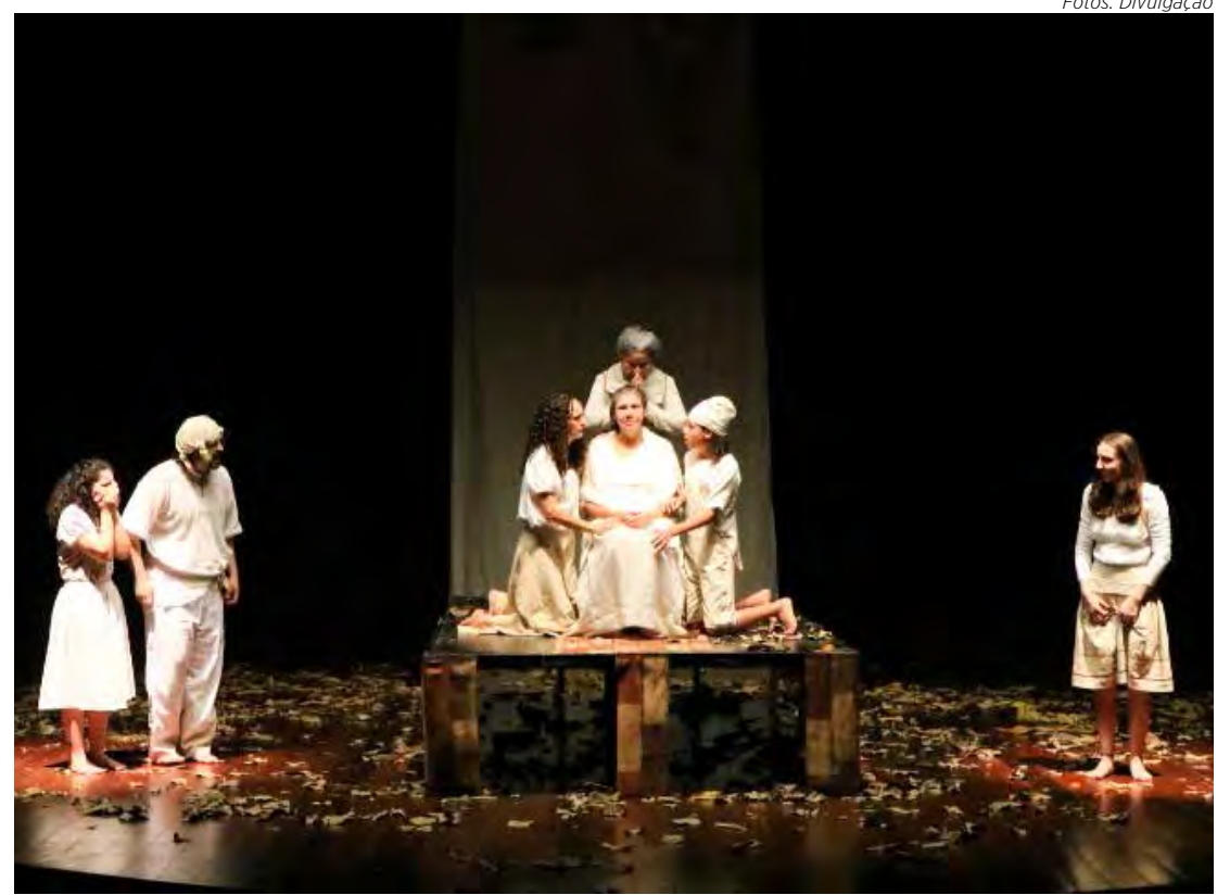
Espectáculo "A Viagem" encenado pela turma dos adultos