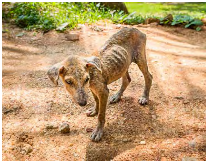
Abandonar ou maltratar animais é crime passível de punição com multa e detenção

O reajuste nas tarifas de pedágios estava previsto para ocorrer em julho deste ano, mas foi adiado pelo então governador de São Paulo, Rodrigo Garcia. Segundo a Artesp, o adiamento ocorreu por causa da "sensível conjuntura econômica existente na ocasião, com alta inflação e alta desenfreada dos preços, em especial de combustíveis, que causaram efeito cascata no bolso do consumidor". Rodrigo Garcia disputou a reeleição para governador paulista e foi derrotado.