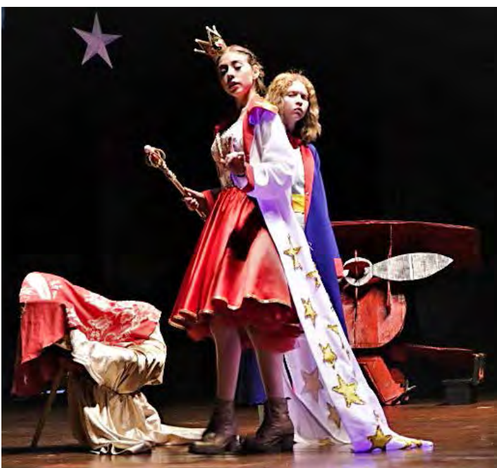
"O Pequeno Príncipe", encenada por crianças e adolescentes, foi apresentada na Mostra Teatral 2022 no Centro Cultural "Roberto Palmari".

Conforme divulgado pela entidade, "os profissionais da Cia. Tempero D'Alma entregam aos seus alunos e associados um divertido e instigante conjunto de atividades que exploram técnicas vocais e corporais, leitura dramática, dança, jogos teatrais, improviso, entre outras experiências que irão provocar os participantes a soltar o artista que existe dentro de cada um".