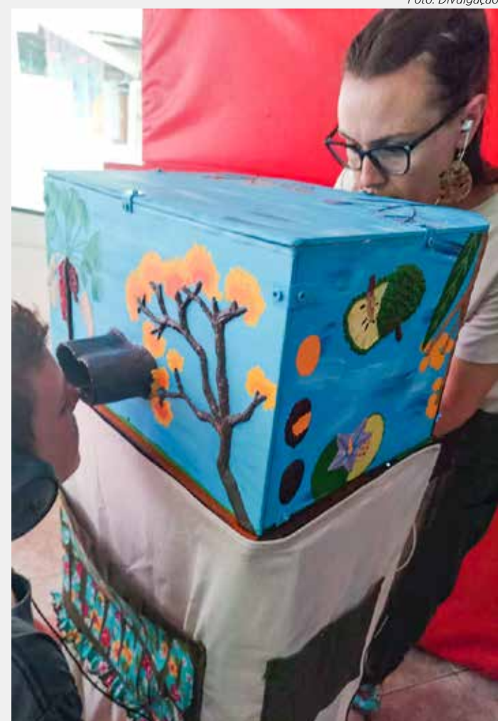
Apresentação será realizada no domingo (11), das 15h às 17h, na Floresta Estadual

9/12, às 19h30: Coral da Guarda Mirim 12/12, às 19h30: Coral da Escola Bom Bosco 16/12, às 20h00: FlashMob e Coral - Casa da Música 23/12, às 20h30: PROAC, com jazz natalino Local: Praça de Alimentação