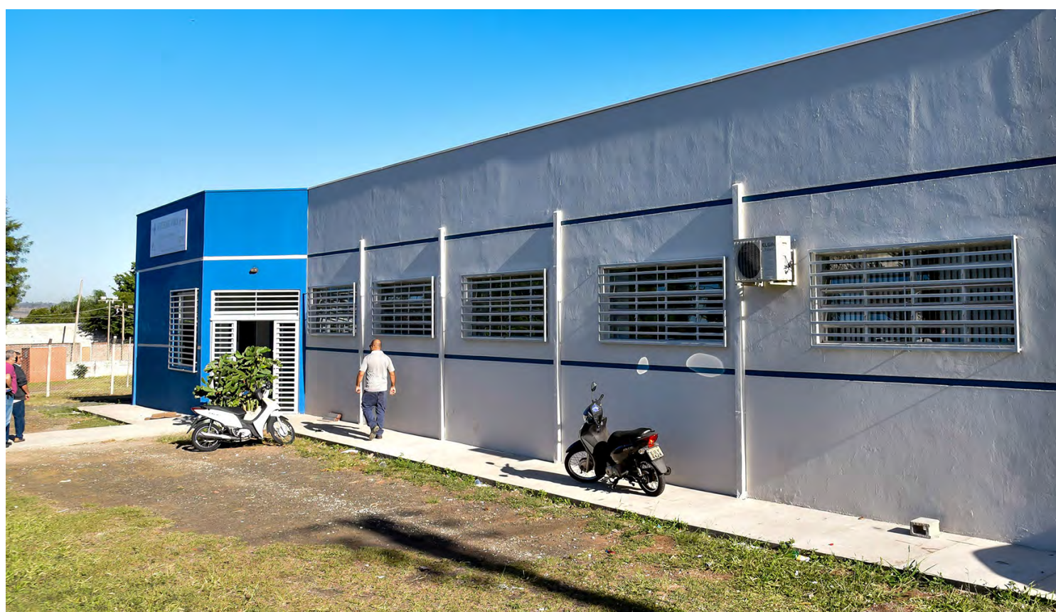
Unidades de saúde estão recebendo reformas e outras melhorias em Rio Claro.

Os investimentos contemplam também a implantação de um complexo de serviços de saúde no Cervezão. Nesta semana o município abriu licitação para contratar empresa de engenharia que realizará a construção do Hospital Público Municipal, que terá 60 leitos e investimentos iniciais, incluindo insumos