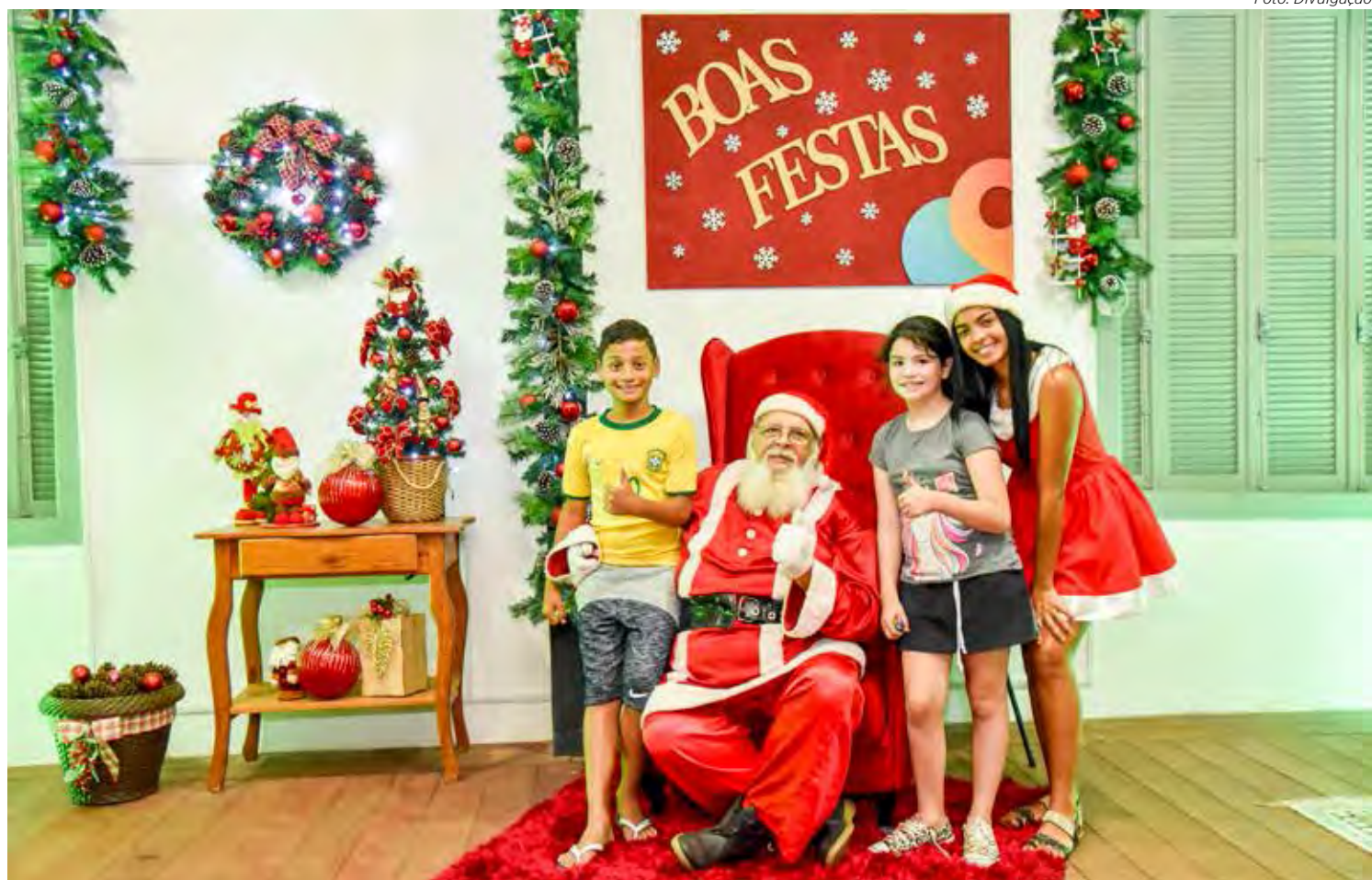
Crianças visitaram a Casa do Papai Noel e aproveitaram para tirar uma foto com o bom velhinho.