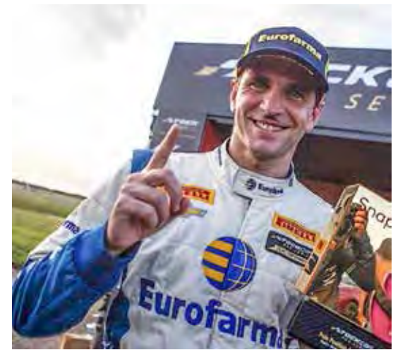
Barrichello e Serra são dois candidatos ao título em Interlagos neste fim de semana pela Stock Car