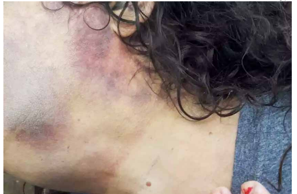
Agressões ocorreram no apartamento da vítima, em um residencial na Avenida Aureliano Fernandes de Araújo Neto

A mulher solicitou uma corrida de transporte por aplicativo nesta semana para ir ao banco retirar dinheiro. Ela foi acompanhada pelo suspeito. No entanto, no caminho, as faxineiras viram seus ferimentos e chamaram moradores para ajudá-la. Nes-