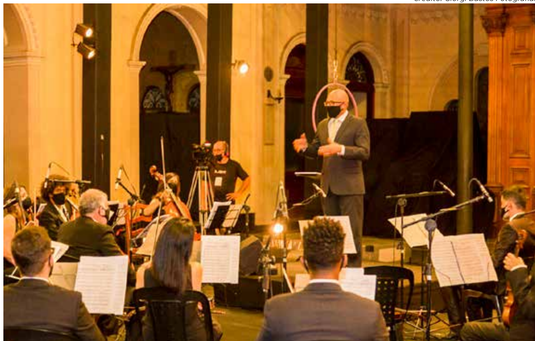
Programação da Orquestra Filarmônica inclui quatro eventos gratuitos