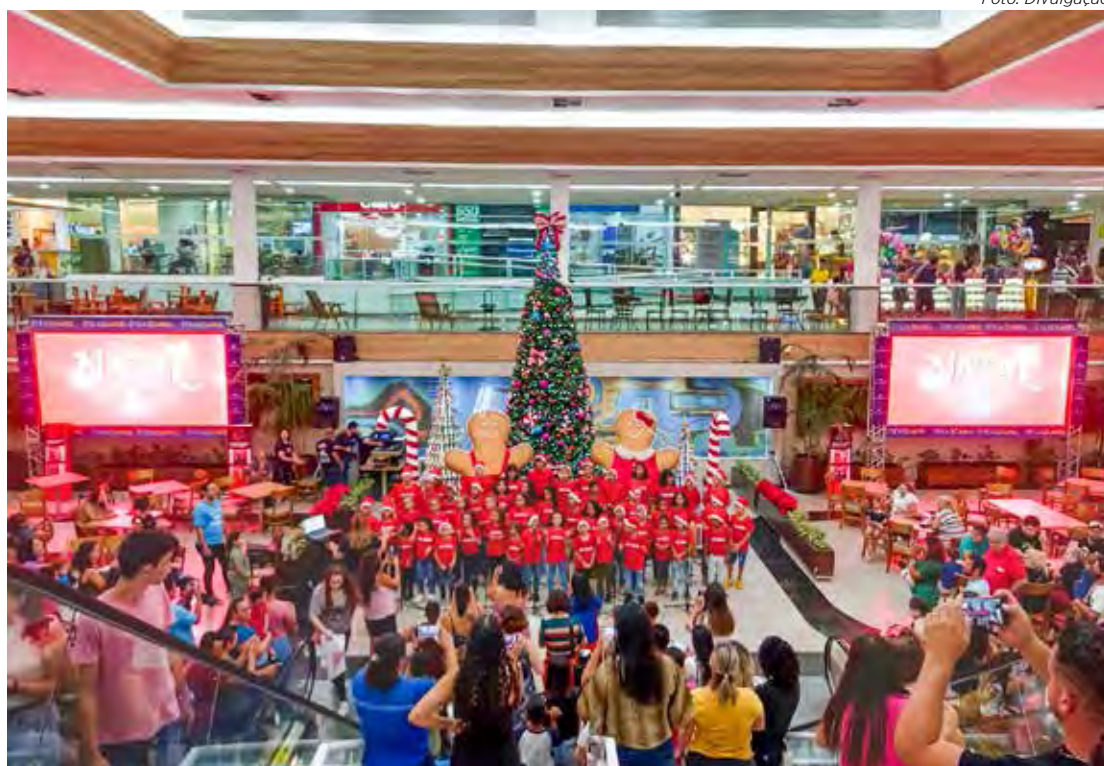
Apresentações de 7 de dezembro da Cantata de Natal que acontece na praça de alimentação do shopping

“A Cantata de Natal do Shopping Rio Claro já se tornou uma tradição no calendário das