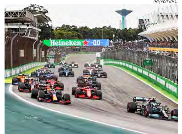
Interlagos voltará a receber a corrida no próximo ano

As corridas sprints são corridas de 100 quilômetros que acontecem no sábado anterior, valem pontos e determinam a ordem de largada para a corrida principal. Com isso, a tradicional qualificação acontece na sexta-feira. Até este ano, apenas os GPs da Emília-Romana, Áustria