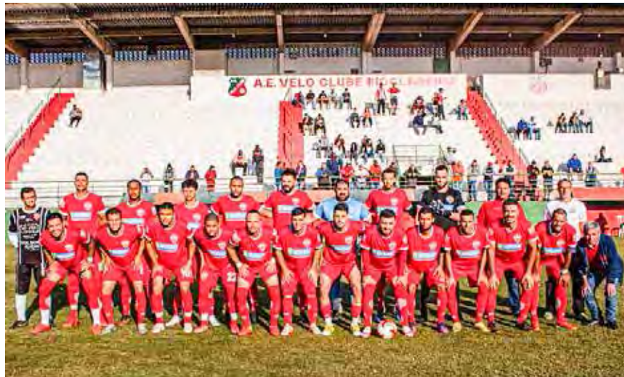
A.A. Boa Vista

Vale destacar que o Campeonato Amador Série A deste ano