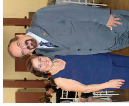
Cidinha Demarchi e Aldo Demarchi – Deputado Estadual