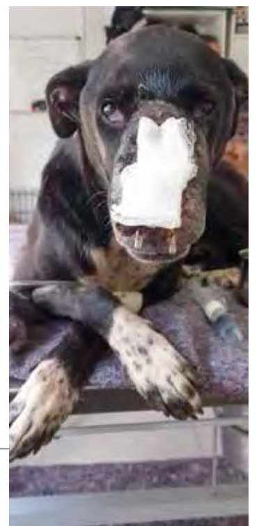
O cachorro Torque foi atacado por uma onça e sofreu dilacerações na face

Quem quiser ajudar com os custos do tratamento e fazer doações pode buscar informações pelos telefones (19) 3532-8796 e (19) 981760461 ou pelas redes sociais da Clínica Veterinária Vila dos Bichos.