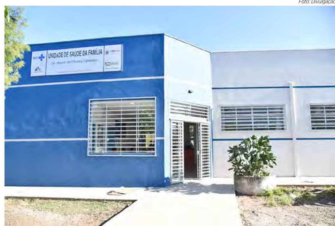
Quatro unidades de saúde da família receberam serviços de reforma

Na UPA da Avenida 29, nova rampa de acesso coberta foi construída facilitando a entrada e saída das ambulâncias na emer-