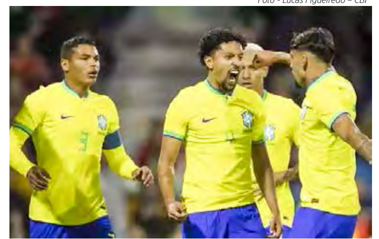
Titulares voltam contra a Coreia do Sul, pelas oitavas de final