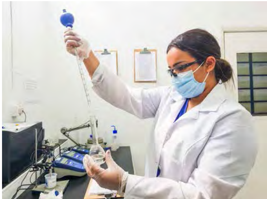
Diariamente, o Daae faz um rigoroso e minucioso trabalho de verificação da qualidade da água com análises realizadas a cada hora antes da saída da água tratada para toda a cidade

Possui duas Estações de Tratamento de Água (ETA 1 e ETA 2). A ETA 1 "José Maria Pedrosa" está localizada no bairro Cidade Nova e foi inaugurada em 1949 e ampliada em 1969, passando a ter volume de 400 litros de água por segundo. A captação da água bruta é feita no Ribeirão Claro, com produção média de 38 milhões de litros por dia, sendo responsável