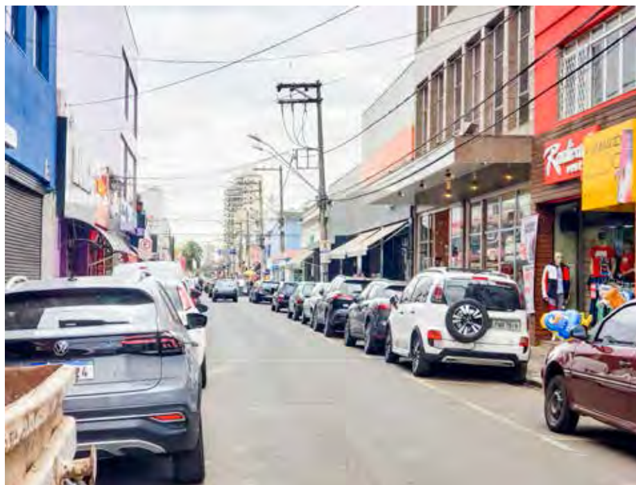
Lojas e estabelecimentos comerciais na Rua 3 na região central de Rio Claro

De acordo com o Sincômercio, as lojas de rua vão abrir das 9 às 22 horas de segunda a sexta-feira. Esse horário vale para os dias 5, 6, 7, 8, 9, 12, 13, 14, 15, 16, 19, 20, 21, 22 e 23 de dezembro. Aos sábados, o funcionamento será das 9 às 18 horas nos dias 10, 17 e 24 de dezembro.