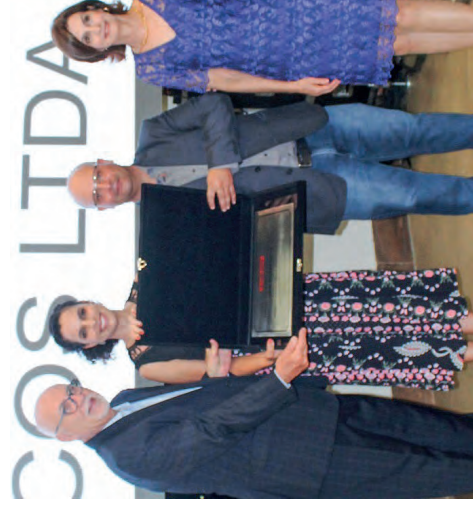
A JAW PLÁSTICOS recebeu o Prêmio Excelência Industrial 2022