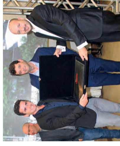
A CAPREM CONSTRUTORA recebeu o Prêmio Excelência Industrial 2022