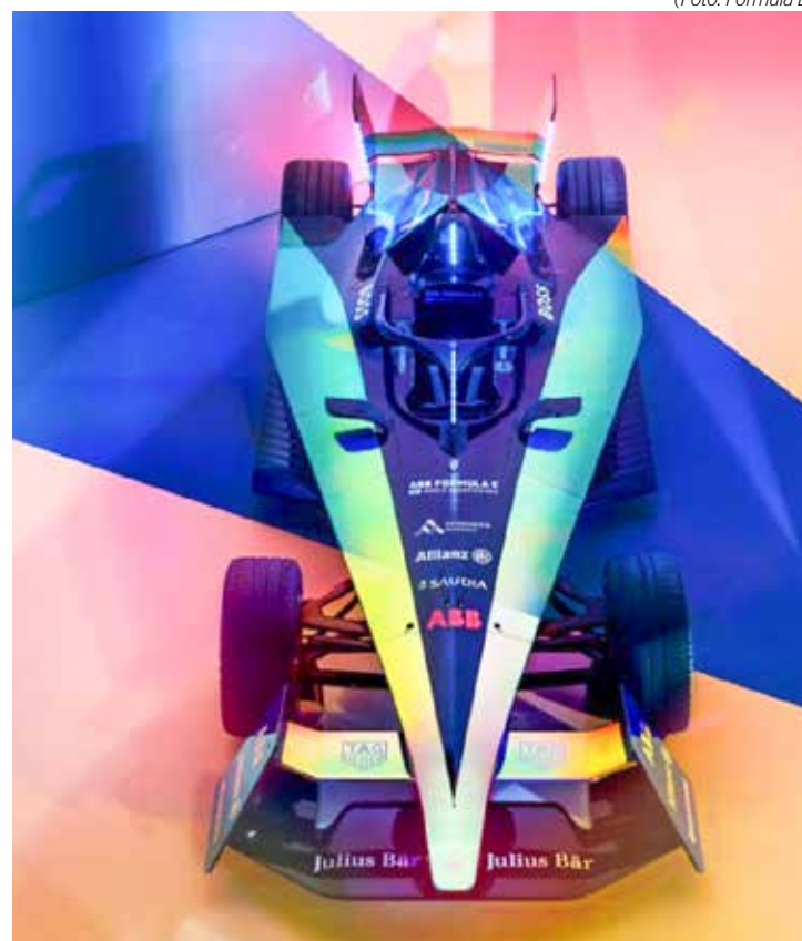
Pré-temporada será realizada este mês na Espanha, com o novo modelo Gen3