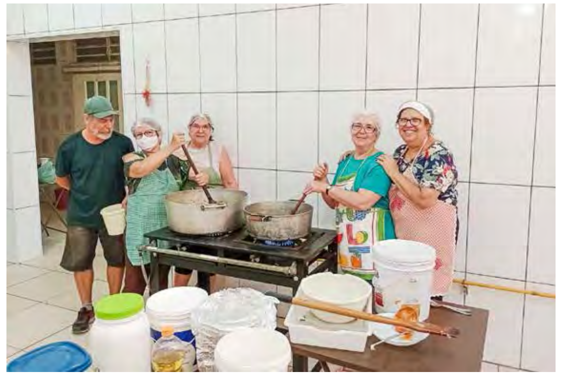
Comunidade de Santa Luzia prepara a tradicional quermesse em homenagem à padroeira

Seus restos mortais estão no Santuário de Santa Lúcia em Veneza. Sua memória é celebrada em 13 de dezembro, data de seu martírio, sendo invocada como protetora dos olhos e possuindo grande devoção popular. No Brasil, muitas são as paróquias e capelas cuja padroeira é Santa Luzia. Em Rio Claro, a Capela Santa Luzia, de quase 60 anos, fica no bairro Bela Vista e pertence à Paróquia Nossa Senhora da Saúde.