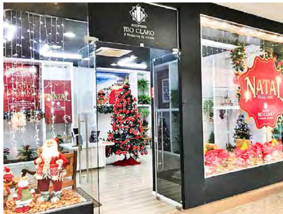
Local de trocas de cupons da Campanha de Natal realizada pelo Shopping Center

Nos dias 11 e 18 (domingo), o comércio de rua abrirá das 10 às 16 horas. Em 25 de dezembro, dia de Natal, o comércio estará fechado. As lojas reabrem na segunda-feira (26), das 12 às 18 horas. O comércio de rua funciona das 9 às 18 horas nos dias 27, 28, 29 e 30 de dezembro, e das 9 às 15 horas no sábado, dia 31.