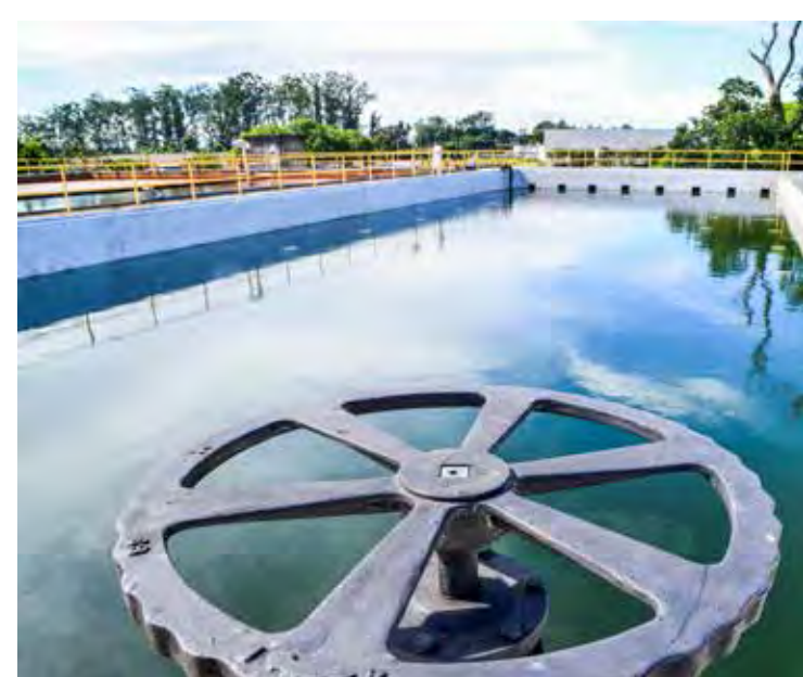
Rio Claro possui duas Estações de Tratamento de Água (ETA 1 e ETA 2) para o abastecimento da cidade.

Antes, eram utilizados cloreto férrico e cal hidratada. Desde dezembro de 2021, o Daae utiliza apenas o coagulante cloreto de polialumínio (PAC). O complemento continua sendo feito com cloro e flúor.