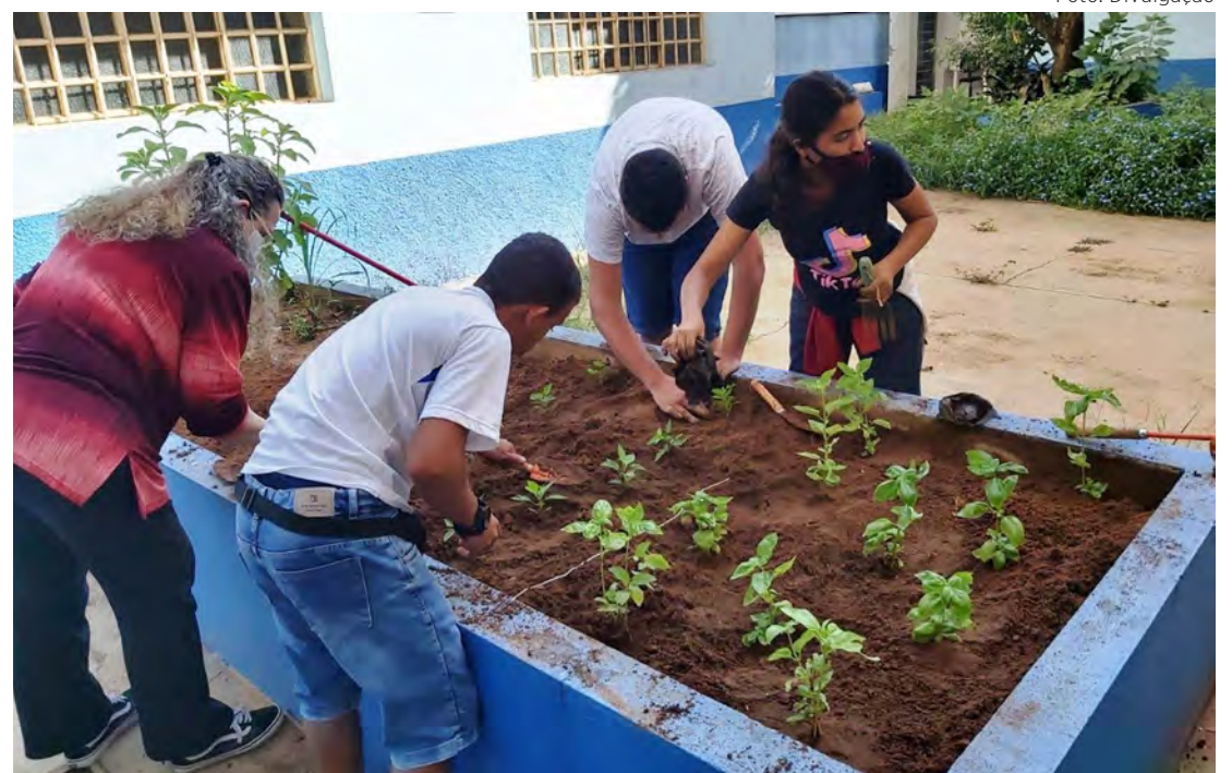
Alunos preparam a terra para o plantio das hortaliças no programa Horta nas Escolas.

Ainda neste semestre os alunos da EJA 2 da escola Marcelo Schmidt passaram a utilizar uma horta vertical como laboratório vivo para atividades pedagógicas em educação ambiental. A horta tem vasos feitos de garrafas pet fixados numa parede.