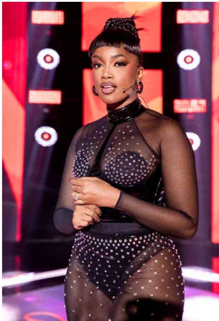
Isa confirmada para o "The Twon"

foi se acostumando a encontrar naquele horário o mesmo quadro de programação. Complicado quebrar. SBT e Record, em momentos diferentes, já tentaram trabalhar com alternativas, alcançando em algumas ocasiões bons resultados. E em outras não. Mas como tudo está mudando na televisão, a começar pela própria forma de assistir, essa pode ser a hora de rastrear novos caminhos e se utilizar, cada vez mais, da contraprogramação.