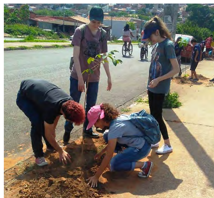
Prefeitura fez o plantio de 25 árvores no bairro Jardim Novo 2.

O plantio contemplou todo o entorno do Centro de Referência em Assistência Social (Cras) Terra Nova, da escola Rutinéia Paulino de Souza Ferreira da Silva e do Centro Social Esportivo Claretiano. Foram plantados pitangueiras e ipês brancos.