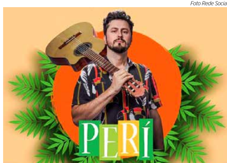
Peri no Tropicalia - no Wonder

MALADOS BAR – No domingo (27) a partir das 20h tem música ao vivo com o cantor Fabricio, com serviço de bar completo, mais informações 19.99867-4060. Endereço: Rua 1JSP nº 39, com as Av. 26 e 28 – Jardim São