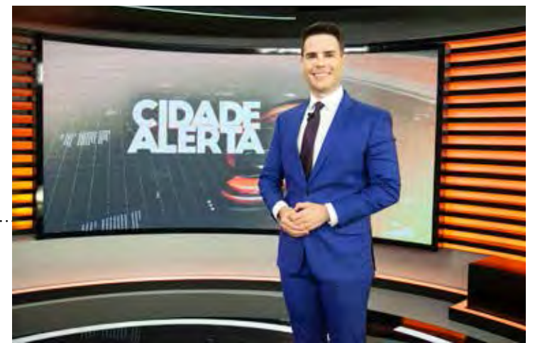
Luiz Bacci comanda o "Cidade Alerta" na Record

Dáí a necessidade de, com segurança e sem tanto medo de errar, buscar variações que possam surpreender o telespectador.