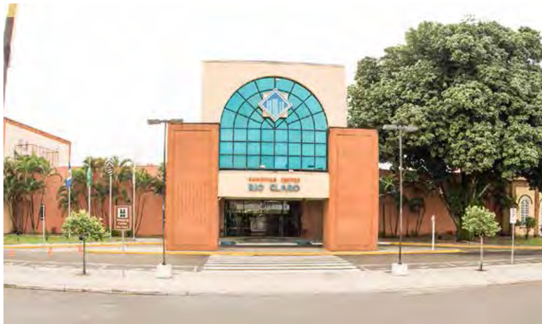
Fachada do Shopping Rio Claro na Avenida Conde Francisco Matarazzo na Vila Paulista