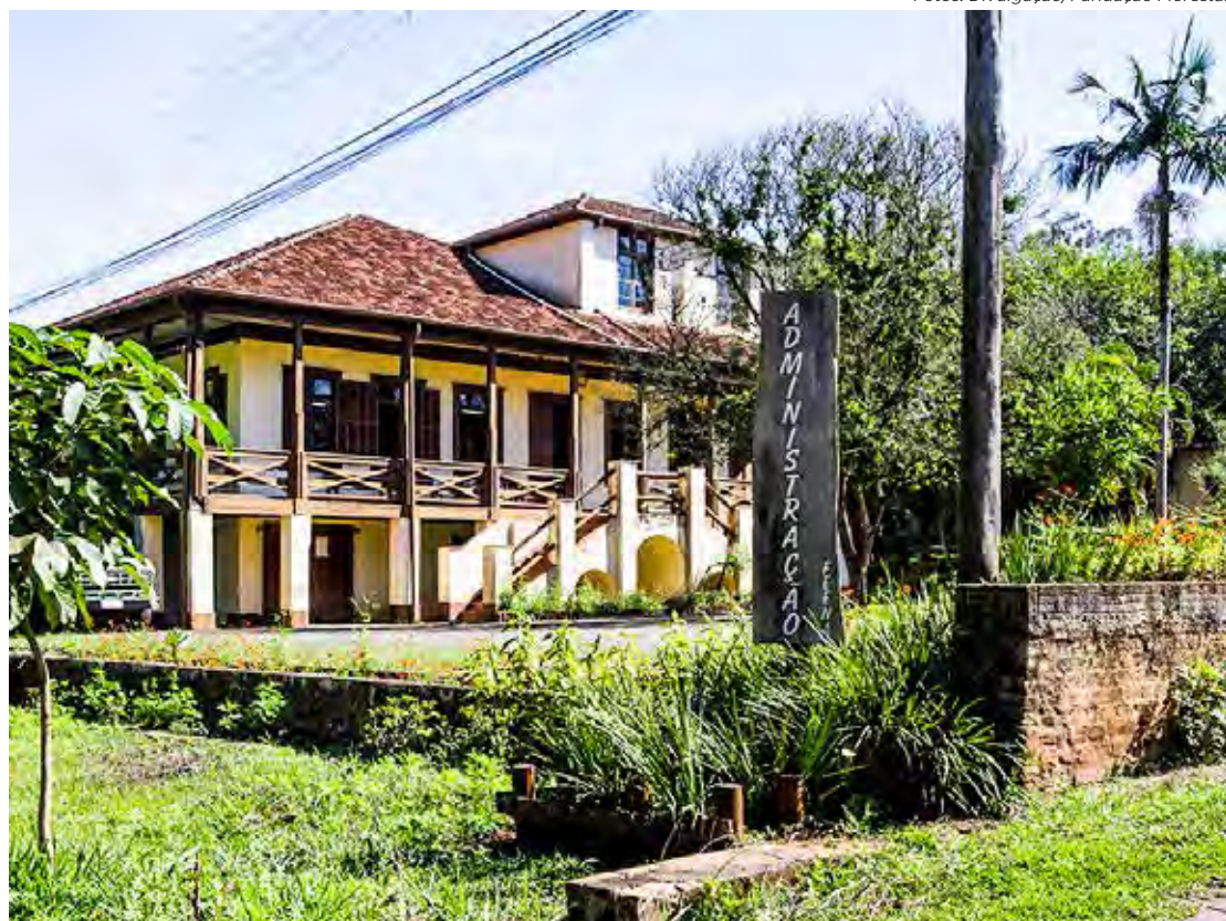
Prédio da administração na Feena passará por reforma