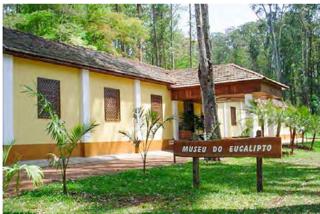
Museu do Eucalipto na Feena será um dos imóveis reformados

esgoto, assim como a instalação de internet nas edificações.