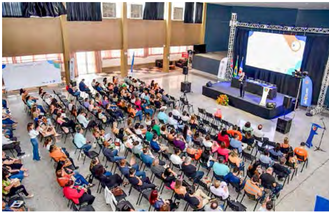
Evento aconteceu no Grupo Ginástico Rioclarense nesta quarta-feira

"Desde o início pensamos em como plantar sementes e como desenvolver projetos para os próximos anos. Ou como desenvolver políticas públicas que irão impactar localmente nos próximos 30 anos a cidade de Rio Claro. Os palestrantes trouxeram implementações e ideias que nos ajudarão em um futuro muito próximo a construir