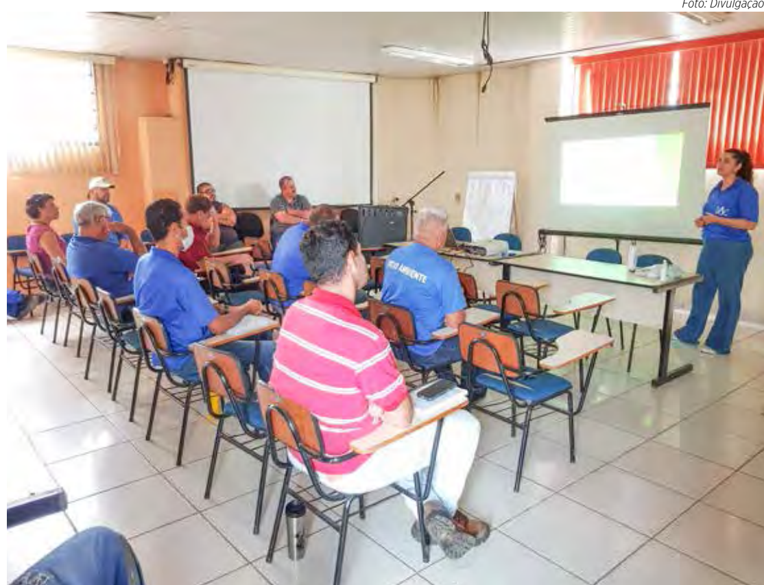
Daae realiza treinamento para os novos integrantes da Cipa

Com carga horária de 20 horas, o treinamento dos “cipeiros” teve início na segunda-feira (21), sendo retomado na quarta-feira (23) e acontece até dia 28 de novembro, no Centro de Treinamento da autarquia.