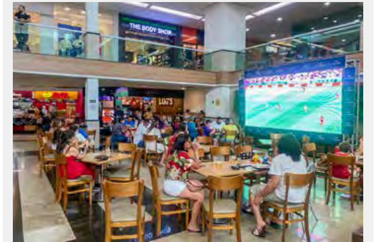
Dois telões foram instalados na praça de alimentação do shopping