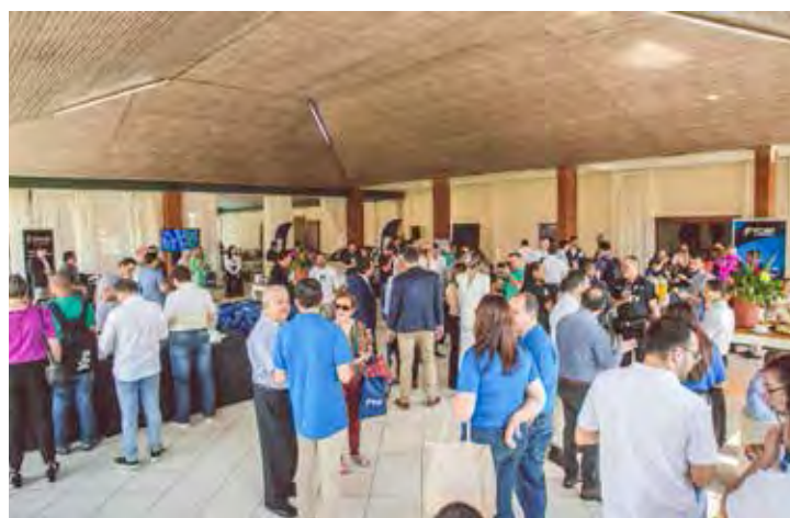
Entre os temas em debates no FORP Summit 2022 estavam "Segurança: um desafio integrado"; "Como podemos transformar os municípios com a segurança eletrônica partindo da modernização da infraestrutura existente?"