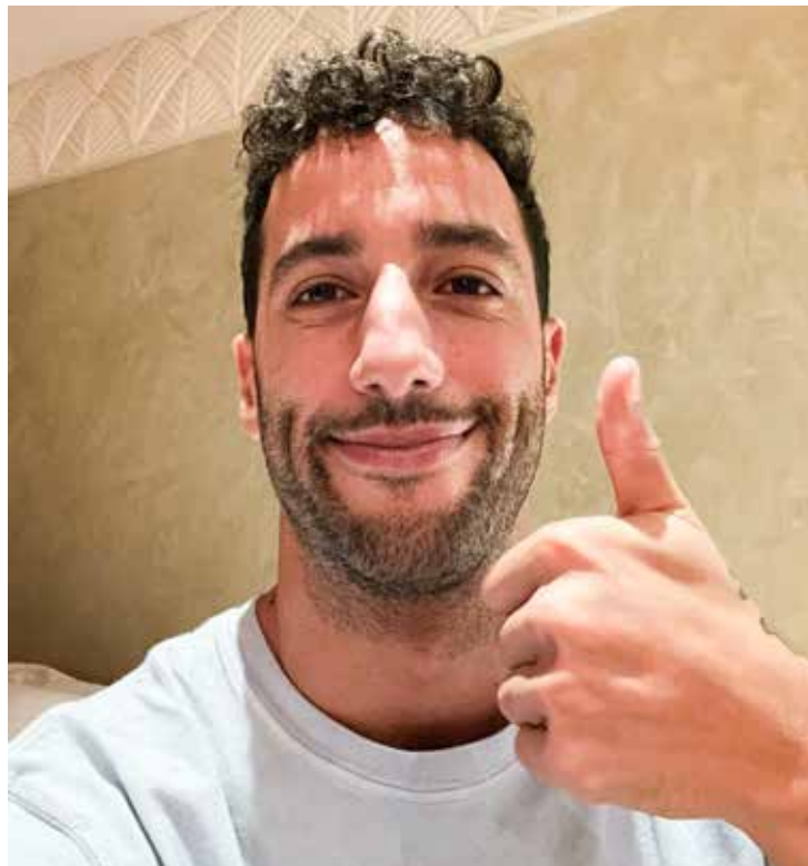
Australiano volta à equipe na qual conquistou sete das suas oito vitórias

priria o papel de reserva na Red Bull e AlphaTauri no próximo ano.