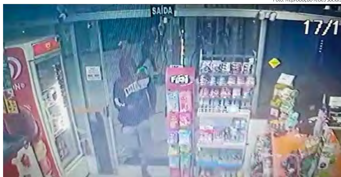
Criminosos fizeram o frentista deitar no chão para entrar na conveniência

Um deles fica perto das bombas e o outro entra na conveniência com um facão. Ele procura a caixa