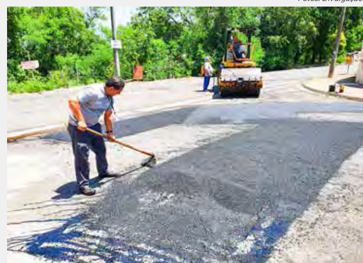
Serviço de tapa-buracos no Jardim Panorama