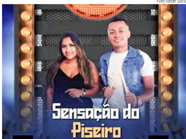
Sensação do Piseiro no Bar e Lanchonete Patty e no Bar do Zé Amorim

PARÓQUIA BOM JESUS – Neste sábado (19) a partir das 14h e no domingo (20) a partir das 11h, no salão de festa do Bom Jesus tem “Festa do Milho” com comida típica como: Pamonha, Milho Cozido, Curau, Croquete de Milho, Bolo de Milho, Suco de milho, sorvete de