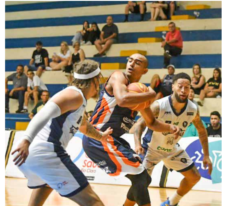
Apesar do placar bastante favorável a Rio Claro, jogo foi pegado o tempo todo