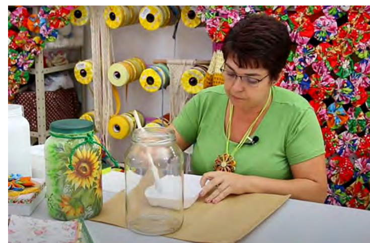
Artesanato Sustentável

A produção de peças e objetos de maneira manual é a característica mais marcante do artesanato sustentável, tudo tem uma ligação do homem com o meio ambiente