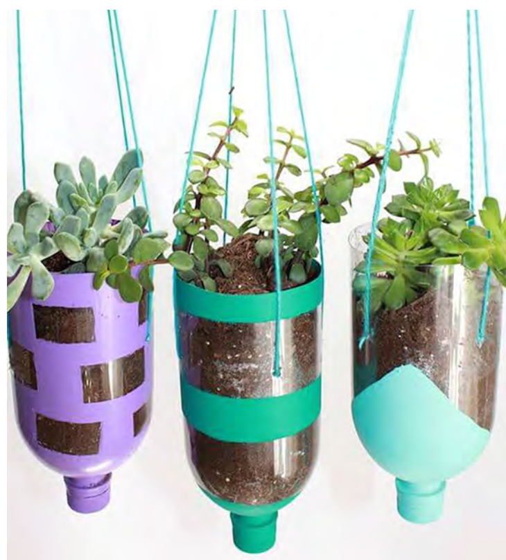
Jardim Suspense. Imagem do Portal Revista Artesanato

As peças podem ser vendidas em lojas, feiras, eventos culturais, redes sociais, etc. O meio ambiente está sendo cada vez mais beneficiado através desse trabalho diário e criativo.