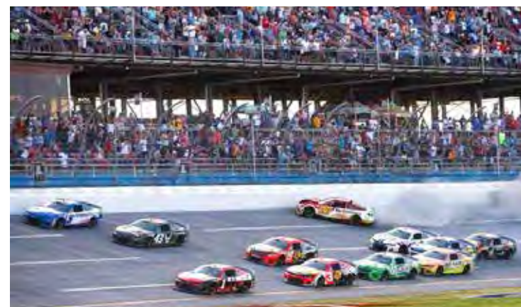
Parceria entre NASCAR e Sprint Race dá origem a competição brasileira com chancela da maior categoria do automobilismo norte-americano

A NASCAR Brasil - Sprint Race, como oficialmente se chama, começa em março, no Rio Grande do Sul. Haverá 8 corridas nos principais circuitos do país, com as etapas de