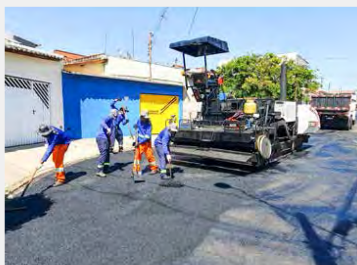
Serviço de recapeamento no bairro Mãe Preta

A prefeitura realizou ação de tapa-buracos no Jardim Panorama nesta sexta-feira (18). Equipe da Secretaria Municipal de Obras trabalhou em trechos de várias vias do bairro. Os serviços de reparo asfáltico da prefeitura atendem todas as regiões e fazem parte de uma série de ações que incluem recapeamento e suavização de valetas.