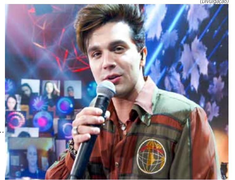
Luan Santana, um dos mais tocados do País, passa longe da Antena 1