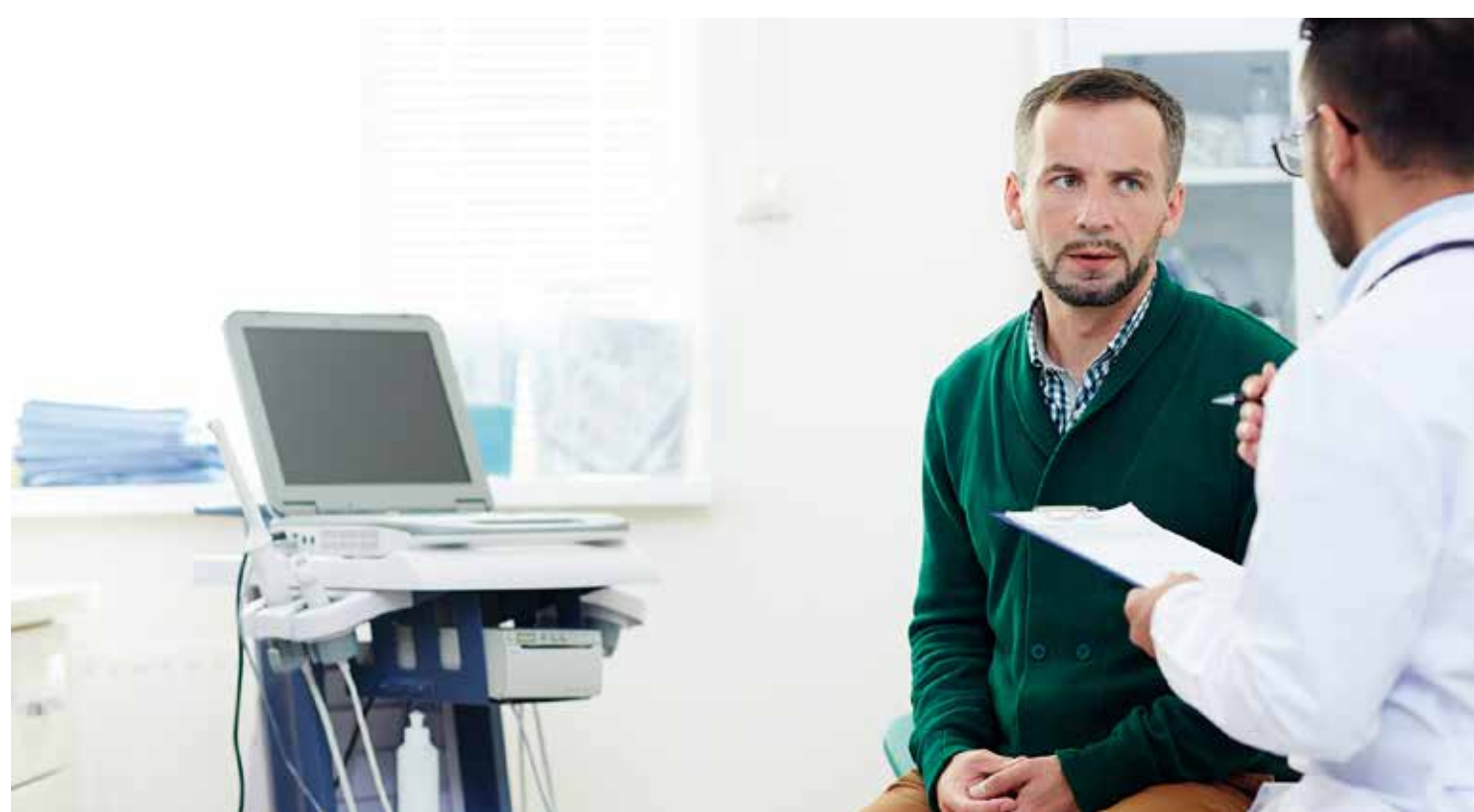
Município oferece atendimento voltado para a saúde do homem

A busca ativa se dá por meio da central de acesso avançado, que faz o contato com o paciente para o agendamento de consultas na unidade de saúde de referência.