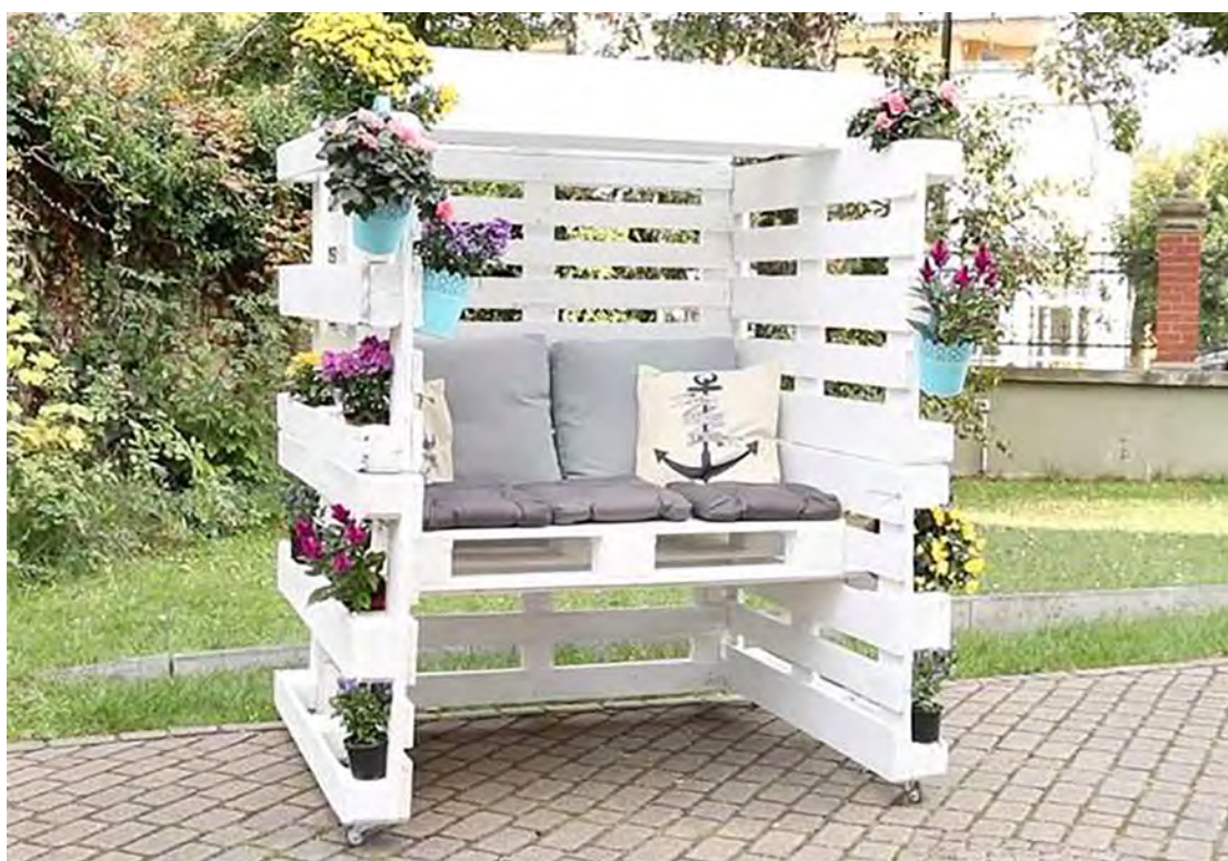
Paletes em Jardins.

Produzir arte através de matéria-prima muitas vezes disponível em grande escala na natureza é uma forma de contribuir com o meio ambiente. O trabalho artesanal é muito lindo, criativo e diferente dos demais, por sua forma de ser produzido, dele também muitas tribos e povos tiram seu sustento financeiro.