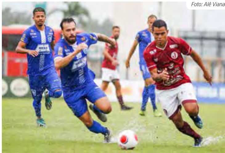
Rio Claro FC vai à São Paulo, encarar o Juventus

As equipes locais terão pela frente na 1ª rodada adversários dos mais tradicionais do futebol paulista. O Velo estreia diante da A.A. Ponte Preta, no estádio Benitão. E o Rio Claro FC