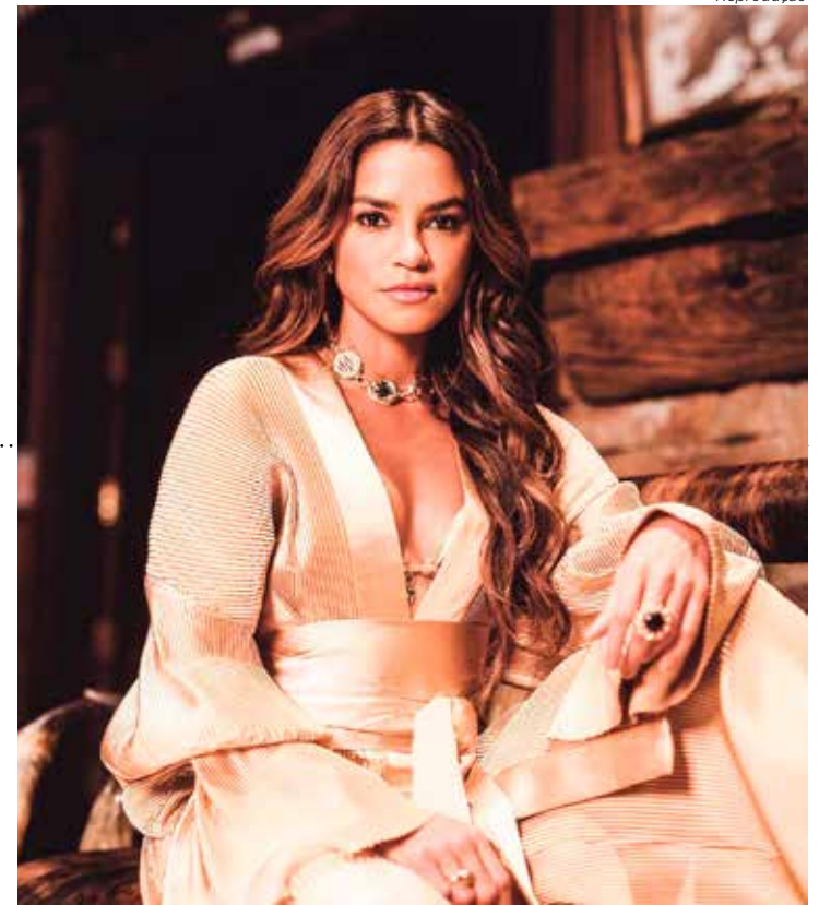
Lucy Alves é estrela da série "Só Se For Por Amor", na Netflix