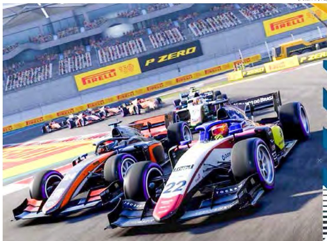
Última etapa da F2 será neste final de semana