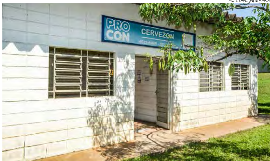
Fachada do prédio do Procon na subprefeitura do Cervezão

Rua M-15, 411. Telefones (19) 3523-5985 e (19) 3532-1550. E-mail procon.crc@gmail.com .