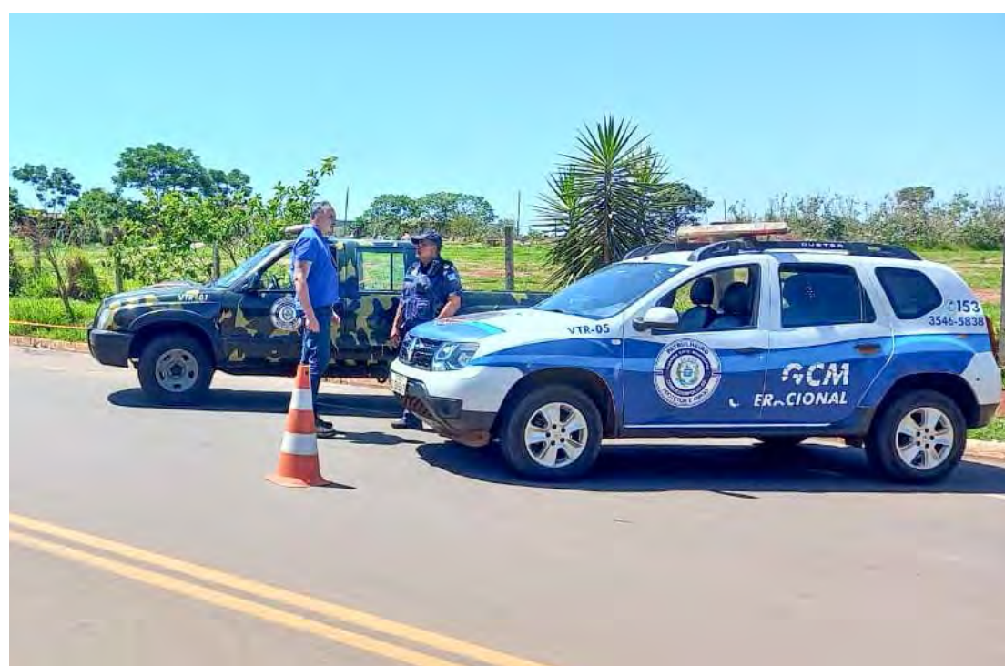
Vítima relatou à polícia que o rapaz já a perseguiu e tinha intenção de matá-la

Também informou que escondeu pertences em uma mata próxima de onde foi detido. No