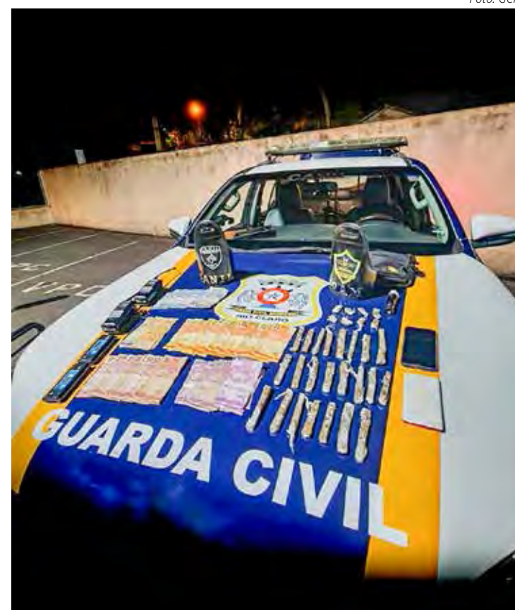
Material apreendido pela Guarda Civil Municipal durante abordagem

Os rapazes foram conduzidos ao Plantão Policial para registro da ocorrência, mas foram liberados em seguida. As drogas foram apreendidas.