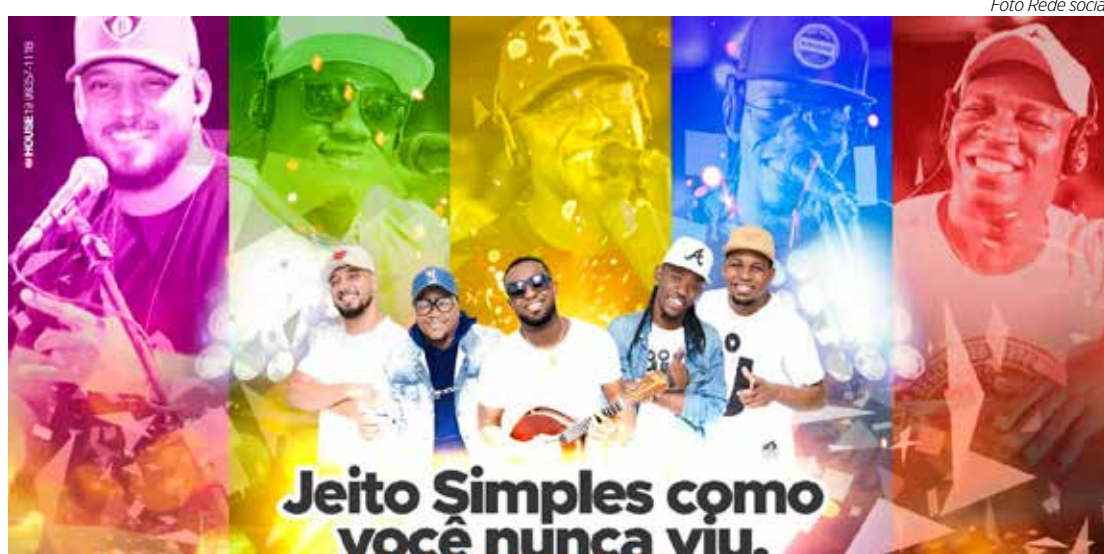
Jeito Simples na Escola de Samba Grasifis

CANECA DOCE – No domingo (20), a partir das 19h tem música ao vivo com o cantor André Heller o Bruto do Peisero. Endereço: Rua 1 nº 519 – Jardim Novo I