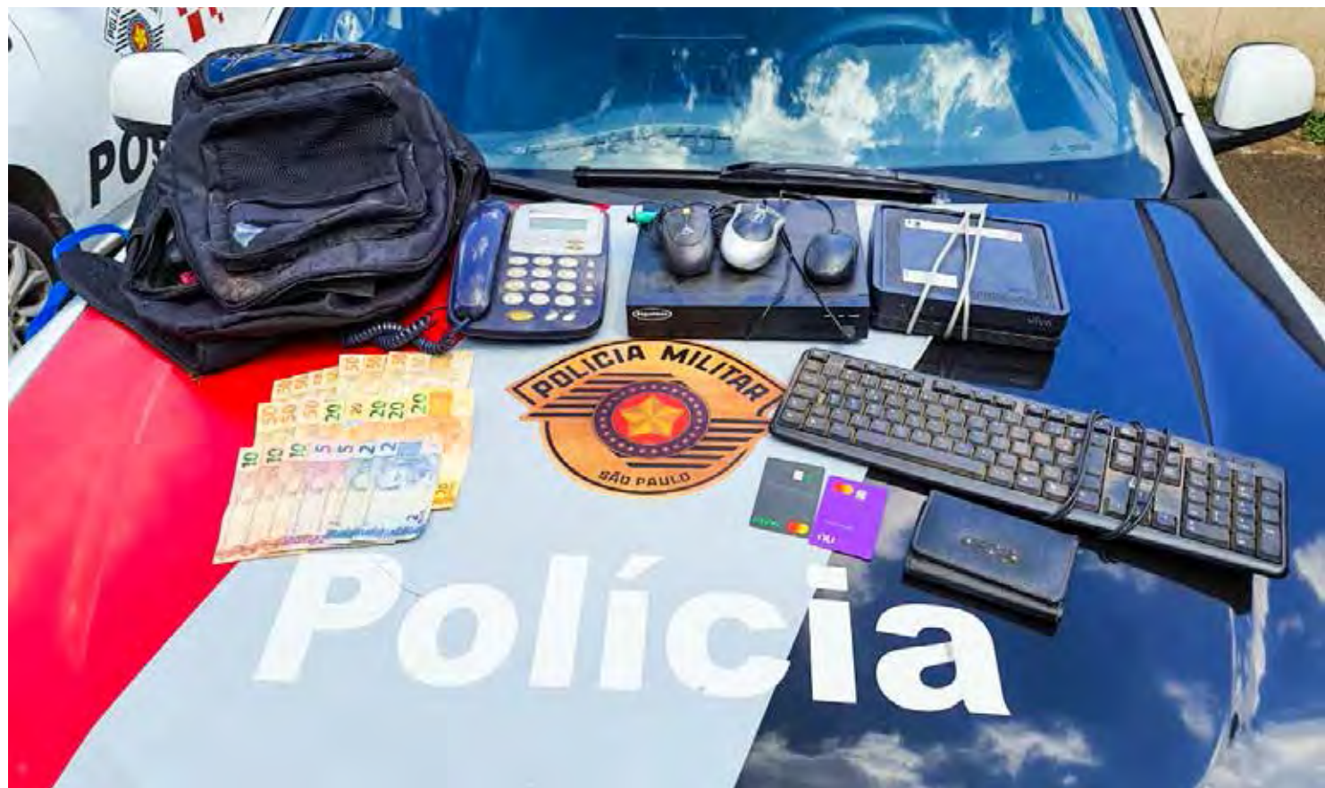
Trio estava levando R$ 694 em dinheiro e vários pertences da vítima

Os três criminosos foram conduzidos ao Plantão Policial e permanecem à disposição da Justiça. Os bens foram restituídos para o proprietário.