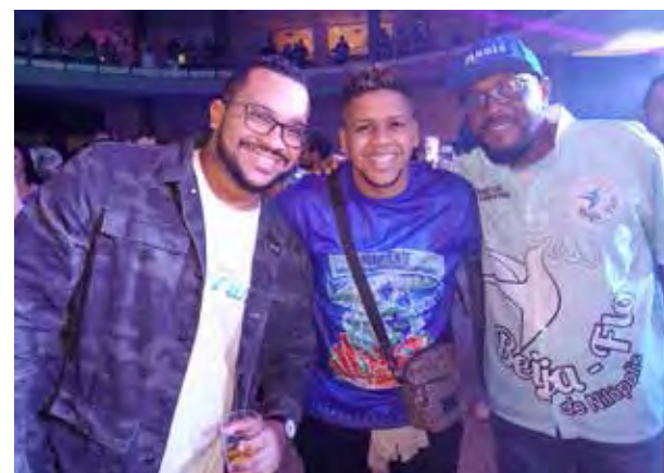
Integrantes da Beija Flor esbanjando alegria e simpatia no salão