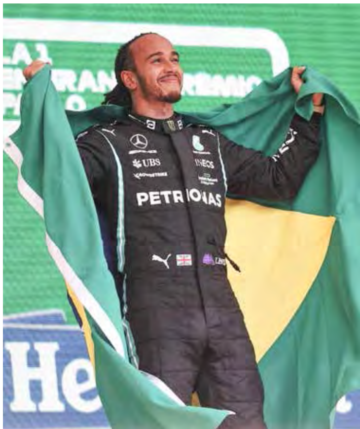
Hamilton e o Brasil estão conectados há um longo tempo