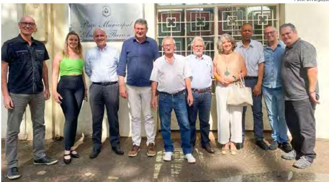
Encontro aconteceu na prefeitura de Cordeirópolis