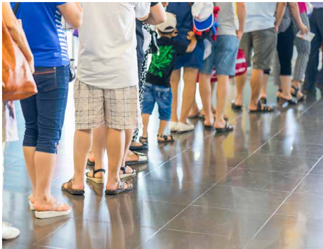
Clientes aguardam na fila por atendimento em agência bancária

Agora, esses valores estão sendo revistos por meio de proposta dos vereadores Rafael