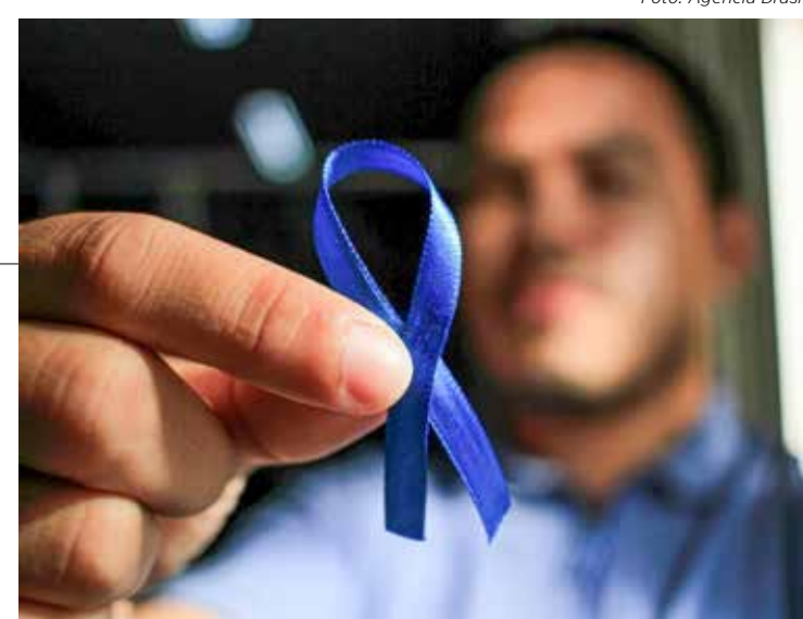
Campanha Novembro Azul visa conscientizar os homens sobre a importância prevenir o câncer de próstata

A iniciativa internacional "Novembro Azul" teve origem na Austrália no ano de 2003 e foi comemorado no Brasil pela primeira vez em 2008. O "No-