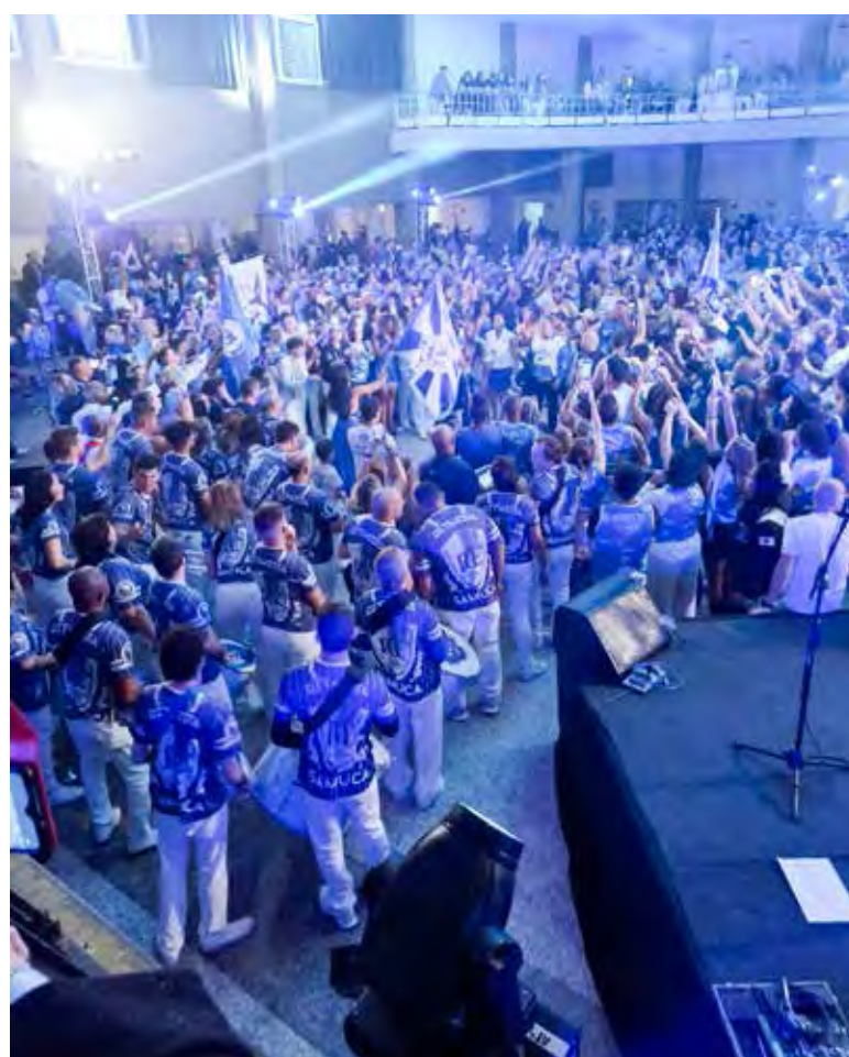
Bateria fazendo o salão tremer no momento mais esperado