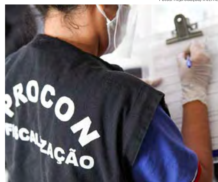
Câmara cobra maior fiscalização do Procon para fazer valer a Lei das Filas