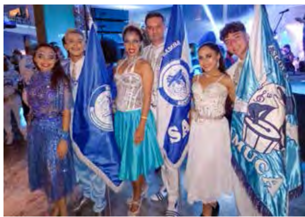
Entre giros e evoluções eles dão o show: mestres-salas e porta-bandeiras da escola de Samba Samuca

e branco enfeitou a todos que lá estiveram e a noite contou com homenagens à velha guarda da escola, à família samuqueira que sempre auxilia no crescimento e acompanhou a escola durante todos esses anos de glória da associação.