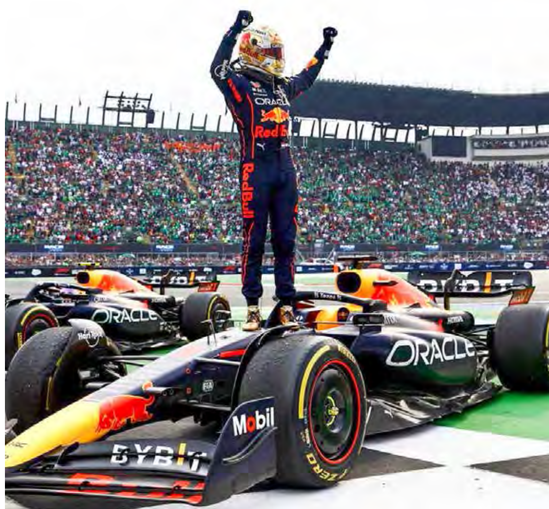
Com o título da temporada 2022 de Fórmula 1 já garantido, Max Verstappen venceu o GP do México