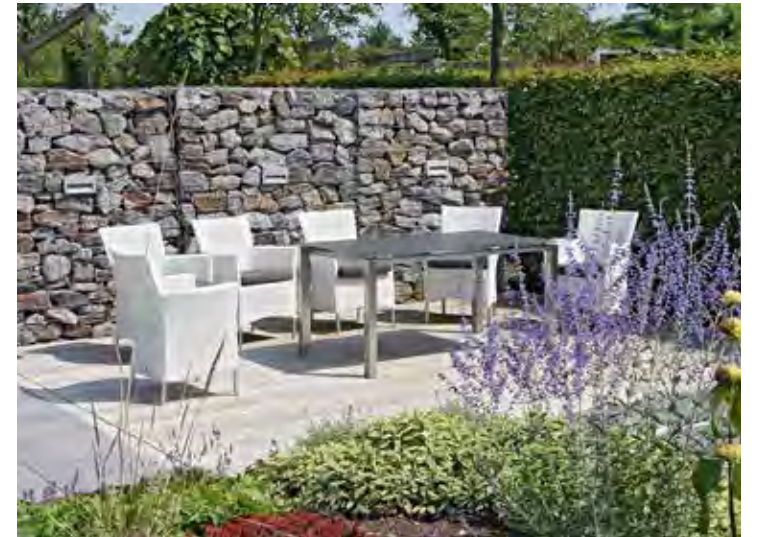
Os muros de pedra são resistentes, super decorativos e charmosos

lizadas dentro de condomínios residenciais. Geralmente essas condições permitem que a casa permaneça totalmente aberta, ou seja, sem muros, cercas ou portões limitando seus espaços.