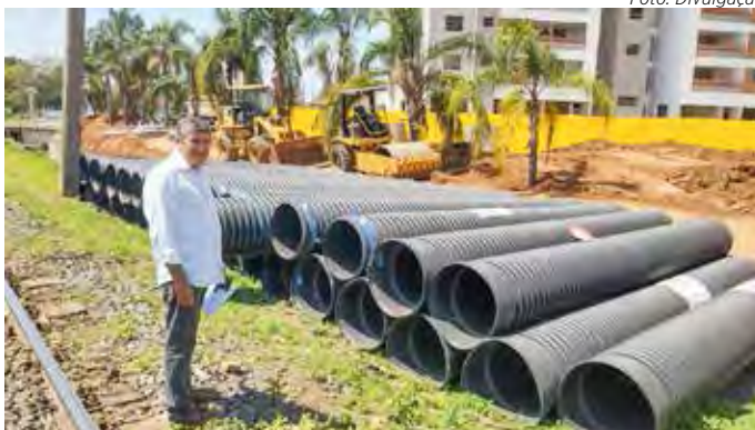
Obra de implantação de galerias de águas pluviais na Avenida 11