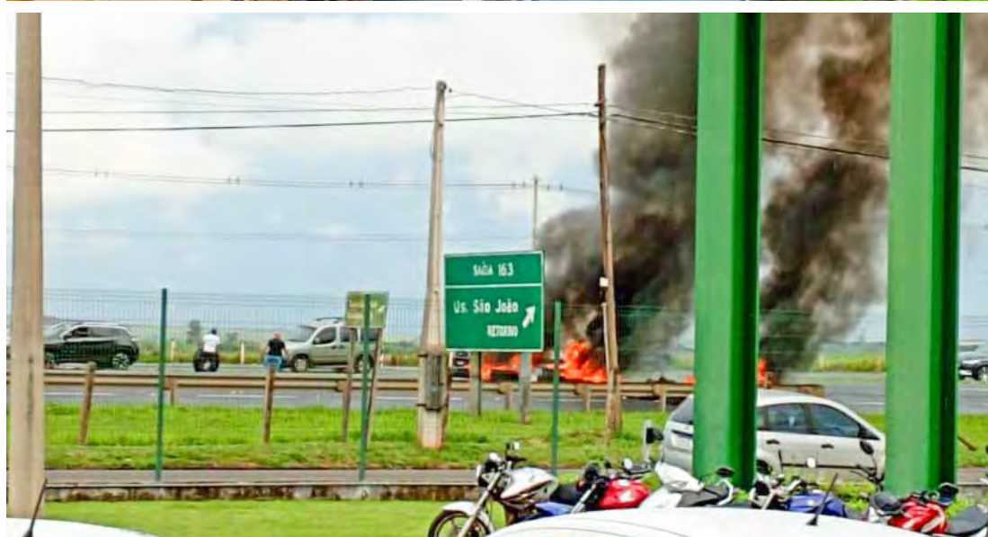
Equipes da concessionária Arteris Intervias trabalharam para a sinalização das estradas

sentido capital, no km 238, perto do posto Graal. Caminhões bloquearam a pista e o fogo foi ateadado em pneus. Os bombeiros