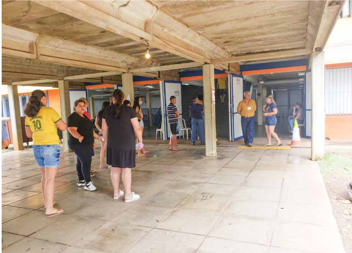
Eleitores aguardam para votar na escola Caic em Rio Claro

O resultado repete o que ocorreu no primeiro turno. Bolsonaro vence a disputa contra Lula pelo menos em Rio Cla-