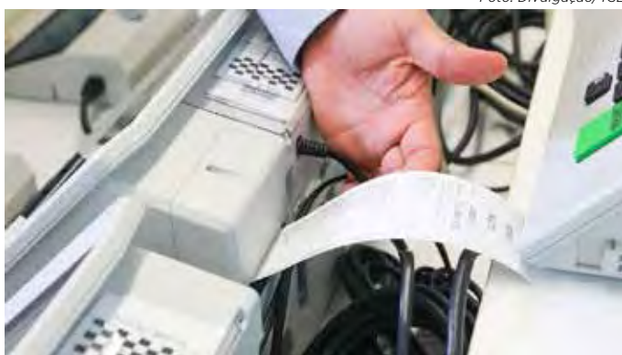
Emissão de boletim de urna