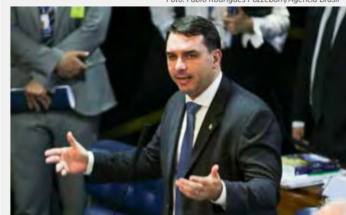
O senador Flávio Bolsonaro (PL-RJ), filho do presidente Jair Bolsonaro (PL)