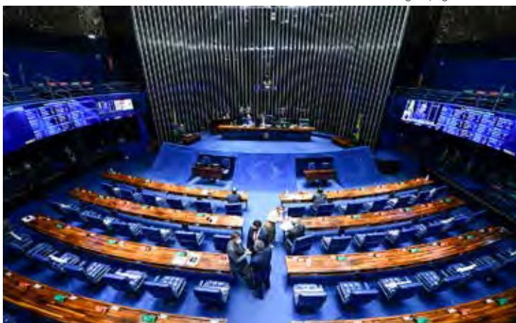
PL terá a maior bancada no Senado Federal na próxima legislatura