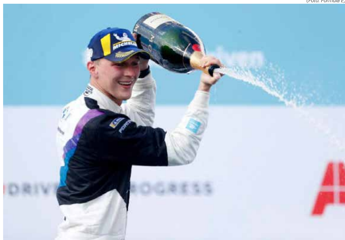
Maximilian Günther comemora vitória em Nova York, sua última até aqui na Fórmula E