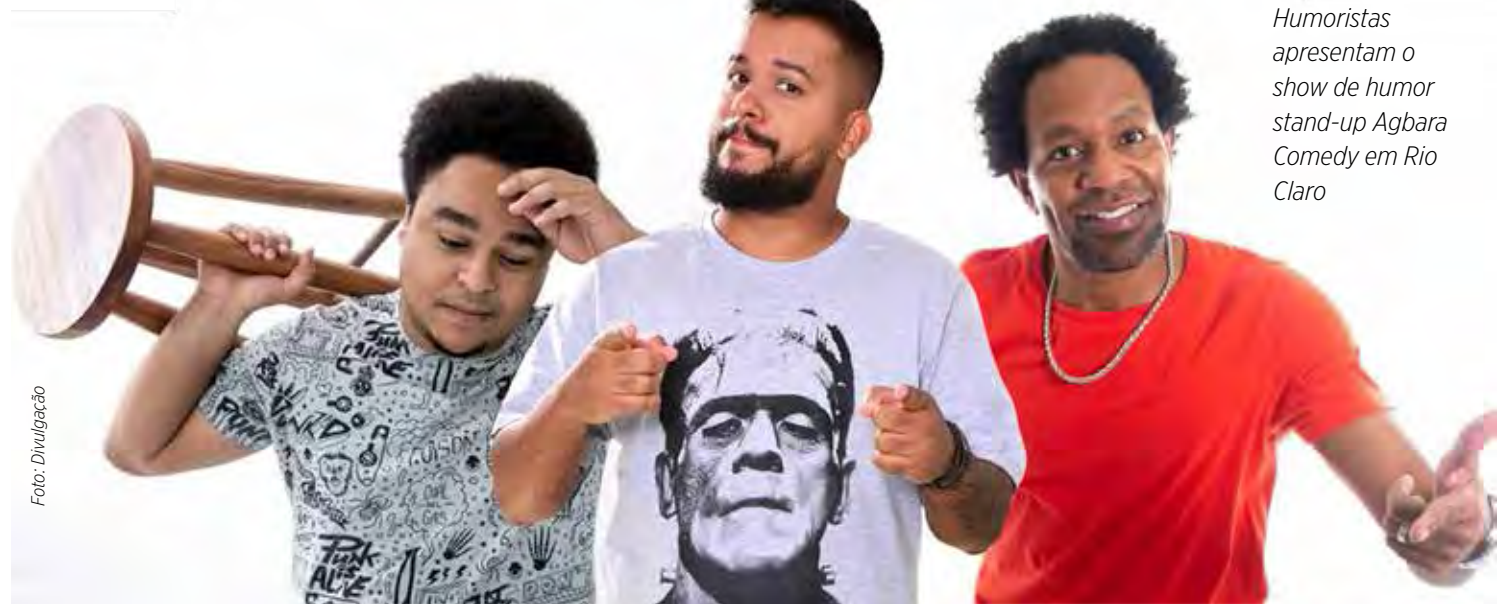
Humoristas apresentam o show de humor stand-up Agbara Comedy em Rio Claro