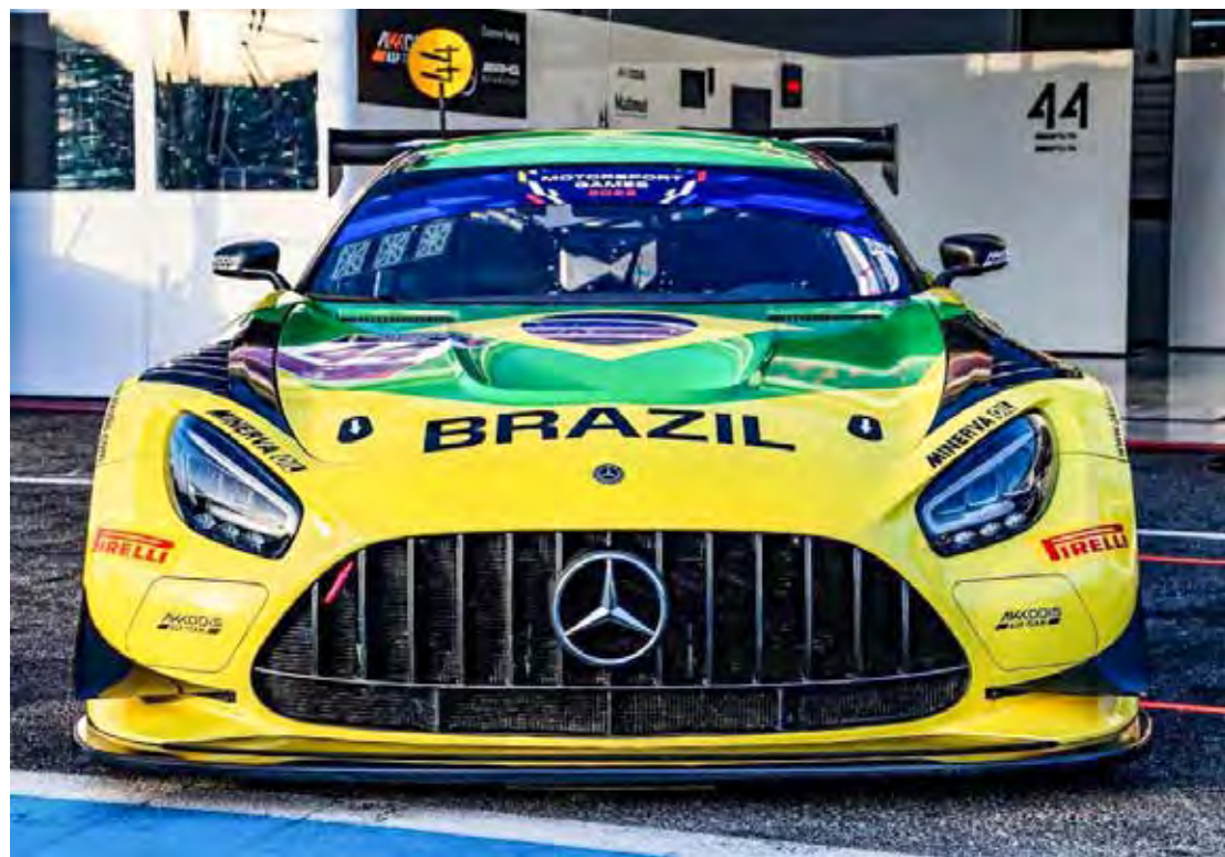
Piloto da Stock Car faz corrida de recuperação e acaba prova como melhor piloto Silver do evento

GT Sprint na sexta posição. Ele ficou a menos de meio segundo do top 5. Bruno levou para casa o troféu "Silver Cup", destinado ao melhor piloto de sua graduação no evento de encerramento na "olimpíada do esporte a motor".