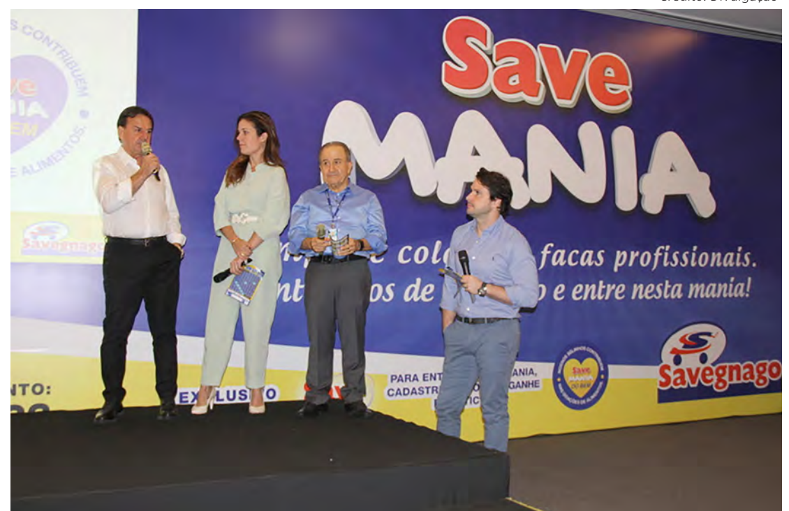
Campanha Save Mania foi lançada na quarta-feira (26) em Ribeirão Preto.

Cada cartela terá a capacidade máxima de 110 selos, sendo que para cada produto há uma quantidade de selos necessária para conquistar a compra com descontos.