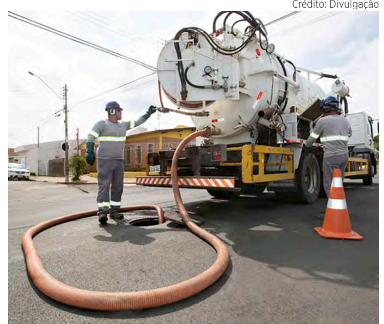
Guichê de atendimento de unidade de saúde em Rio Claro.

A BRK incentiva a população a conhecer mais sobre a importância do uso correto das redes de esgoto. Acesse https://blog.brkambiental.com.br/esgoto-nao-e-lixo para mais informações. E a concessionária também disponibiliza palestras educativas sobre esse tema. Interessados podem solicitar o agendamento à equipe de Sustentabilidade pelo e-mail: sustentabresp@brkambiental.com.br.