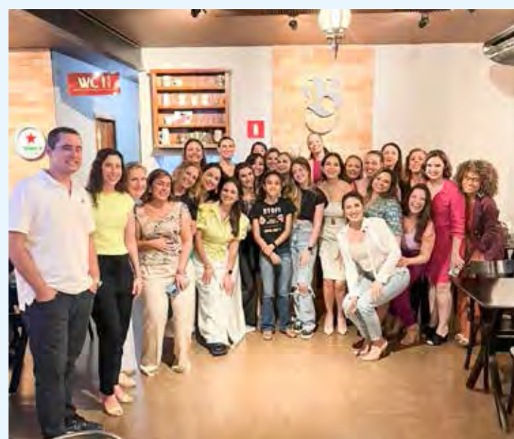
Empresárias se reuniram na Birreria na última semana

A Empresa Júnior Puríssimo é uma associação sem fins lucrativos, especializada em tecnologia e Cultura Maker, criada com o objetivo de fomentar o aprendizado prático dos educandos, onde o professor inspira e os alunos lideram; alunos assumem problemas reais e não apenas simulações.