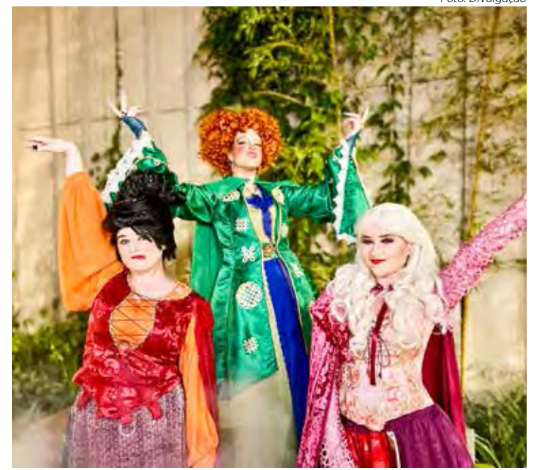
Personagens temáticos do Halloween do Shopping Rio Claro

As atividades são realizadas em parceria com a Rota da Arte, responsável pela decoração temática, e Influx, que no sábado estará com personagens e fará distribuição de doces.