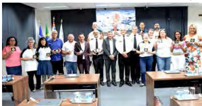
Legislativo entregou medalhas aos capelães na noite de terça-feira (25)