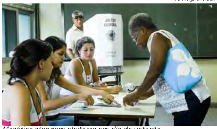
Mesários atendem eleitores em dia de votação