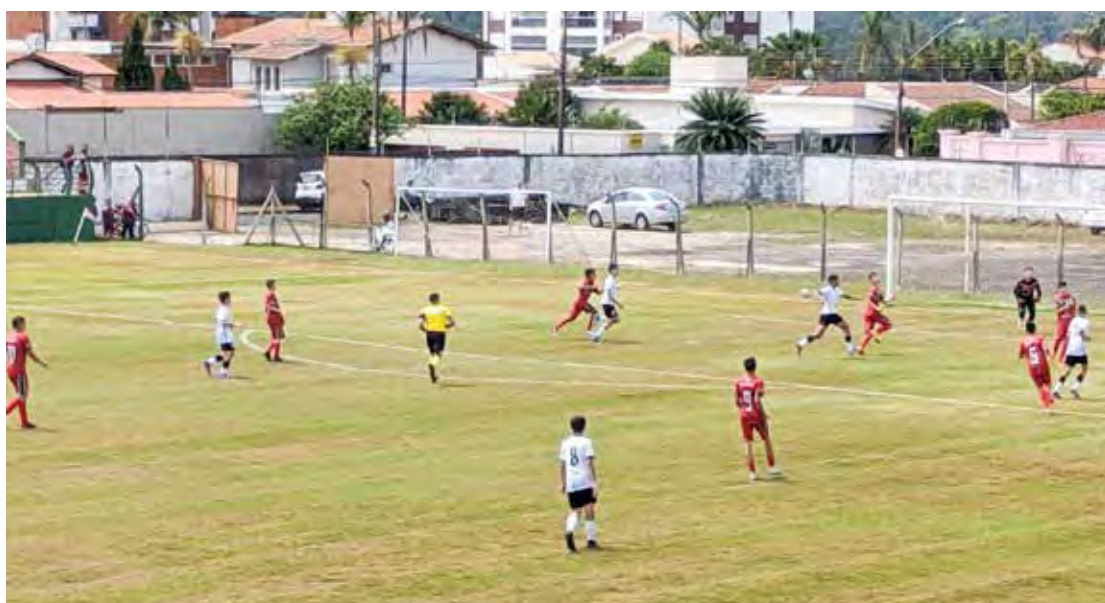
Manhã de futebol no Benitão neste sábado