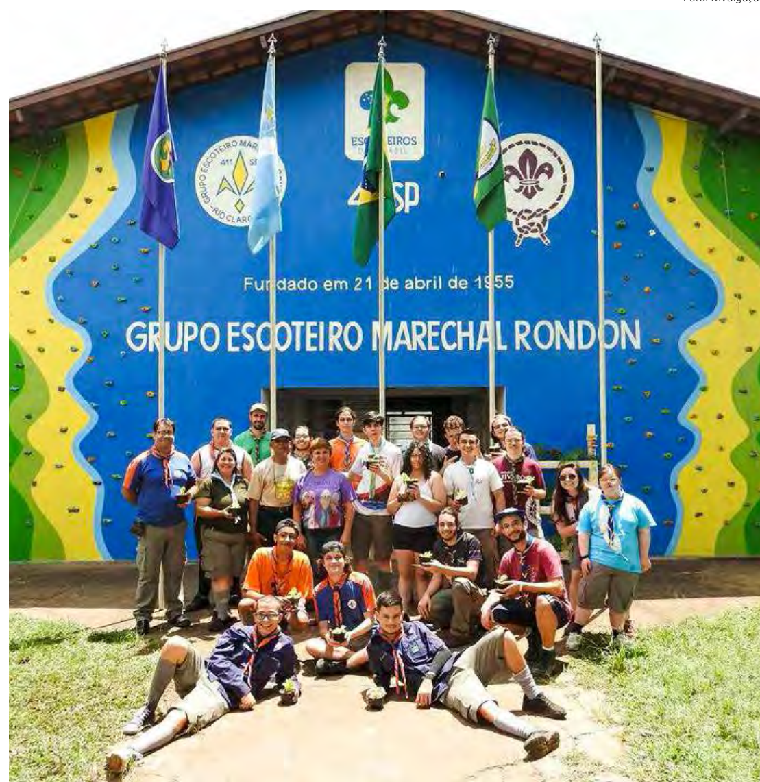
Pioneiros, seniores e guias do Grupo Escoteiro Marechal Rondon