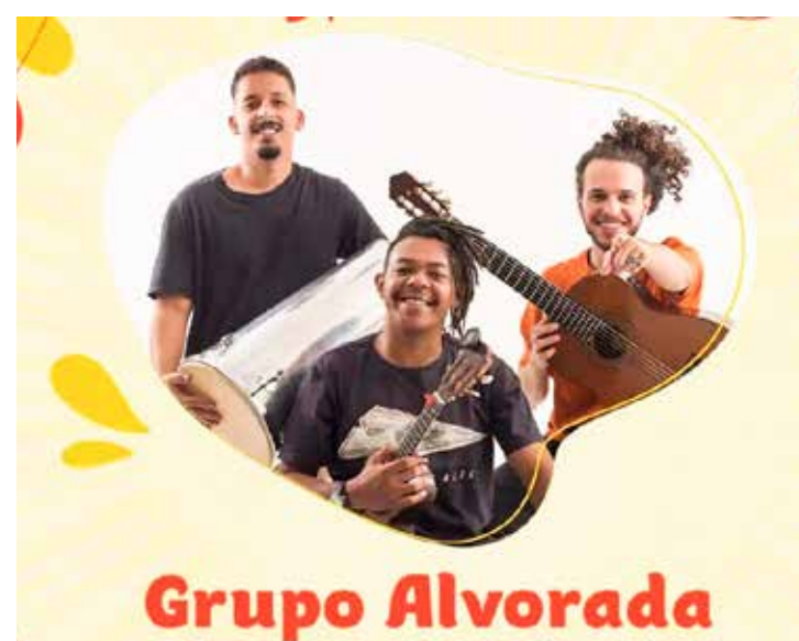
Grupo Alvorada de Campinas no Madureira