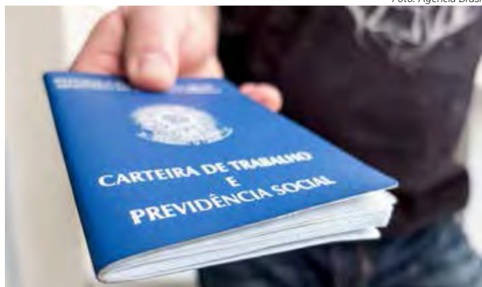
Eleitor pode usar carteira de trabalho para votar