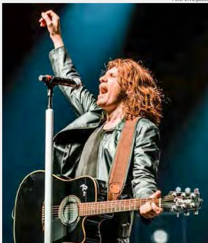
A banda “These Days - Bon Jovi Cover” apresenta os hits antigos e atuais do artista norte-americano