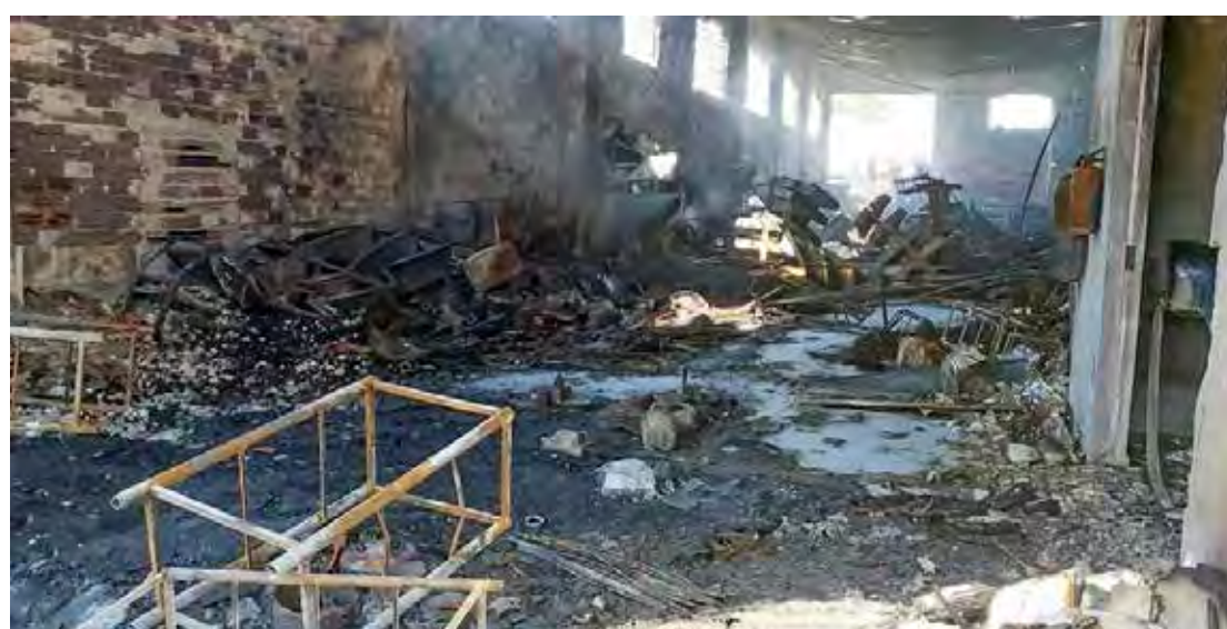
Caminhões-pipa de usinas da região também ajudar a combater as chamas