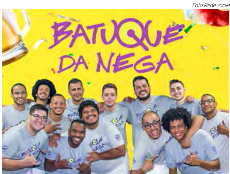
Batuque da Nega no Paradise Beach Sports