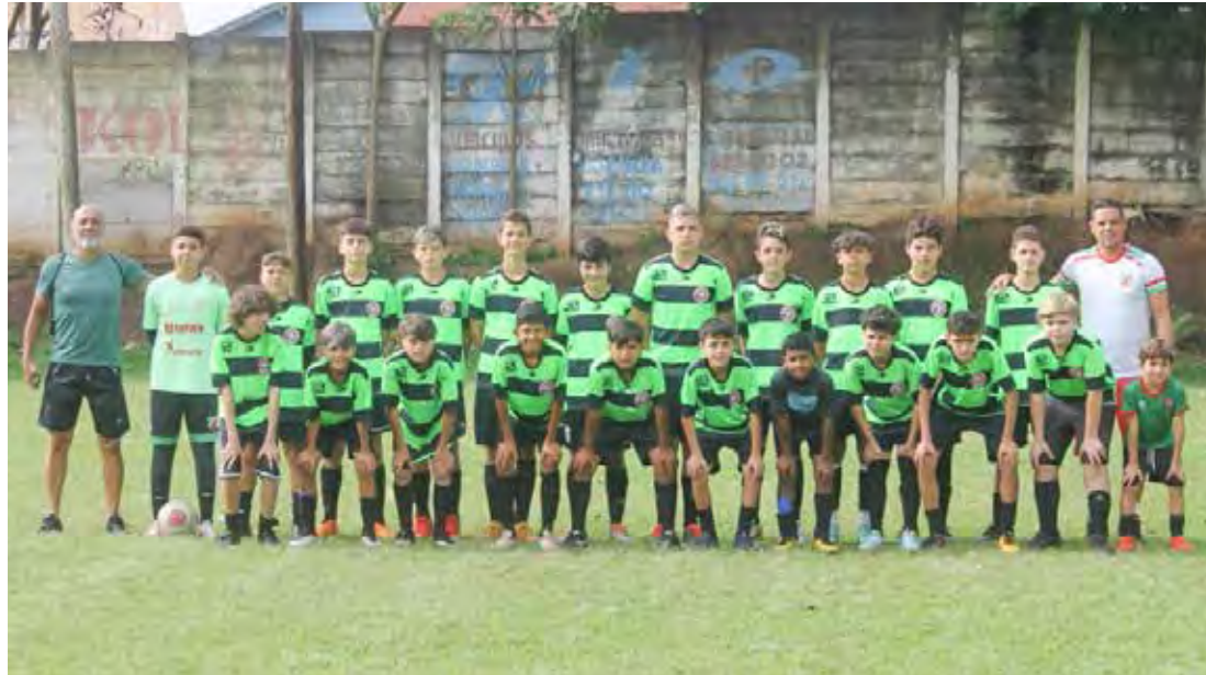
Escolinha do Cris CR10 Campeão Sub-15 Dente de Leite 2022

O final de semana reserva mais emoções no Dente de Leite rio-clarense. Amanhã (29), também no 3º Distrital, acontecem as semifinais das categorias Sub-9, Sub-11 e Sub-13.