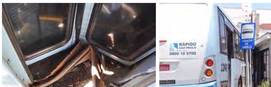
Acidente causou danos materiais tanto para a empresa de ônibus como para a moradora da casa