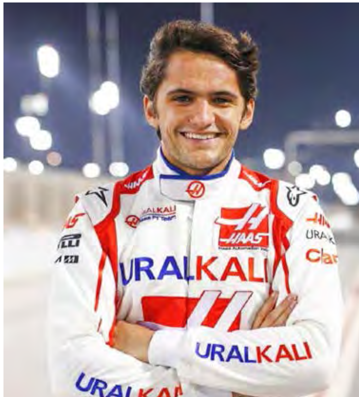
Brasileiro já venceu corridas no Autódromo Hermanos Rodríguez quando competiu na World Series