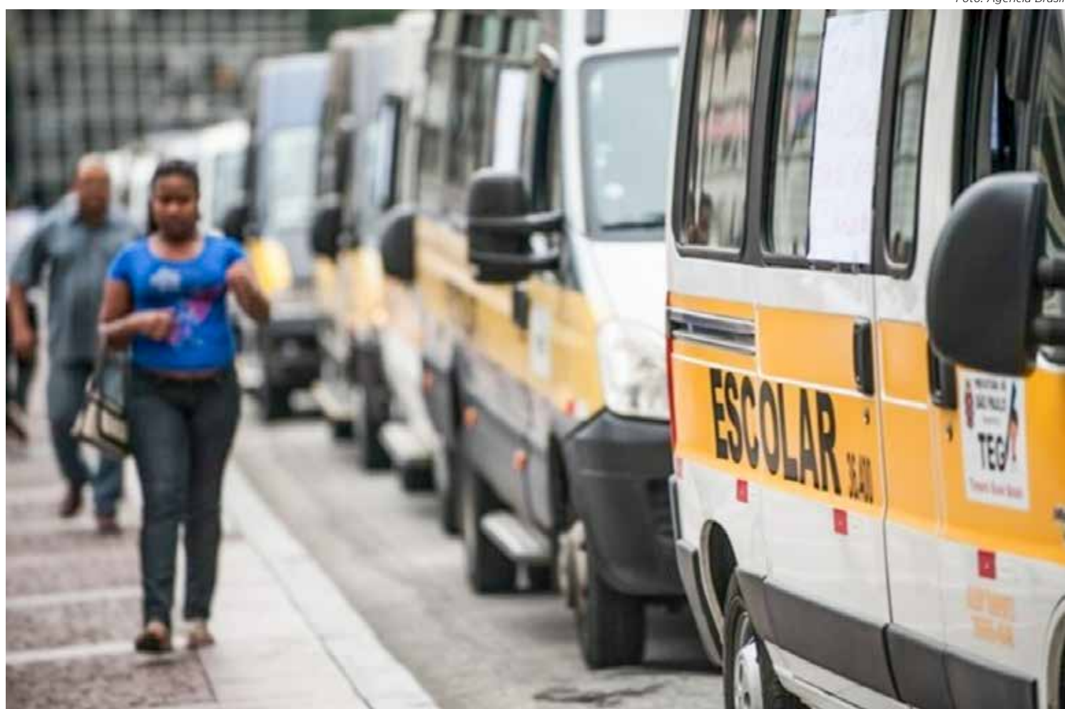
Veículos do transporte escolar precisam atender os requisitos estabelecidos pela legislação

“Essa é a oportunidade para quem quiser se tornar um transportador de escolar de forma legalizada. O processo acontece por meio de oferta pública, ou seja,