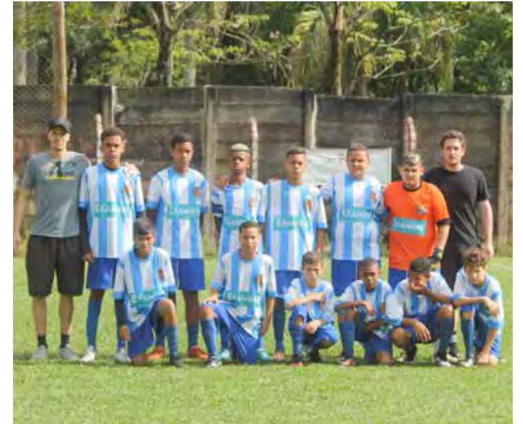
Real FC Sub-15 Vice-Campeão Sub-15 Dente de Leite 2022