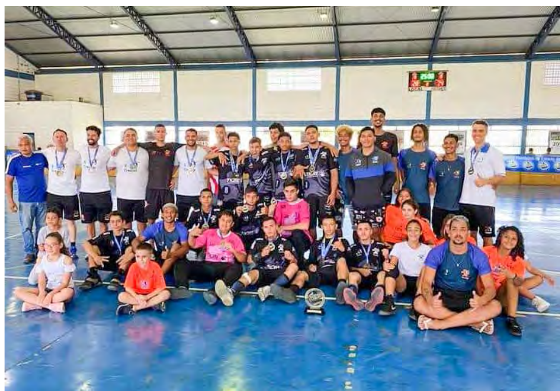
Delegação rioclarense de Handebol conquista resultados importantes

Categoria sub-16 masculina ficou com o título e sub-16 feminina levou o bronze