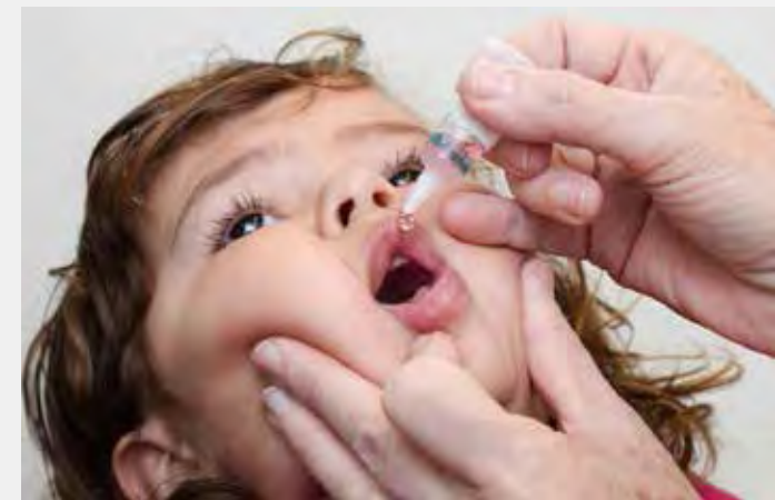
Vacina contra a pólio é destinada a crianças 1 a menores de cinco anos