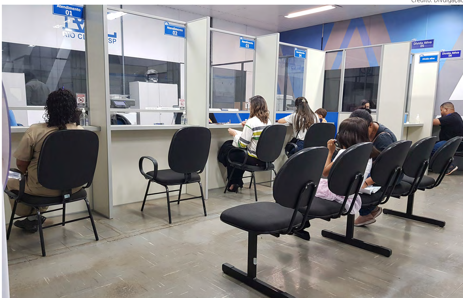
Setor de atendimento na sede do Daae na Avenida 8-A, no bairro Cidade Nova.

O atendimento presencial, também retorna na quinta-feira (3), a partir das 8 horas. Realizado de segunda à sexta até às 15h30, tem sido feito somente por agendamento, através do telefone 0800-505-5200.