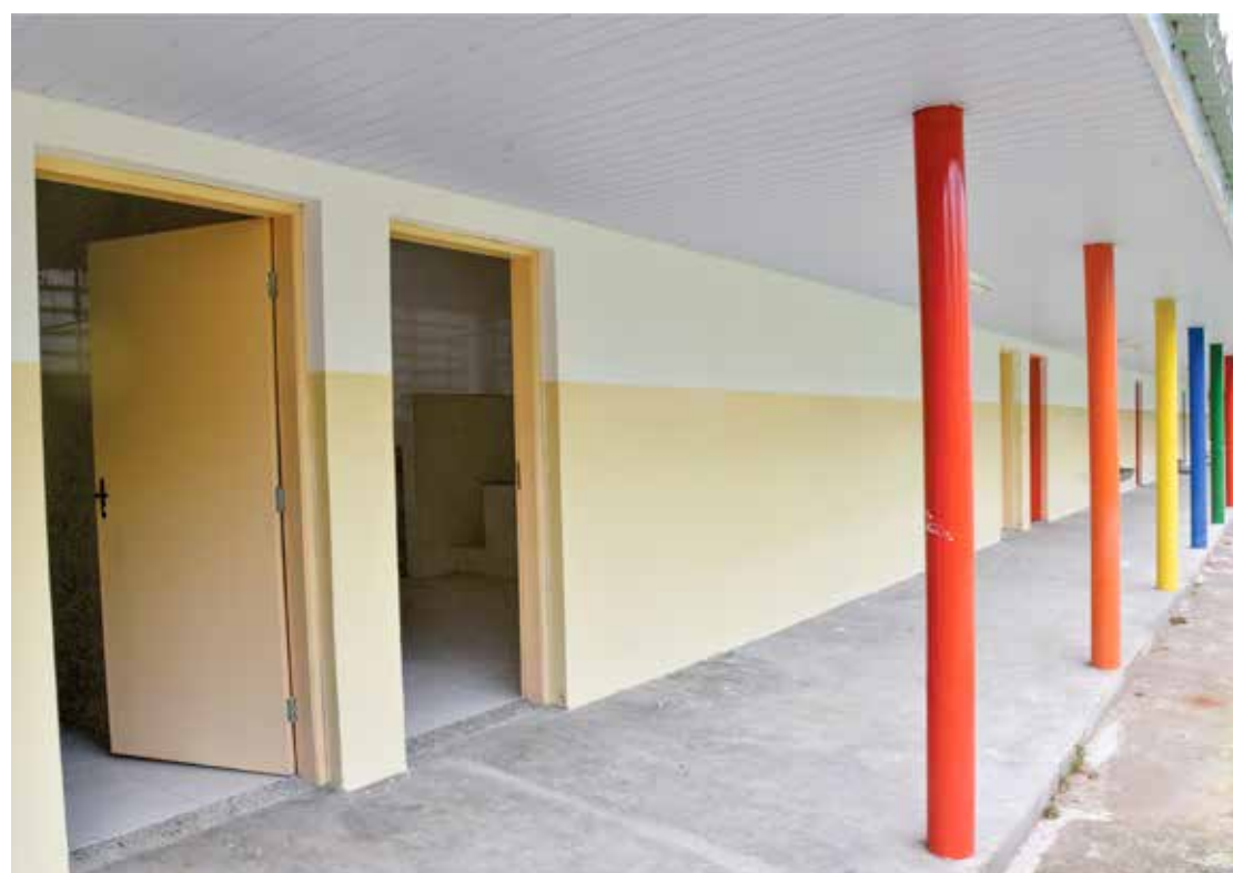
Prédio da Escola Municipal Paulo Koelle foi ampliado