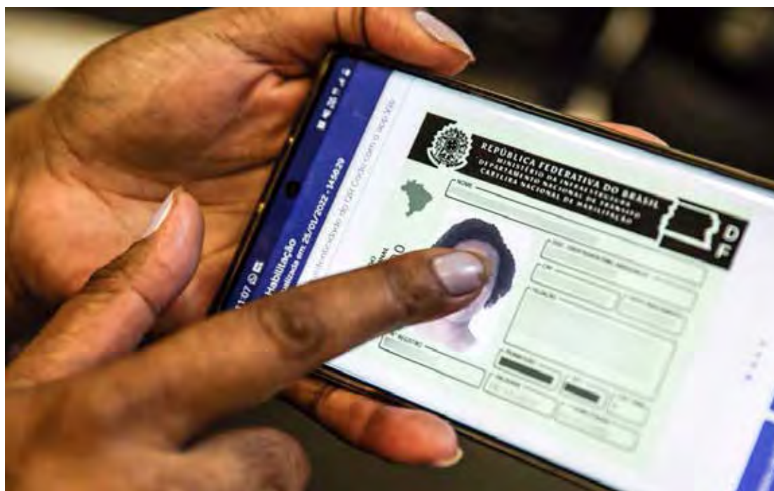
Documento foi vencido nos meses de novembro e dezembro de 2021, quando a renovação ainda estava suspensa devido à pandemia da covid-19

De janeiro a agosto de 2022 foram aplicadas mais de 160 multas pela Polícia Militar para motoristas flagrados por estarem dirigindo com a CNH vencida.