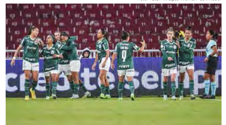
Time feminino do Palmeiras disputa hoje final da Libertadores