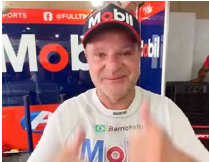
Barrichello, agora na liderança, vai em busca do título de campeão da temporada 2022 da Stock Car

A Stock Car vai chegar a Interlagos no mês de dezembro com quatro candidatos ao título e Rubens Barrichello larga na frente na briga pelo bi. O Rei de Goiânia não brilhou tanto como em março, mas com a quinta e oitava colocações nas provas de domingo (23), soma 298 pontos.