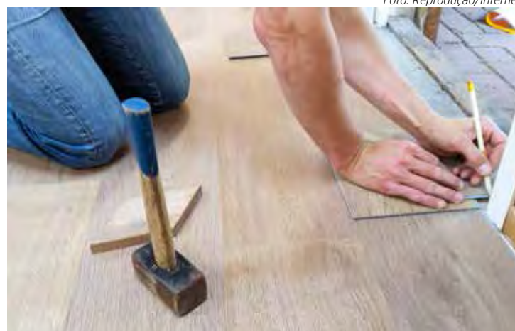
O ideal é contratar especialistas capacitados e experientes

Colocar prazos é uma das maneiras mais eficazes de escapar dos erros durante a reforma, já que quando as datas estão estabelecidas é possível observar com clareza o andamento da obra. "É essencial alinhar um cronograma detalhado com o arquiteto e o mestre de obras responsável pela construção, pois isso trará mais tranquilidade para o andamento da reforma. Além disso, os prazos precisam ser realísticos e atingíveis, contendo uma margem considerável para