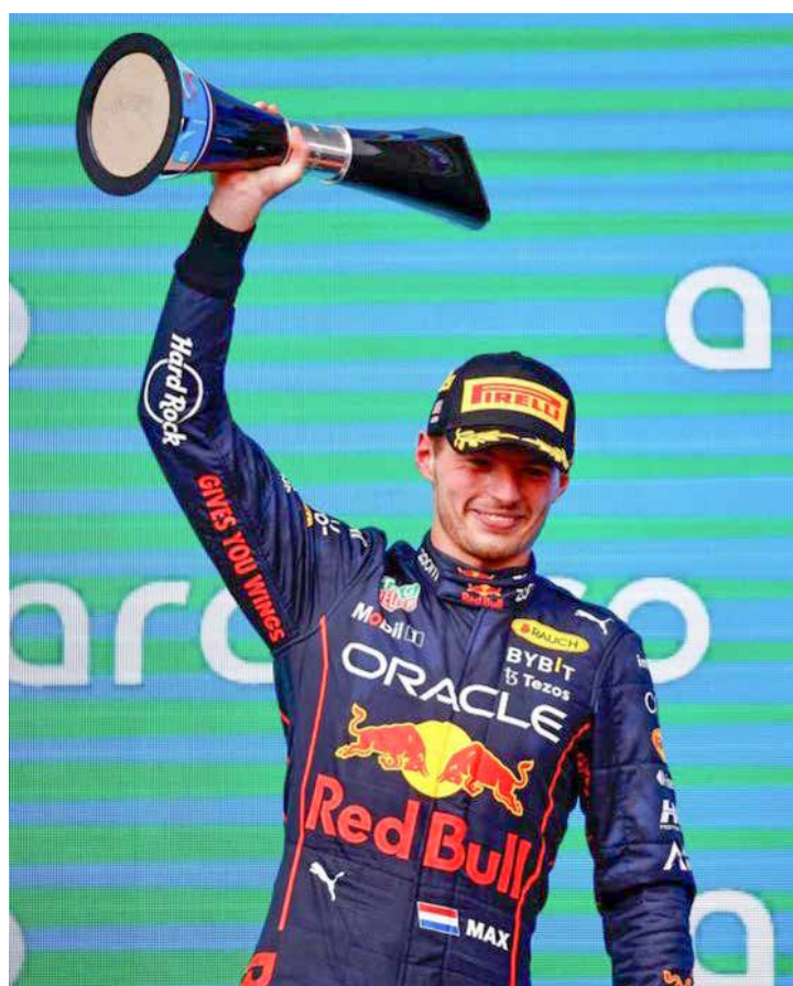
Max Verstappen recebe troféu da vitória no GP dos EUA e Red Bull comemora título de Construtores

A 20ª corrida da temporada, o GP do México, será no próximo domingo (30) às 17h - horário de Brasília. Restam três provas para o fim do campeonato.