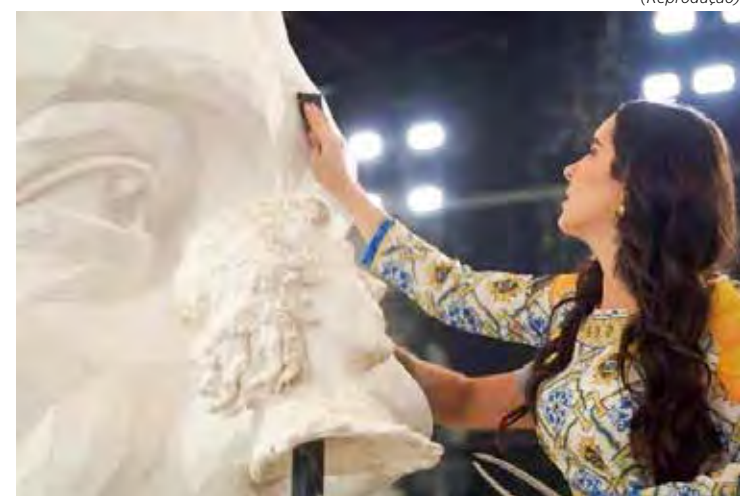
Obra de 3,5 metros de altura será inaugurada no dia 9 de novembro no autódromo

O lançamento da homenagem marcará as comemorações de 50 anos de corridas de F1 no Brasil.