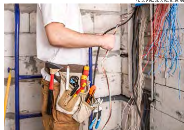
As instalações elétricas e hidráulicas devem ser checadas

A Sika é uma empresa especializada em produtos químicos, que ocupa uma posição de liderança no desenvolvimento e na produção de sistemas e produtos para fixação, vedação, amortecimento, reforço e proteção no setor de construção e na indústria automobilística. Possui filiais em 100 países e mais de 300 plantas no mundo.