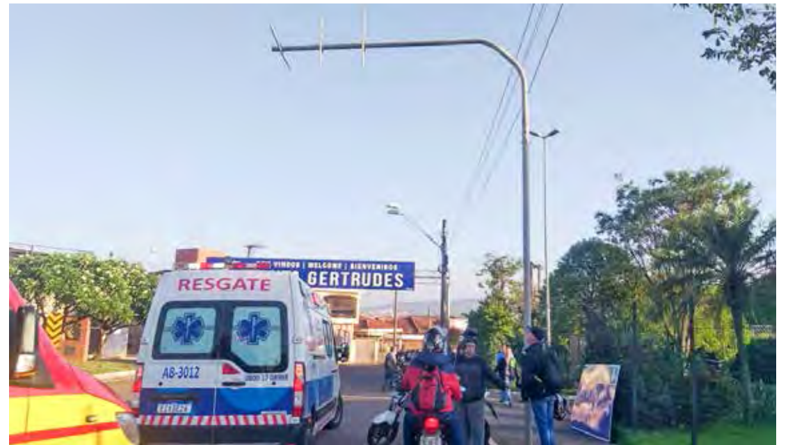
Acidente aconteceu próximo ao acesso à Rodovia Washington Luís (SP-310)

mal enquanto pilotava a motocicleta e, por isso, perdeu o controle, se chocando contra o poste de sinalização. Devido ao impacto, a placa que ficava presa ao poste caiu. O homem chegou a ser socorrido para uma unidade de saúde de Santa Gertrudes, mas já chegou sem vida. Página 6