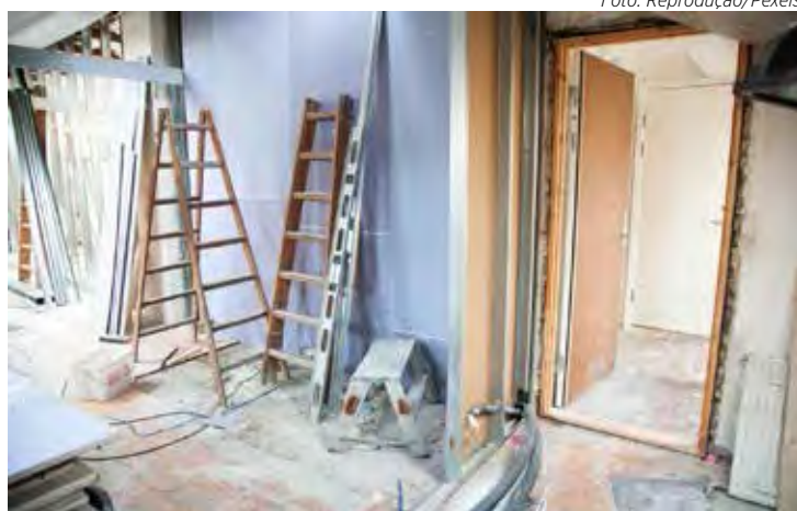
Reformar a casa exige atenção máxima a todos os detalhes que fazem parte da obra.

Com isso em mente, a PortoKoll®, marca do grupo Sika, empresa especializada em produtos químicos para construção civil, cita os erros cometidos mais comuns durante a reforma