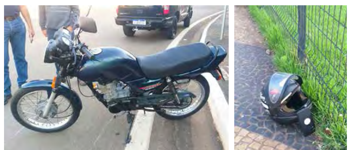
Acidente aconteceu na manhã de segunda-feira (24)