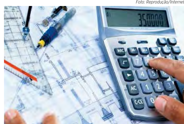
O ideal é definir um orçamento para a obra listando todos os gastos