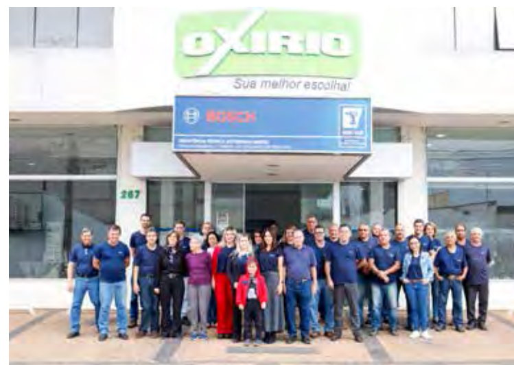
Foto da equipe completa à frente da empresa em todos os sentidos

Aceito o desafio, as noites eram preenchidas com muita dedicação, bem como os finais de semana de muita "luta", visto que os sócios continuavam suas jornadas profissionais na outra empresa. O crescimento chegou agregando e fortalecendo a nova equipe, qualificada e focada em conquistar novos mercados. Nessa fase, ocorreu a