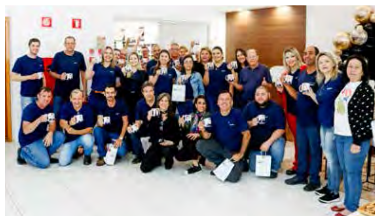
A equipe da empresa no seu momento mais bem humorado, com o brinde de canecas com caricaturas