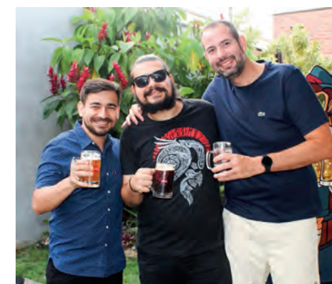
Os cervejeiros de Rio Claro Secco