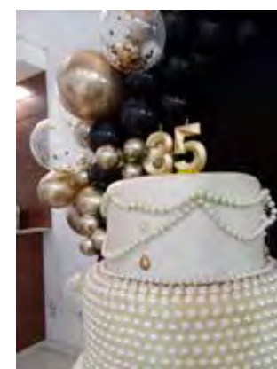
Uma foto para a eternidade ou até a próxima comemoração