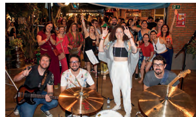
Bloco da Jupa