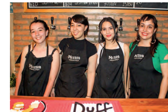
Equipe do Bar