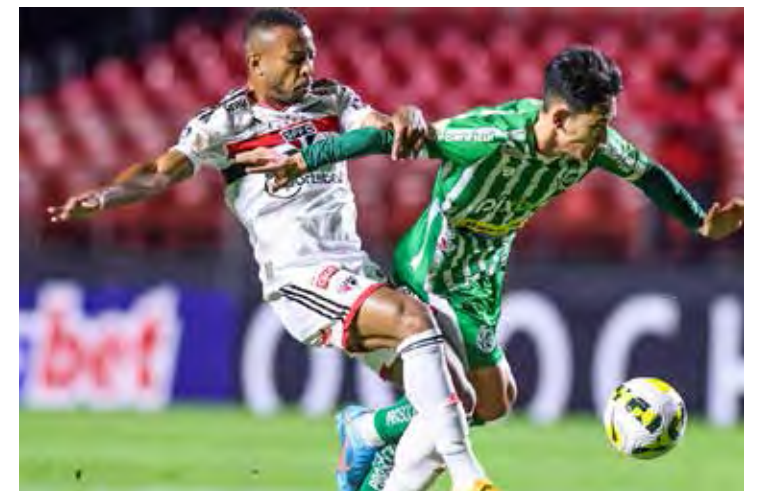
De olho no G8, São Paulo encara Juventude, fora de casa