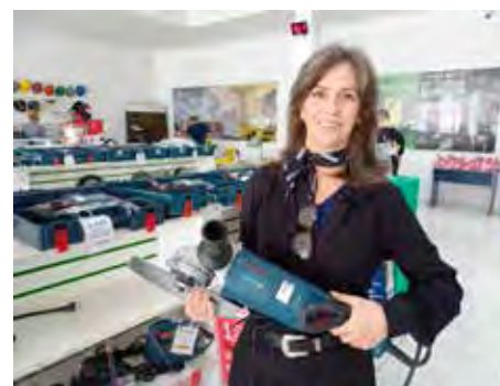
Ferramentas e treinamentos disponíveis na loja e meios digitais