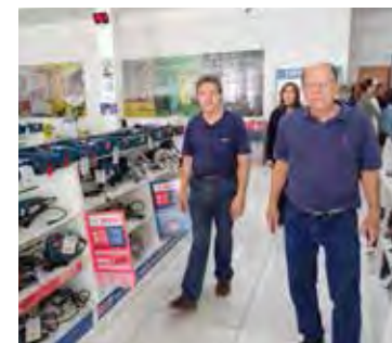
Os sócios percorrem o espaço perfeito da loja