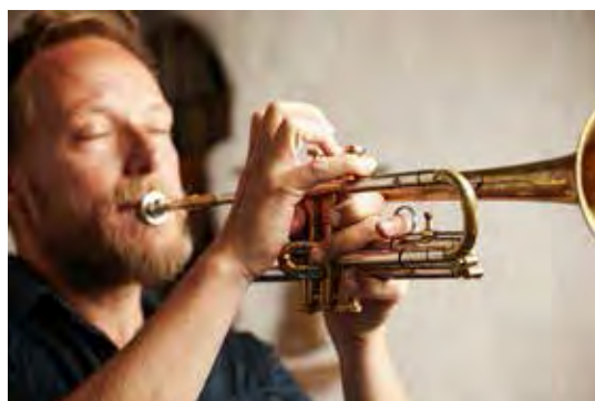
No concerto gratuito serão interpretadas músicas brasileiras e italianas

A apresentação será realizada às 19h30 no salão social da Sociedade Italiana, na Rua 4, número 1334, Centro. O evento tem apoio da prefeitura de Rio Claro por meio da Secretaria Municipal de Cultura.