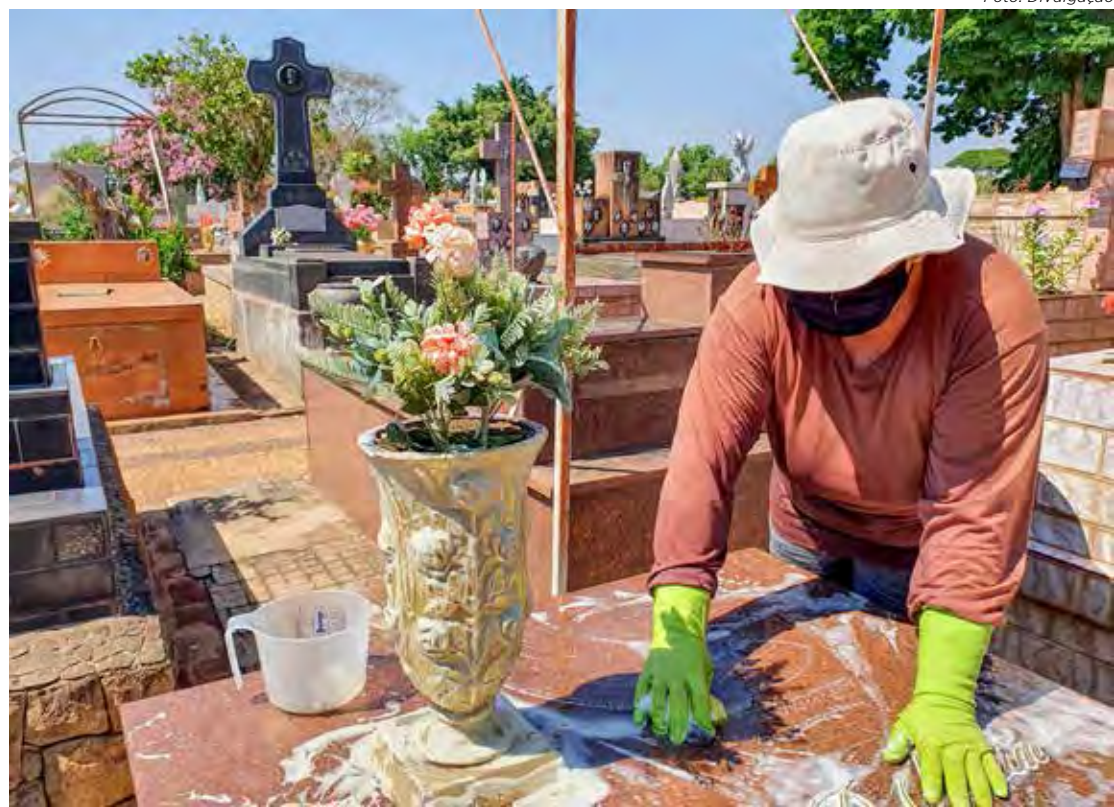
O dia 31 de outubro é o prazo final para as pessoas realizarem limpeza dos túmulos no cemitério municipal

Finados, o cemitério terá horário de funcionamento normal, das 6 às 18 horas. O Cemitério Municipal São João Batista, em Rio Claro, tem aproximadamente 14 mil túmulos. Como medida preventiva à dengue, a prefeitura está orientando as pessoas que forem levar flores aos seus falecidos que tomem cuidado para não incluir vasos ou embalagens que possam acumular água.