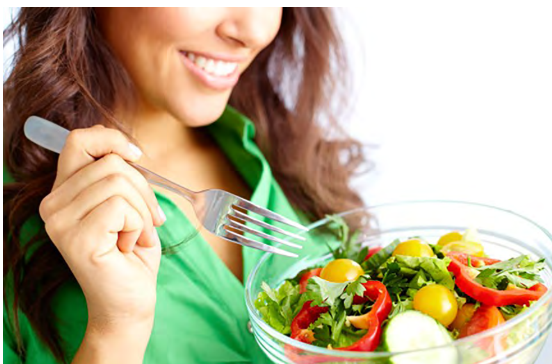
Ingerir alimentos saudáveis na dieta.

O que comemos pode interferir no equilíbrio do planeta, a dieta sustentável nos dias atuais contribuem muito, pois tem baixo impacto ambiental, contribuindo também para a qualidade e segurança nutricional, uma vida mais saudável para as futuras gerações.