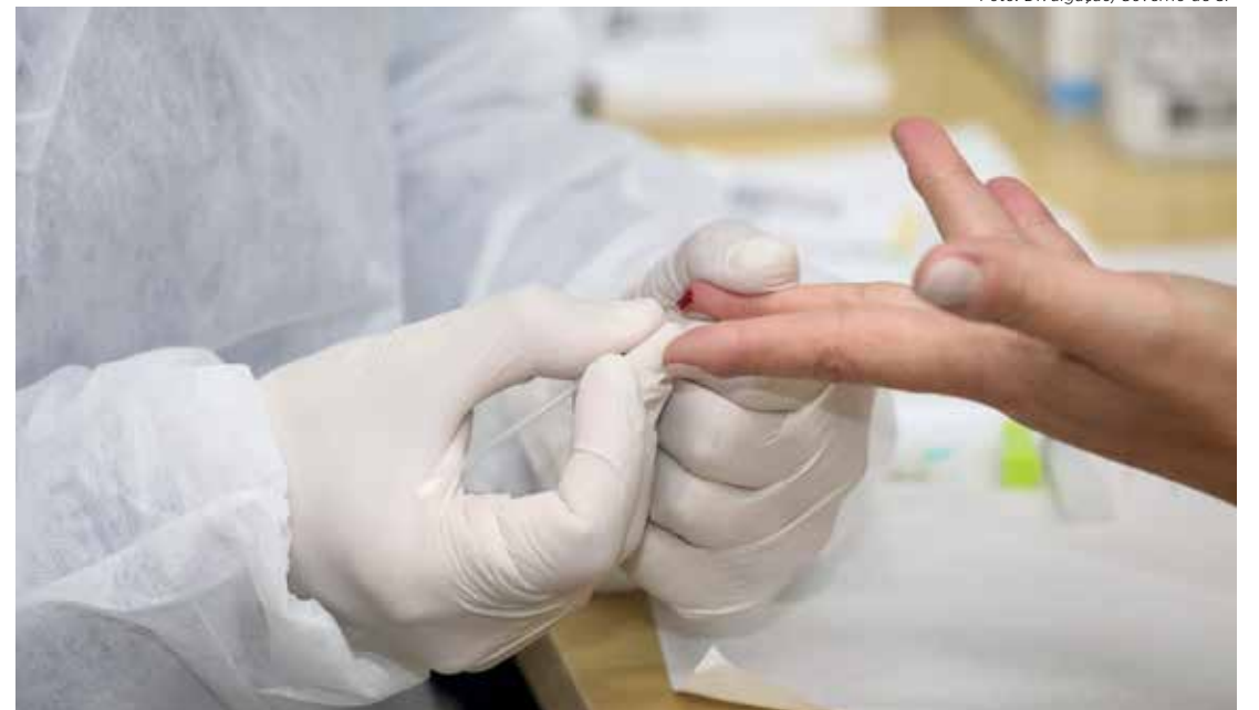
Teste para detecção de Covid-19. Brasil registrou 4.203 novos casos da doença nas últimas 24 horas

O Brasil registrou, desde o início da pandemia, 687.527 mortes por Covid-19, segundo o boletim epidemiológico divulgado ontem (21) pelo Ministério