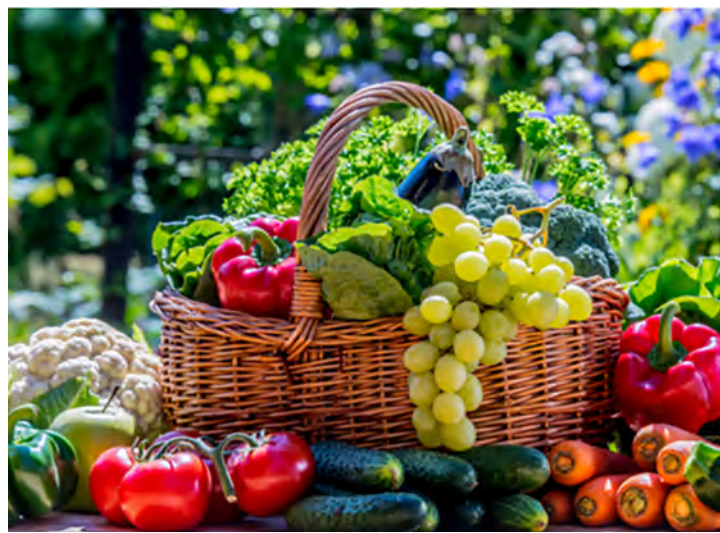
Ingerir Frutas e Legumes na dieta.

Um cardápio sustentável vai requerer mudanças na rotina, porém essas mudanças irão contribuir com a saúde e com o meio ambiente, o importante é iniciar devagar, introduzindo vegetais, ervas, temperos e molhos diferentes, diversificar as receitas, lavar as frutas e picar com antecedência para substituir as guloseimas na hora da sobremesa. Essas mudanças de hábito contribuirão para uma vida melhor e um meio ambiente mais saudável.