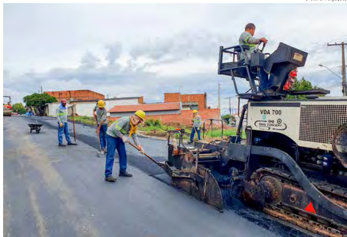
Trechos de vias do Jardim Santa Maria receberam ontem (21) serviços de recapeamento