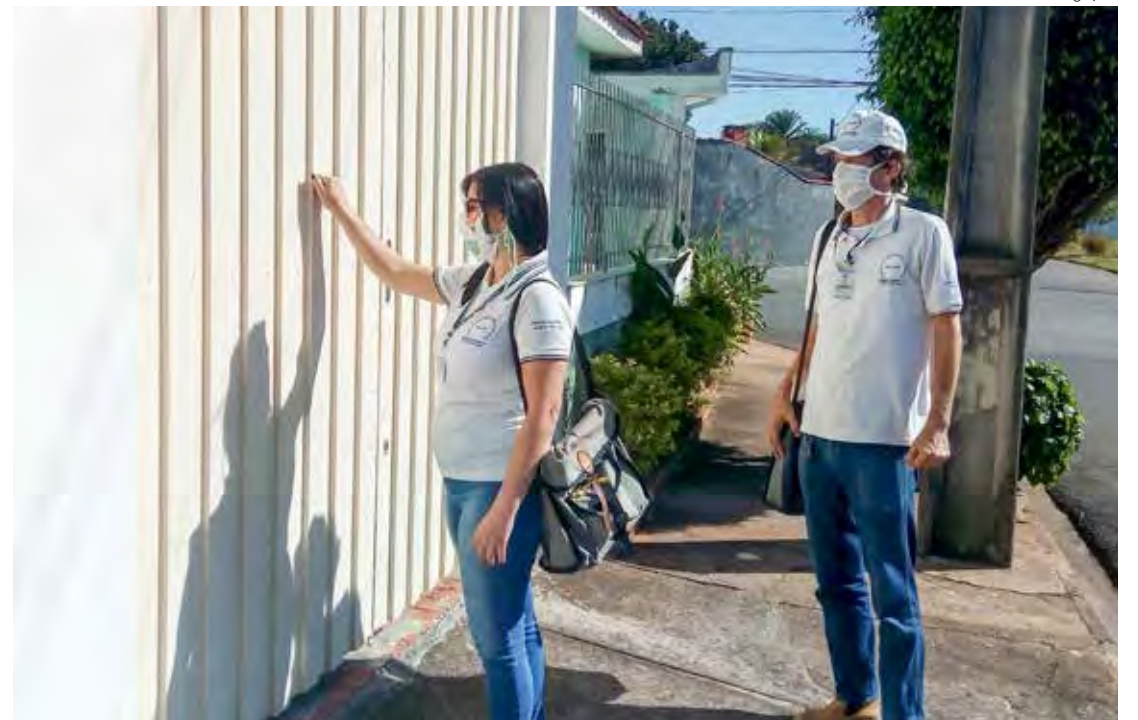
Agentes de endemias percorrem os bairros fazendo vistorias nos imóveis

A Fundação Municipal de Saúde realiza trabalho preventivo nos bairros do município. São realizadas visitas casa a casa, vistorias em pontos estratégicos e nebulização. Porém, este trabalho apenas não é suficiente para combater o