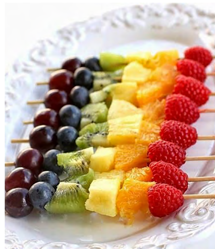
Trocar guloseimas por frutas na sobremesa

Outros padrões alimentares estão sendo propostos nesse contexto, como é o caso das dietas flexitariana criada em 1990, que limita o consumo de carne vermelha para apenas uma vez na semana, carne branca, meia porção