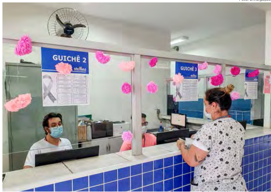
Guichê de atendimento de unidade de saúde do município

Para realizar o papanicolau é necessário que a paciente esteja há três dias sem relações sexuais; não esteja menstruada há cinco dias; e no dia do exame não utilize creme ou pomada vaginal. Antes de ir à unidade a paciente pode tomar banho normalmente.