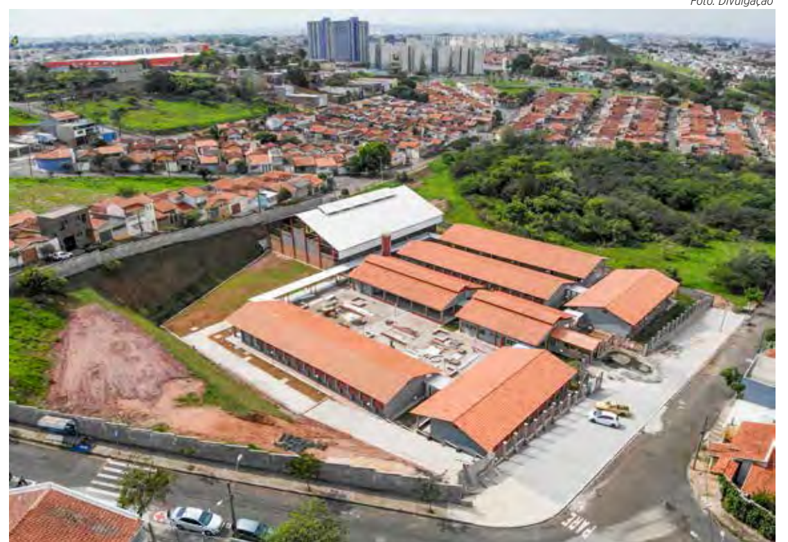
A escola vai atender crianças do Benjamin de Castro e de bairros da região