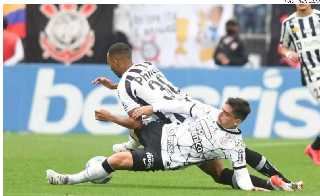
Santos x Corinthians, velha rivalidade em campo