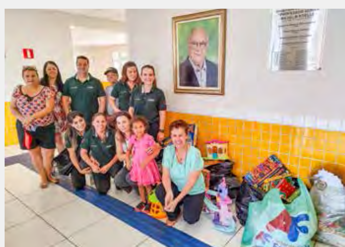
Brinquedos foram doados às escolas Gunar Koelle e Theodoro Koelle

A escola Gunar Koelle atende 253 alunos e a escola Theodoro Koelle atende 261 alunos.