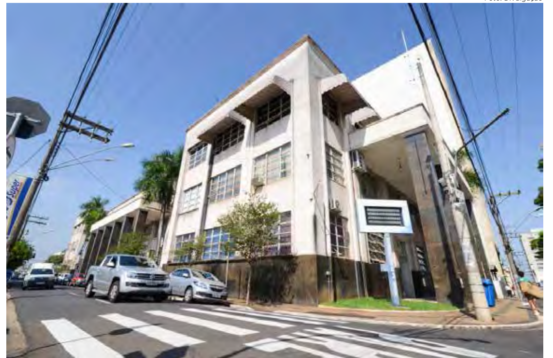
A Câmara está instalada no último andar do paço municipal na Rua 3, entre as avenidas 3 e 5, Centro

Ele informou aos vereadores que o presidente nacional do PSD, Gilberto Cassab, se comprometeu a ceder a área na Rua 6 com a Avenida 25 para a construção da sede própria para a Câmara. Por isso, Pereira solicitou aos vere-