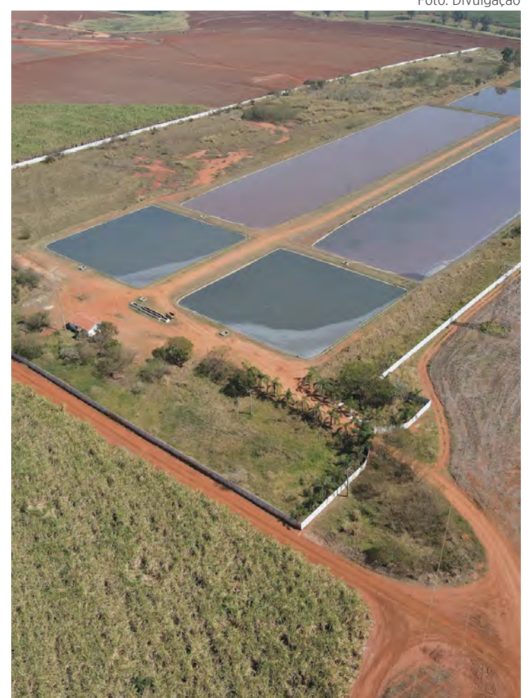
Estação de Tratamento de Esgoto de Santa Gertrudes.

Santa Gertrudes conta com quatro estações elevatórias em operação, uma estação de tratamento de esgoto e mais de 74,5 quilômetros de redes coletoras. “Essa infraestrutura permite que o esgoto produzido pela população retorne aos mananciais em condições adequadas depois de tratado de forma eficiente, de acordo com os padrões exigidos pela legislação”, finaliza.