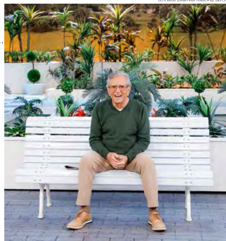
Carlos Alberto de Nóbrega

A ação do TSE, proibindo a Jovem Pan de veicular determinados fatos e termos, continua no centro das discussões. É censura ou não? O fato é que isso está reverberando de diferentes formas. A audiência da TV observou crescimento nas últimas horas.