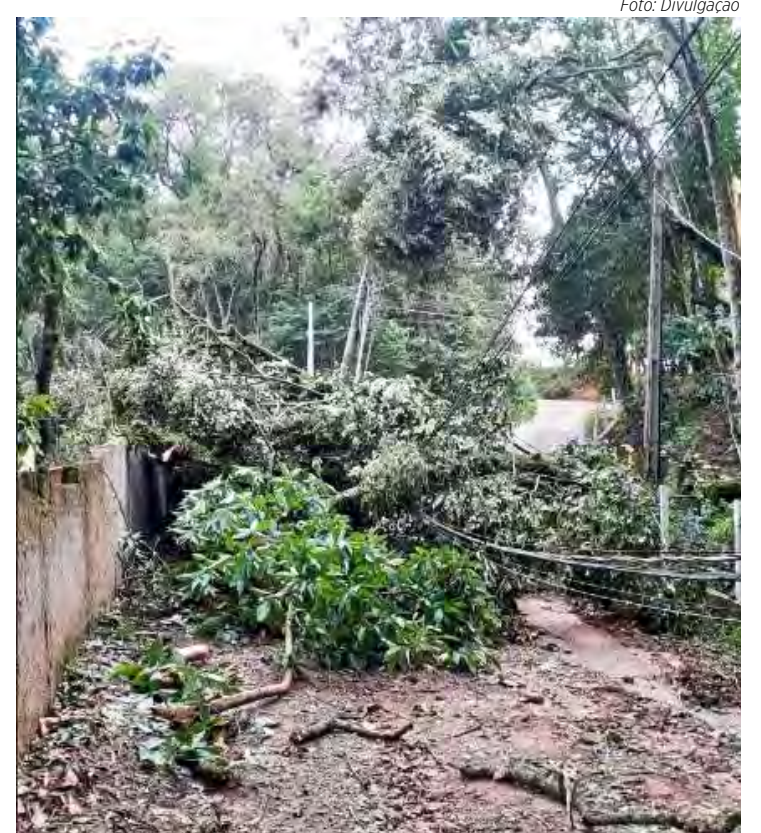
A concessionária orienta a população a se manter distante da rede elétrica e jamais encostar em um fio caído

“A eletricidade quando utilizada de forma indevida, pode causar danos irreversíveis e até a morte. Os famosos “jeitinhos” para resolver situações envolvendo a rede elétrica só colocam a vida em risco. Mesmo que falte luz nas casas próximas, não significa que o cabo caído esteja desenergizado. A orientação é contatar imediatamente a concessionária”, comenta.