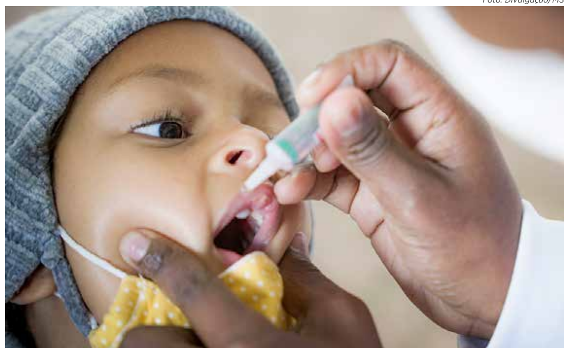
Vacina contra a pólio é destinada a crianças de 1 a menores de 5 anos.

As primeiras doses contra a Covid-19 são aplicadas em quem tem 3 anos ou mais. Para a segunda dose, é necessário observar a data de retorno, marcada a lápis no cartão de vacinação. Já nos maiores de 12 anos a terceira dose é aplicada quatro meses após a segunda dose. A quarta dose é aplicada em pessoas com 18 anos ou mais que tomaram a terceira dose há no mínimo quatro meses.