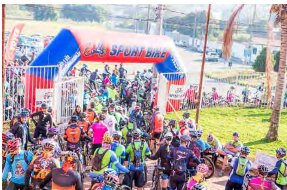
Concentração acontece a partir das 7h e a saída para o pedal às 8h

Denominado Sport, um percurso com aproximadamente 30 quilômetros pelas estradas rurais de Araras. Já o Percurso Pró será mais longo, seguirá também pela zona