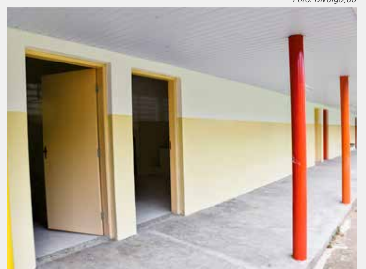
Número de alunos atendidos pela escola passará a ser de 500

A Escola Municipal Paulo Koelle foi inaugurada em 1970 e está localizada na Rua 12 com a Avenida 5.