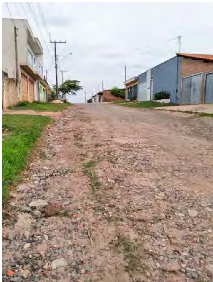
Rua sem asfalto do Jardim Nova Rio Claro cujos moradores aguardam pelo pavimento há mais de 30 anos

De acordo com ele, a Secretaria Municipal de Obras informou que até o próximo dia 30 deverá