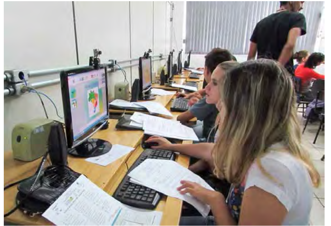
Curso de inclusão digital oferecido pela Udam que será uma das entidades homenageadas

A lei que institui o Dia Municipal da Filantropia foi aprovada no ano passado a partir de projeto de lei do vereador Moisés Marques. "A população rio-clarense precisa entender melhor qual a importância das instituições do terceiro setor no município, pois existem serviços de terceiro setor que a população pensa que é serviço