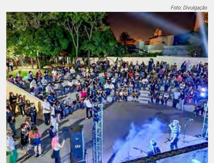
Uma Noite no Museu se tornou opção de cultura e lazer em Rio Claro