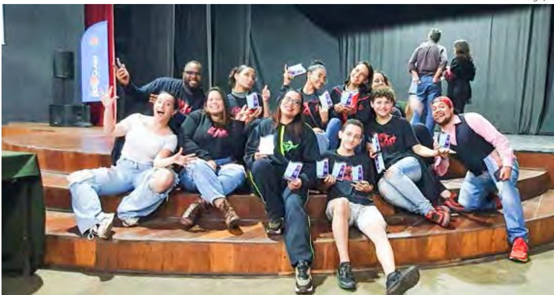
Os alunos garantiram uma vaga no Festival de Arte Metropolitana da Bahia