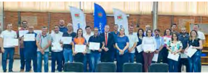
O conselho tem representantes dos poderes Executivo e Legislativo e da sociedade civil