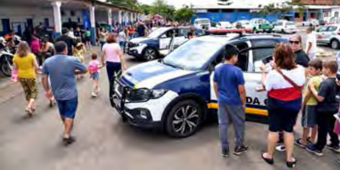
A GCM realizou festa para comemorar o Dia das Crianças