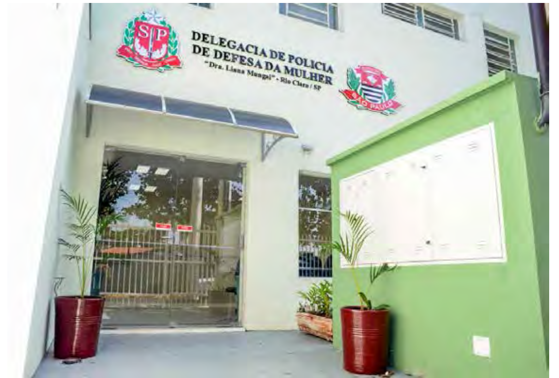
A ocorrência foi apresentada na Delegacia de Defesa da Mulher de Rio Claro, onde todas as partes foram ouvidas e o idoso ficou preso em flagrante

Conforme informações do Boletim de Ocorrência, os Policiais Militares foram acionados via COPOM a comparecer em local de possível roubo, quando chegaram encontraram o cenário totalmente diferente. Segundo os PMs pelo local estava um adolescente de 16 anos que disse que um homem ofereceu dinheiro para ter relações com o menor. Os dois foram para um ambiente onde o adolescente chegou a ser tocado. O adolescente decidiu ir embora, mas relatou aos policiais que neste momento, um suposto neto do acusado apareceu, agrediu o menor e subtraiu sua mobilete. Ainda