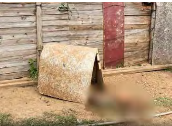
Caso aconteceu em Piracicaba na última segunda-feira (17)

O Corpo de Bombeiros e a Guarda Civil Municipal estiveram no local, que passou por perícia. Até o fechamento desta edição, o dono não foi encontrado.