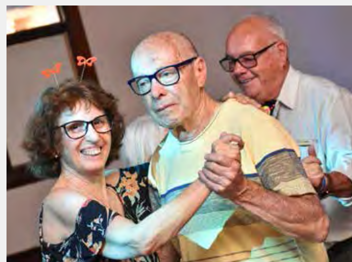
O público poderá assistir o concurso que terá logo em seguida um baile

O evento, realizado em parceria com a Secretaria de Turismo e Assessoria dos Direitos do Idoso, irá marcar o encerramento da Semana do Idoso em Rio Claro. Haverá venda de cartelas no local.