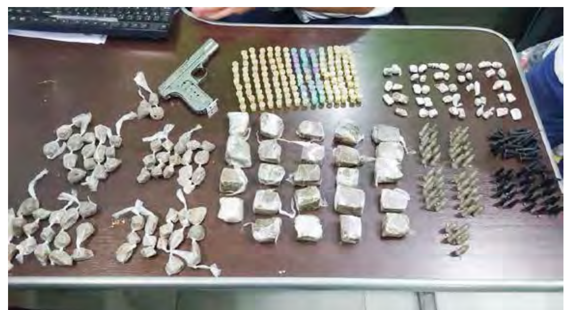
822 gramas de drogas foram encontradas com o rapaz

Ao perceber a presença da viatura, o adolescente entrou em uma casa e foi abordado. Na sua bolsa, segundo os PMs,