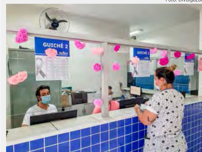
Unidades de saúde promovem atividades em alusão ao Outubro Rosa