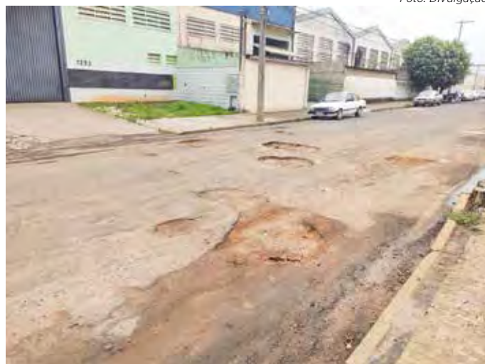
Buracos em via pública