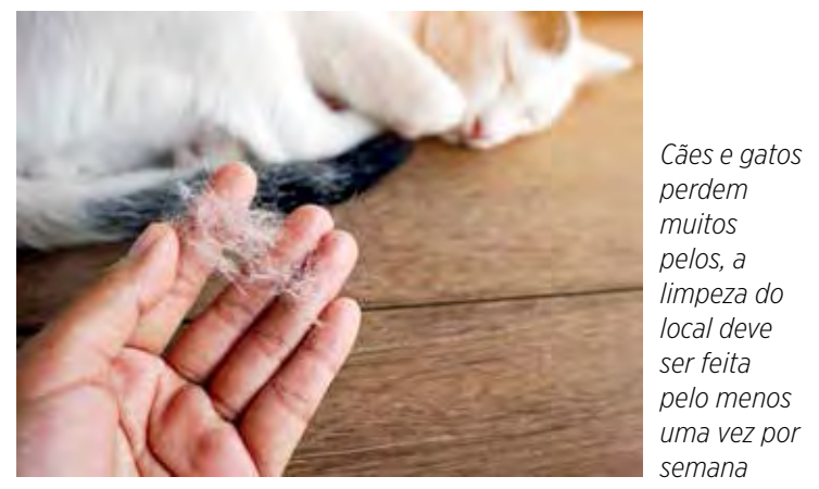
Cães e gatos perdem muitos pelos, a limpeza do local deve ser feita pelo menos uma vez por semana