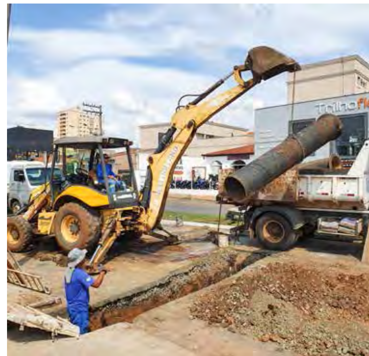
Bueiro do local também será refeito

O problema de inundação na Visconde só será solucionado de vez quando obras de grande porte forem realizadas para que o volume de água na avenida seja reduzido.