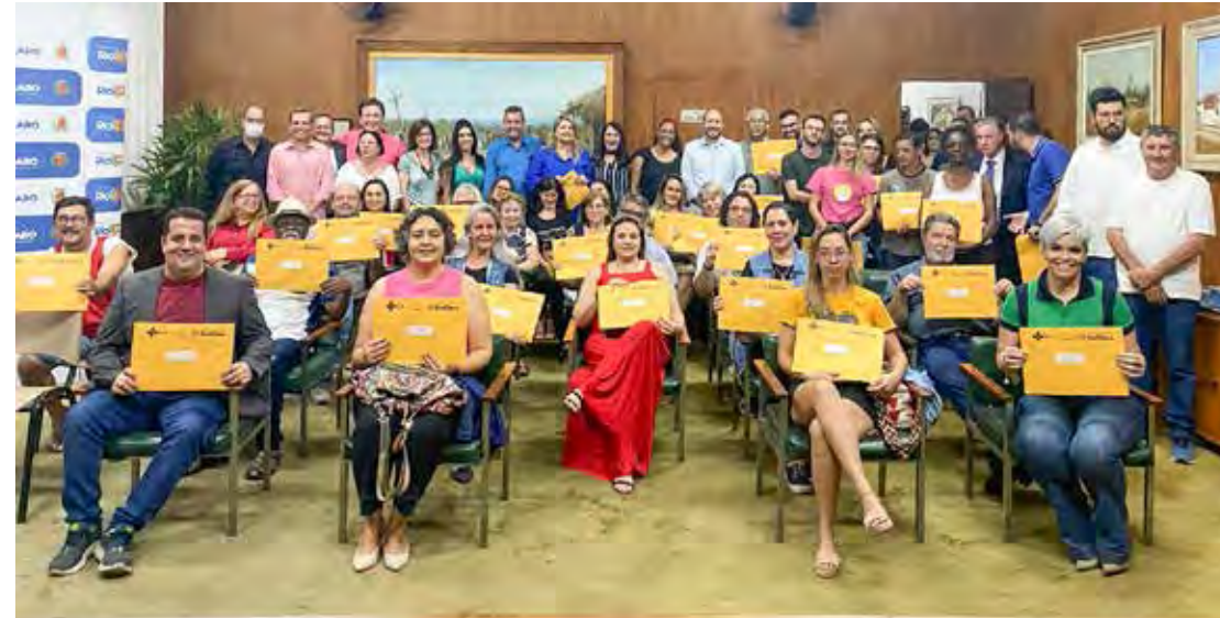
Novos integrantes tomaram posse em cerimônia no paço municipal