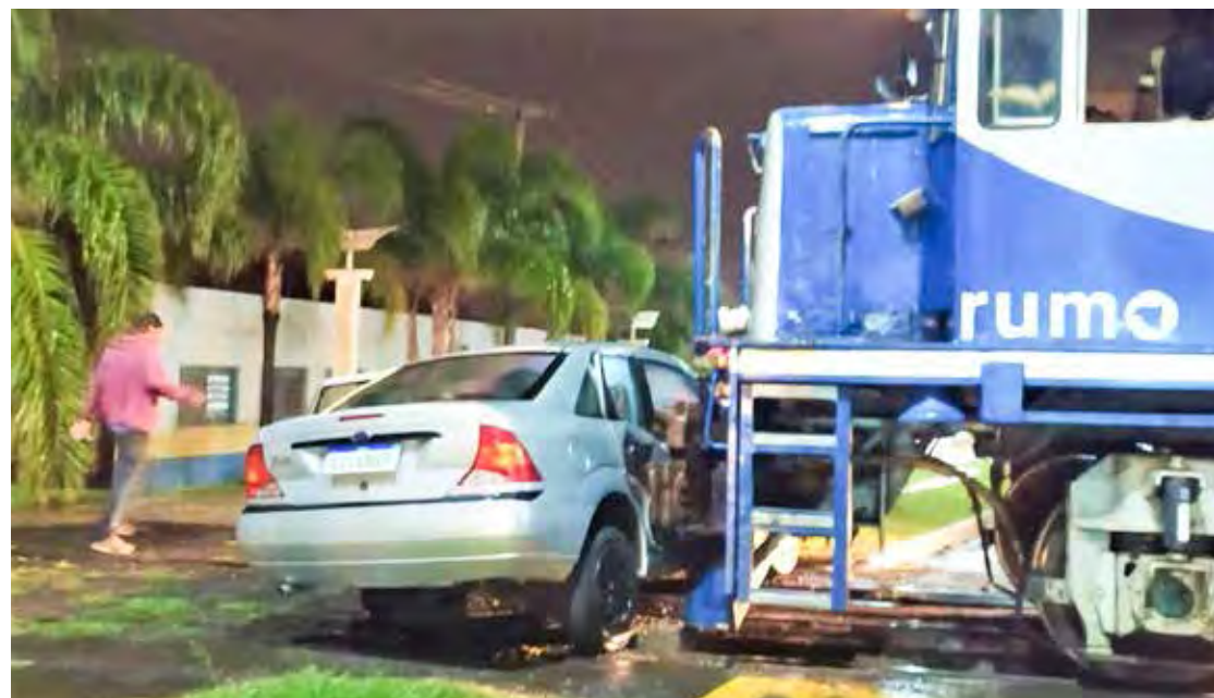
Acidente aconteceu na noite deste domingo (16)

Um carro que cruzava a linha férrea, na Avenida 7, em Rio Claro, foi atingido por um trem na noite do último domingo (16). Segundo informações da Guarda Civil Municipal (GCM), que atendeu a ocorrência, o motorista alegou que