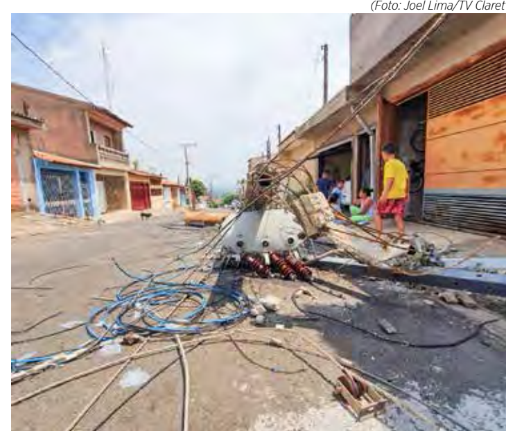
Queda de cinco postes foi registrada na Rua 17 do Jardim Progresso

Equipes da concessionária foram comunicadas logo em seguida aos fatos e chegaram durante a noite de domingo, isolaram a área para impedir qualquer acidente com a população e iniciaram os trabalhos. Os funcionários atuaram no local durante essa segunda-feira para restabelecer o serviço à população.