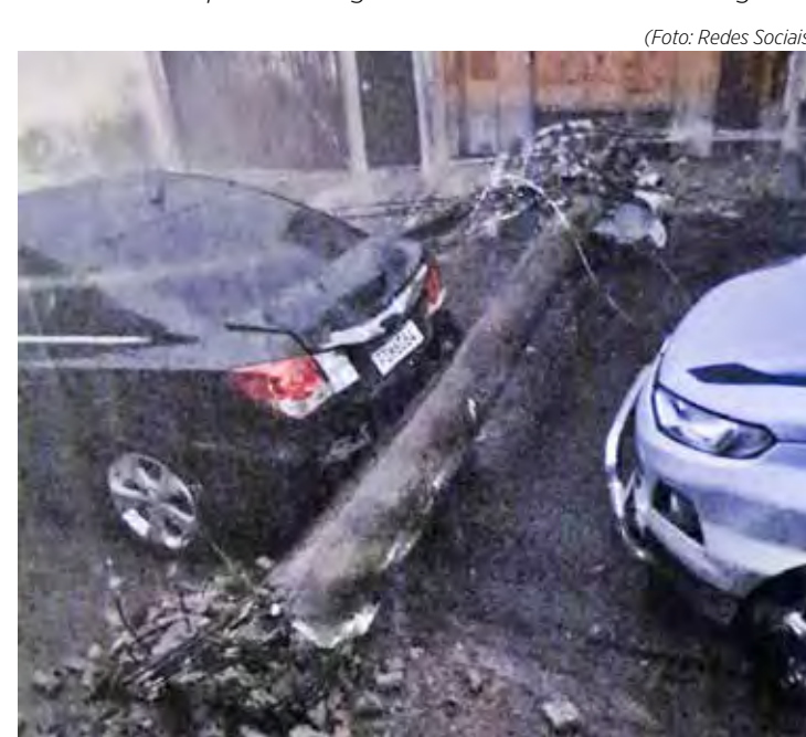
Um dos postes atingiu um veículo