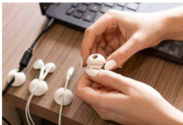
Organizador de cabos ajuda a evitar acidentes