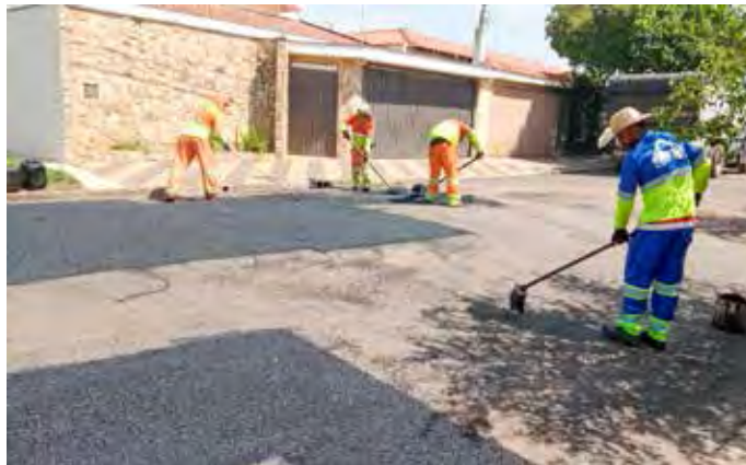
Serviço de reparo asfáltico em via pública