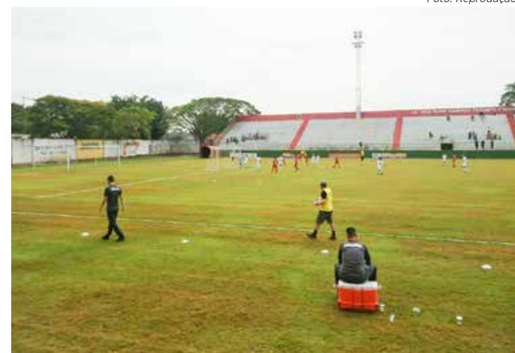
Velo venceu Ferroviária no Sub-11