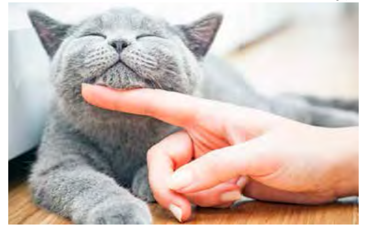
Os pets são ótima companhia, mas demandam cuidado para uma boa convivência