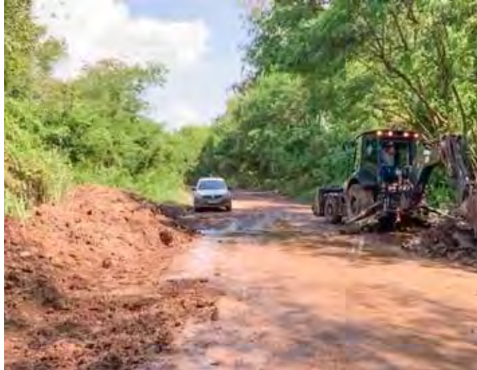
Serviço de recuperação em estrada rural