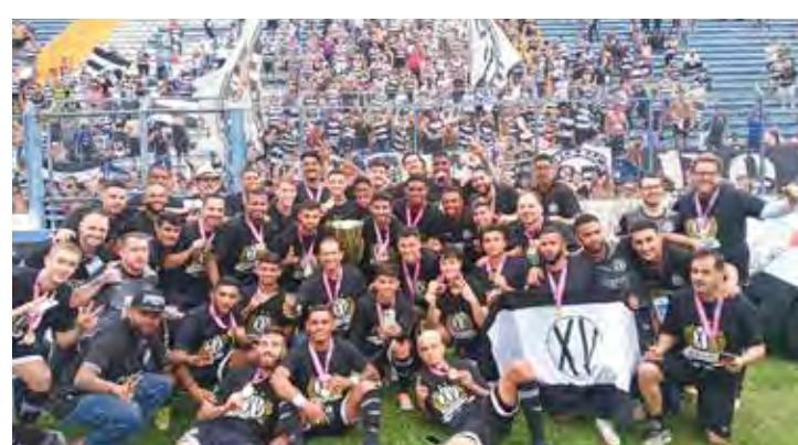
XV comemora o título da Copa Paulista

Time está garantido no Brasileiro Série D do próximo ano