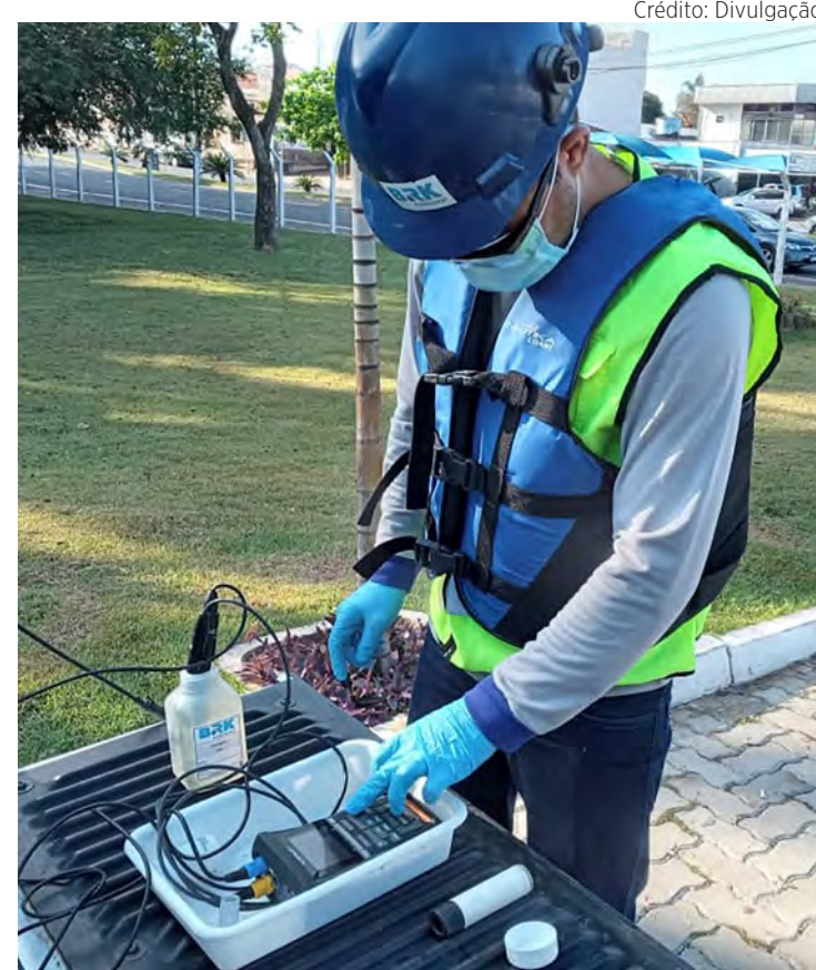
Concessionária realiza monitoramento regular da água dos rios e córregos.

“Essa infraestrutura permite que o esgoto tratado retorne aos mananciais em condições adequadas depois de tratado de forma eficiente, de acordo com os padrões exigidos pela legislação”, finaliza.