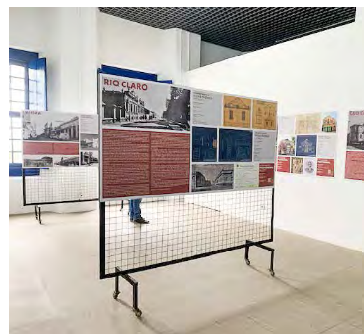
A exposição Imigrantes Italianos no Estado de São Paulo pode ser vista no Museu Amador Bueno da Veiga

Com ênfase no legado dos italianos de primeira e segunda