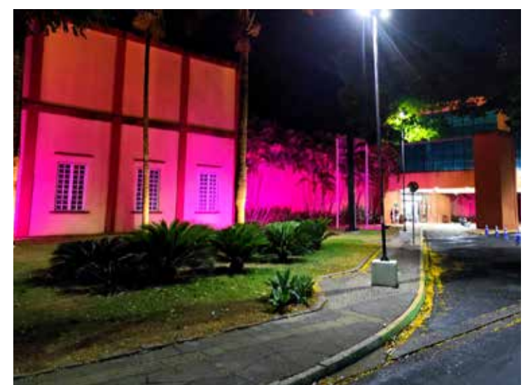
Chuva forte caiu na cidade na quinta-feira (13)

O Departamento Autônomo de Água e Esgoto precisou acionar equipes para restabelecer o funcionamento da estação de tratamento de água do bairro Cidade Nova, que parou de funcionar por causa da falta de energia elétrica.