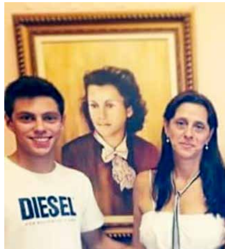
A filha prestigiou as homenagens feitas à mãe em 2014, como patronesse de uma escola municipal

“Minha mãe foi Professora titular da cadeira de Geografia do Instituto de Educação Joaquim Ribeiro, sempre foi muito querida, admirada e respeitada pela dedicação educacional. Muitas lembranças me vem à tona das suas intermináveis noites analisando textos e atividades de seus alunos, procurando sempre o melhor e mais adequado conhecimento a todos que passaram por suas mãos”.