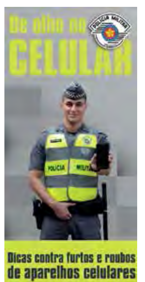
Dicas contra furtos e roubos de aparelhos celulares

EM CASO DE EMERGÊNCIA LIGUE 190 OU DISQUE - DENÚNCIA 181