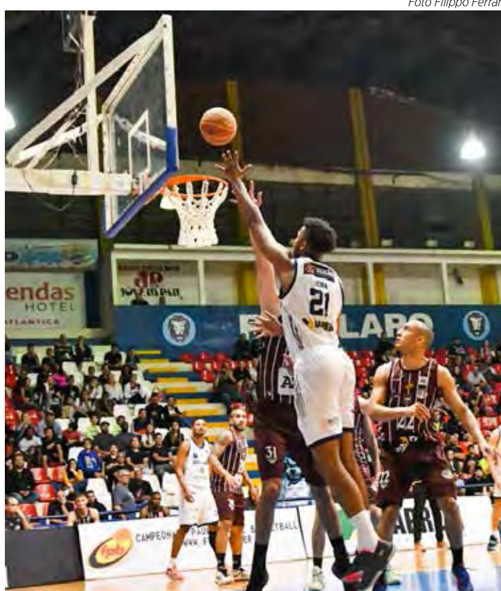
Rio Claro Basquete vai pra cesta

Para assistir a estreia do Leão no NBB 2022/2023, o torcedor pagará o ingresso no valor de R$ 20,00.