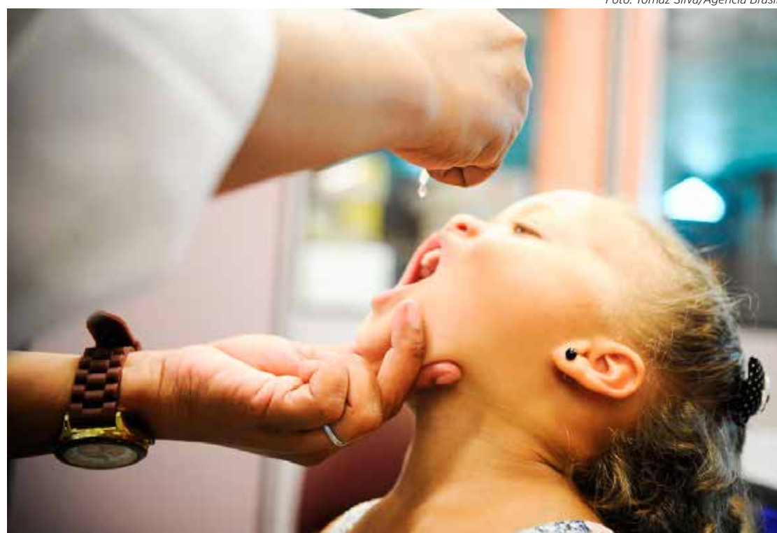
Criança recebe a vacina oral contra a poliomielite durante campanha de vacinação

Já imunizadas com essas três doses, as crianças brasileiras devem receber as famosas gotinhas da vacina oral contra a poliomielite (VOP), aos 15 meses e aos 4 anos de idade, como um reforço na imunização.