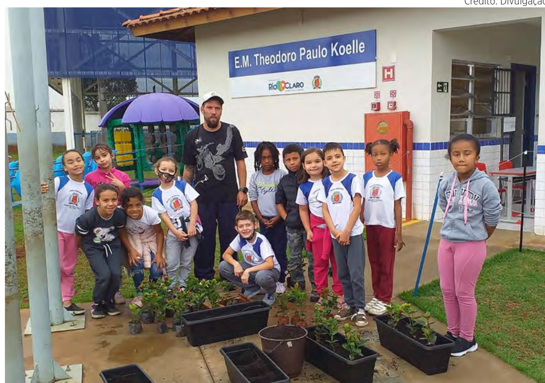
Crianças realizaram plantio de mudas na escola Theodoro Paulo Koelle.

A iniciativa da escola, vinculada à Secretaria Municipal da Educação, teve parceria com a Secretaria Municipal de Agricultura, que fez a orientação aos professores, e da Secretaria Municipal da Habitação, que providenciou as mudas utilizadas no plantio, e apoio das empresas Garden Cerri e Flora Cerri.