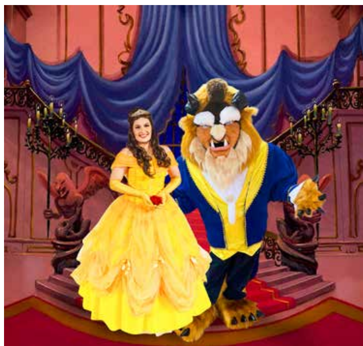
Os personagens de "A Bela e a Fera" vão estar no Shopping Rio Claro

Hoje, os pequenos têm encontro marcado com uma das princesas mais famosas dos contos de fada e seu monstro preferido. Os personagens estarão no shopping das 15h às 19h, interagindo com as famílias e fazendo selfies. E a partir