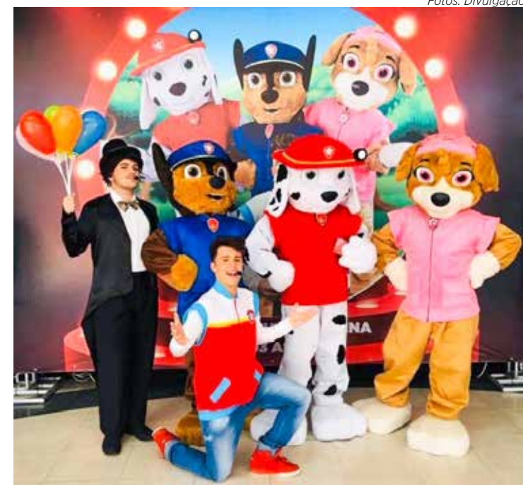
Amanhã, às 16h, tem teatro com a turma da Patrulha em Ação

A sessão de teatro infantil acontece no domingo, às 16h, com a turma da Patrulha em Ação cantando suas aventuras para a criançada se divertir muito.