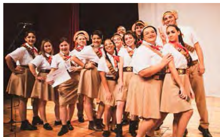
Coral da Guarda Mirim faz apresentação no shopping