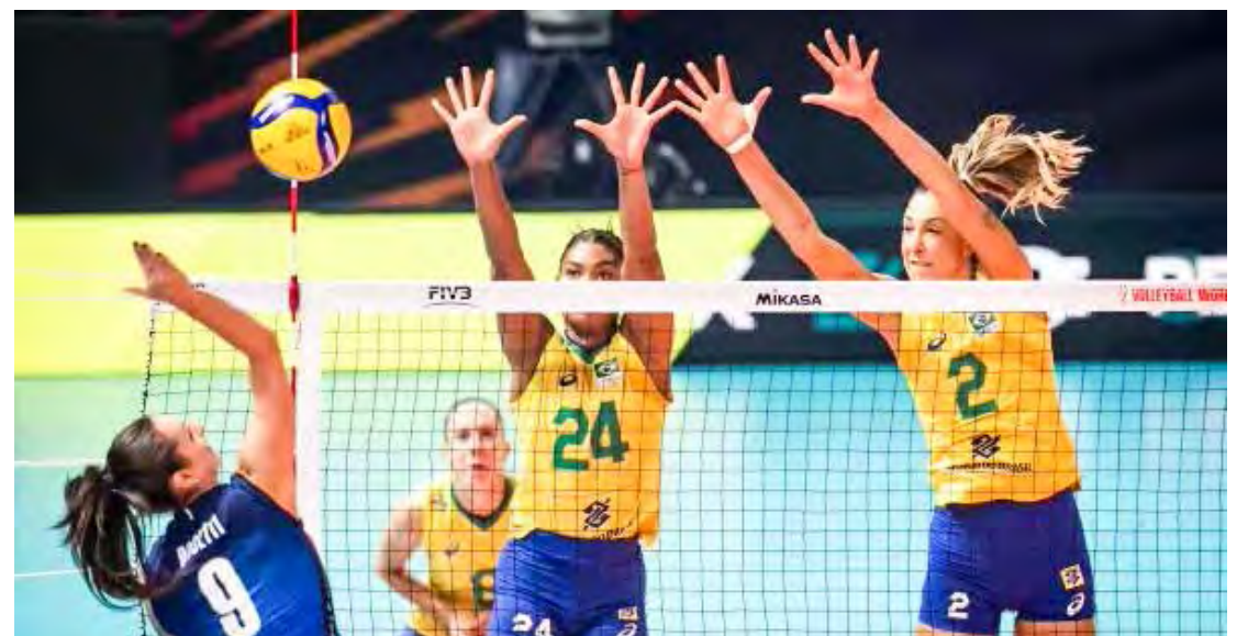
Brasil tenta o título do mundial de vôlei feminino.