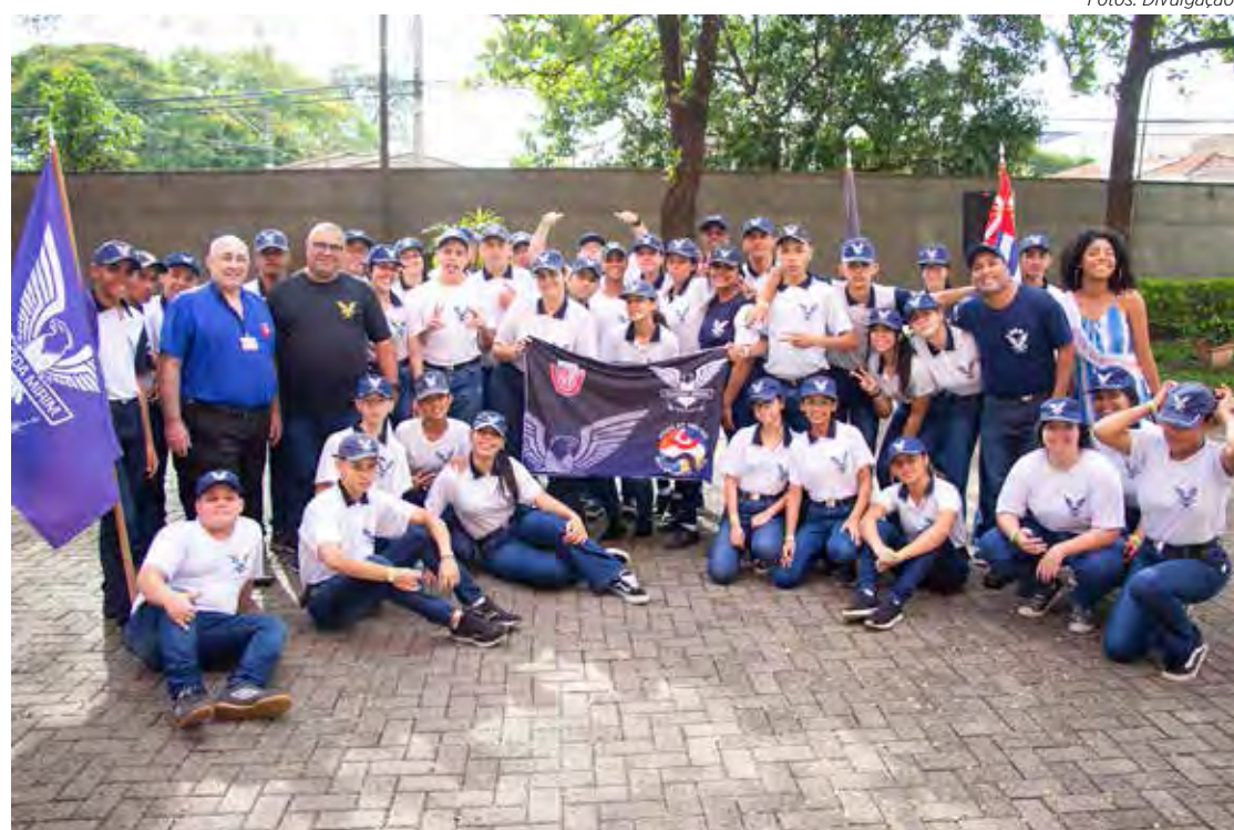
Equipe da Guarda Mirim