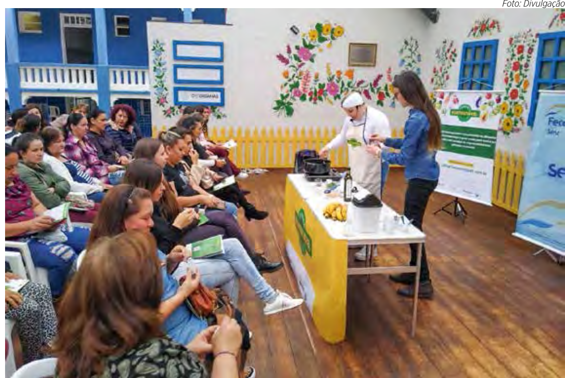
As oficinas estimulam a criatividade e promover o empoderamento dos participante

O programa acontece em parceria com o Consulado da Mulher e vai passar pelas cidades de São Paulo (SP), Rio Claro (SP), Manaus (AM) e Joinville (SC), até