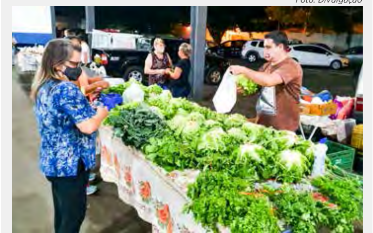
Além dos hortifrutis, feiras também oferecem gastronomia e outros produtos