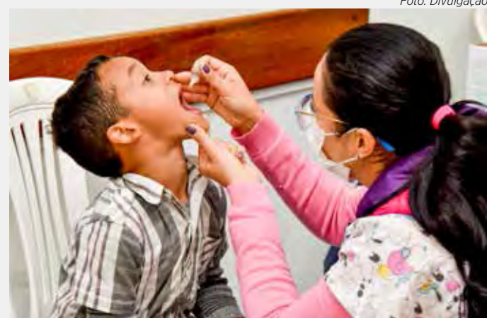
Criança recebe vacina contra a pólio em unidade de saúde em Rio Claro