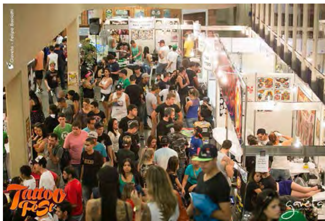
Evento começa hoje no Centro Cultural a partir das 16h

Mais informações sobre o festival podem ser obtidas no Instagram @tattofest ou pelo telefone (19) 996823726.