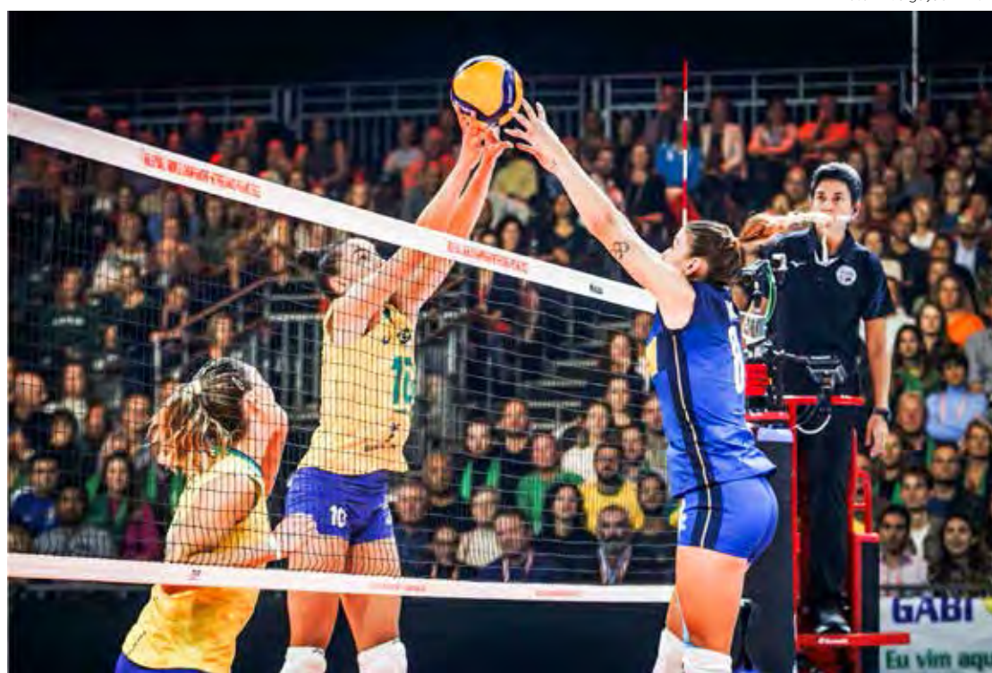
Brasil derrota Itália e enfrenta Sérvia na final