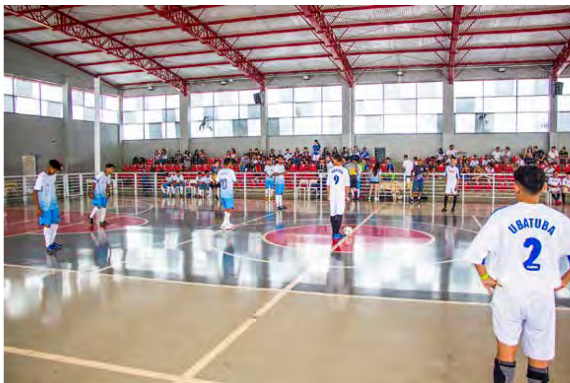
Aprendizes da Guarda Mirim competiram em provas de futebol de salão

de futebol de salão, natação e tênis de mesa. No futebol de salão, a Guarda Mirim de Rio Claro foi campeã no masculino e feminino, tendo como vice-campeã a Guarda Mirim de Frutal nas duas modalidades. No tênis de mesa masculino, pôdio de campeão e vice para Rio Claro. Já no feminino, a equipe de Uberaba levou título e Rio Claro ficou em segundo lugar.