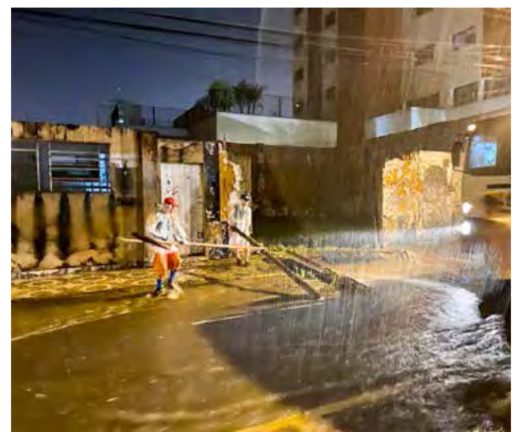
Temporal derrubou árvores e causou alagamentos em vários pontos da cidade