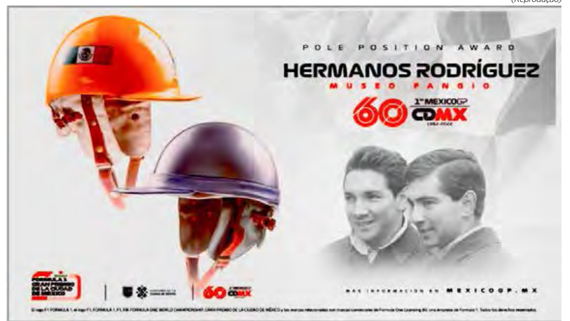
Piloto mais rápido na qualificação do GP do México terá direito a um troféu especial

Com certeza uma bonita homenagem aos dois irmãos mexicanos, que eram bons pilotos mas infelizmente morreram nas pistas.