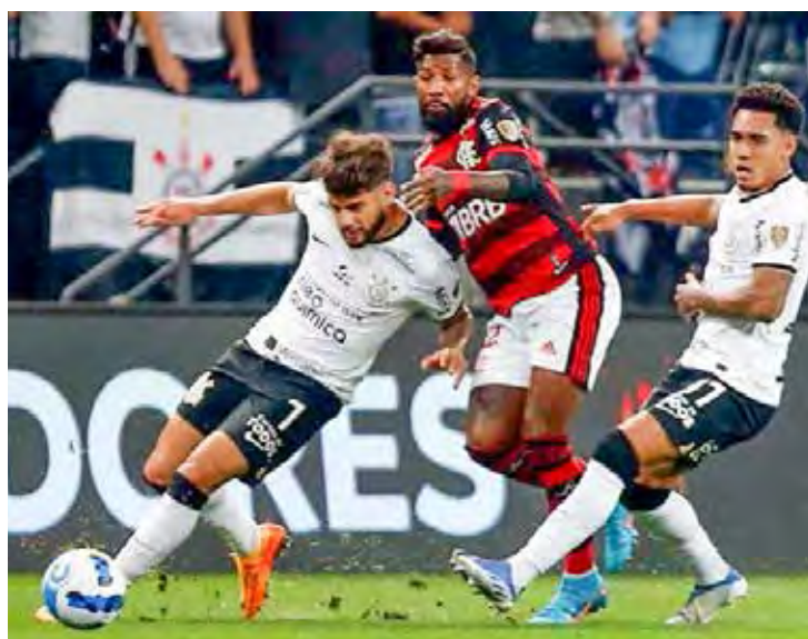
Corinthians e Flamengo ficaram no empate

As equipes voltam a se enfrentar no próximo dia 19, dessa vez, no Maracanã. Em caso de novo empate, o título será decidido na disputa de pênaltis.