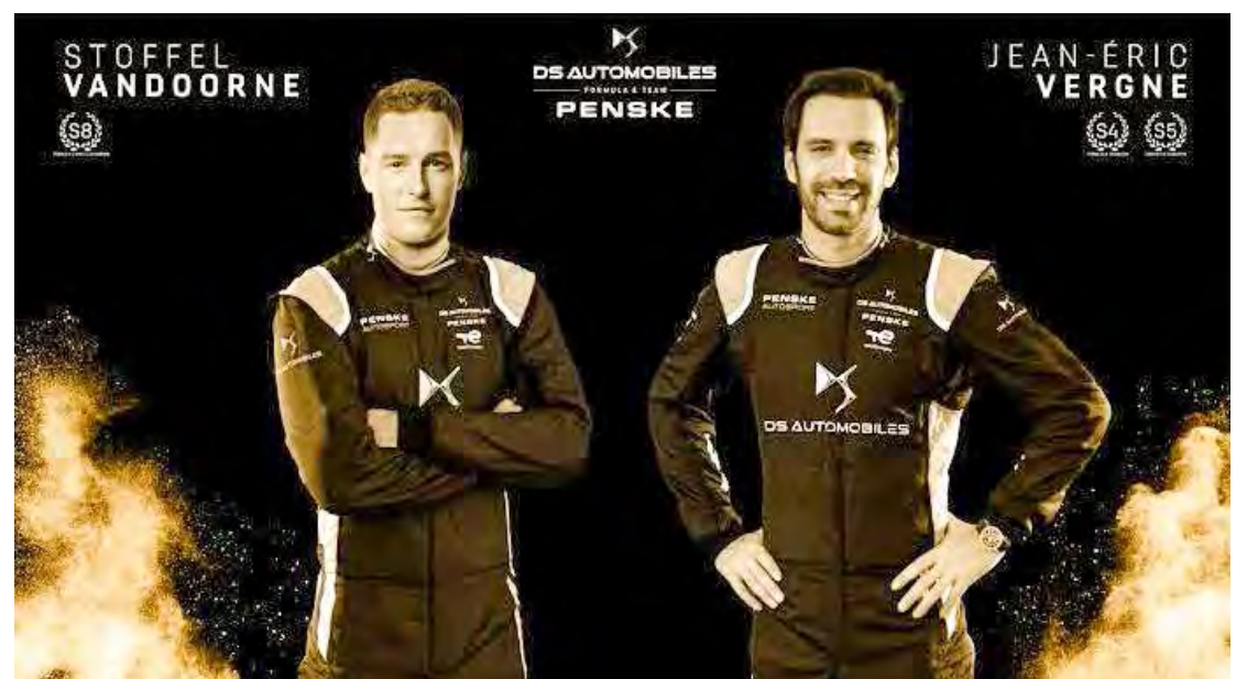
Penske anunciou sua nova dupla de pilotos para a Fórmula E: Jean-Éric Vergne e Stoffel Vandoorne

A fabricante francesa, uma ramificação da marca Citroën, fez anteriormente parceria com a equipe Techeetah ao longo da era do Gen2 e conquistou dois campeonatos de pilotos e equipes cada com a equipe chinesa. Mas com a incerteza significativa sobre o compromisso da SECA, o conglomerado de mídia chinês responsável pela Techeetah, a DS se separou da equipe e transferiu suas atenções para a equipe Dragon Penske - de propriedade de Jay Penske, filho de Roger Penske.