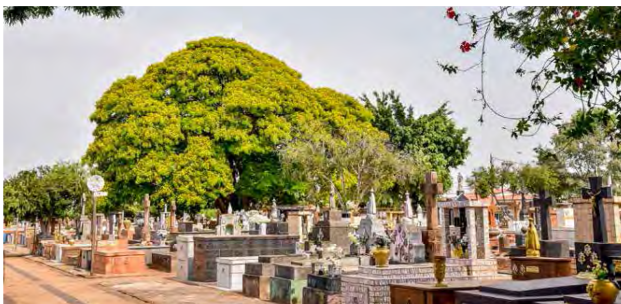
Cemitério municipal São João Batista no Bairro do Estádio em Rio Claro

Mais informações sobre o assunto ou esclarecimentos podem ser obtidas no departamento municipal de Desenvolvimento Urbano pelo telefone 3522-1982.