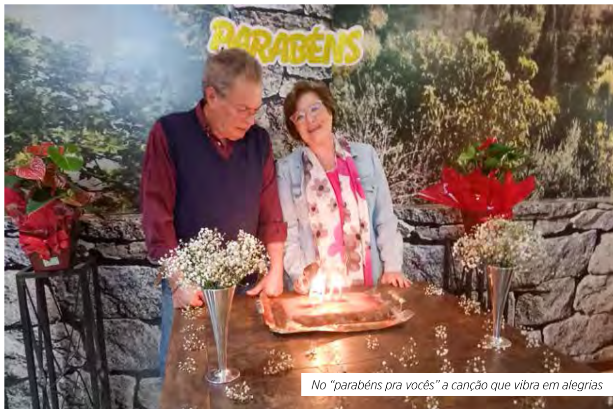
No “parabéns pra vocês” a canção que vibra em alegrias

o dia de hoje abrace o passado com nostalgia e o futuro com as aspirações.”