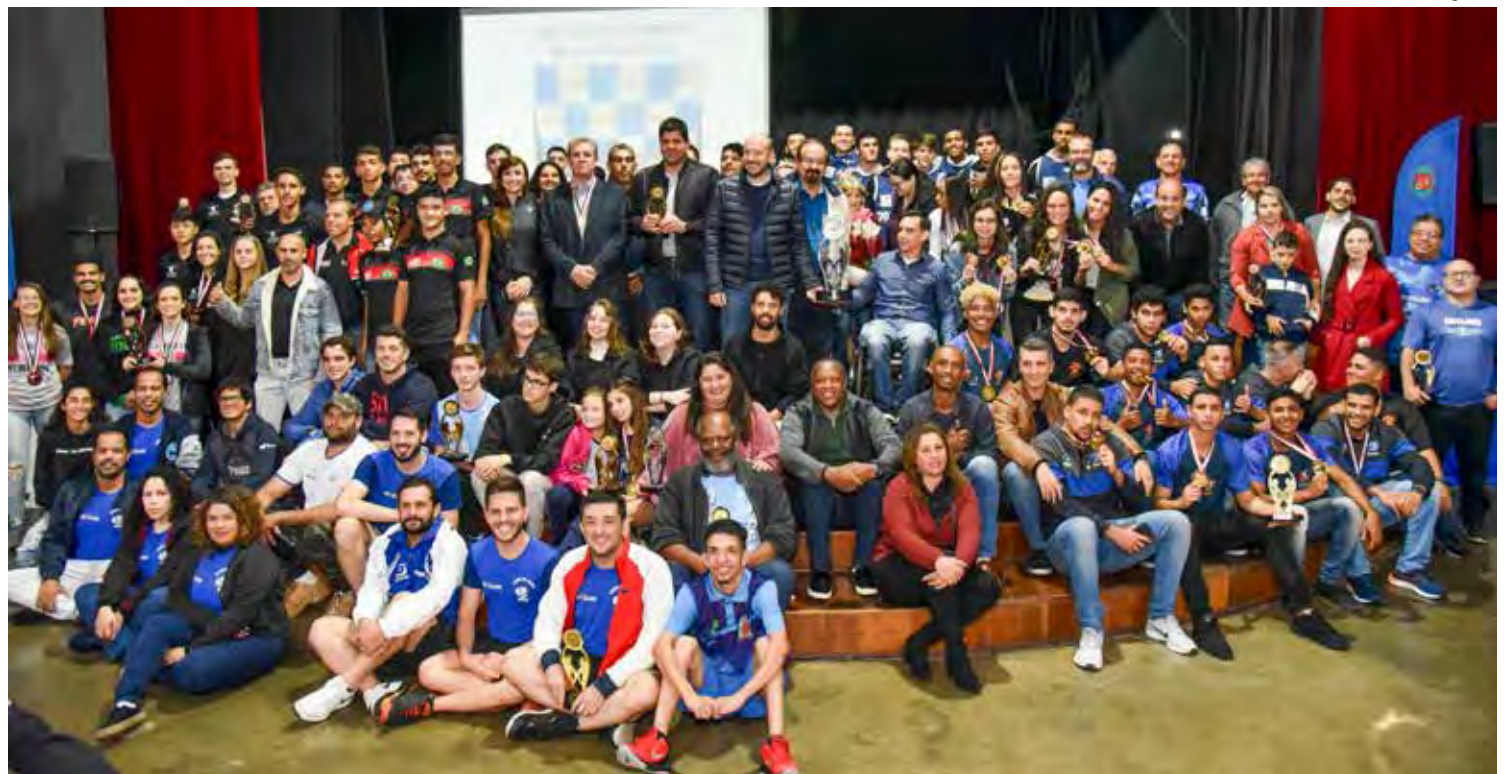
Atletas foram homenageados pela Secretaria de Esportes

Rio Claro terminou a disputa dos Jogos Regionais com 161 pontos e conquistou o vice-campeonato, ficando atrás de Indaiatuba, campeã com 165 pontos.