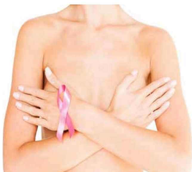
Até o final de 2022 estima-se que ocorrerão 66.280 novos casos de câncer de mama no Brasil

Especialista fala sobre as formas de prevenção e tratamento ao câncer de mama, assim como todo o processo de recuperação, que é bastante abrangente