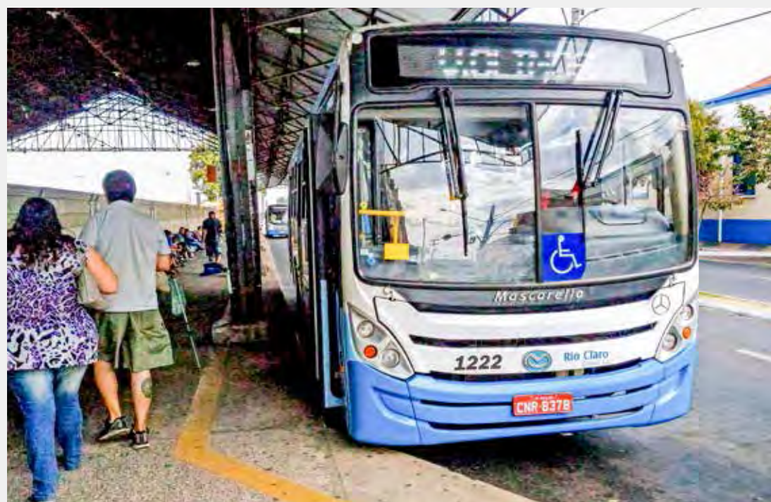
Ônibus vão circular em horário ampliado, das 8 às 18 horas, neste domingo