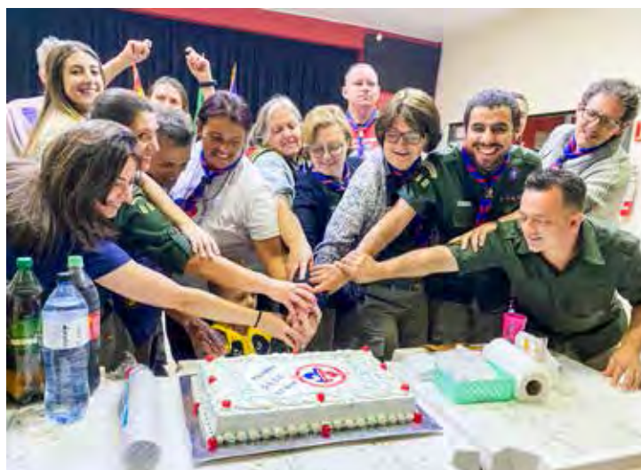
Os membros comemoraram com festa os 57 anos do Grupo Escoteiro Santa Cruz

Assim, em agosto de 1981 houve a transferência da sede para o antigo Posto de Puericultura,