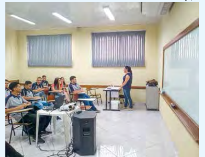
"Guardinhas" participam de cursos e aulas de reforço escolar, entre outras atividades.

7 a 9 de Outubro LOCAL: ESTAÇÃO FERROVIÁRIA