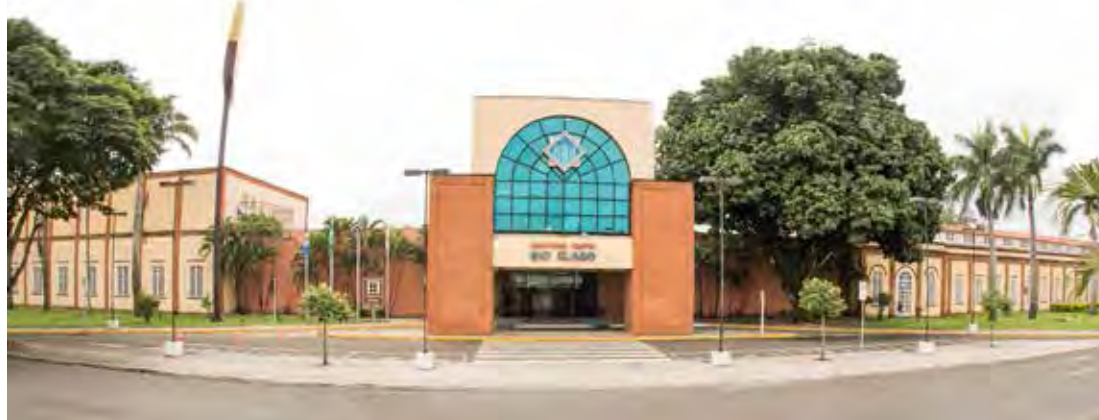
O Shopping Rio Claro fica na Av. Condé Francisco Matarazzo Júnior, 205, na Vila Paulista