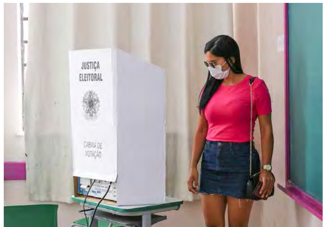
O eleitor pode comparecer à sessão portando o celular, mas terá que deixá-lo desligado com os mesários

O TSE estabeleceu que a votação acontecerá entre as 8h