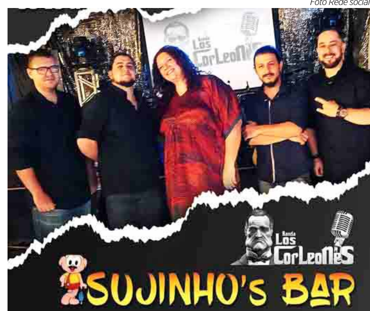
Banda Los Corleões no Sujinhos Bar

AMERICANA JOHN GOW IRISH PUB – Nesta sexta (30), a partir das 20h tem Bailinho Galáctico dos anos 80 com a Banda Playmohits 80, com um repertório dos sucessos nacionais e internacionais dos anos 80, mais informações 19.3407-4996. Endereço: Rua Hermam Muller Carioba nº 275 – Jardim Girassol – Americana.