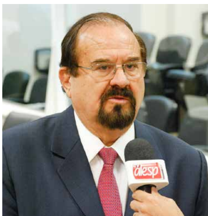
O deputado Aldo Demarchi tenta a reeleição para o oitavo mandato na Alesp

“Por isso é que me esforço tanto para que Rio Claro e muitas cidades do Interior continuem a fazer parte dessa estatística, pois somente assim teremos condições de encaminhar nossas reivindicações aos diversos setores governamentais”, justifica Demarchi.