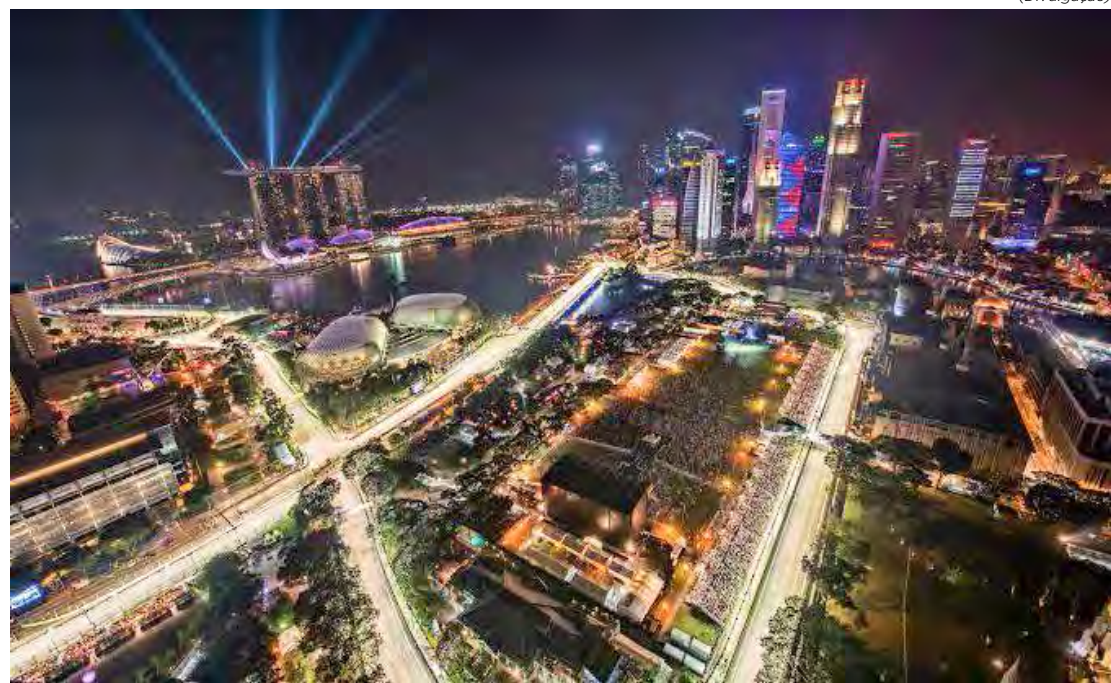
Longe desde 2019 de Singapura, Fórmula 1 volta a Marina Bay