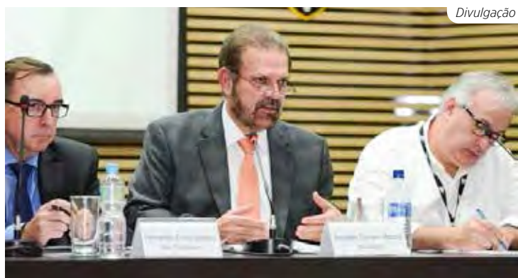
Reinaldo Carneiro Bastos, ao centro, presidente da FPF

Ao invés de se classificarem as duas melhores equipes de cada grupo, como vem ocorrendo nos últimos anos, passariam à segunda fase do Paulistão as equipes com as 8 melhores campanhas. Essa e outras propostas de mudanças serão discutidas no Congresso Técnico do Campeonato Paulista da Série A1 2023, que acontece no dia 1º de novembro deste ano.