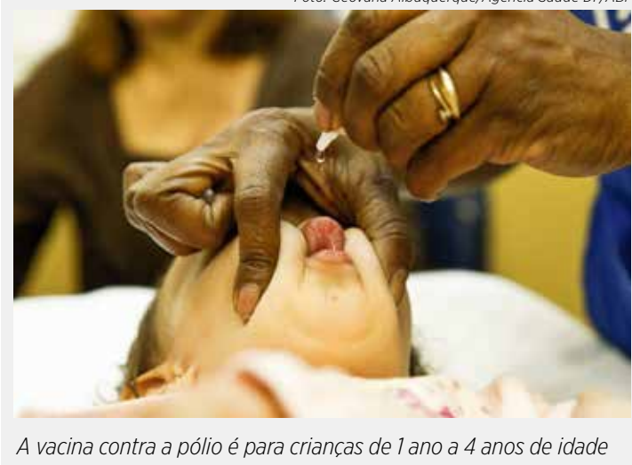
A vacina contra a pólio é para crianças de 1 ano a 4 anos de idade