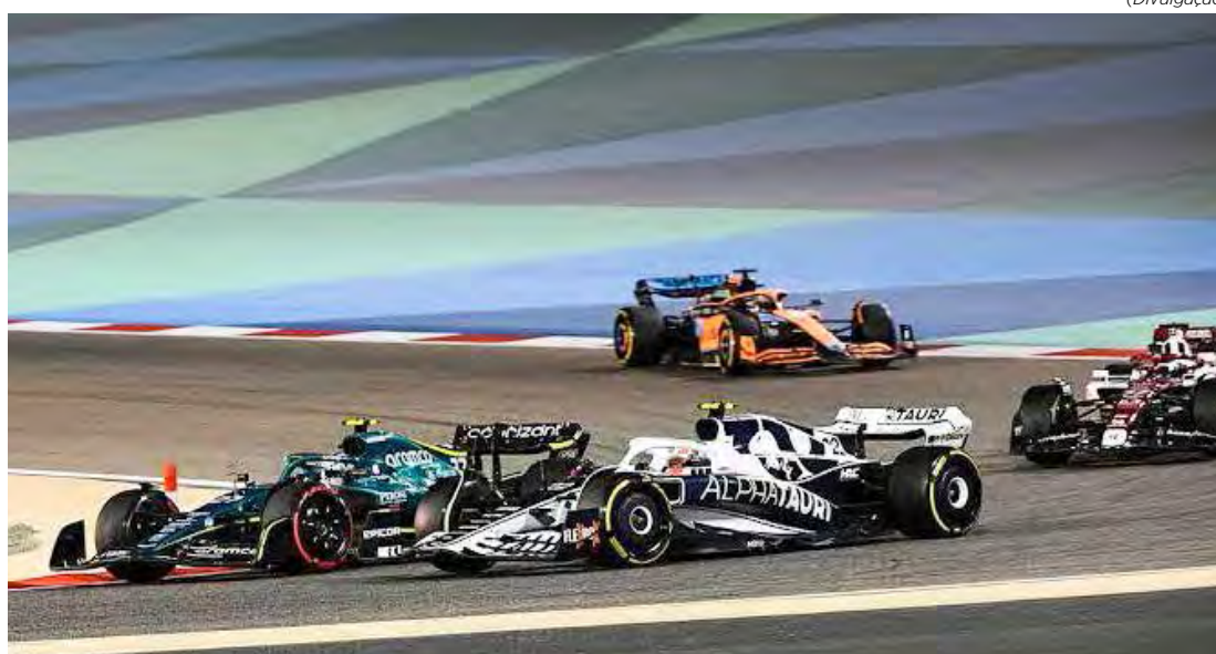
Sessão de testes deverá ter novamente apenas três dias

Enquanto a pré-temporada de 2022 teve uma duração de seis dias, devido à introdução dos novos carros da F1, em 2023 os testes retornarão ao formato de apenas três. Este será o principal momento de contato de pilotos e equipes com os novos carros, já que testes fora são limitados a dois dias de filmagens de 100 quilômetros de extensão.