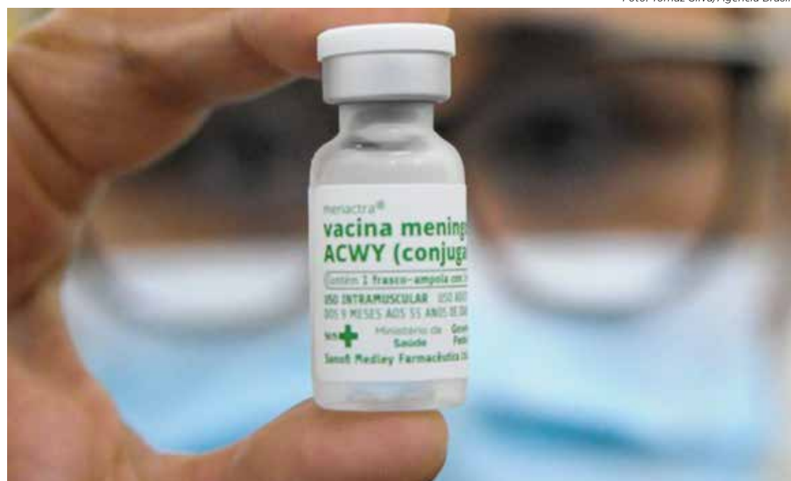
A vacina contra os meningococos A, C, W e Y é para adolescentes de 11 a 14 anos

A doença pode ser grave e até fatal, e os sintomas incluem febre, dor de cabeça, rigidez na nuca acompanhada de vômi-