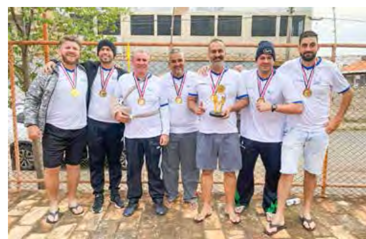
Biribol rioclarense conquistou medalha de ouro