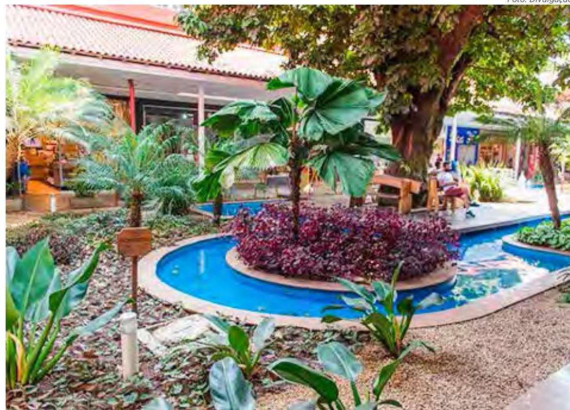
Jardim interno do Shopping Rio Claro