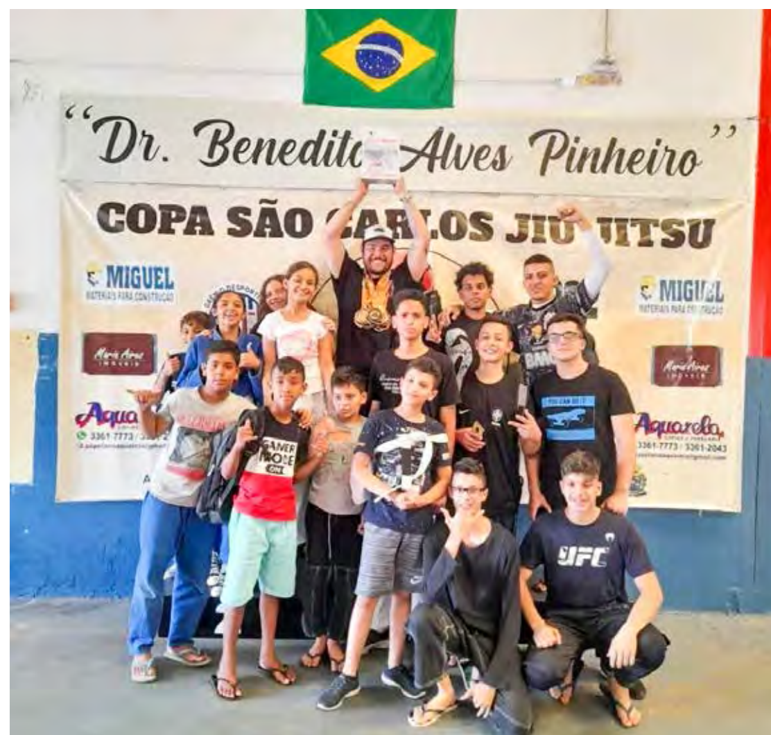
Equipe de Jiu-Jitsu do Projeto Lutando por Jesus, saiu-se bem na Copa São Carlos

Fundando em 2014, o projeto social atende atualmente 35 crianças e tem mais 30 alunos na sede localizada no bairro Cervezeiro.