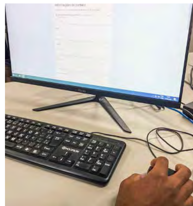
As sugestões ou pedidos de informação devem ser feitos pela internet