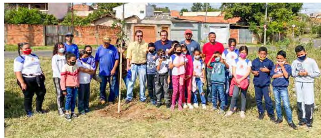
Participaram do plantio alunos do quarto ano da manhã e da tarde

As espécies plantadas foram: abacateiro, aroeira pimenteira, pata de vaca, amoreira, jacarandá mimoso, nêspereira e pitangueira.