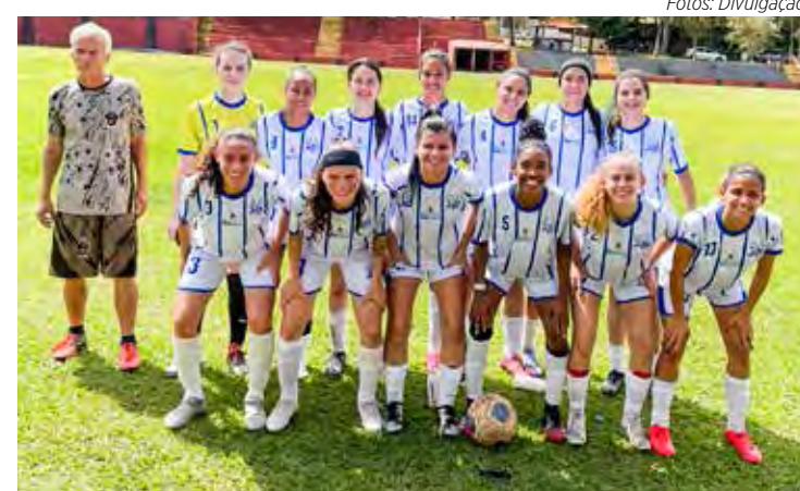
Futebol feminino de Rio Claro foi campeão dos Jogos Regionais