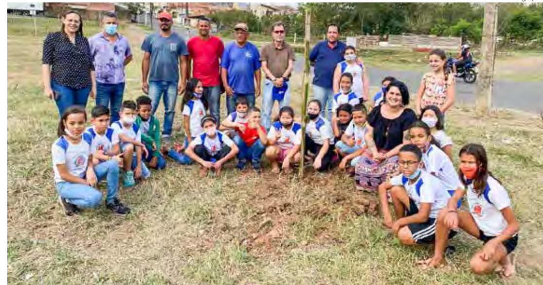
Alunos da Escola Sérgio Hernani Fittipaldi realizaram na terça-feira (20) o plantio de árvores em área verde