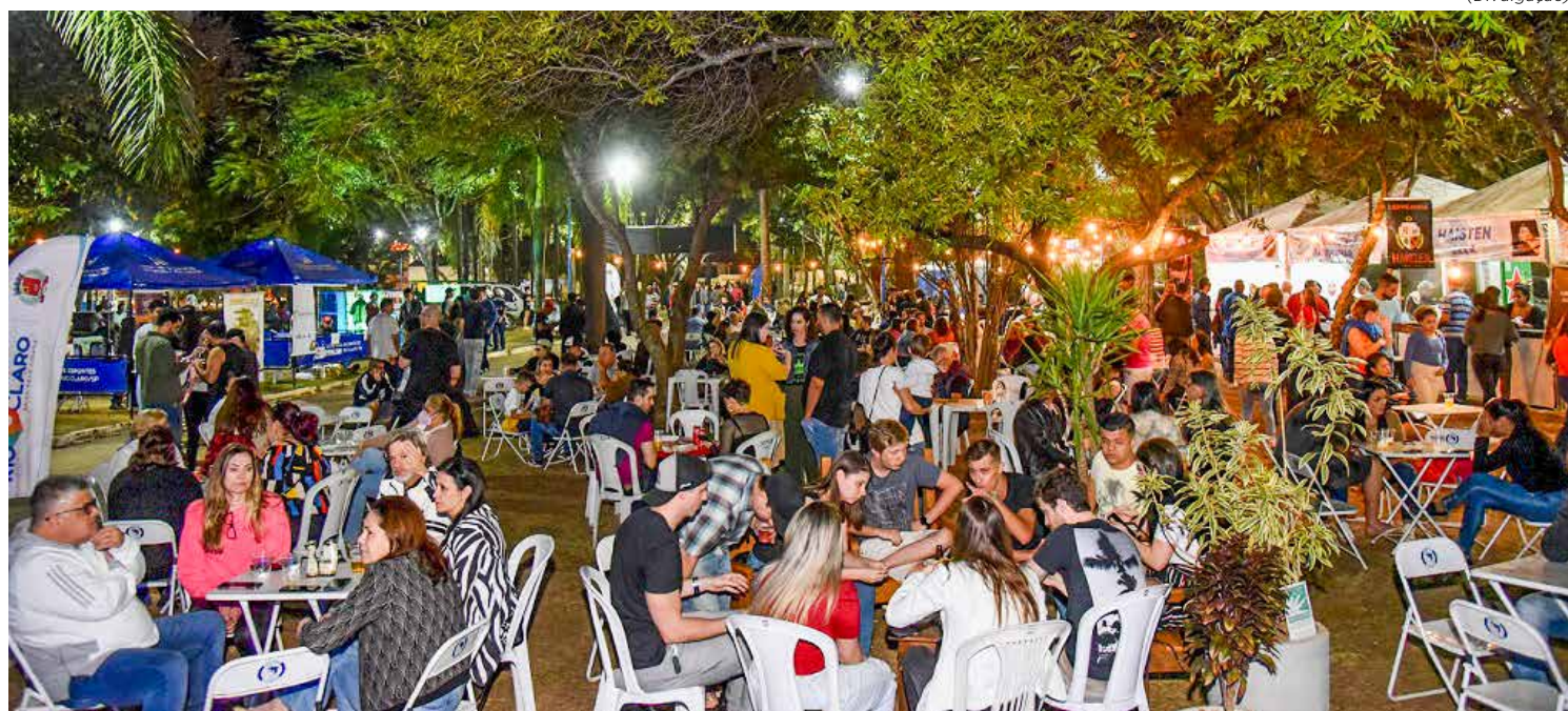
Uma dos eventos realizados recentemente em Rio Claro foi o Festival Gastronômico