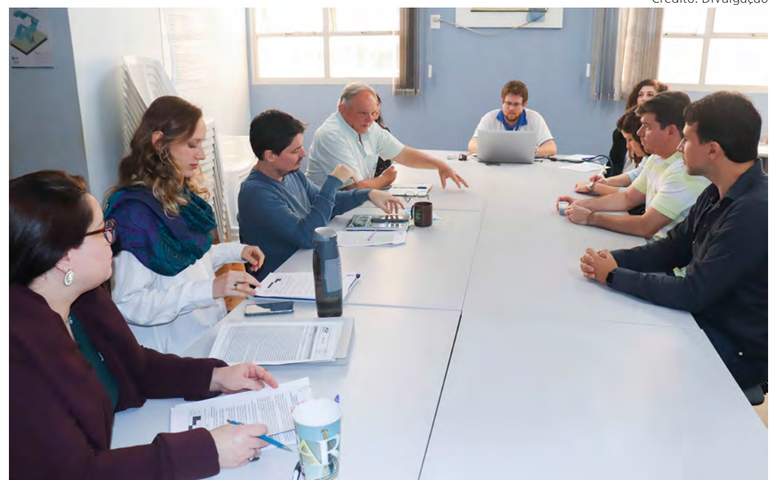
A primeira reunião técnica sobre a emissão da O.S. foi realizada na terça-feira, 6 de setembro.

A elaboração do projeto básico está em andamento e deve ser concluída até o final deste