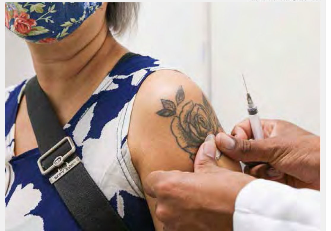
Rio Claro aplicou 532.770 doses nesta campanha de vacinação contra a Covid-19