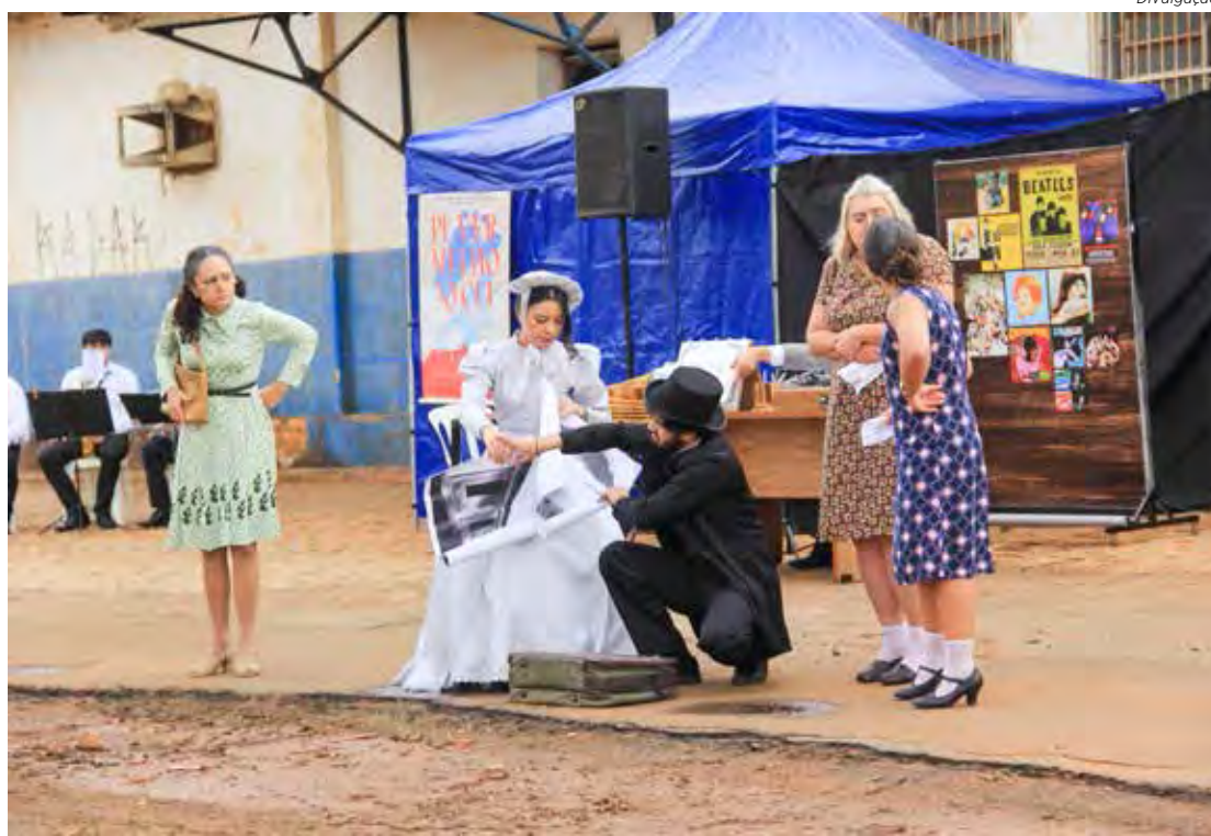
O espetáculo conta com um enredo extremamente importante e relevante: A história de Santa Gertrudes

"A certeza após o término da primeira sessão da peça "Pé Vermelho ao Céu", foi que Santa Gertrudes exala cultura e tem profissionais extraordinários, que carregam nas veias a arte e a habilidade de encantar o público. E tudo isso com um enredo extremamente importante e relevante: