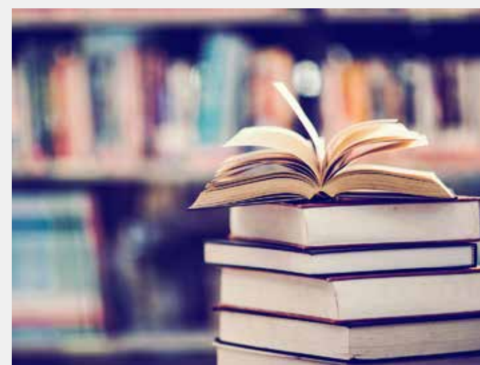
O evento conta com exposição de livros do acervo das bibliotecas e doação de livros

A Festa das Bibliotecas não terá cobrança de ingresso e será realizada a partir das 9 horas no Jardim Público, próximo ao coreto, na Rua 3 com Avenida 1.