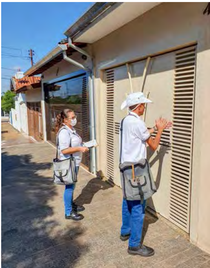
O Centro de Controle de Zoonoses faz trabalho permanente que inclui visitas casa a casa.