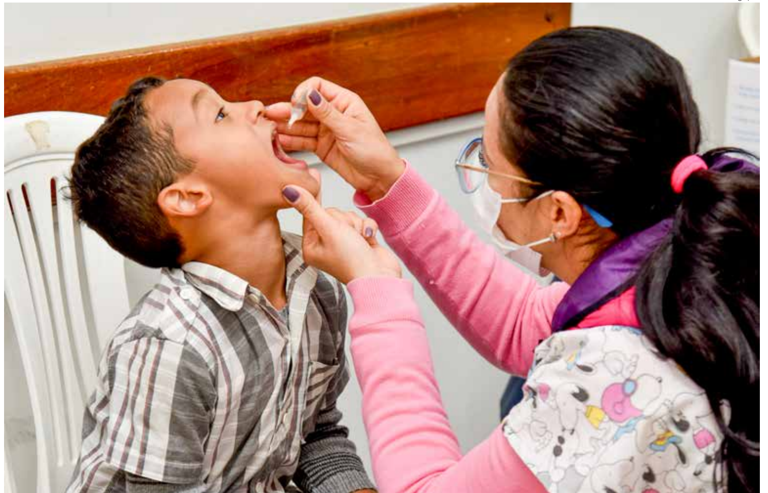
A vacina contra a pólio é para crianças de 1 ano a 4 anos e a campanha de multivacinação para menores de 15 anos

O objetivo da campanha de multivacinação é ampliar as coberturas vacinais e, para isso, são aplicadas as vacinas que compõem o plano nacional de imunização, que protegem contra cerca de 20 doenças. A vacinação contra a gripe também continua e atende toda a população a partir de 6 meses de idade.