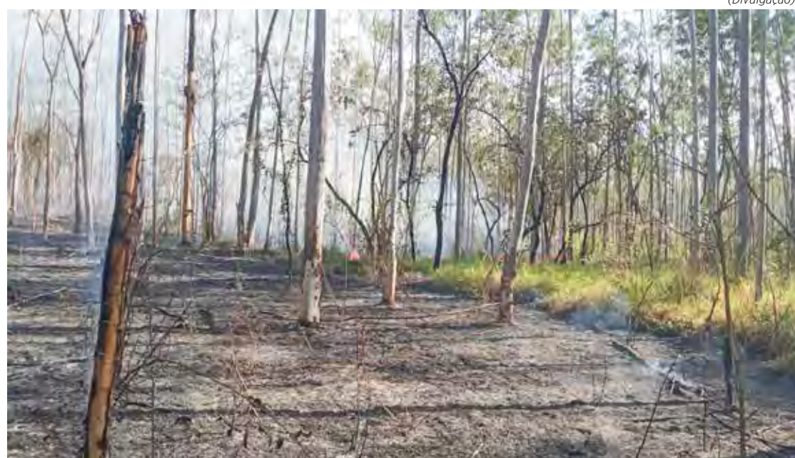
A Defesa Civil de Rio Claro registrou na madrugada do sábado (3) queimada em área da FEENA, região do Orestes Giovanni, bairro São Miguel

Somente na manhã da terça-feira (6), em Piracicaba, dois focos de queimadas foram registrados. O primeiro foi no Parque Natural Municipal, no distrito de Santa Terezinha. De acordo com a Defesa Civil, o fogo começou por volta das 10h e foi controlado pelo Corpo de Bombeiros dentro de uma hora. Vale lembrar que o Parque Natural é uma Unidade de Conservação de Proteção Integral, estrategicamente situada na confluência dos rios Piracicaba e Corumbataí. A outra ocorrência