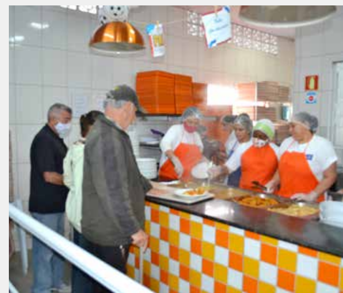
O Bom Prato de Rio Claro fica na Rua 1, número 1.534, Centro e também tem almoço especial nesta sexta-feira (9)

Adultos pagam R$1,00 e crianças com até 6 anos têm a refeição gratuita, assim como a população em situação de rua, que precisa apresentar o cartão com QR Code. As prefeituras são responsáveis pelo cadastramento e a entrega do cartão.