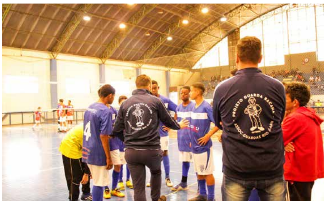
A Copa Palmeiras de Futsal/ Society ocorreu no feriado (7) em Rio Claro