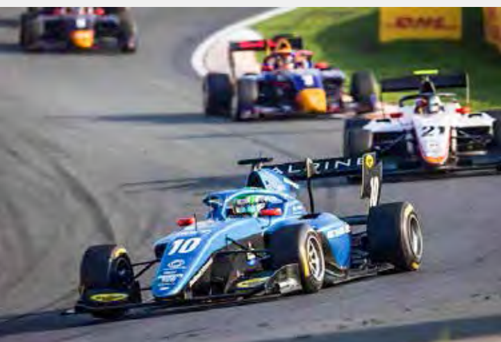
Fim de campeonato na Fórmula 3 tem briga boa pelo título