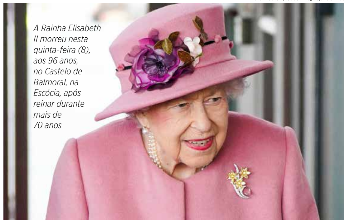
A Rainha Elisabeth II morreu nesta quinta-feira (8), aos 96 anos, no Castelo de Balmoral, na Escócia, após reinar durante mais de 70 anos

Em nota oficial, o presidente do Senado e do Congresso Nacional, Rodrigo Pacheco, informou ter recebido “com tristeza” a notícia do falecimento. “Elizabeth II vivenciou alguns dos momentos