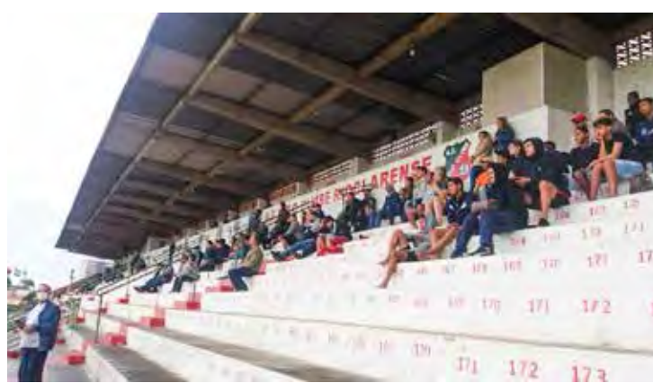
Público prestigiou os dérbinhos, no Benitão

As equipes locais voltam à campo no próximo final de semana. O Velo Clube sai para enfrentar o União São João, em Araras, nas categorias Sub-11 e Sub-13. Já o Rio Claro FC recebe o Independente FC, no estádio Schmidtão. Os jogos acontecem no próximo domingo (11). A categoria Sub-11 joga às 9h00 e a Sub-13, às 10h30.