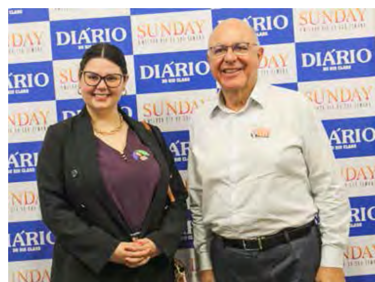
A vereadora Carol Gomes e o deputado Arnaldo Jardim visitaram a redação do Diário do Rio Claro nesta quinta-feira (8)

O deputado foi relator de matéria aprovada pelo Congresso Nacional e sancionada pelo presidente que instituiu o Pagamento por Serviços Ambientais (PSA). O Ministério do Meio Ambiente está regulamentando o PSA que vai estimular e premiar as boas práticas ambientais. “Se o produtor fizer 22% de reserva legal ao invés de 20%, aumentar a vazão de água ou diminuir o assoreamento, pode se beneficiar do PSA. O Brasil pode ser grande produtor em harmonia com a natureza, cuidando da água e do solo”, conclui.