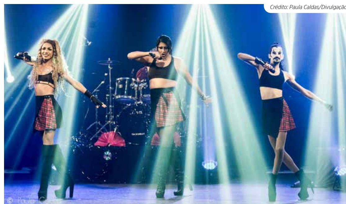
Grupo Manxs lança música “A Cor” em todas as plataformas de streaming digitais nesta sexta (9)

Sendo um grupo engajado e preocupado com sua responsabilidade sociocultural, as Manxs vem construindo um álbum autoral intitulado “Autofalante” com o intuito de proporcionar o local de escuta sobre temas diversos que ele se propõe a percorrer referente a pluralidade humana das pessoas LGBTQIAP+ do Brasil. No caso da música “A Cor” será discursado a necessidade de olharmos para nosso passado e presente, para que possamos então pensarmos em como construir uma realidade onde a história da comunidade negra e LGBTQIAP+ não seja