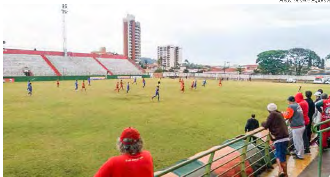
Velo Clube x RCFC se enfrentaram pelo Paulista Sub-11 e Sub13